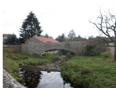
Vue générale IVR82_20134203374NUCA