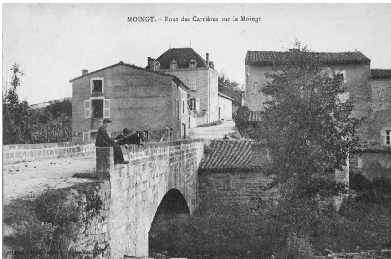
MOINGT. - Pont des Carrières sur le Moingt. Carte postale, 1er quart 20e siècle.