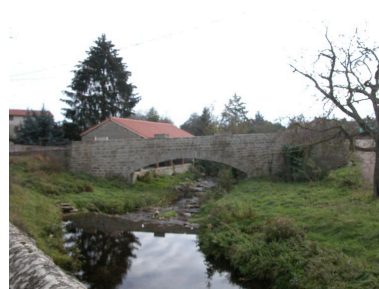
Vue générale IVR82_20134203374NUCA