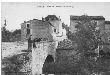
MOINGT. - Pont des Carrières sur le Moingt. Carte postale, 1er quart 20e siècle. IVR82_20054201428NUCB