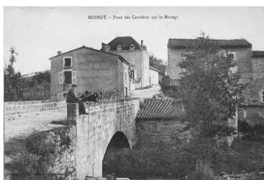
MOINGT. - Pont des Carrières sur le Moingt. Carte postale, 1er quart 20e siècle. IVR82_20054201428NUCB