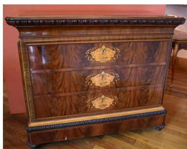
Vue générale IVR84_20216301077NUCA