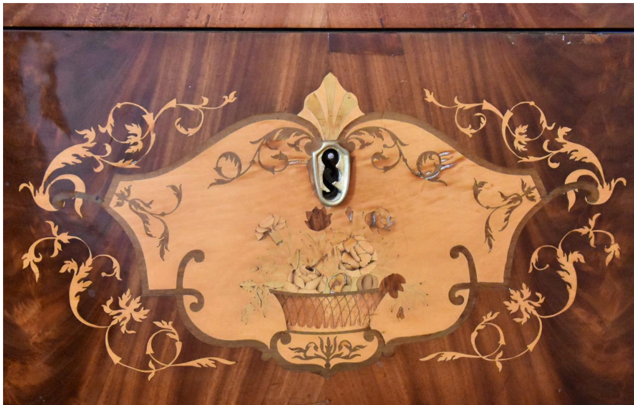
Détail décor tiroirs