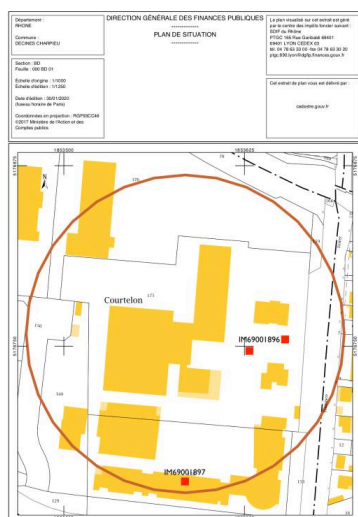
Plan d'implantation des œuvres. IVR84_20206900863NUDA