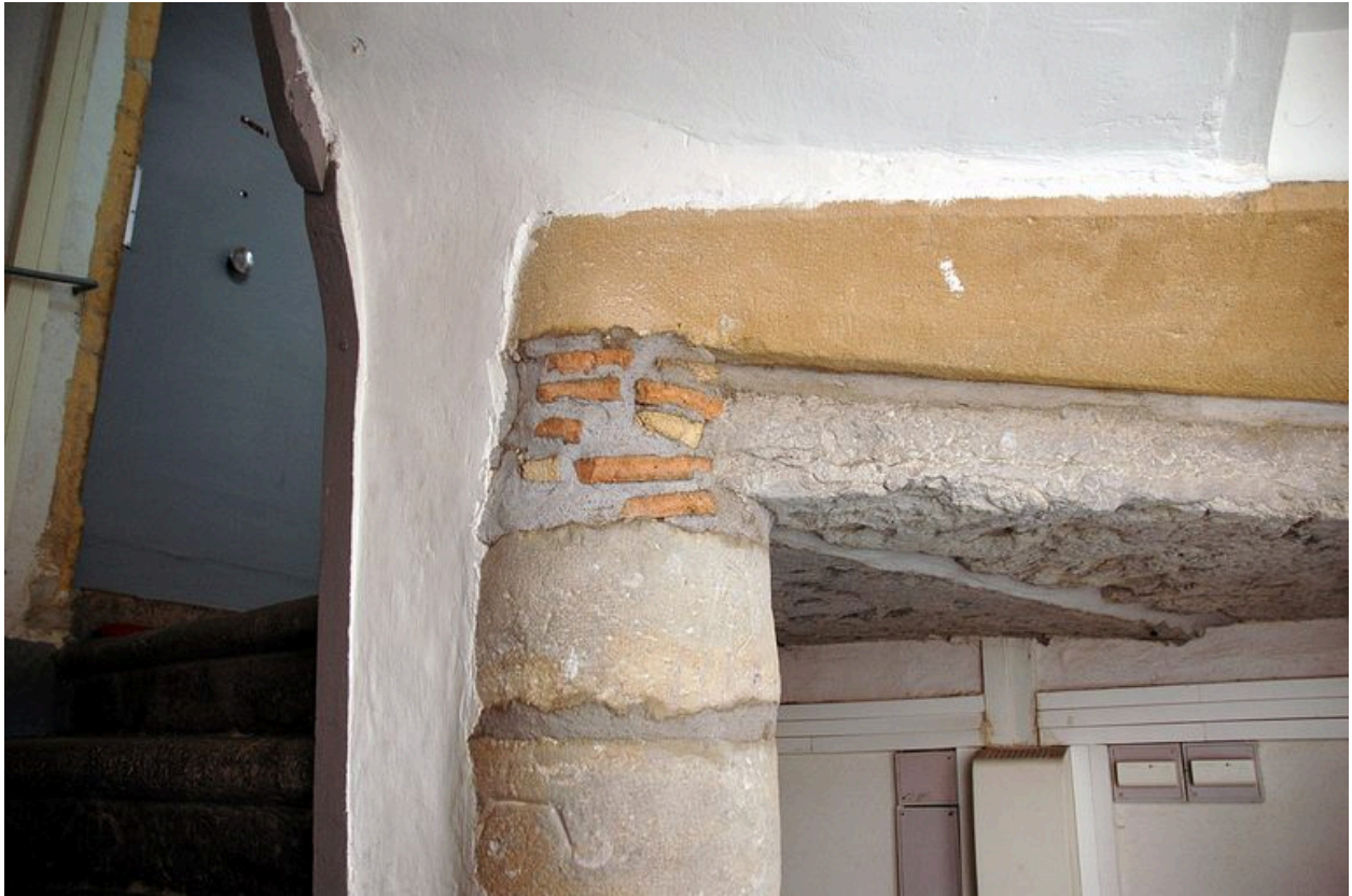
Escalier en vis : détail de matériaux