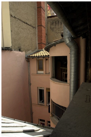
La cage d'escalier et le corps de bâtiment est depuis la galerie desservant le corps de bâtiment ouest, dernier étage IVR82_20086901273NUCA