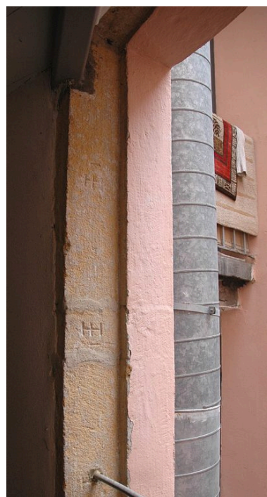
Cage d'escalier : détail de marques de tâcherons