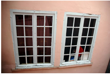
Corps de bâtiment ouest : détail de fenêtres à petits carreaux IVR82_20086902012NUCA