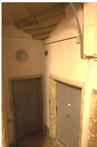
Cage d'escalier : trompe et portes palières IVR82_20086901274NUCA