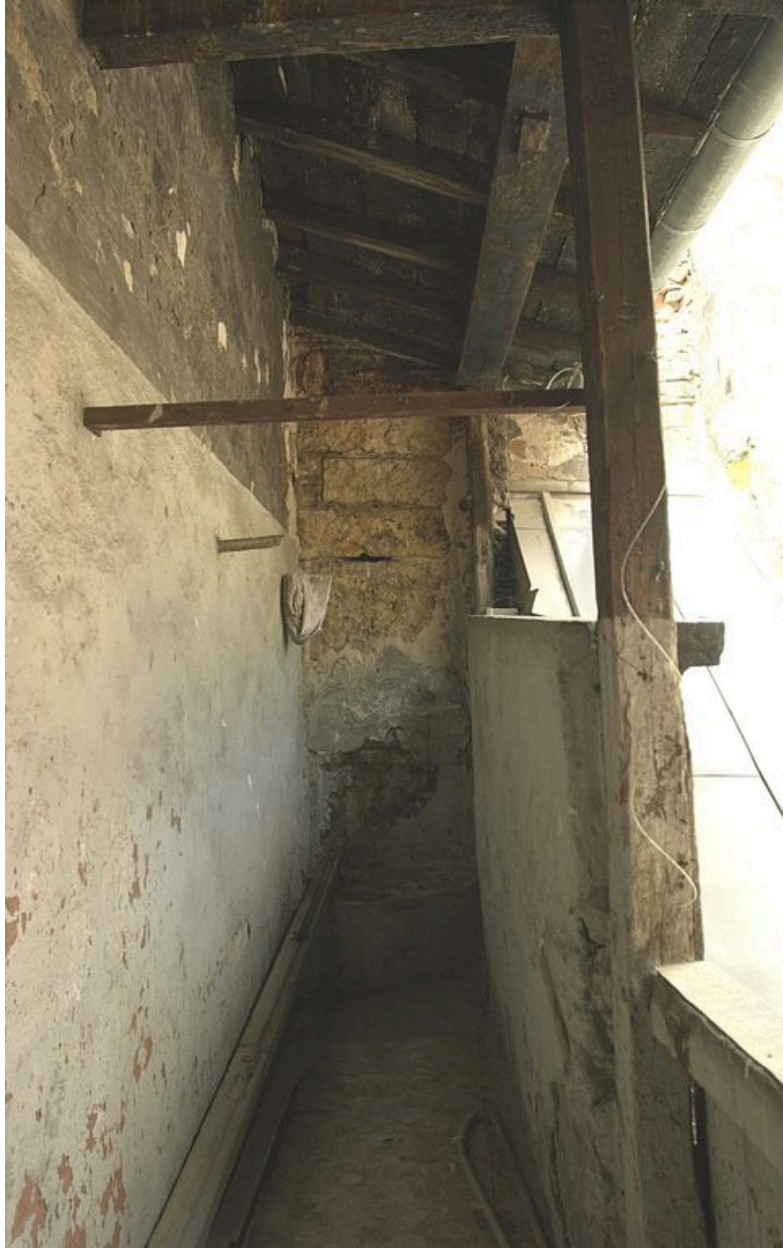
Galerie desservant le corps de bâtiment ouest et pourvue de WC au fond