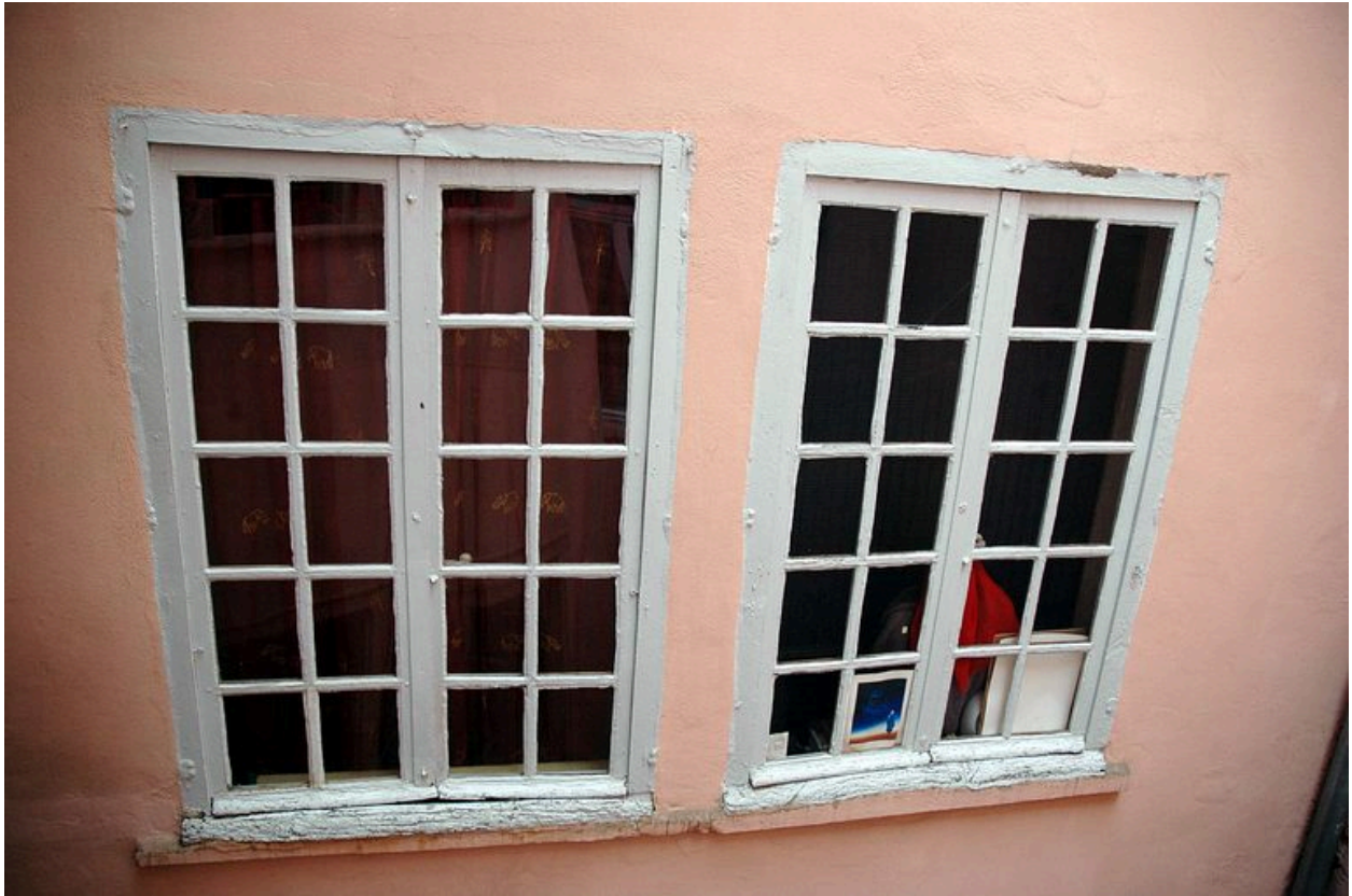
Corps de bâtiment ouest : détail de fenêtres à petits carreaux