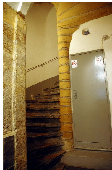
Départ d'escalier IVR82_20086902009NUCA