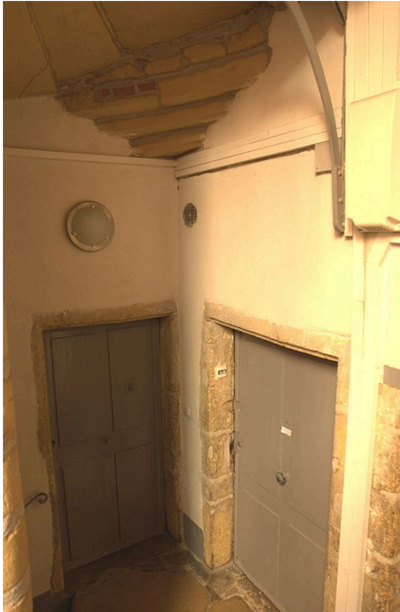
Cage d'escalier : trompe et portes palières