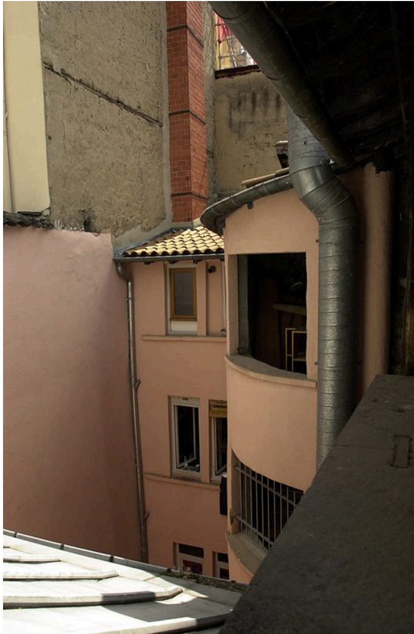
La cage d'escalier et le corps de bâtiment est depuis la galerie desservant le corps de bâtiment ouest, dernier étage