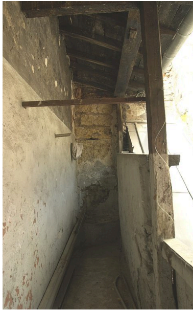
Galerie desservant le corps de bâtiment ouest et pourvue de WC au fond