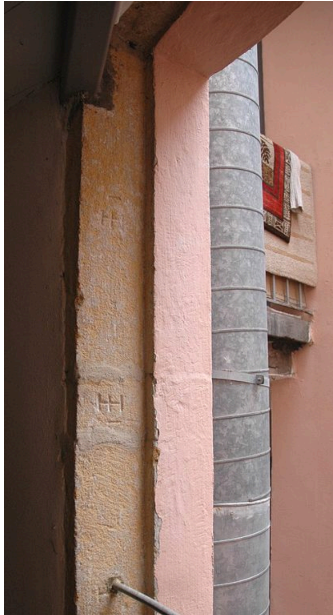
Cage d'escalier : détail de marques de tâcherons