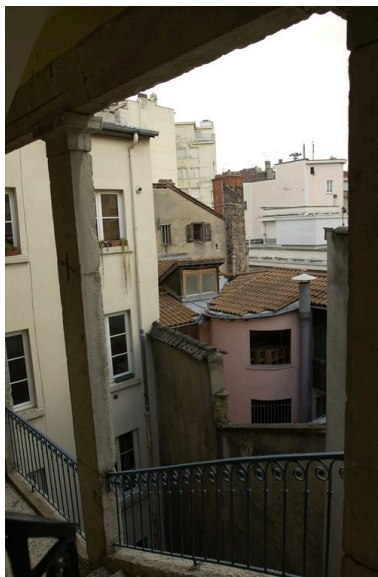
Corps de bâtiment sur cour vus depuis la cage d'escalier de l'immeuble sis 6 rue de l'Ancienne-Préfecture