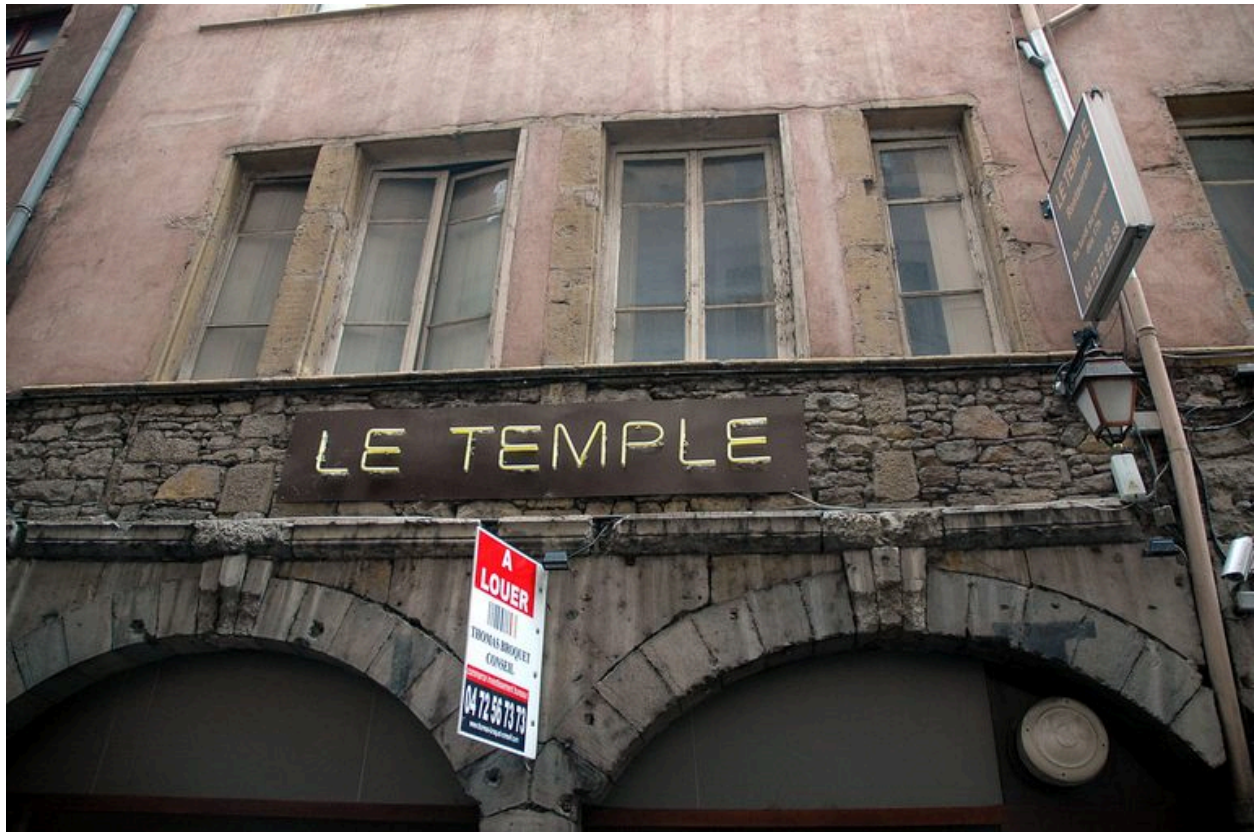
Détail des baies du premier étage