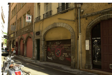
Au second plan, le rez-de-chaussée IVR82_20086901277NUCA