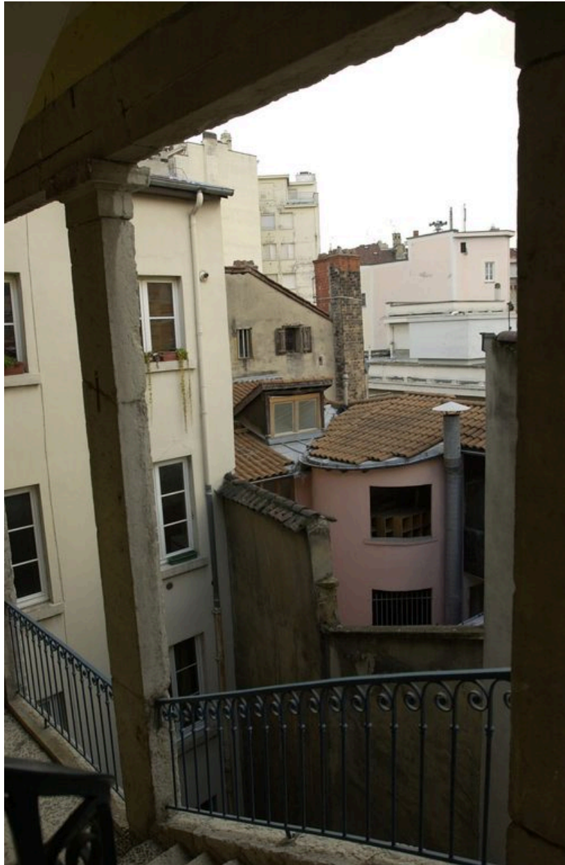
Corps de bâtiment sur cour vus depuis la cage d'escalier de l'immeuble sis 6 rue de l'Ancienne-Préfecture