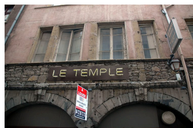
Détail des baies du premier étage IVR82_20086902008NUCA