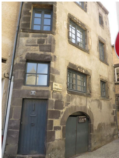
Vue partielle de la façade principale IVR84_20206300106NUCA