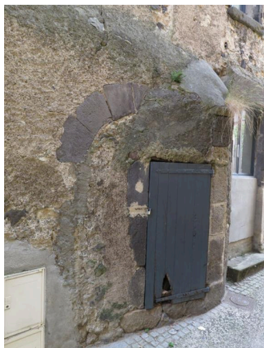
Façade latérale : ancien accès remanié IVR84_20206300111NUCA