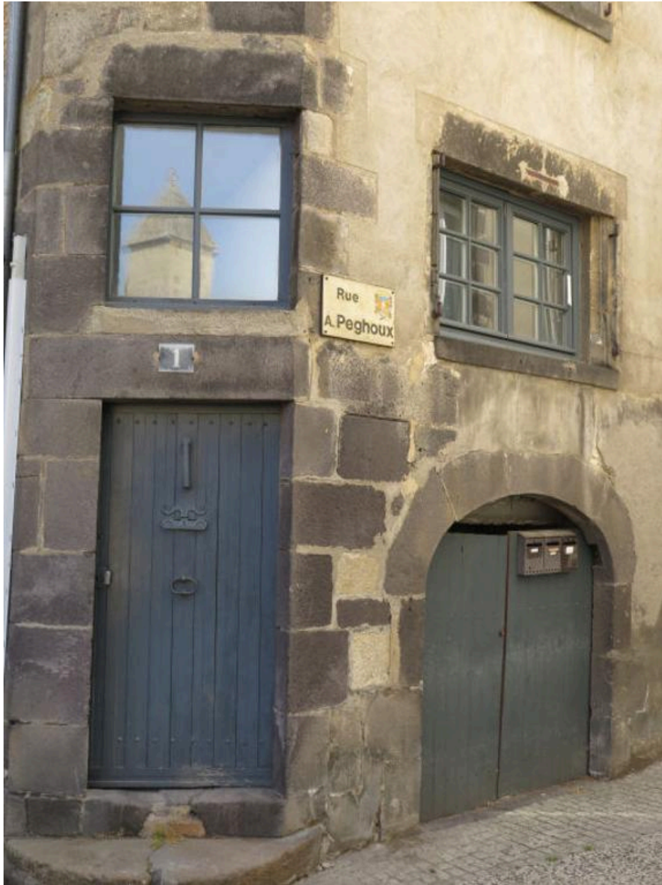
Entrées de l'habitation et de la cave