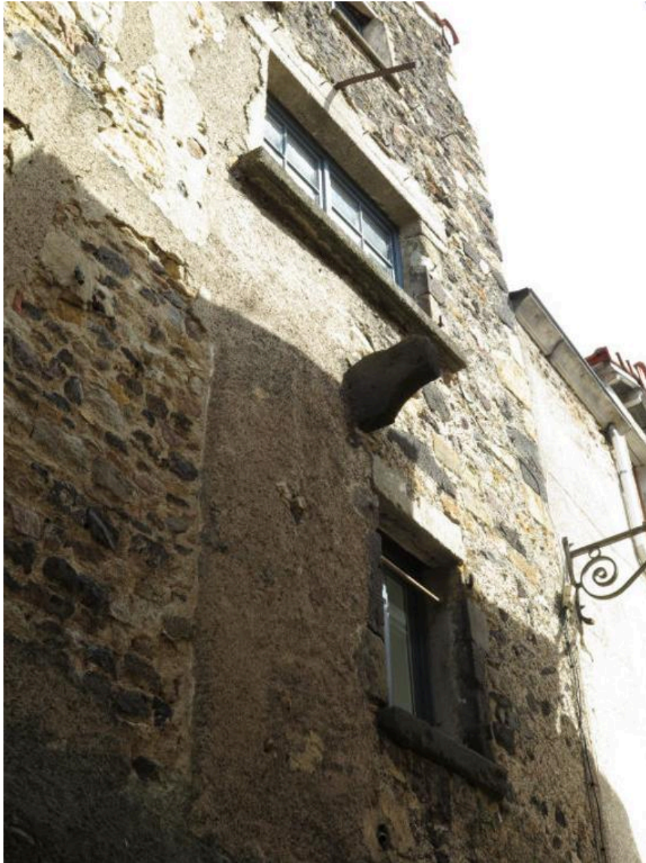
Elément ancien sur la façade latérale