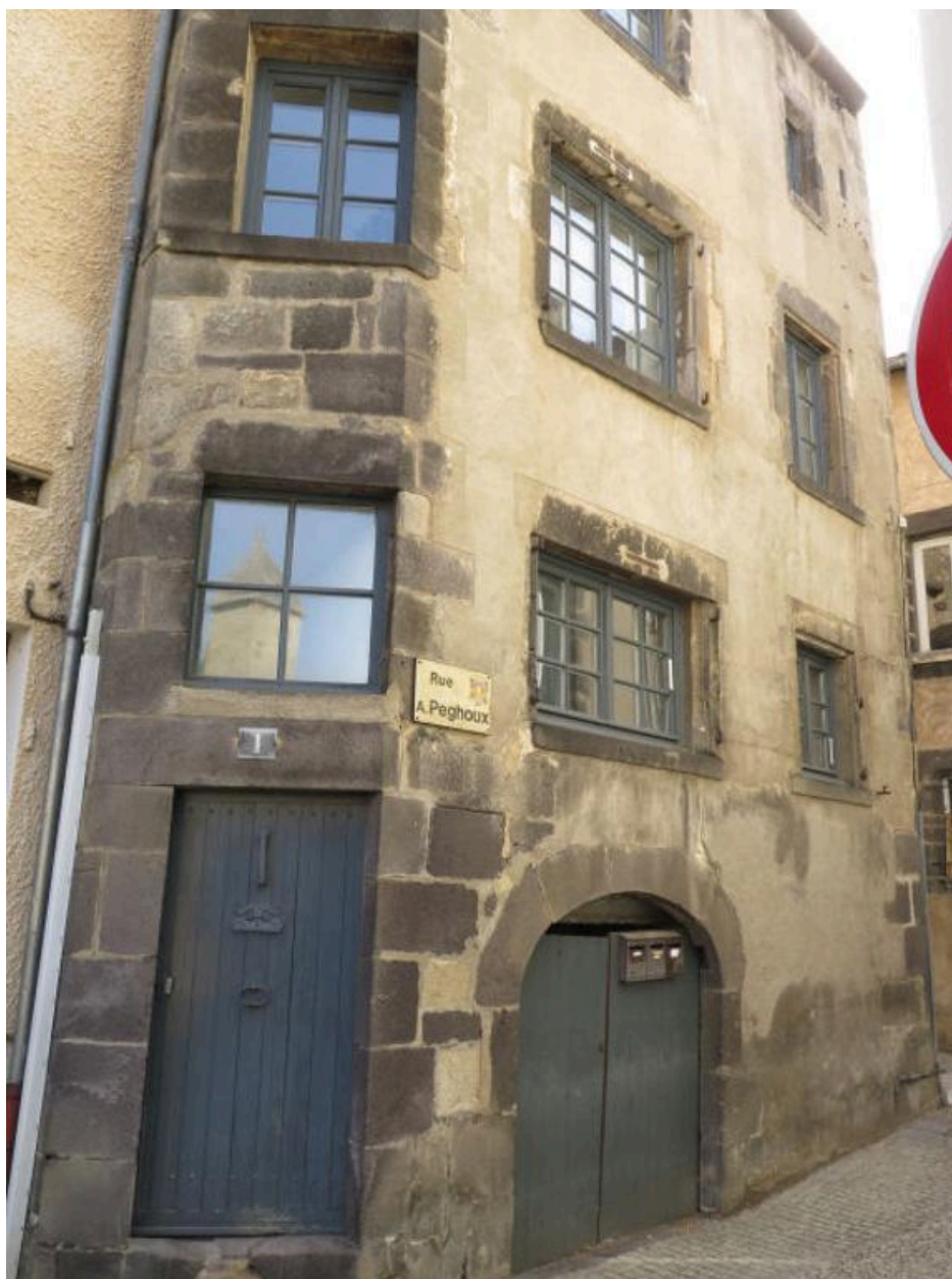
Vue partielle de la façade principale