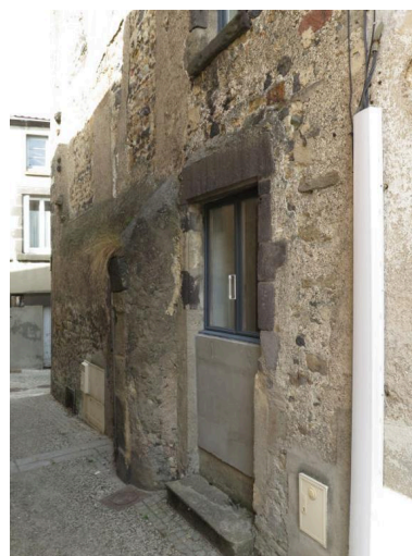
Vue partielle de la façade latérale IVR84_20206300110NUCA