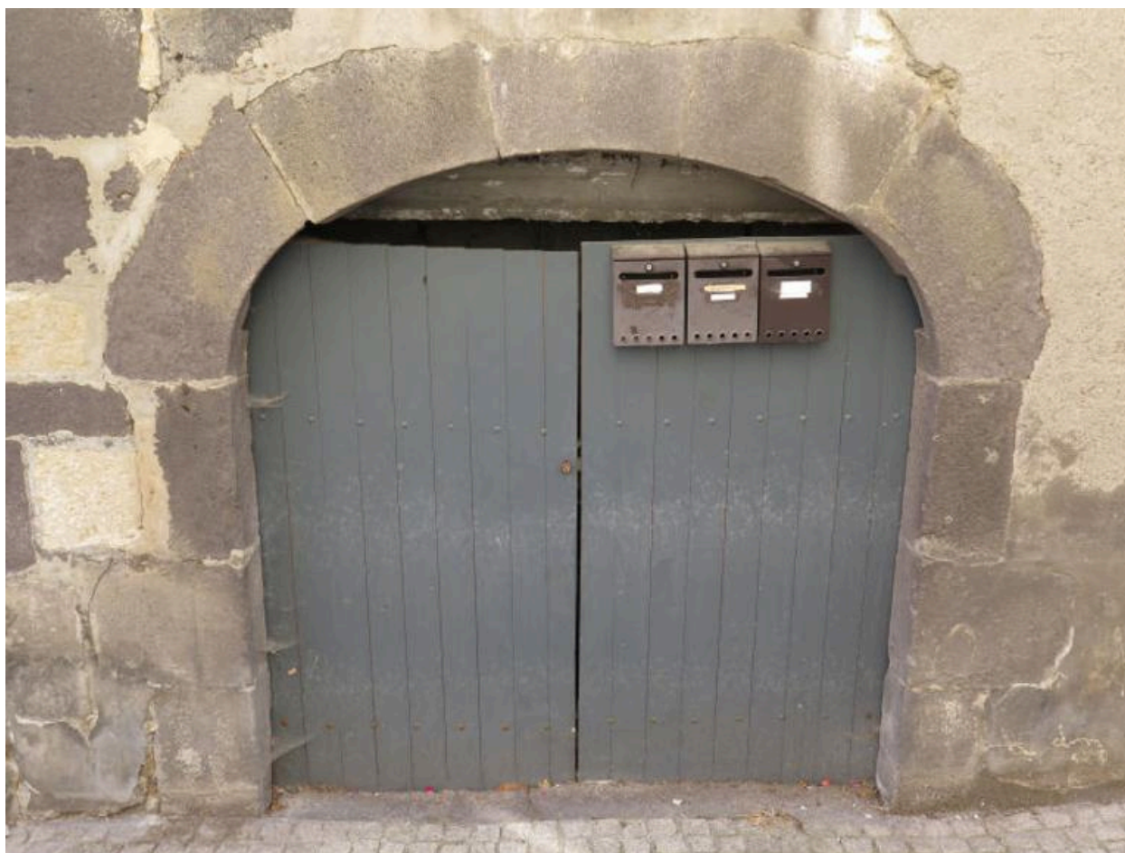
Entrée de la cave