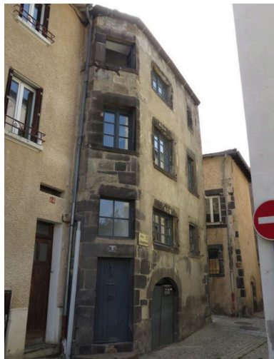
Vue générale IVR84_20206300105NUCA