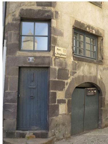
Entrées de l'habitation et de la cave IVR84_20206300107NUCA