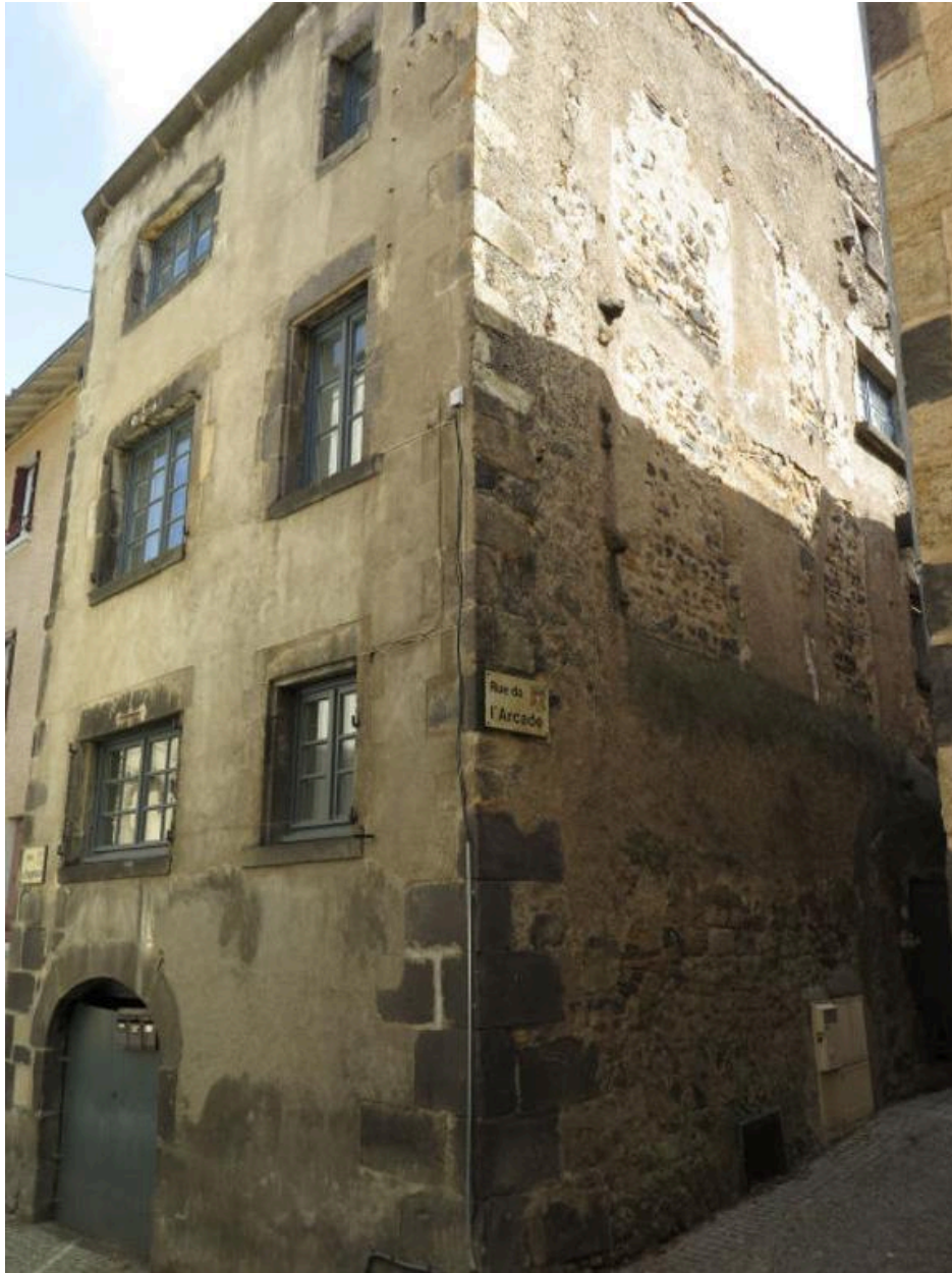
Façade principale et façade latérale