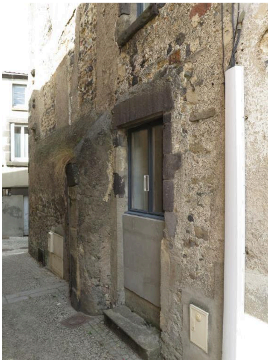
Vue partielle de la façade latérale