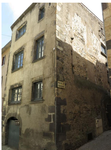
Façade principale et façade latérale IVR84_20206300109NUCA