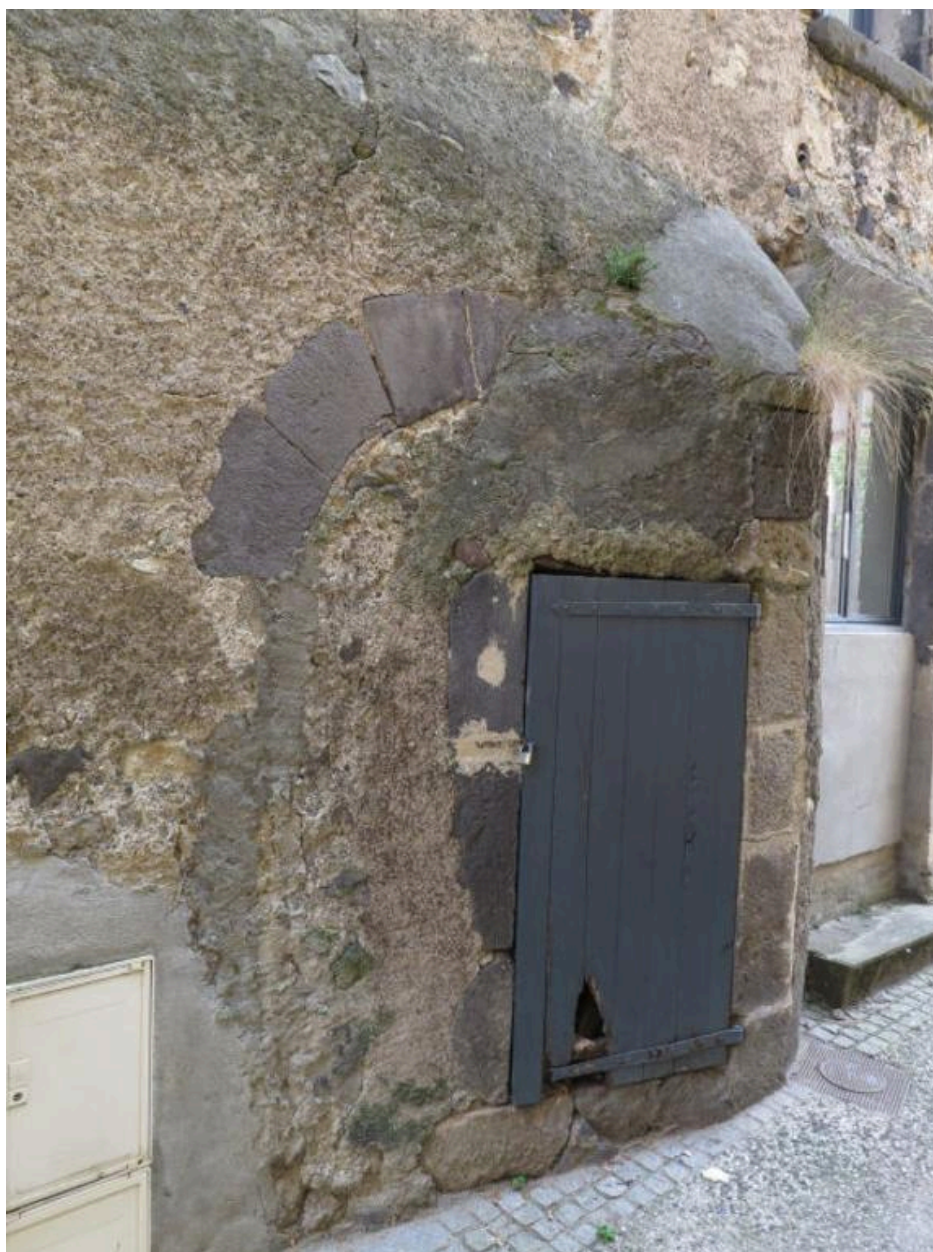
Façade latérale : ancien accès remanié