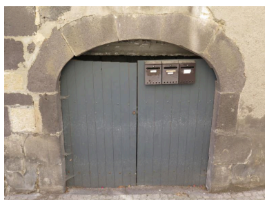
Entrée de la cave