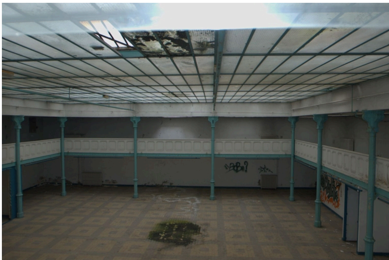
Vue de la grande halle