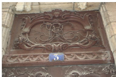
Chiffre de la porte d'entrée principale de l'immeuble XVIIIe siècle IVR82_20086900317NUCA