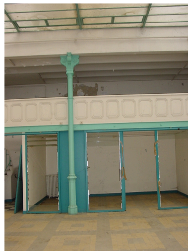
Détail vue intérieure IVR82_20086900323NUCA