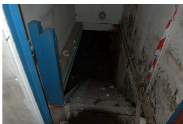
Escaliers menant au sous-sol IVR82_20086900291NUCA