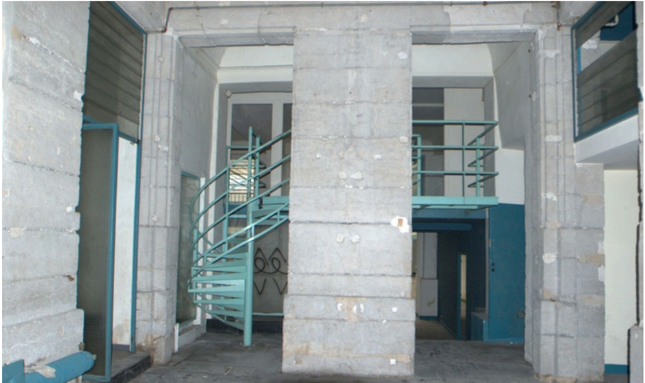
Espace connexe à la halle : avec escalier métallique