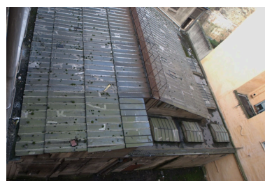
Détail de la toiture de l'atelier IVR82_20086900212NUCA