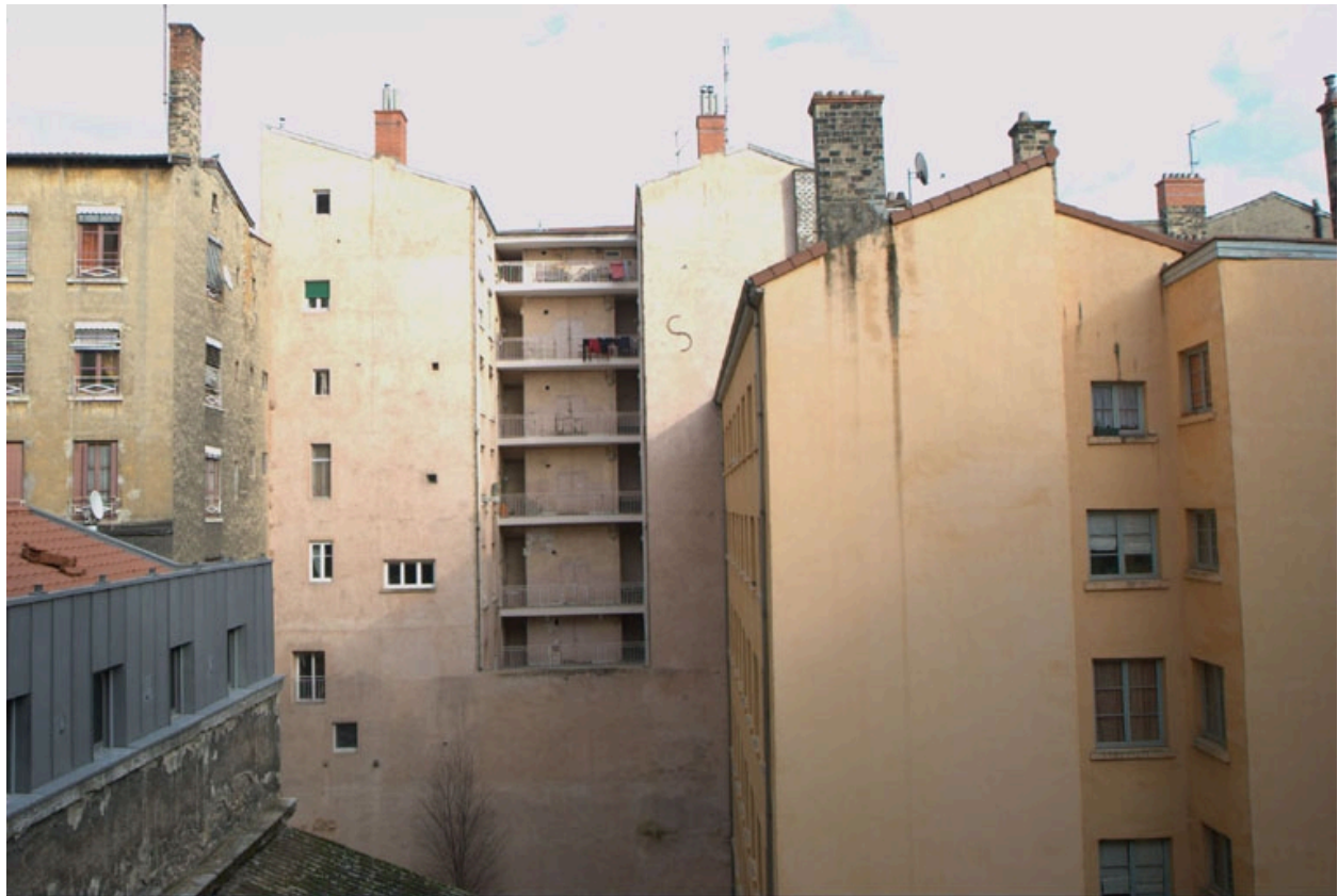
Vue de l'environnement directe de cet atelier, en coeur d'îlot