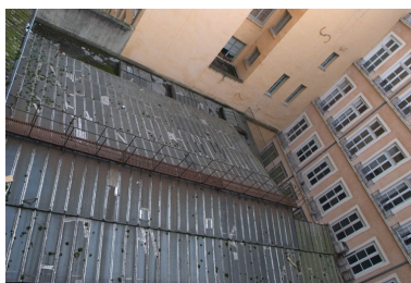
Vue de la verrière IVR82_20086900205NUCA