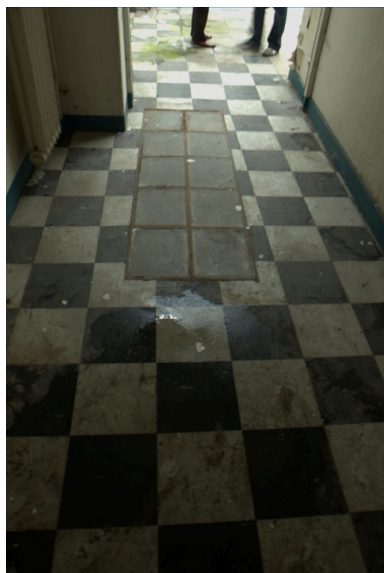
Plaques de verre permettant l'éclairage du sous-sol IVR82_20086900293NUCA