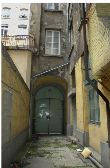
Entrée principale d'accès à la halle (vue est)