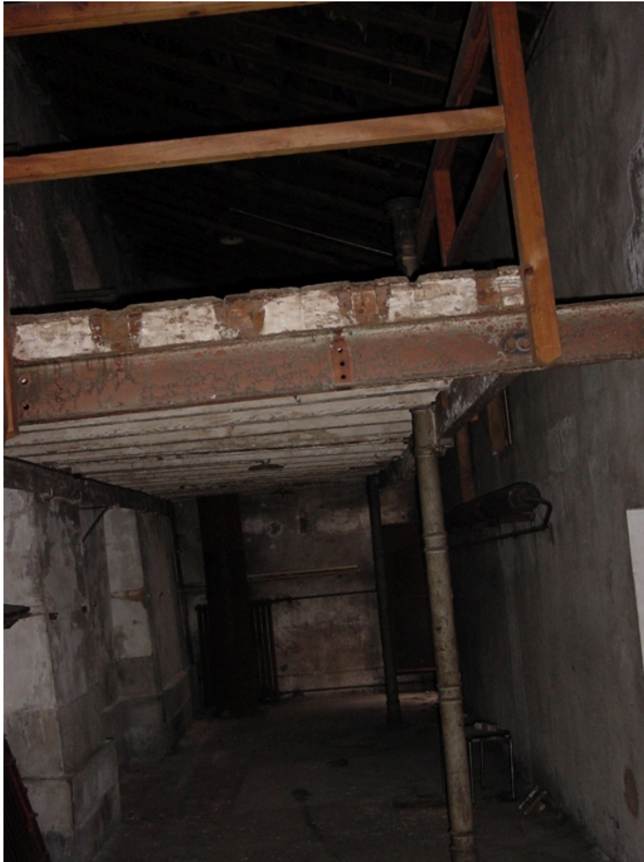
vue du sous-sol