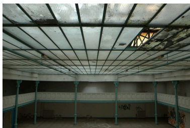
Vue nord de la halle