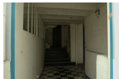
Espaces connexes à la halle (anciens bureaux) IVR82_20086900286NUCA