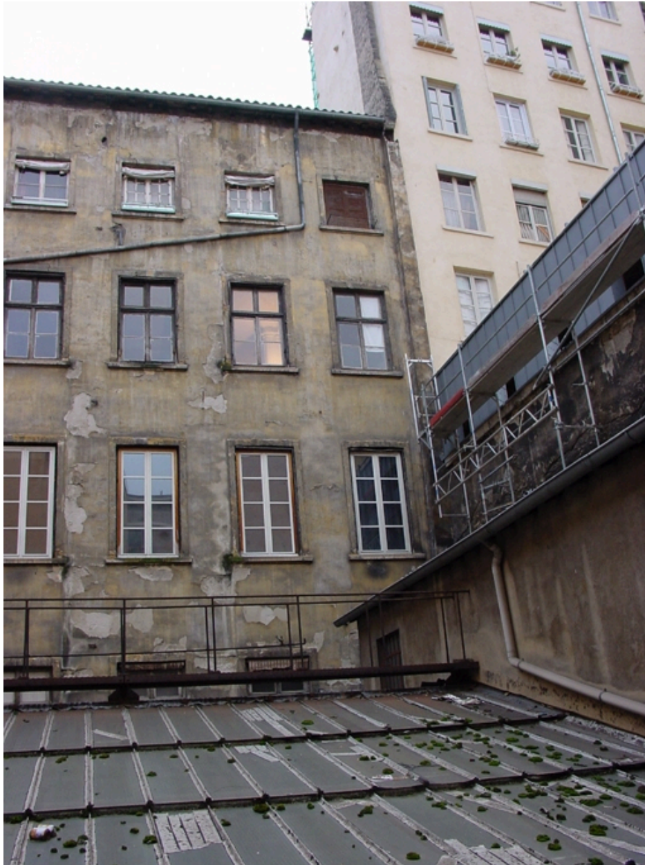
Environnement de la verrière