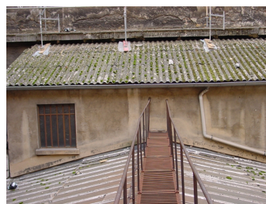
Passerelle de la verrière IVR82_20086900332NUCA