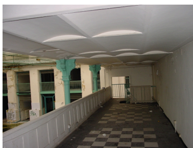
circulation haute IVR82_20086900325NUCA