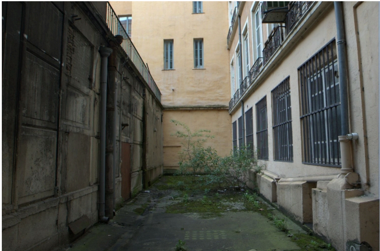
Vue ouest façade principale de la halle (dans l'impasse)