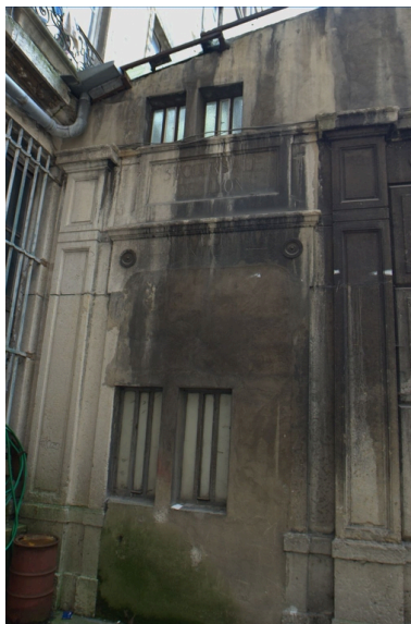
Entrée de la halle localisée dans l'impasse