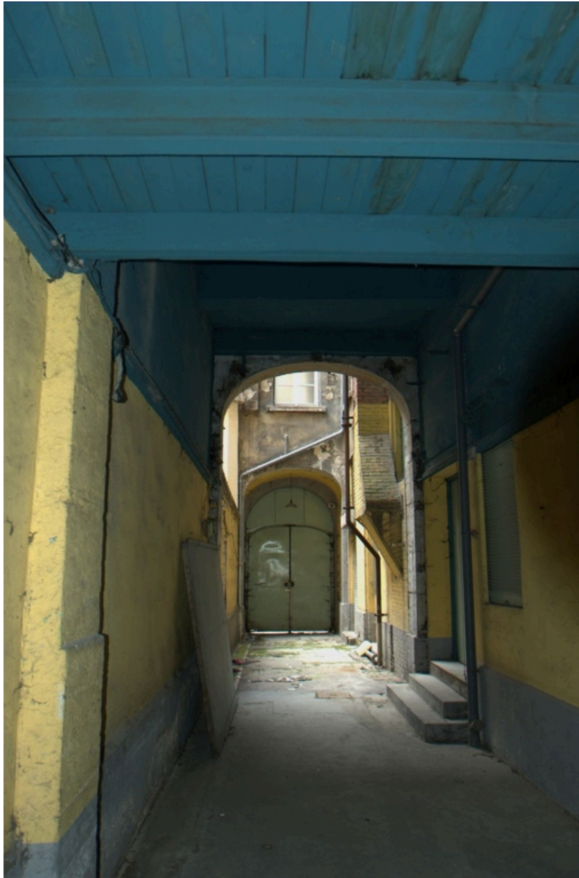
Passage, vue est menant à l'entrée principale