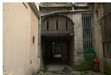
Détail passage IVR82_20086900313NUCA