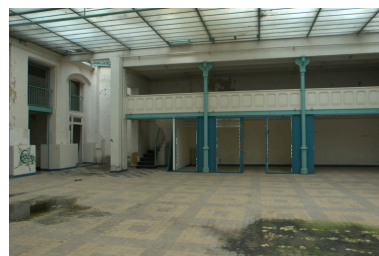
Vue est IVR82_20086900292NUCA