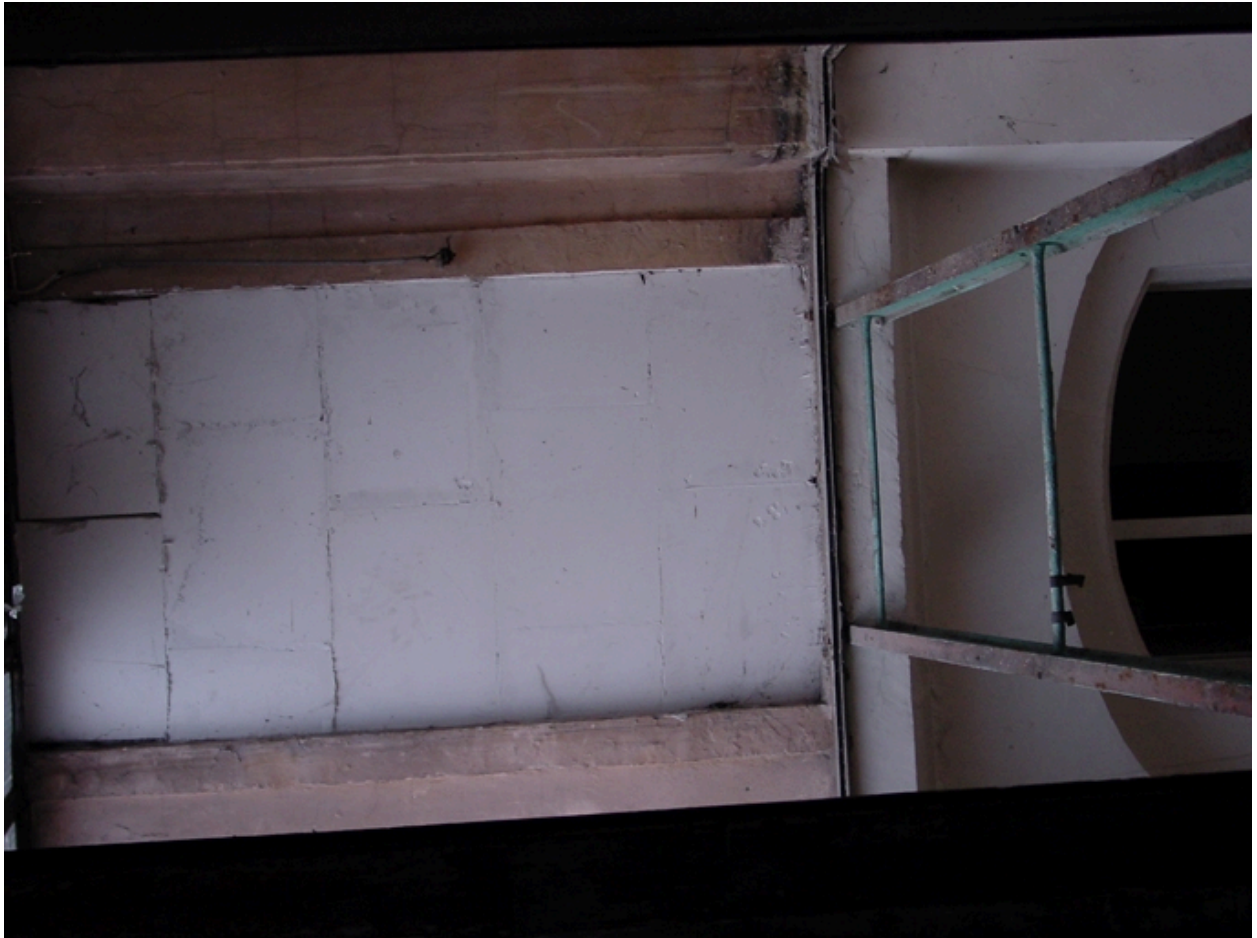
Sous-sol détail plafond