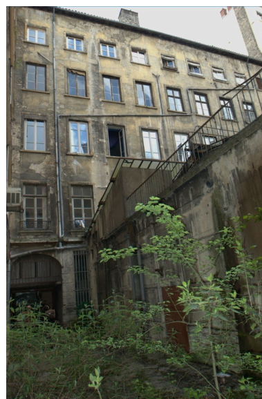
Vue d'ensemble est IVR82_20086900310NUCA