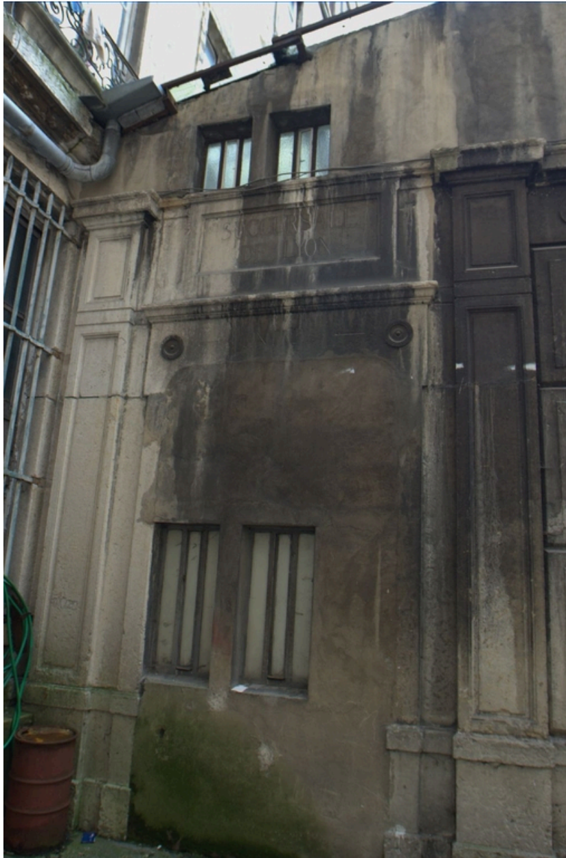
Entrée de la halle localisée dans l'impasse