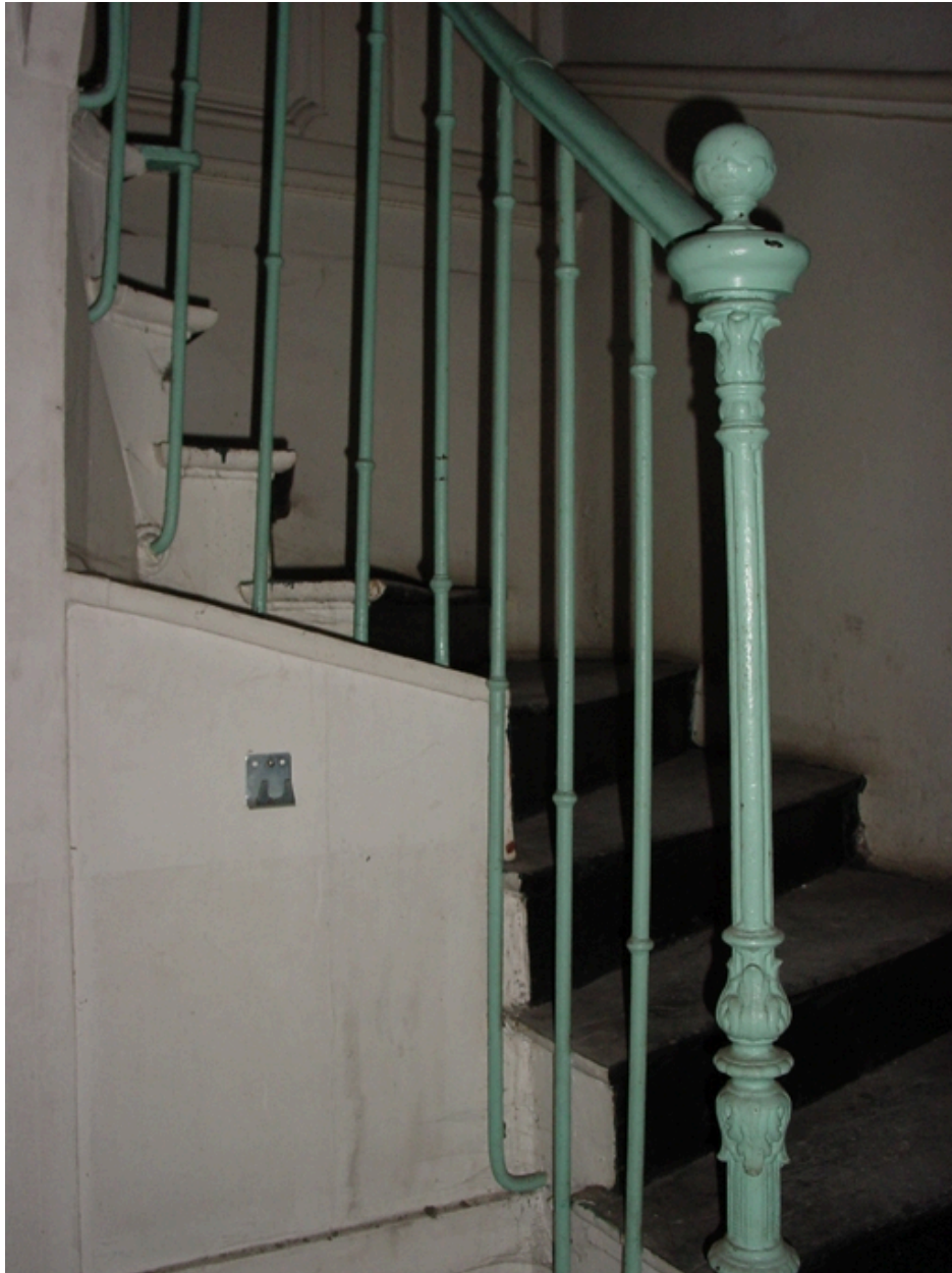
Détail escalier et rampe