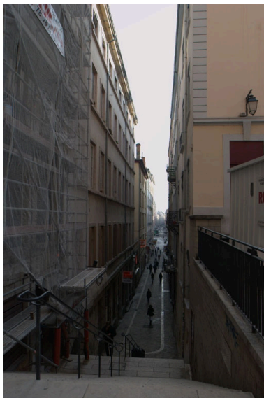
Vue nord de l'immeuble XVIIIe de la rue Sainte-Marie-des-Terreux