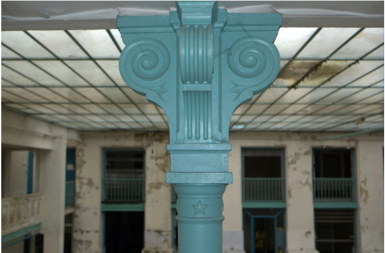
Détail chapiteau formé de 4 consoles cannelées