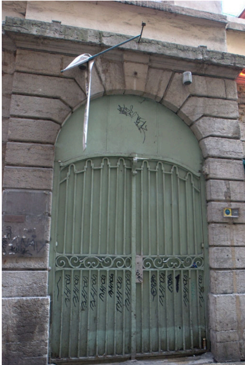
Accès latéral droit à la verrière