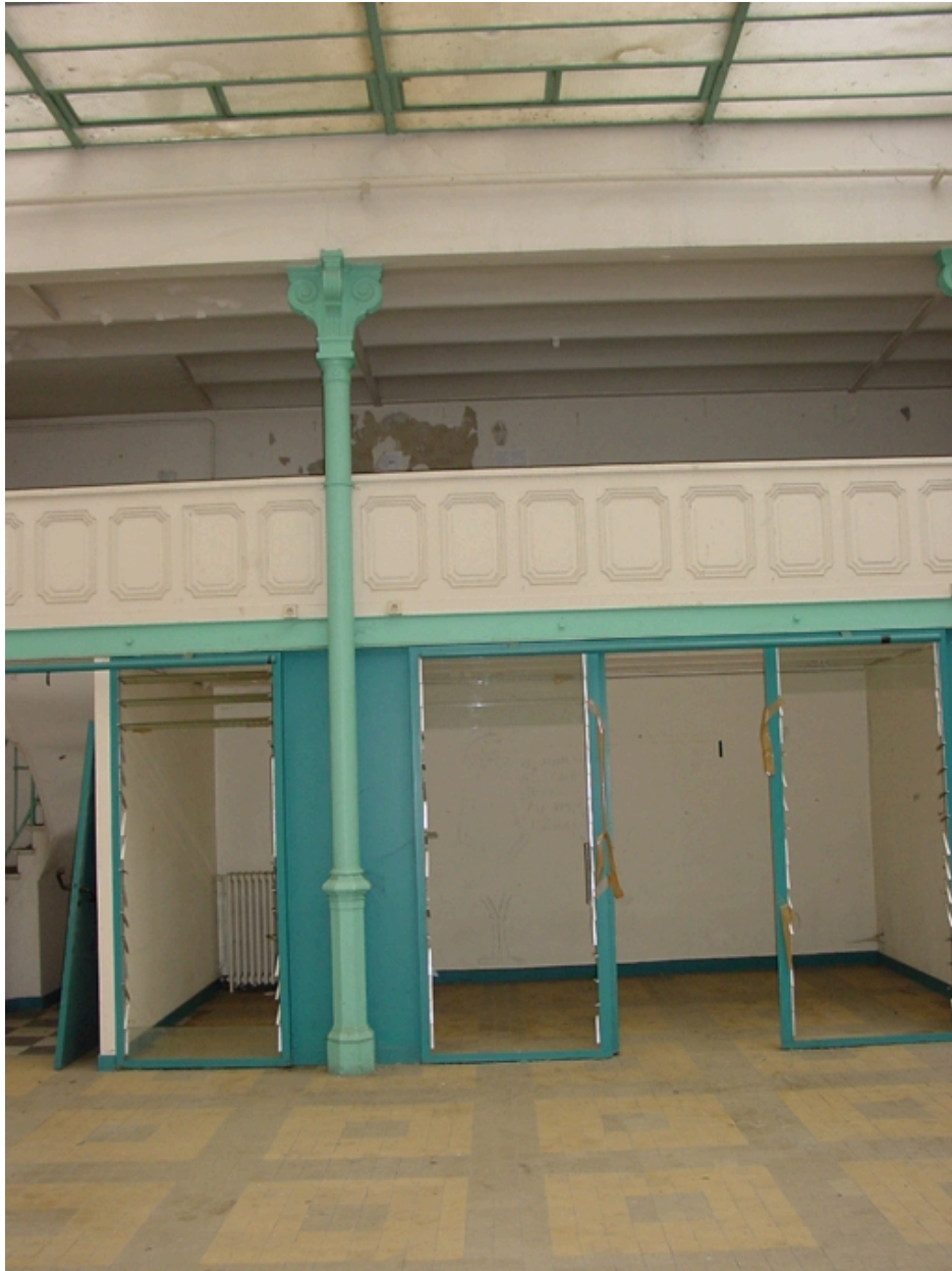
Détail vue intérieure