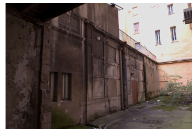
Vue de la façade extérieure localisée dans l'impasse IVR82_20086900280NUCA