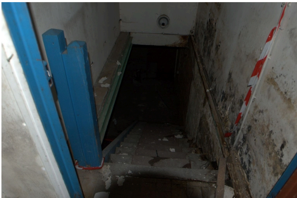
Escaliers menant au sous-sol