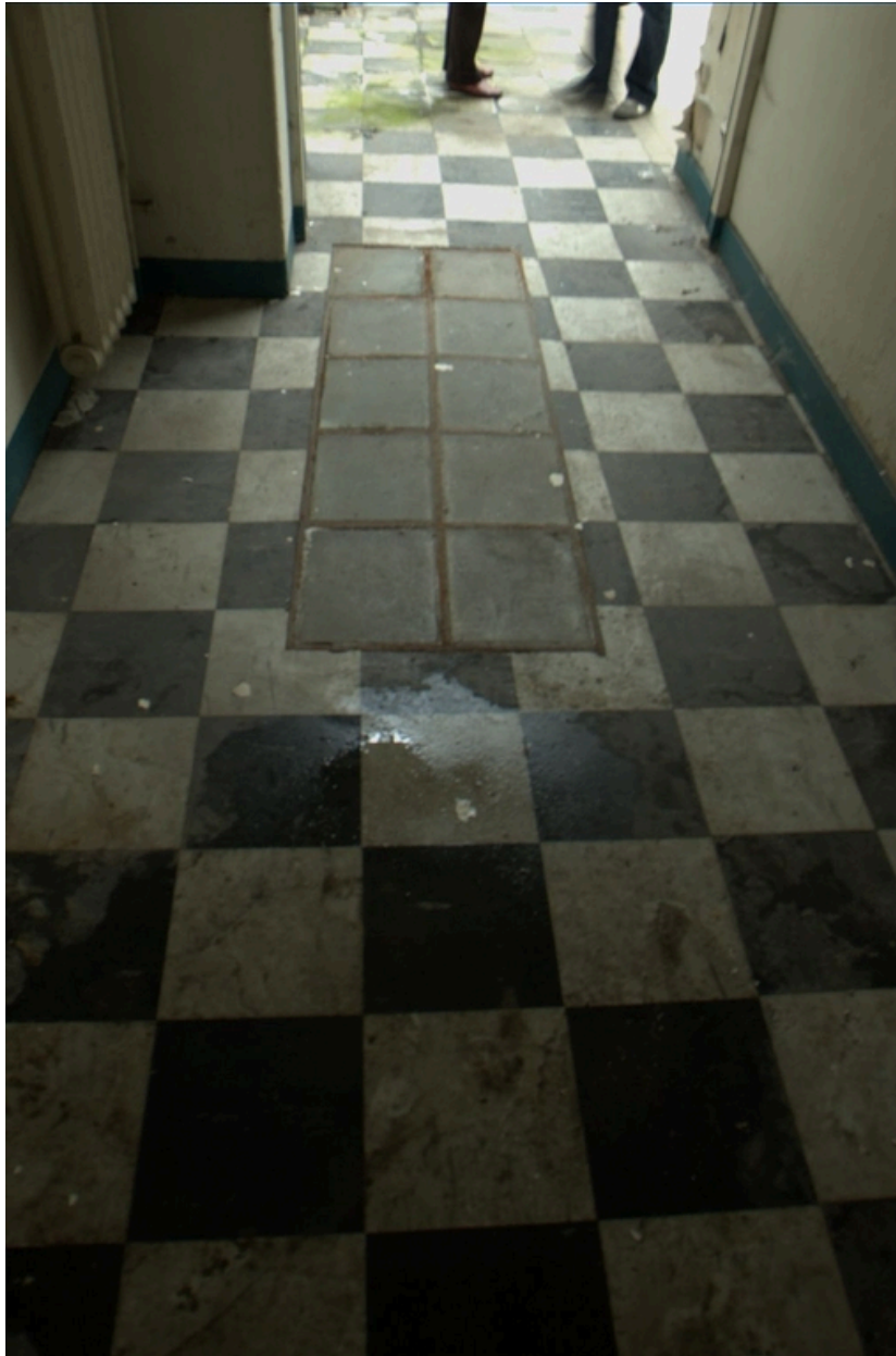
Plaques de verre permettant l'éclairage du sous-sol