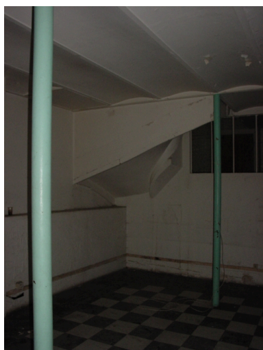
Détail plafond (entrevous) IVR82_20086900330NUCA