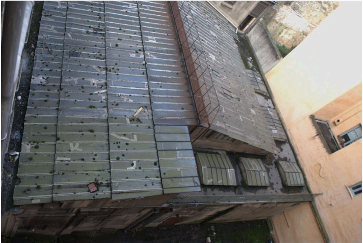
Détail de la toiture de l'atelier