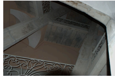
Détail escalier de l'immeuble de la rue Sainte-Marie-des-Terreux IVR82_20086900215NUCA