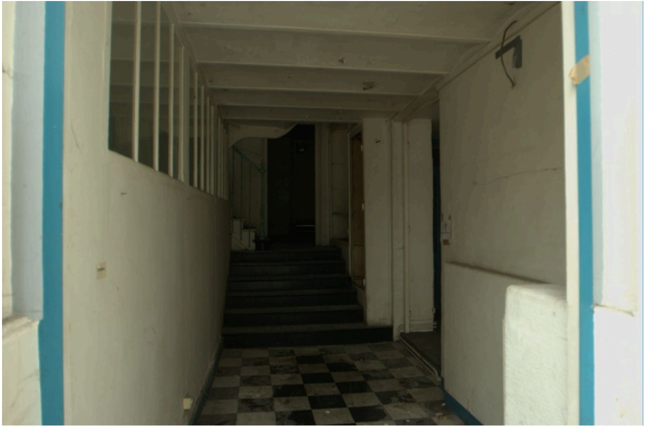
Espaces connexes à la halle (anciens bureaux)