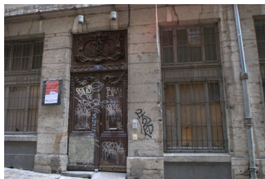
Porte de l'immeuble du 3 rue Sainte-Marie-des-Terreux IVR82_20086900201NUCA