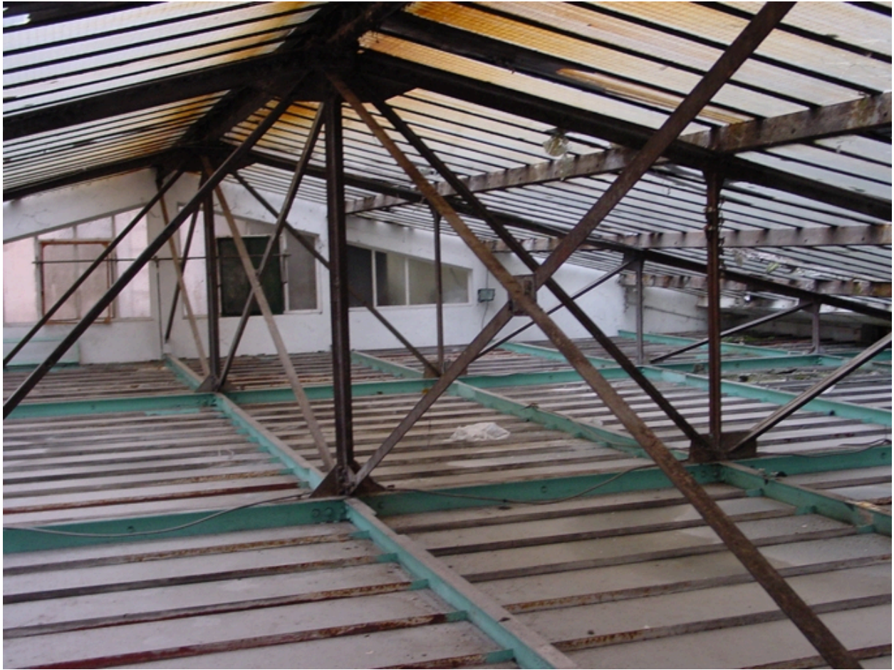
Espace entre les deux verrière