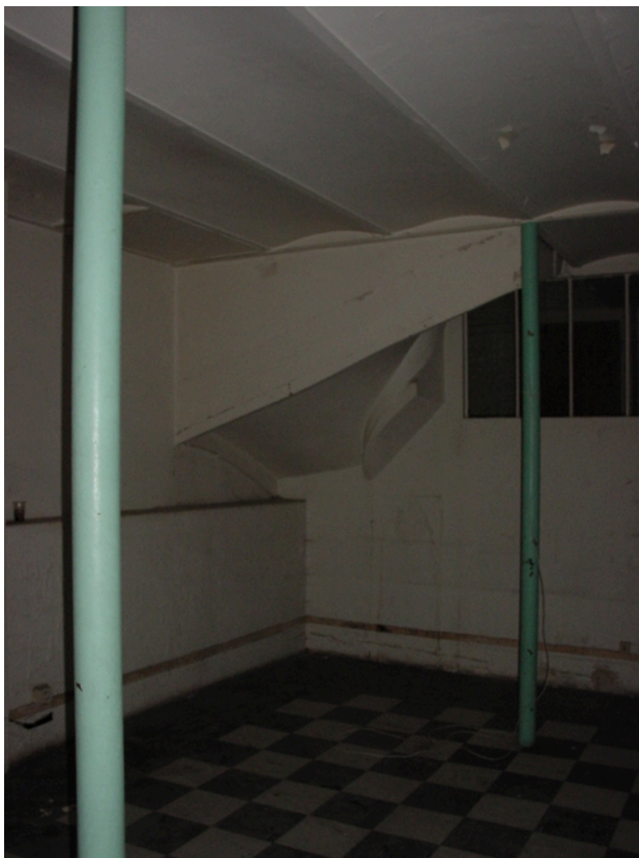
Détail plafond (entrevous)