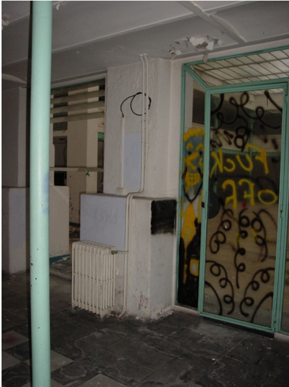
Espace latéral à la grande halle