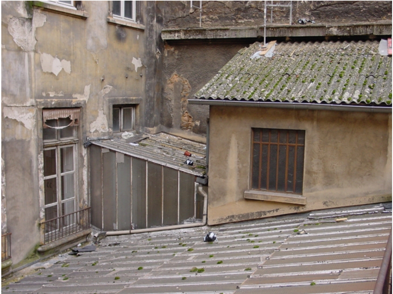
Vue des toitures