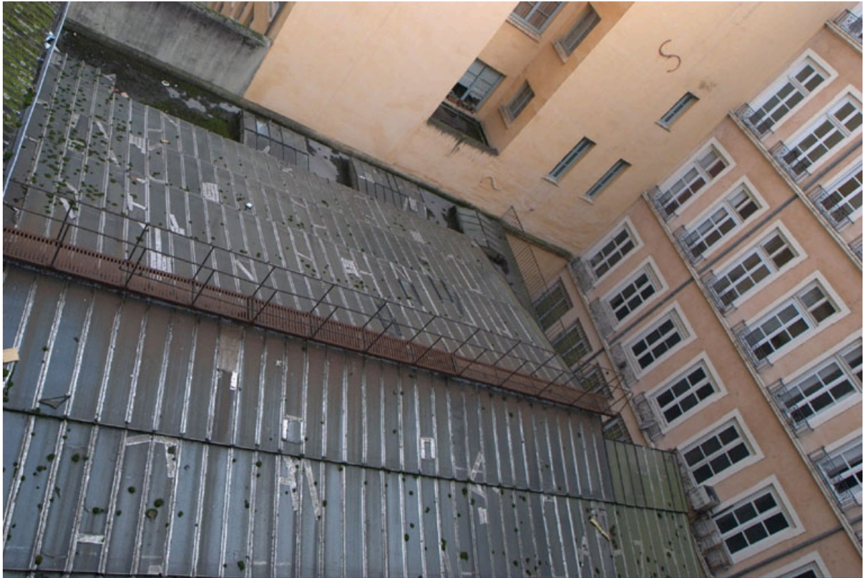
Vue de la verrière