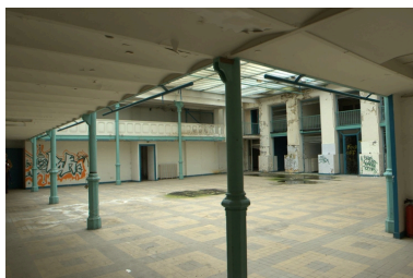
Vue d'ensemble de la halle couverte IVR82_20086900283NUCA