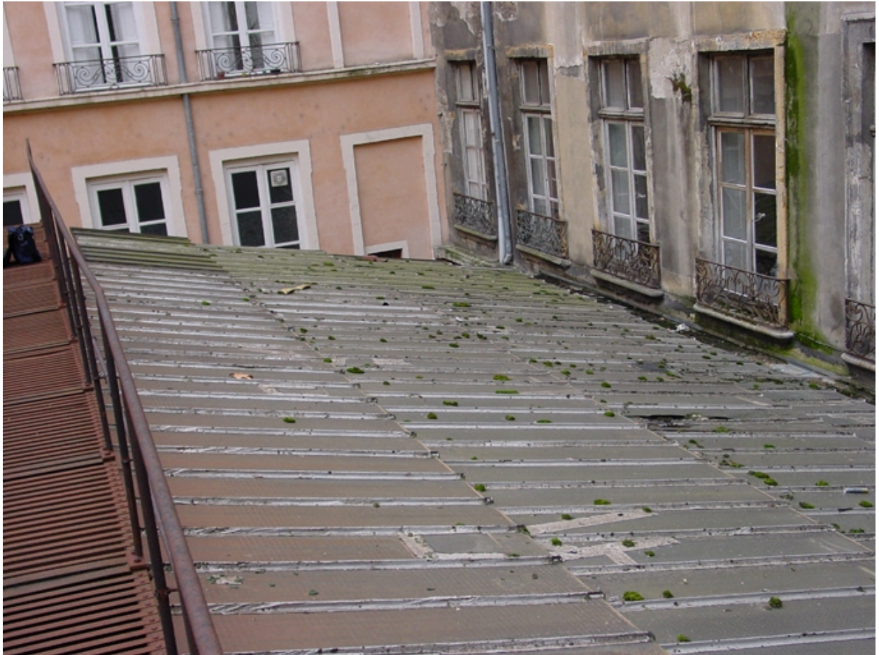
Détail toiture (verrière)