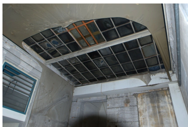
Plaque de verre permettant l'éclairage du sous-sol IVR82_20086900294NUCA