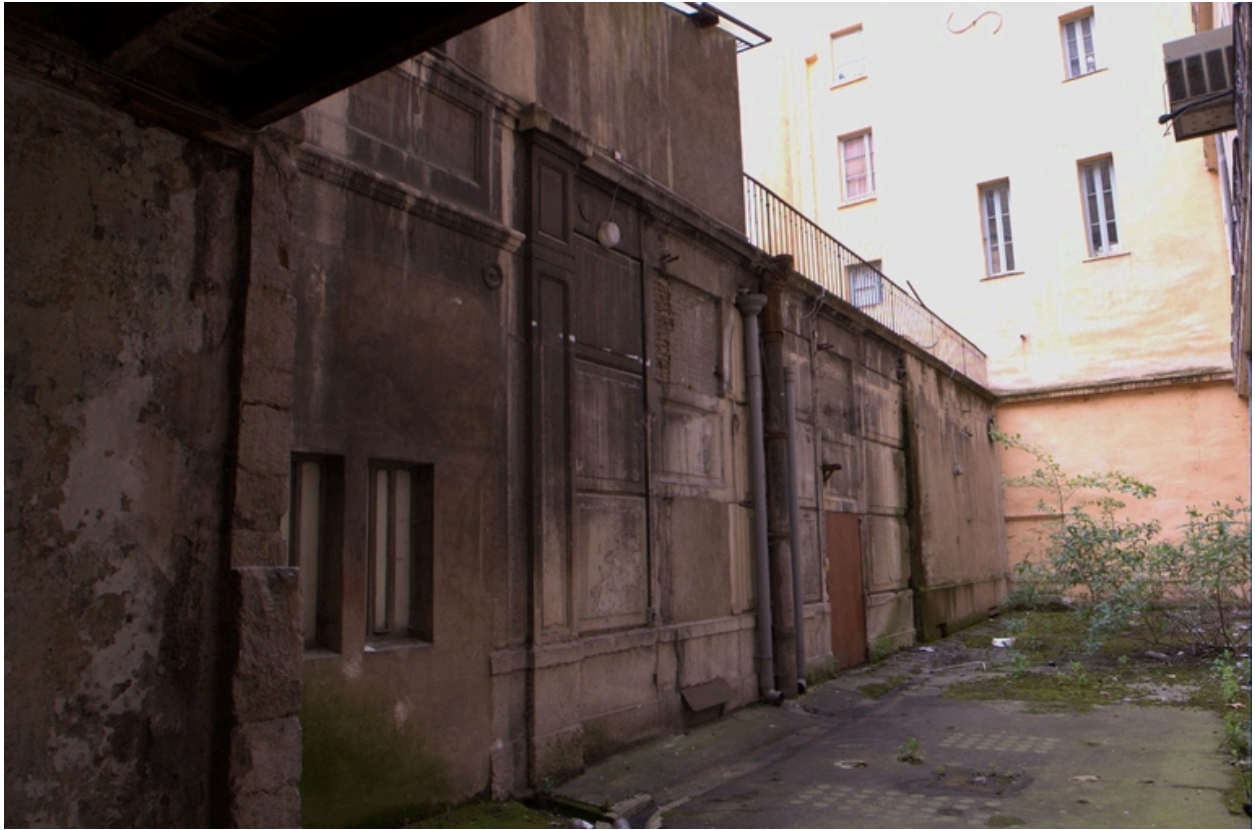
Vue de la façade extérieure localisée dans l'impasse