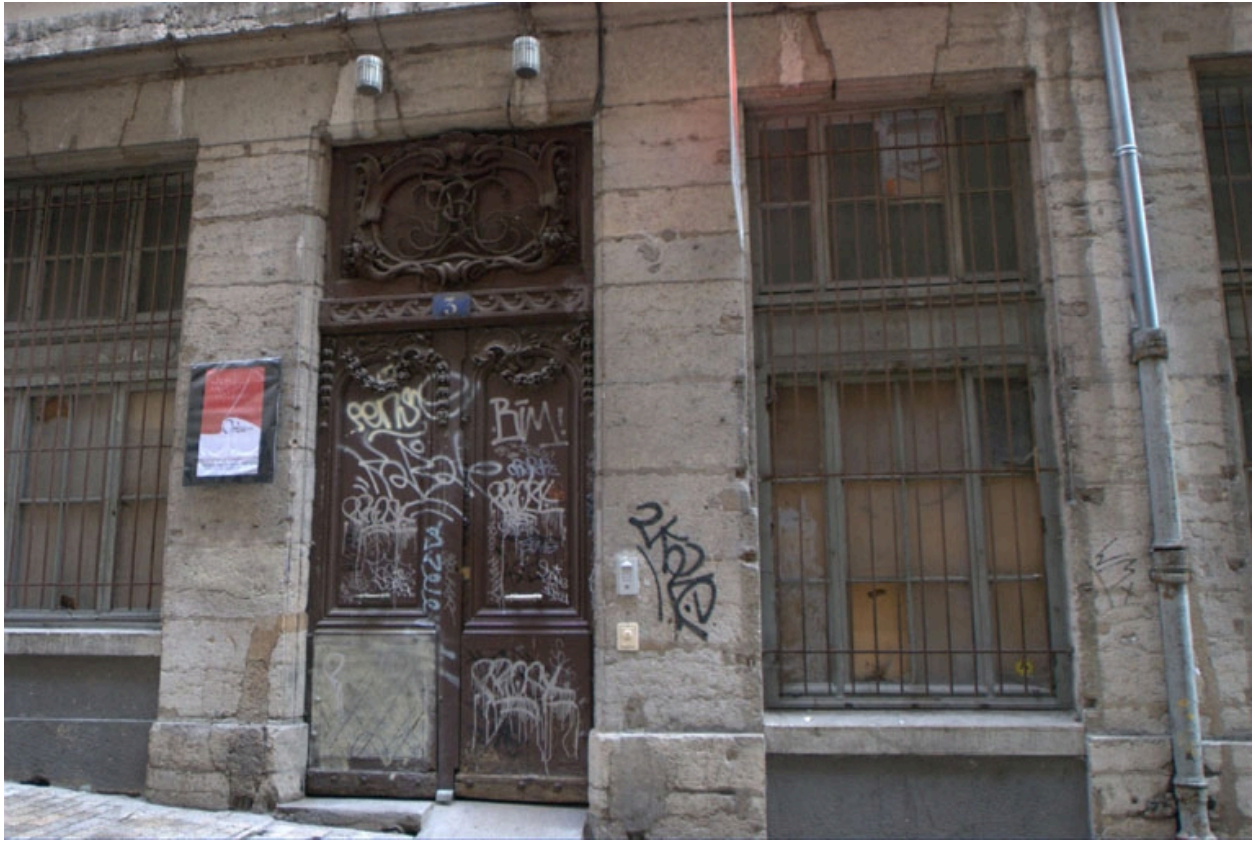
Porte de l'immeuble du 3 rue Sainte-Marie-des-Terreux