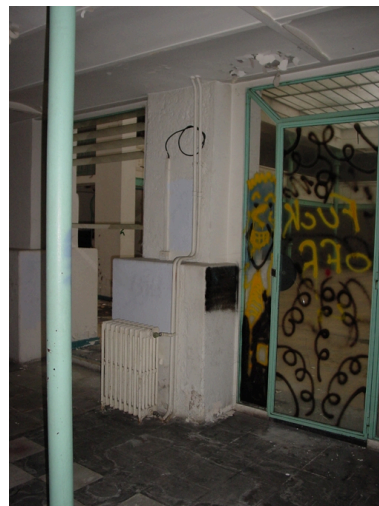
Espace latéral à la grande halle IVR82_20086900329NUCA