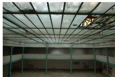
Vue nord de la halle