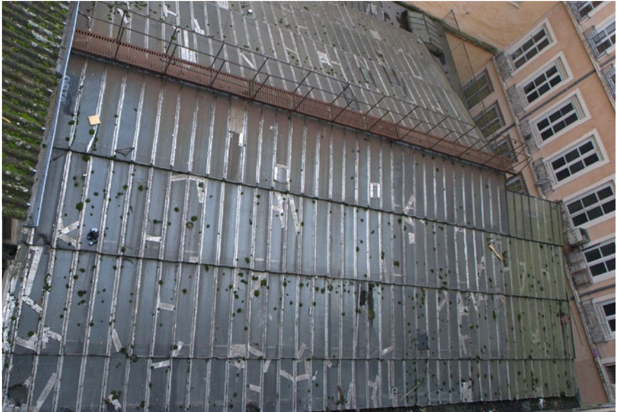
Détail passerelle de la verrière