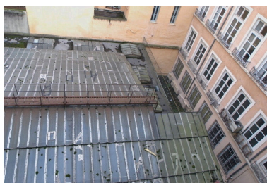
Détail entrée atelier