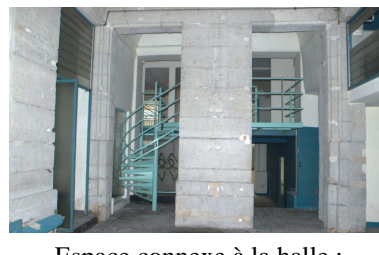
Espace connexe à la halle : avec escalier métallique