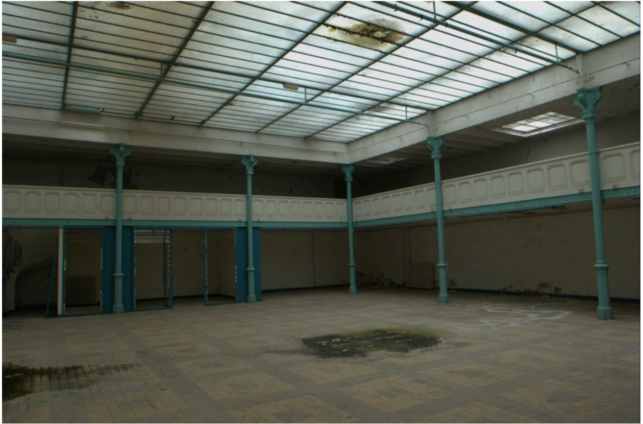
Vue d'ensemble de la halle couverte