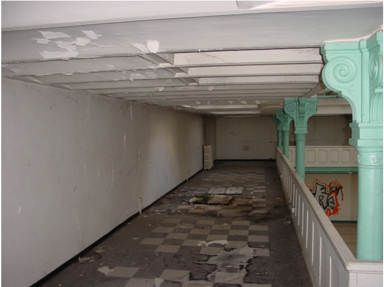
Circulation haute de la halle