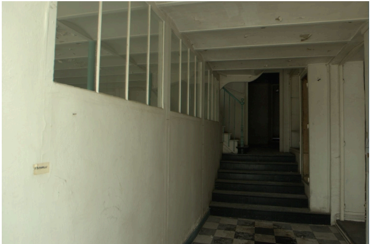
Détail ouverture latérale