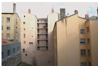
Vue de l'environnement directe de cet atelier, en coeur d'îlot