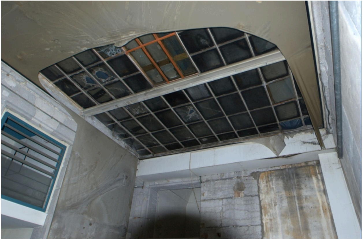
Plaque de verre permettant l'éclairage du sous-sol