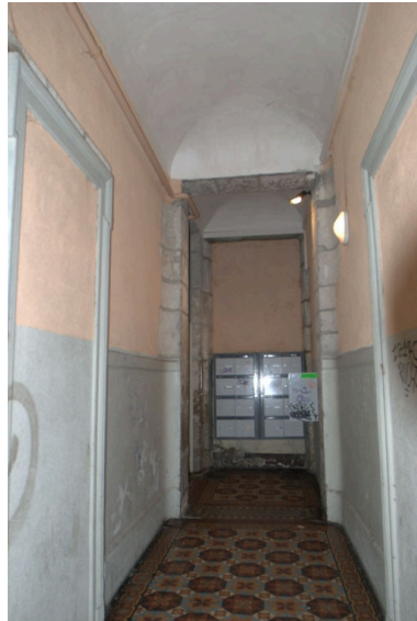
Allée de l'immeuble de la rue Sainte-Marie-des-Terreux IVR82_20086900217NUCA