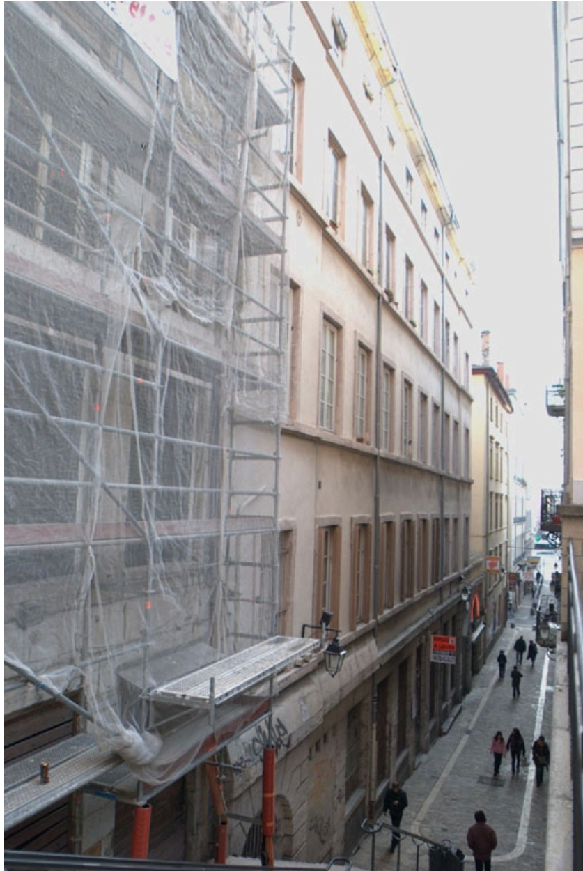
Immeuble de la rue Sainte-Marie-des-Terreux