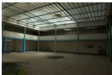
Vue ouest IVR82_20086900290NUCA