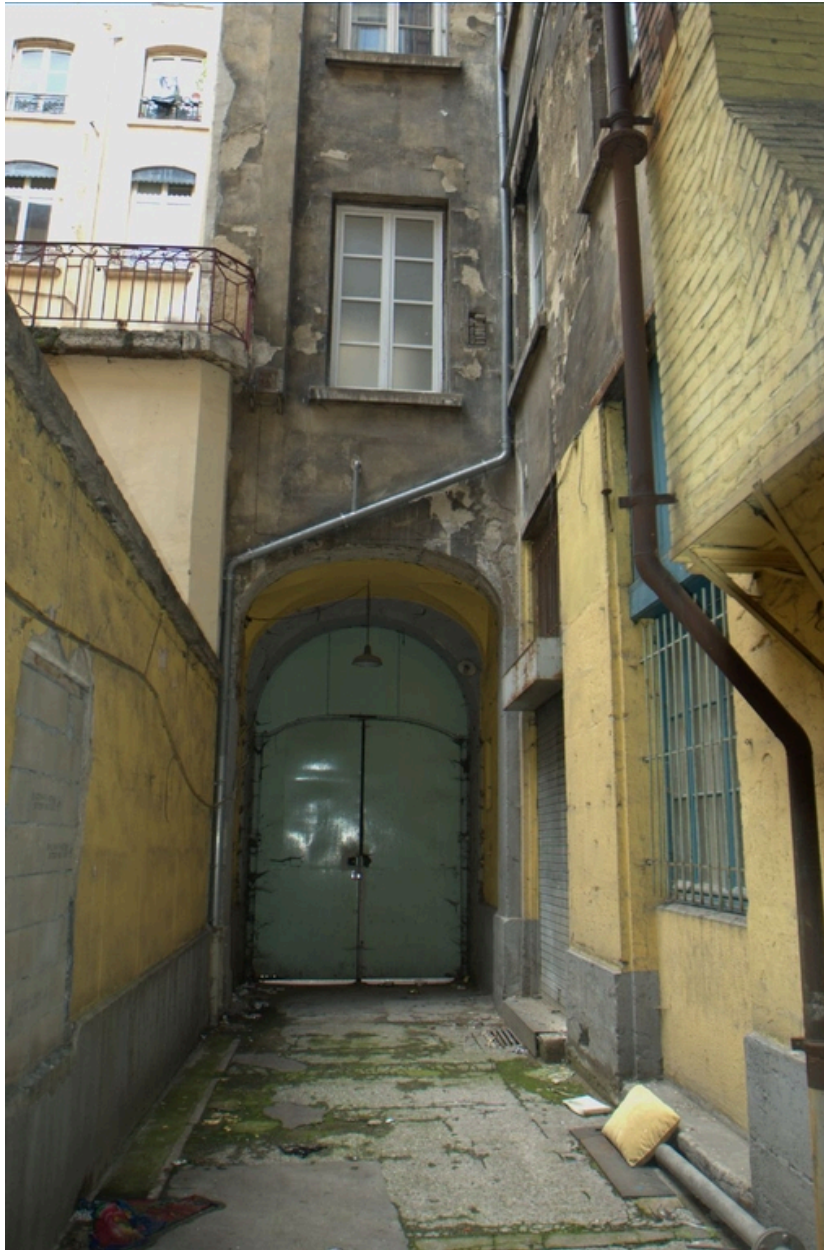
Entrée principale d'accès à la halle (vue est)