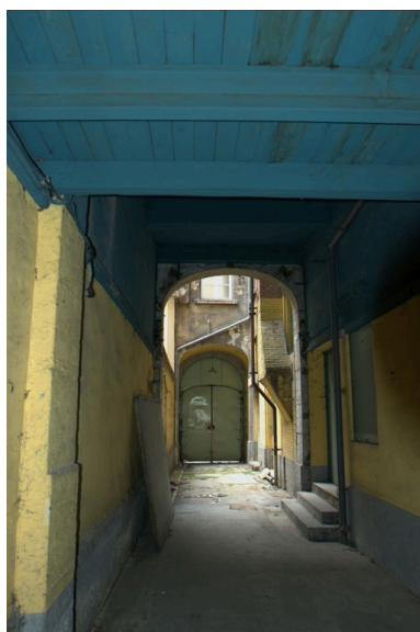
Passage, vue est menant à l'entrée principale IVR82_20086900314NUCA