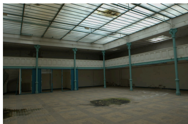
Vue d'ensemble de la halle couverte IVR82_20086900281NUCA