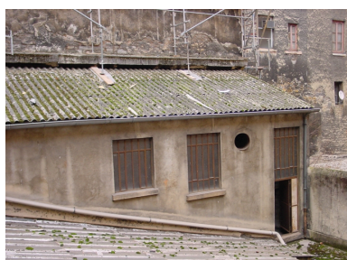
Détail toiture IVR82_20086900333NUCA