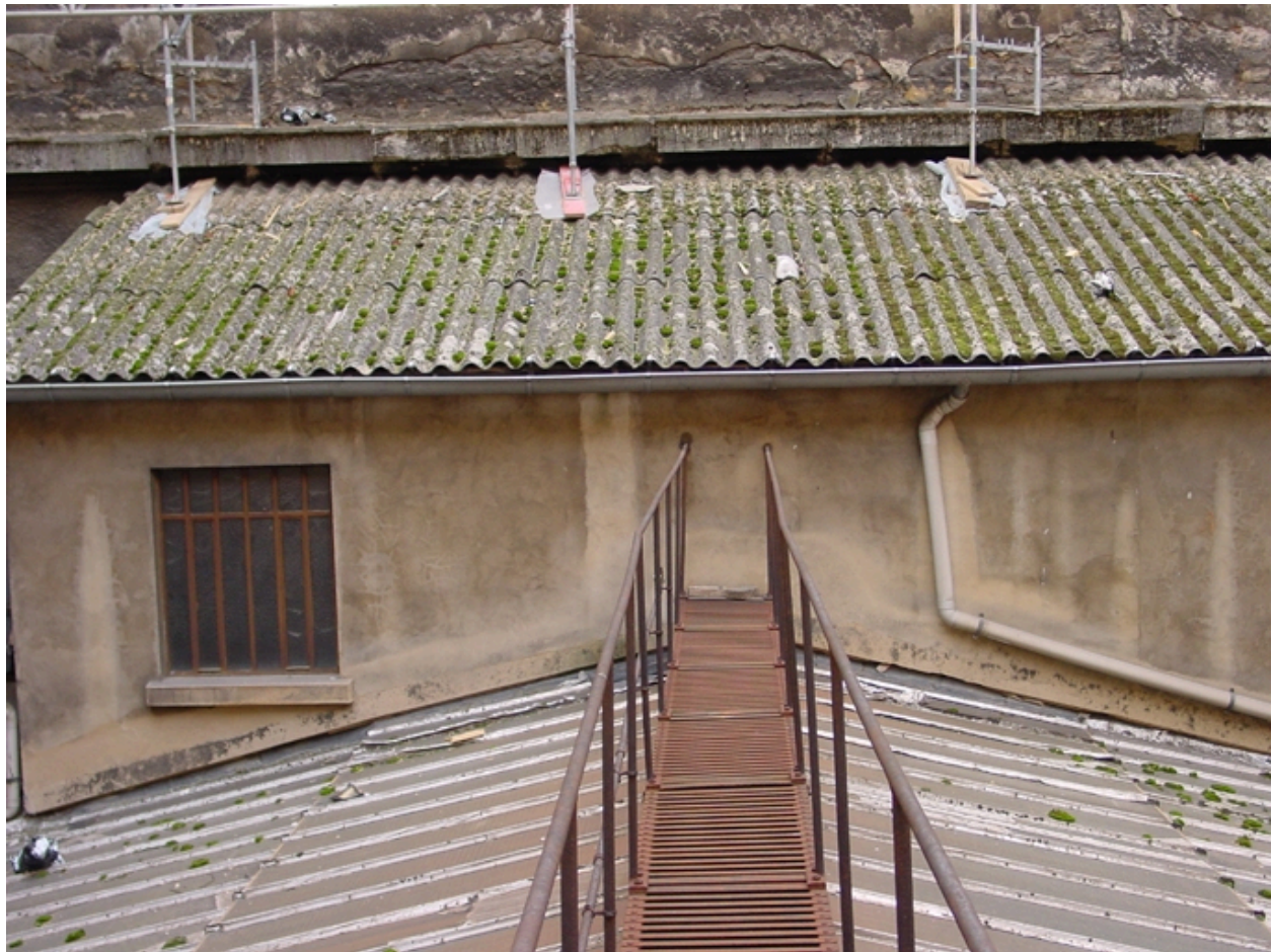
Passerelle de la verrière