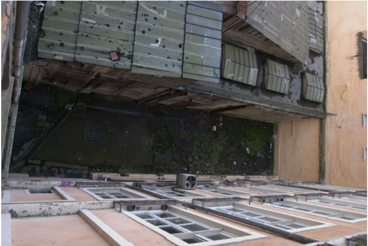
Passage principal, vue zénithale ouest