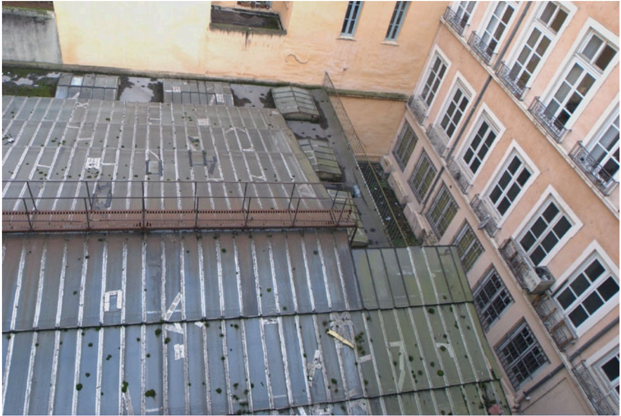
Détail entrée atelier