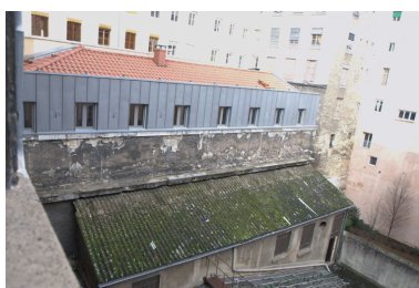
Environnement directe IVR82_20086900210NUCA