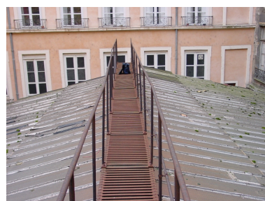
Passerelle de la verrière