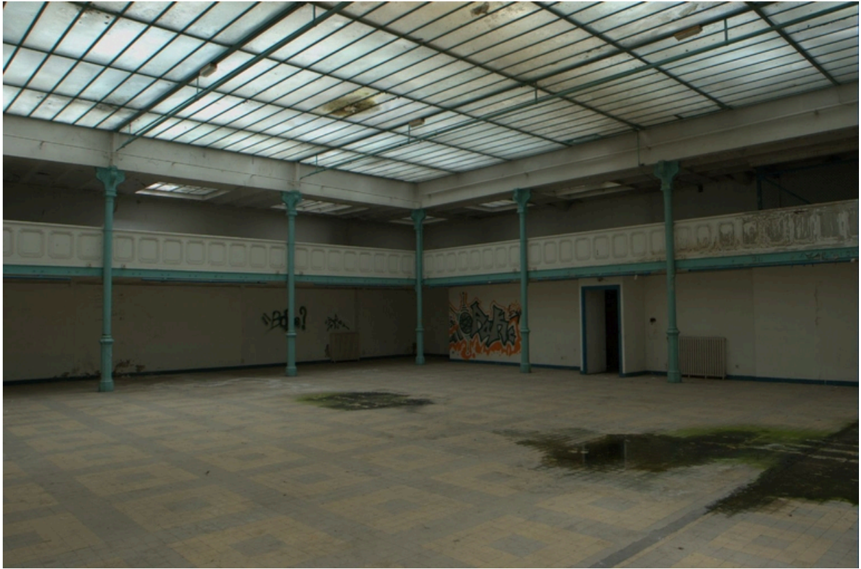
Vue nord-est de la halle