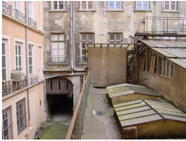
Détail verrière IVR82_20086900346NUCA