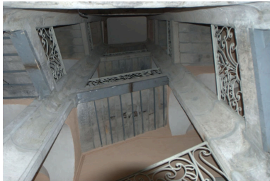
Détail escalier de la rue Ste-Marie-des-Terreux