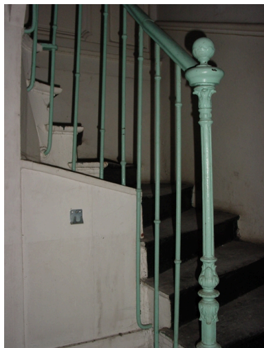
Détail escalier et rampe IVR82_20086900327NUCA

IVR82_20086900326NUCA