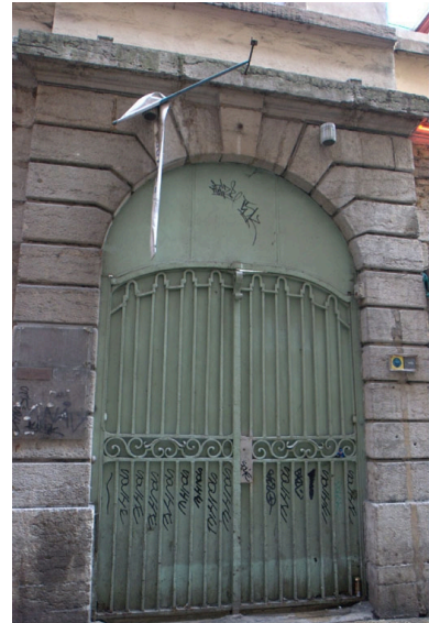
Accès latéral droit à la verrière IVR82_20086900218NUCA