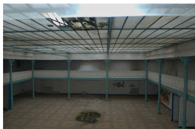
Vue de la grande halle