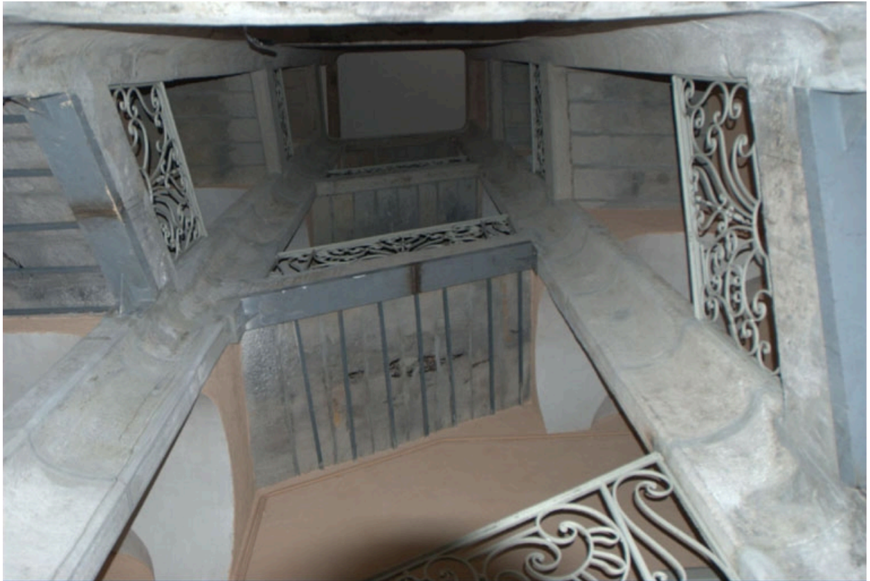
Détail escalier de la rue Ste-Marie-des-Terreux