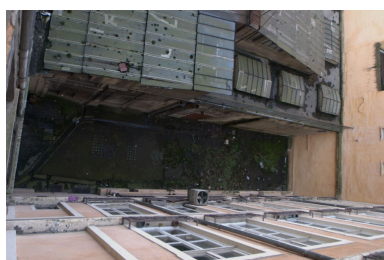
Passage principal, vue zénithale ouest IVR82_20086900211NUCA