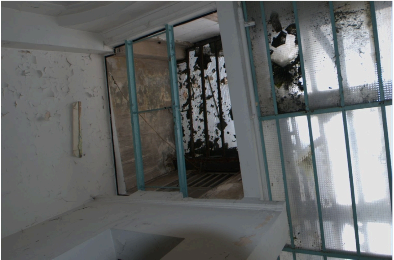
Détail éclairage zénithal (verrière)