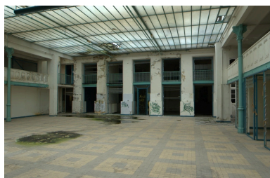
Vue d'ensemble nord de la halle IVR82_20086900284NUCA