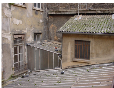
Vue des toitures IVR82_20086900331NUCA