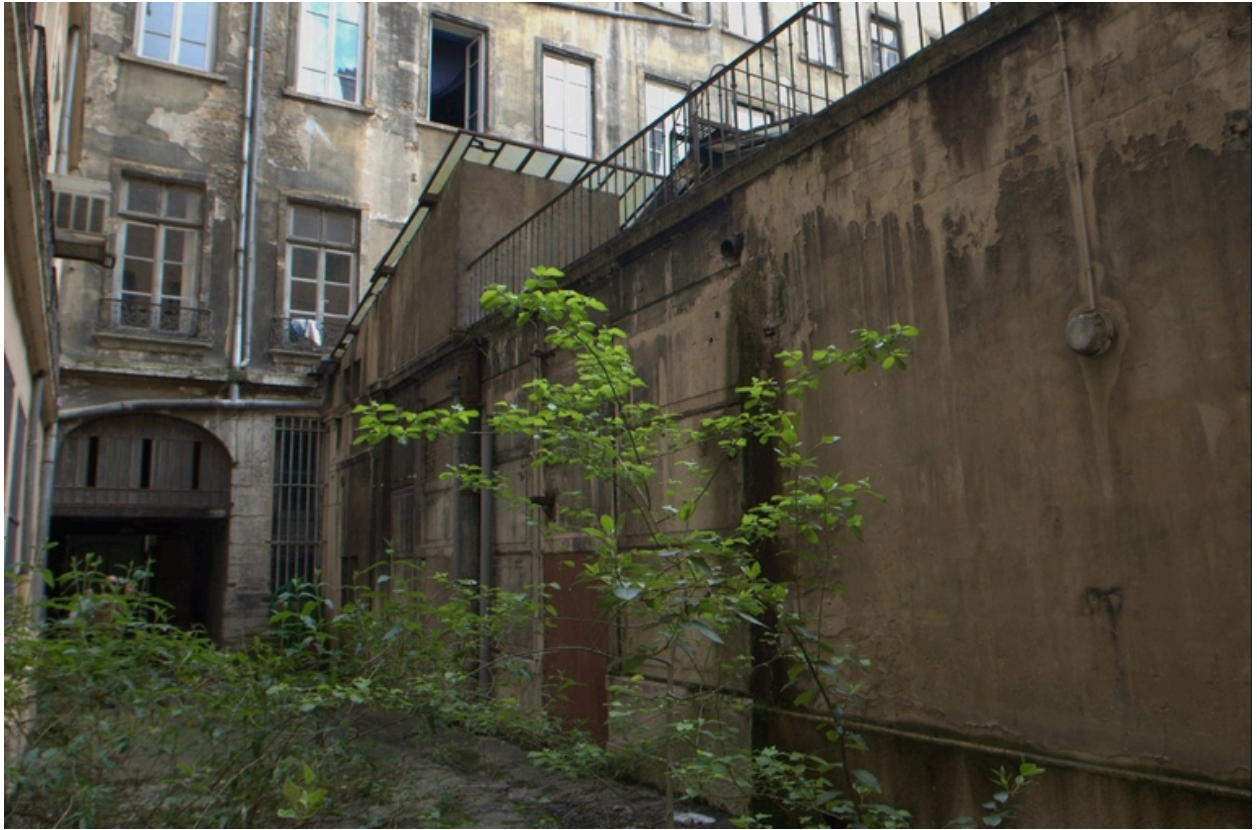
vue d'ensemble est