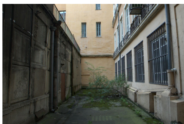
Vue ouest façade principale de la halle (dans l'impasse)

IVR82_20086900305NUCA