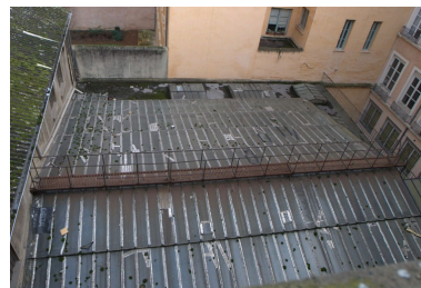
Vue de la verrière