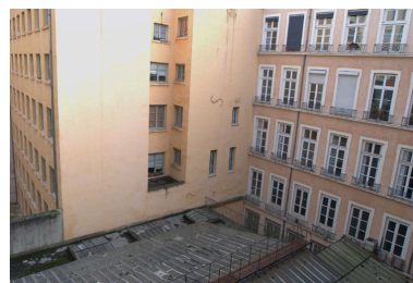
Verrière vue ouest IVR82_20086900206NUCA