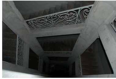
Escalier de l'immeuble XVIIIe IVR82_20086900214NUCA