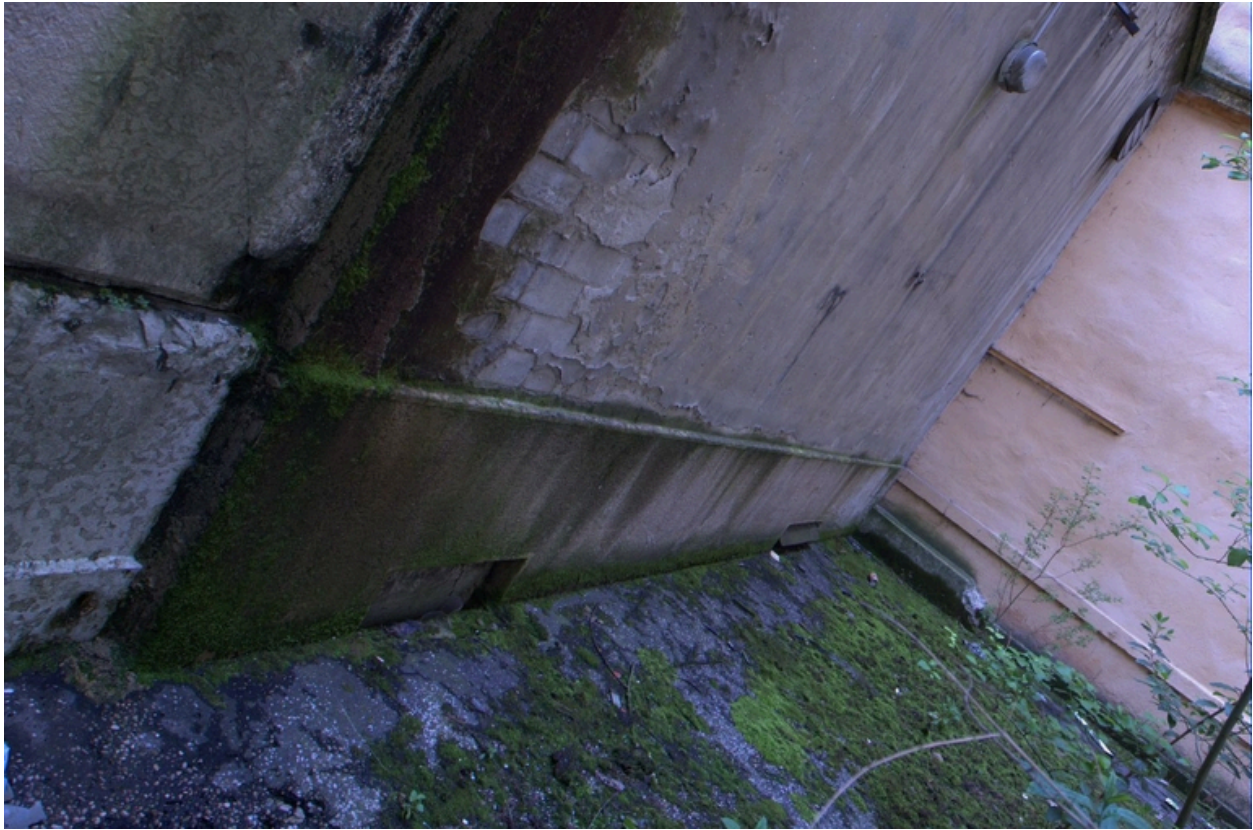
Détail ouest soupiraux