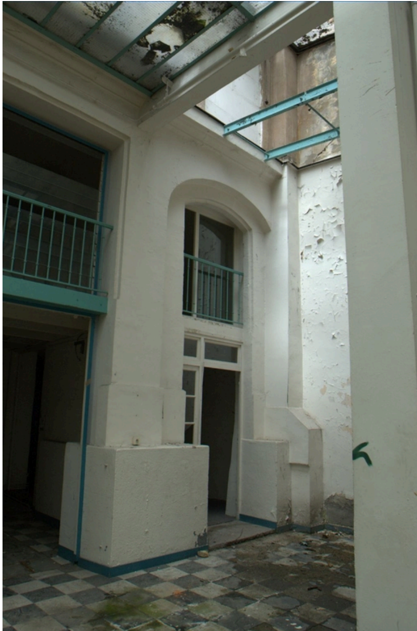
Détail ouverture latérale de la halle