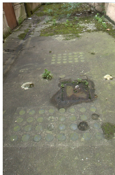
Détail plaques de verre circulaires extérieures éclairant le sous-sol

IVR82_20086900306NUCA