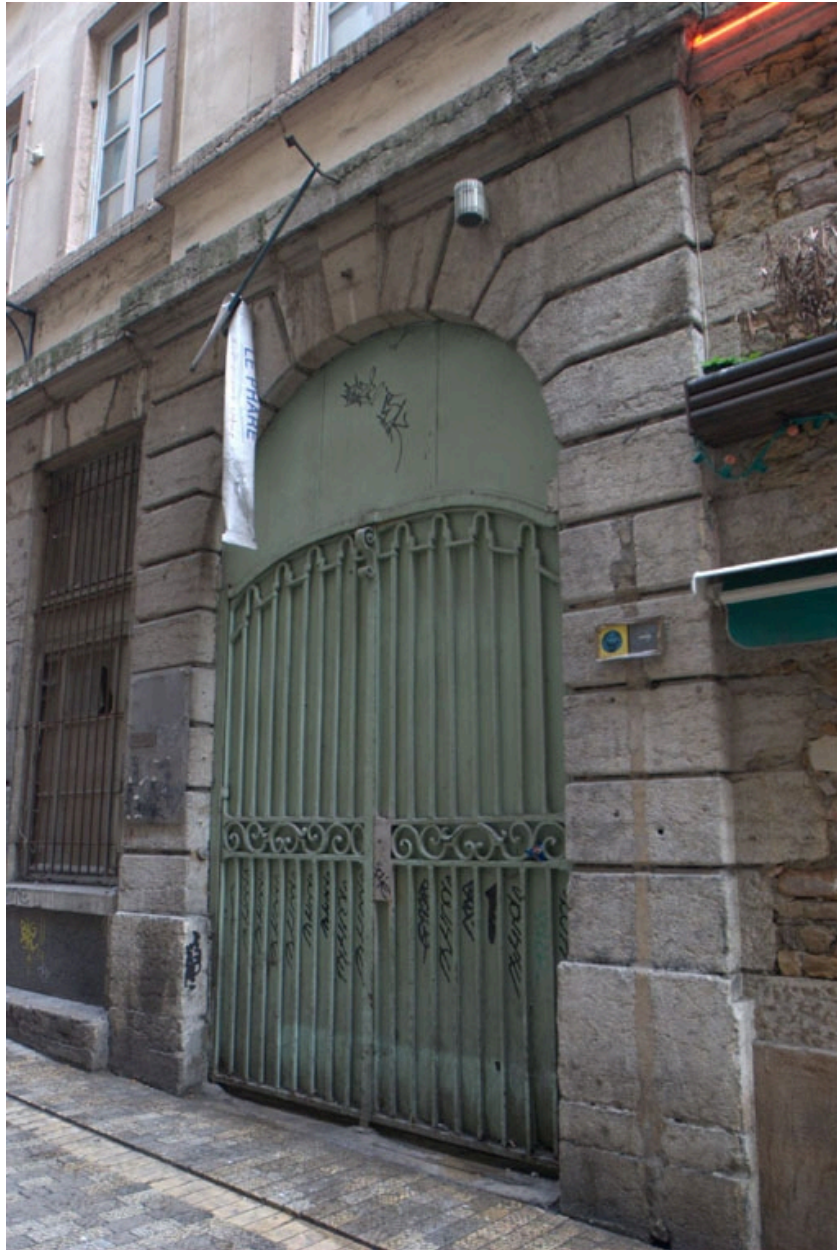
Entrée latérale droite menant à la cour couverte