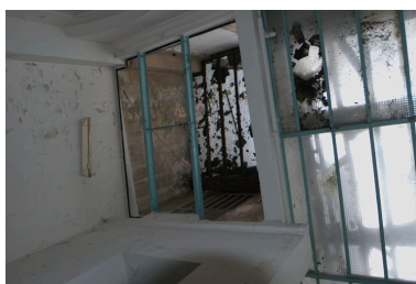
Détail éclairage zénithal (verrière)

IVR82_20086900299NUCA