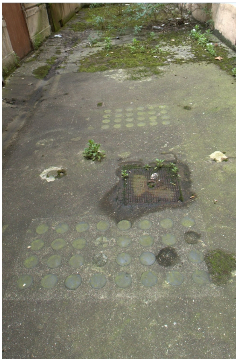
Détail plaques de verre circulaires extérieures éclairant le sous-sol