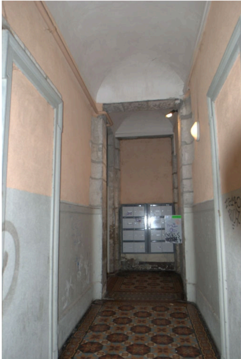
Allée de l'immeuble de la rue Sainte-Marie-des-Terreux