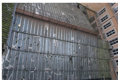
Détail passerelle de la verrière IVR82_20086900207NUCA