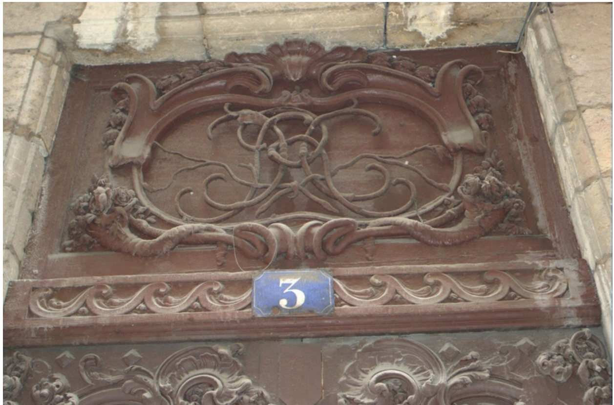
Chiffre de la porte d'entrée principale de l'immeuble XVIIIe siècle