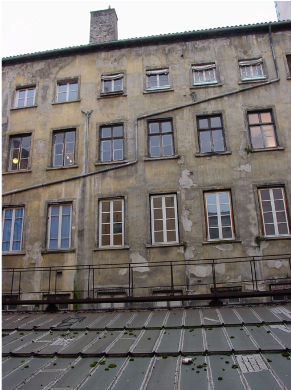
Vue de la verrière et de la façade arrière de l'immeuble