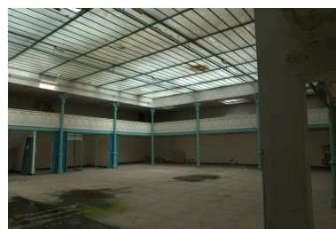
Vue nord-est IVR82_20086900289NUCA