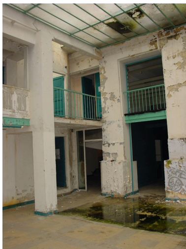
Vue intérieure IVR82_20086900322NUCA