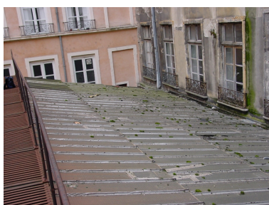
Détail toiture (verrière) IVR82_20086900334NUCA