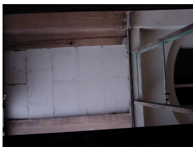
Sous-sol détail plafond

IVR82_20086900339NUCA