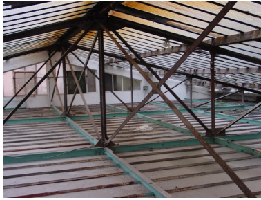
Espace entre les deux verrière IVR82_20086900340NUCA