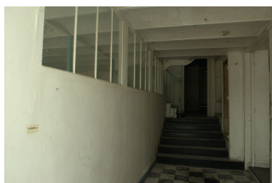
Détail ouverture latérale IVR82_20086900287NUCA