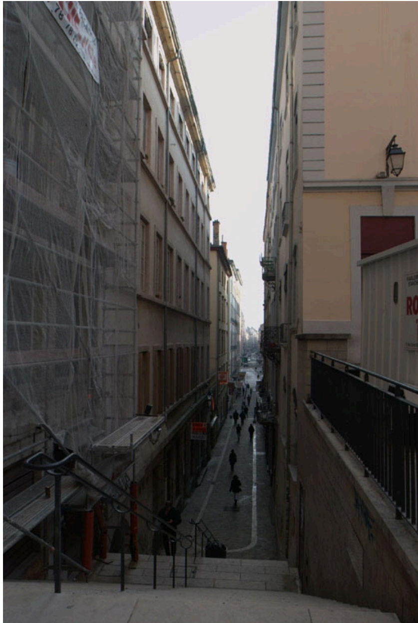
Vue nord de l'immeuble XVIIIe de la rue Sainte-Marie-des-Terreux