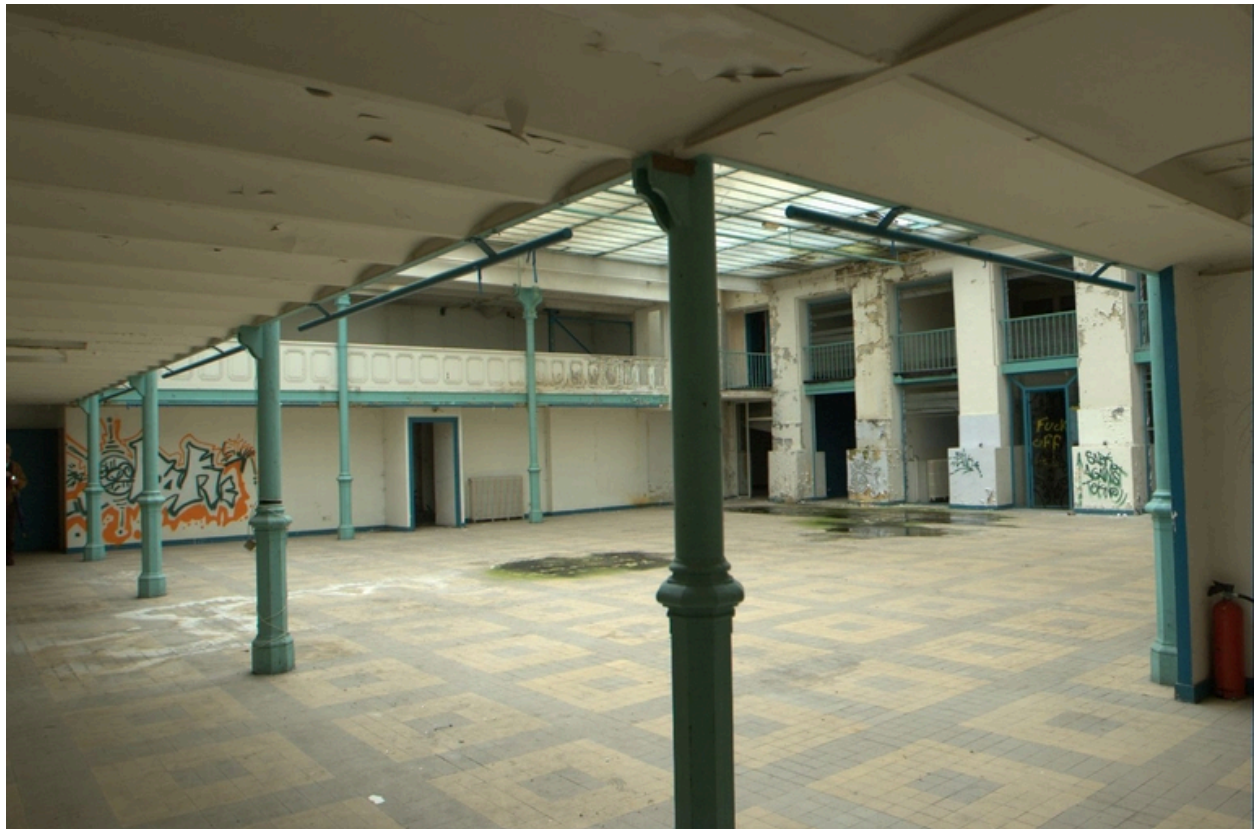
Vue d'ensemble de la halle couverte