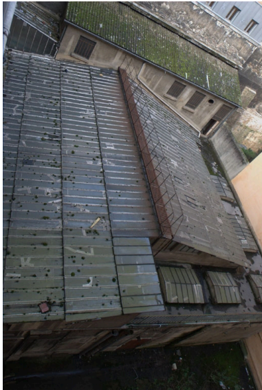
Détail de la toiture