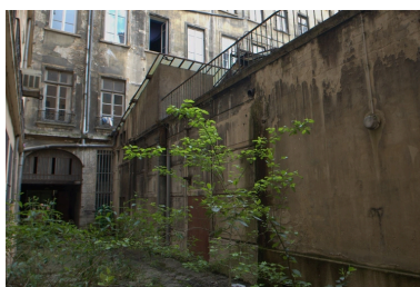
vue d'ensemble est IVR82_20086900309NUCA