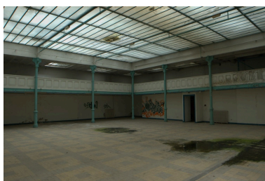
Vue nord-est de la halle IVR82_20086900288NUCA