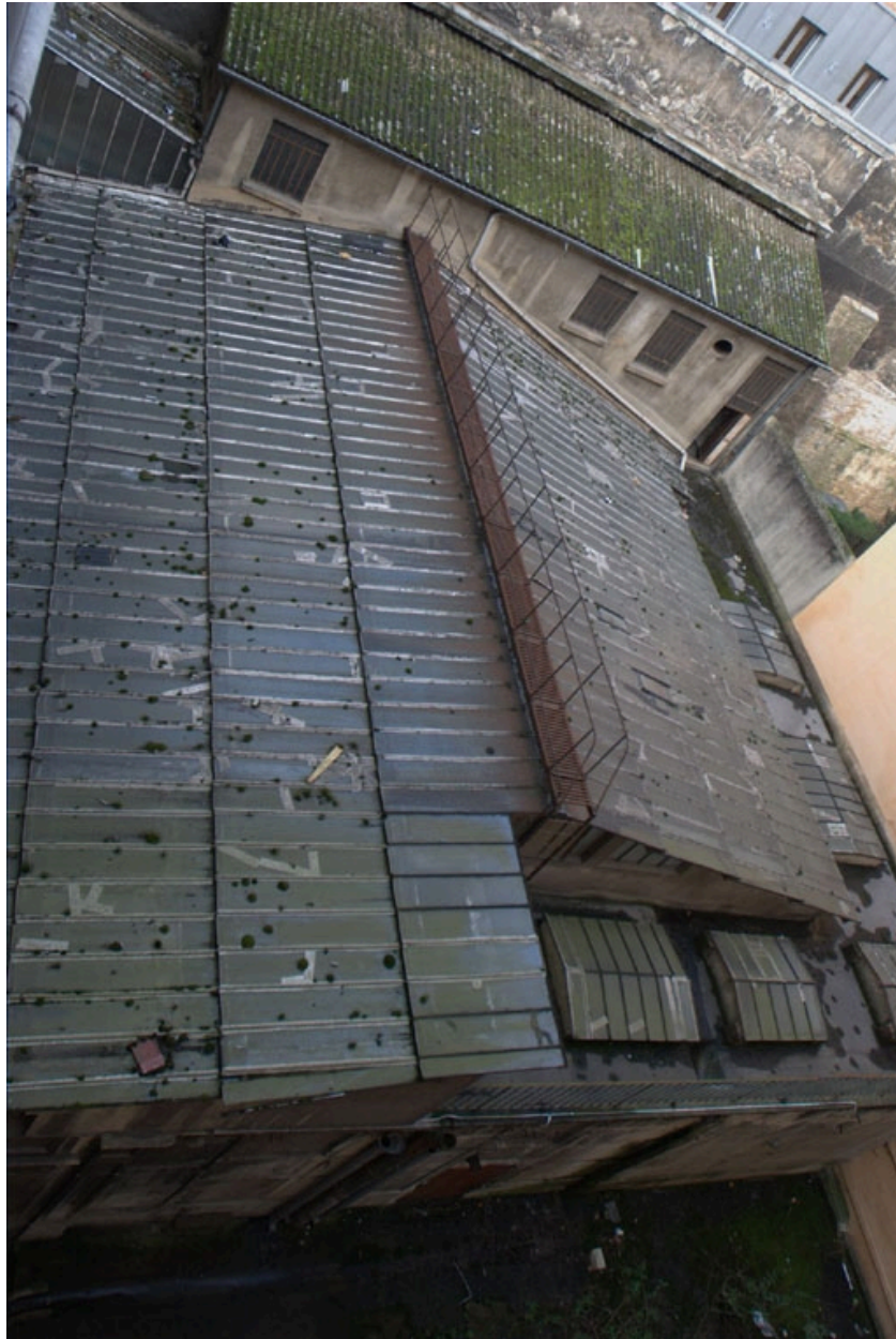
Détail de la toiture