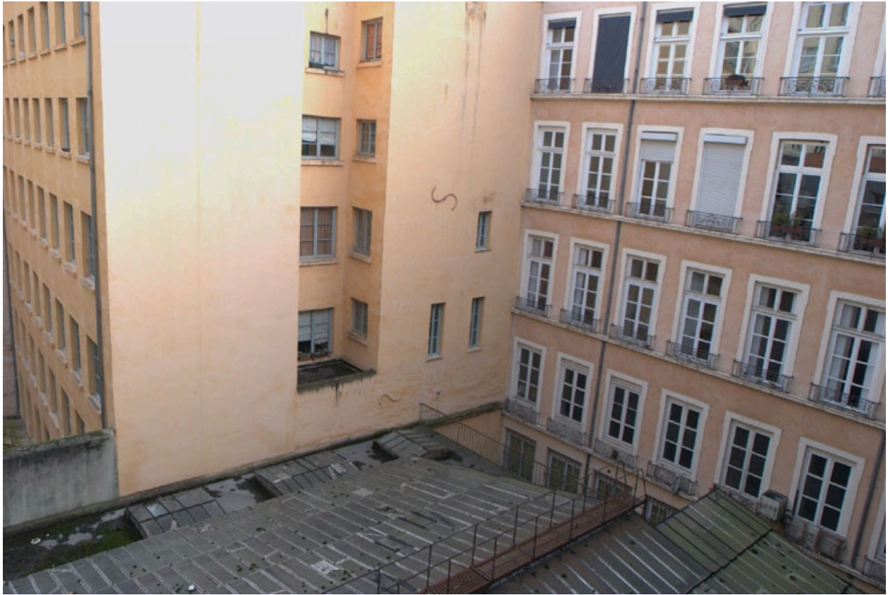
Verrière vue ouest