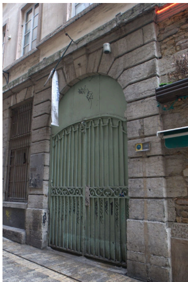
Entrée latérale droite menant à la cour couverte IVR82_20086900202NUCA