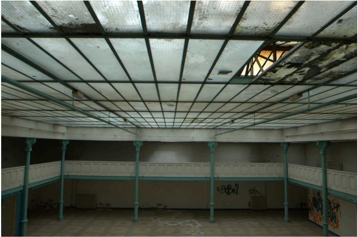
Vue nord de la halle