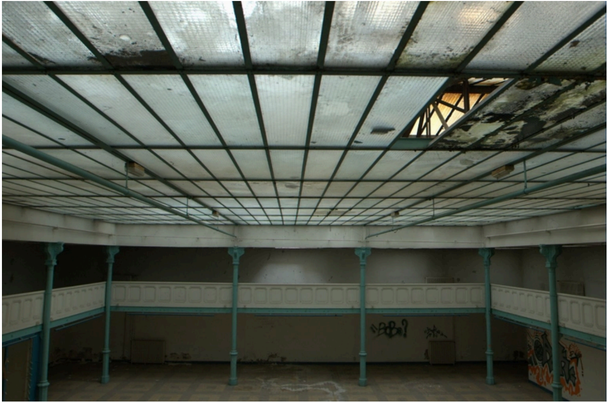
Vue nord de la halle