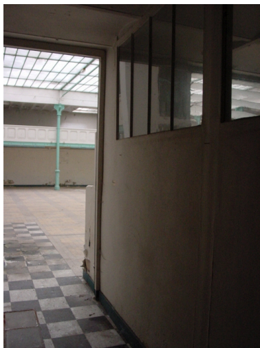
Circulation intérieure IVR82_20086900328NUCA