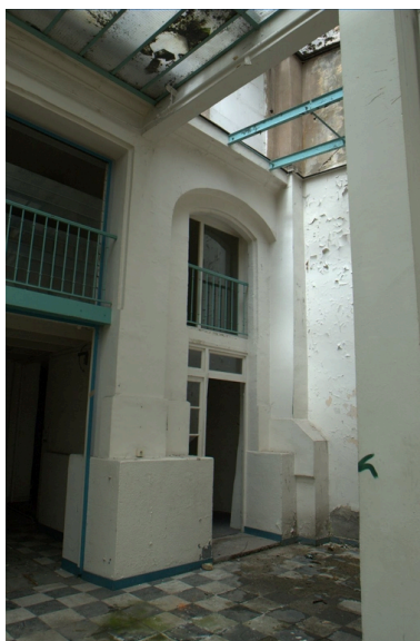
Détail ouverture latérale de la halle IVR82_20086900285NUCA