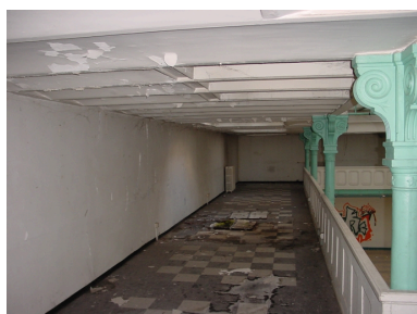
Circulation haute de la halle IVR82_20086900324NUCA