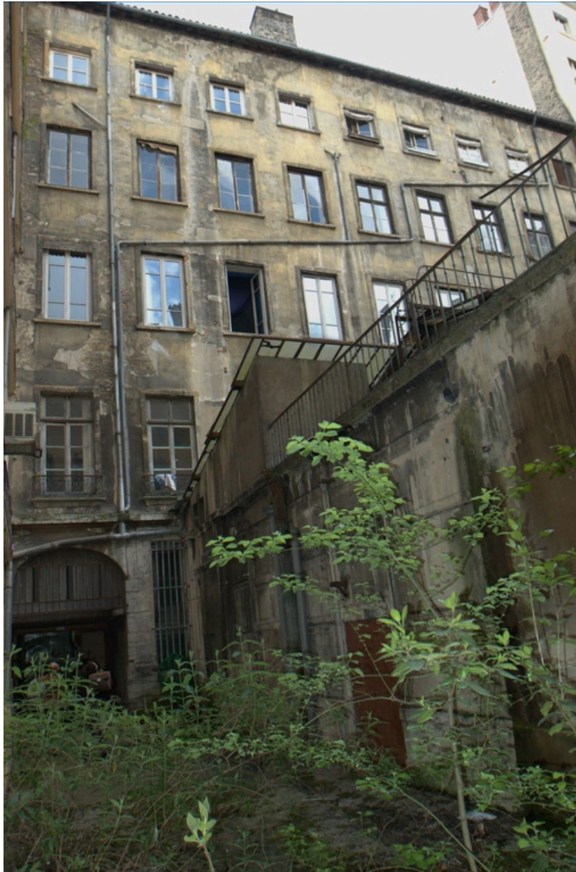
Vue d'ensemble est