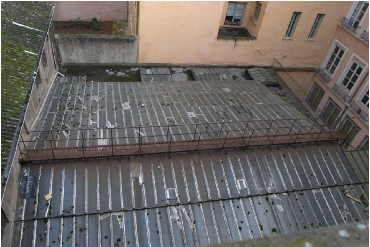
Vue de la verrière