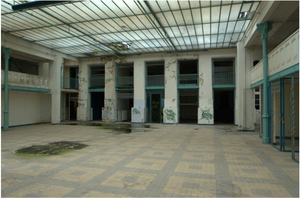
Vue d'ensemble nord de la halle