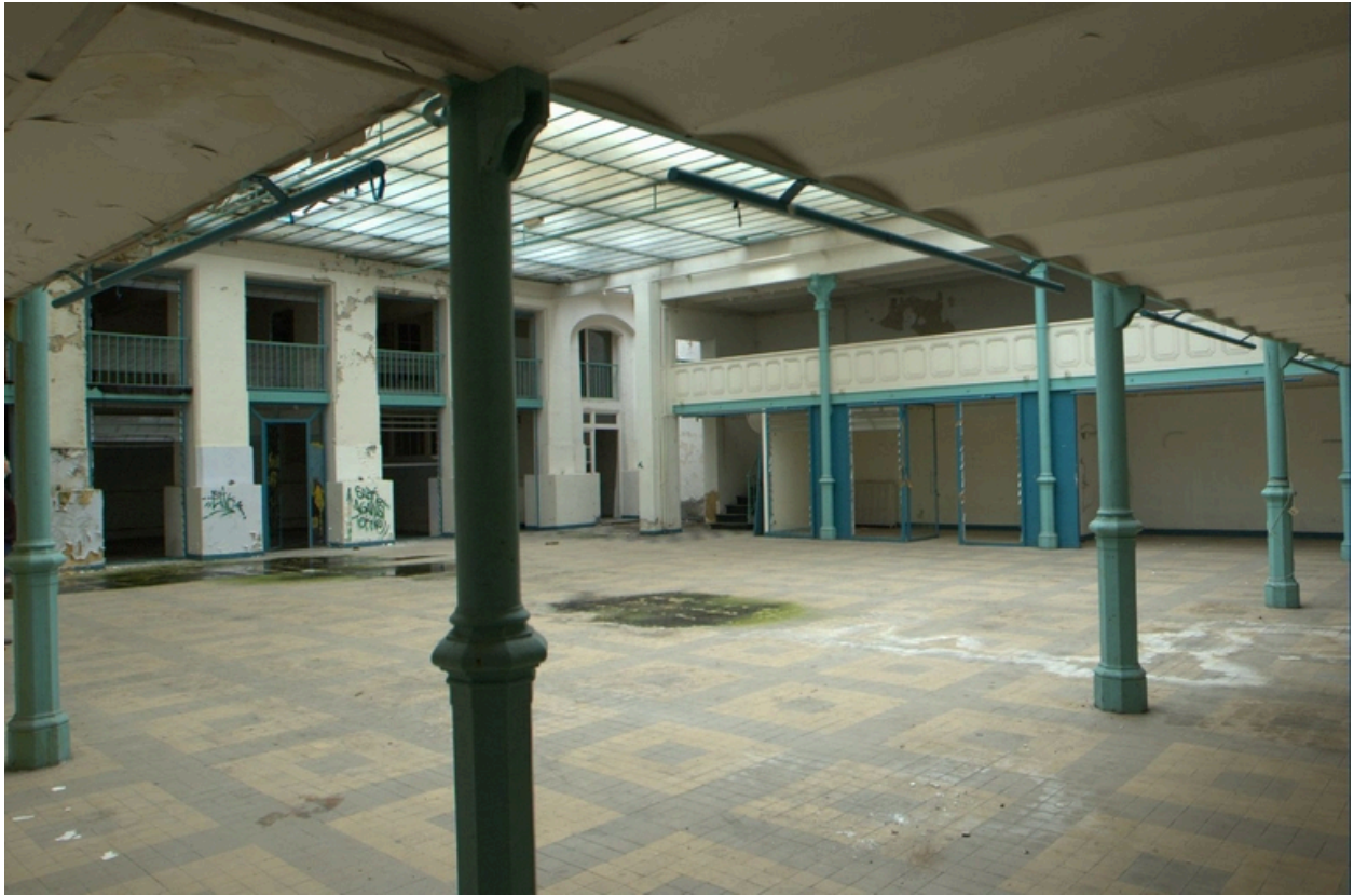
Vue d'ensemble de la halle couverte