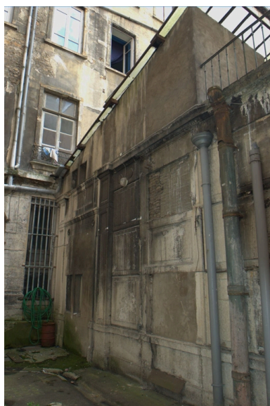
Vue est IVR82_20086900308NUCA