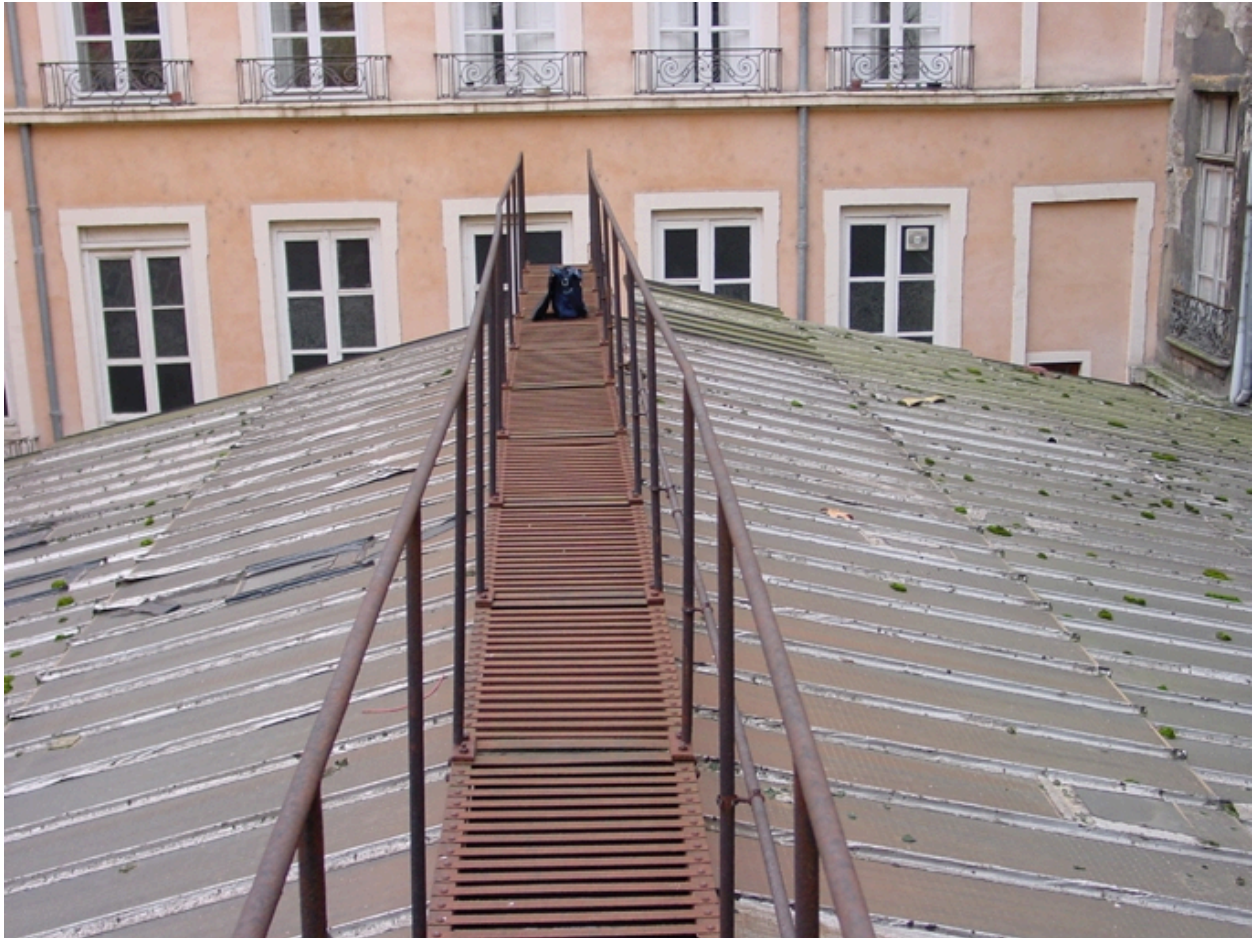
Passerelle de la verrière