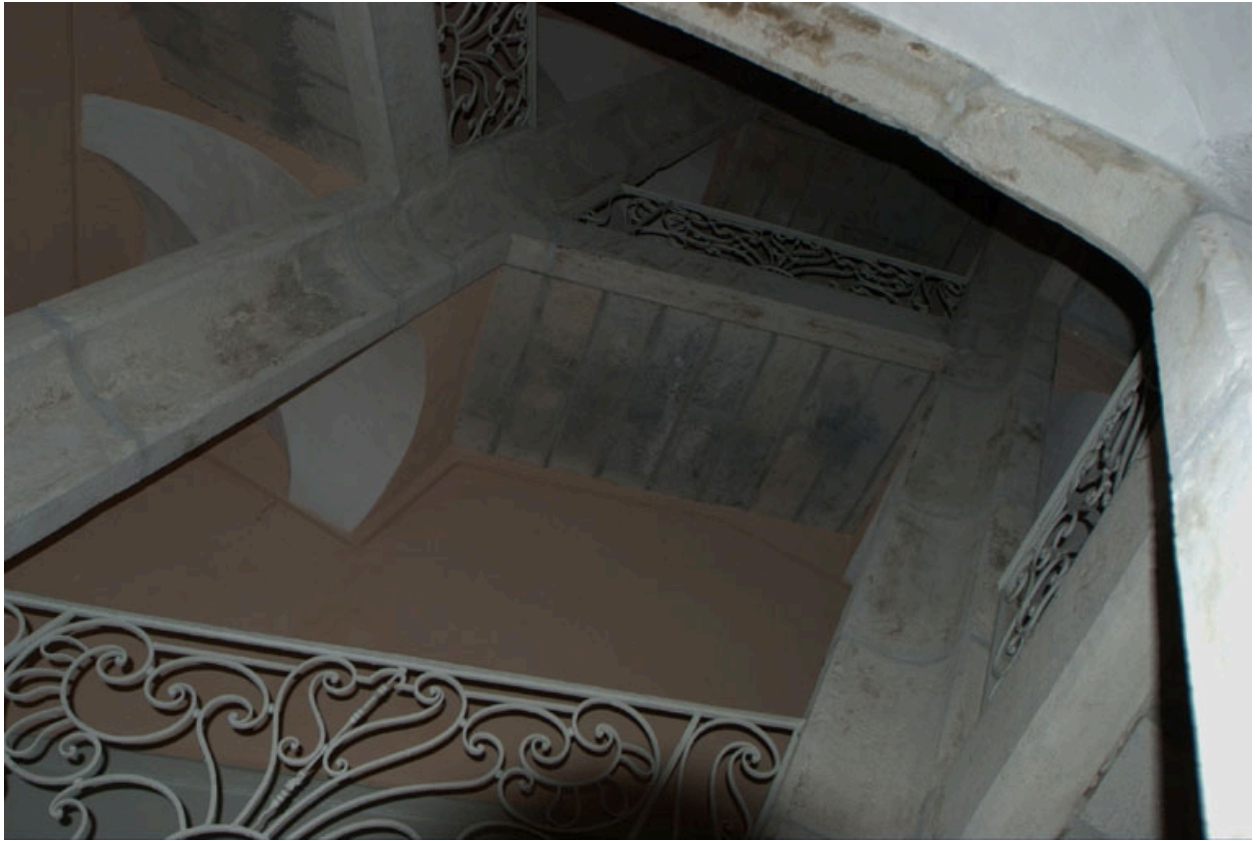
Détail escalier de l'immeuble de la rue Sainte-Marie-des-Terreux