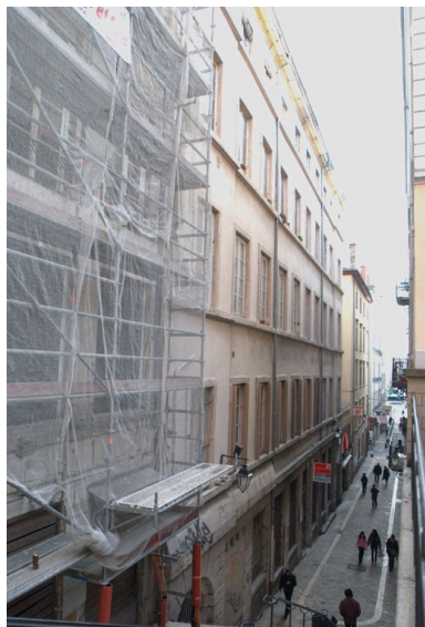
Immeuble de la rue Sainte-Marie-des-Terreux IVR82_20086900219NUCA