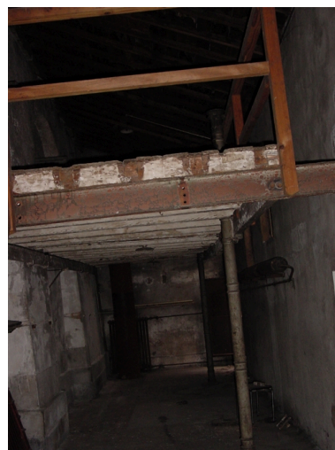
vue du sous-sol

IVR82_20086900341NUCA