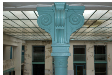
Détail chapiteau formé de 4 consoles cannelées

IVR82_20086900303NUCA