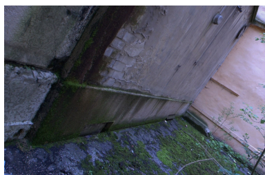
Détail ouest soupiraux IVR82_20086900311NUCA