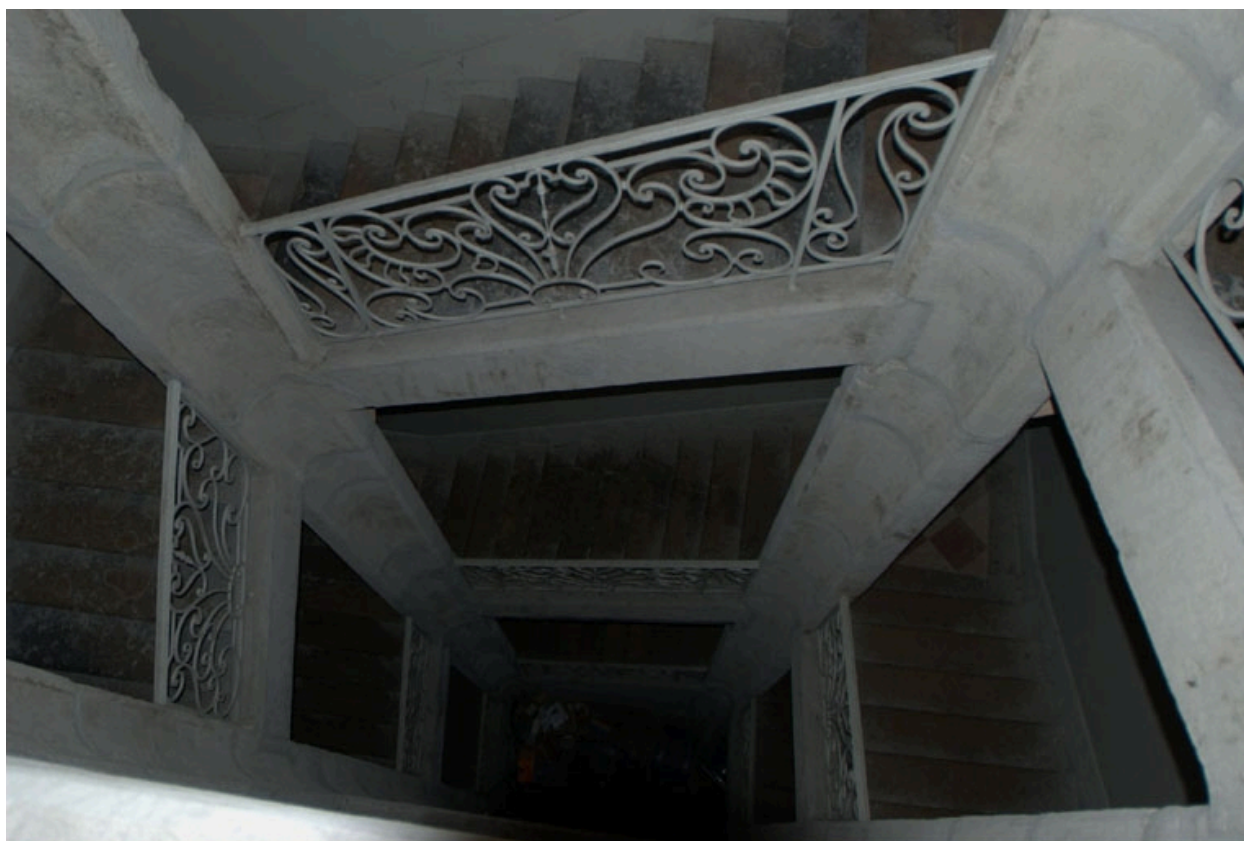
Escalier de l'immeuble XVIIIe