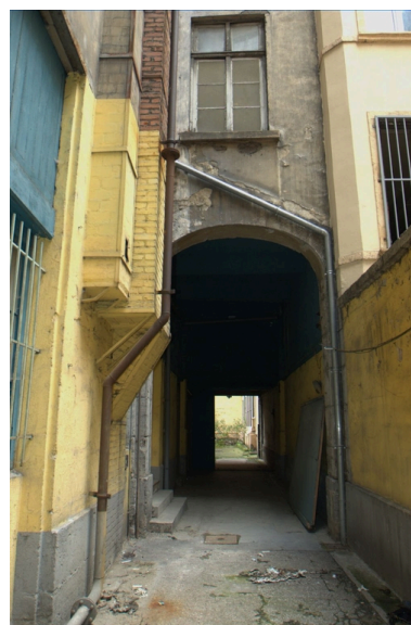
Vue ouest