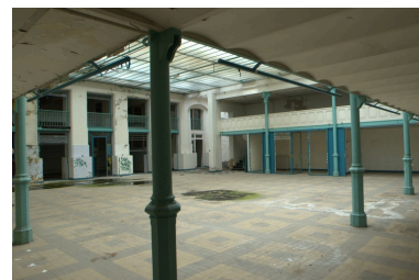
Vue d'ensemble de la halle couverte IVR82_20086900282NUCA