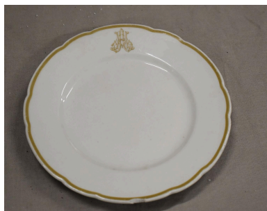
Vue générale IVR84_20226302690NUC4A