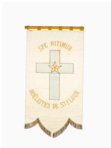
Vue du revers IVR84_20191500216NUC4A