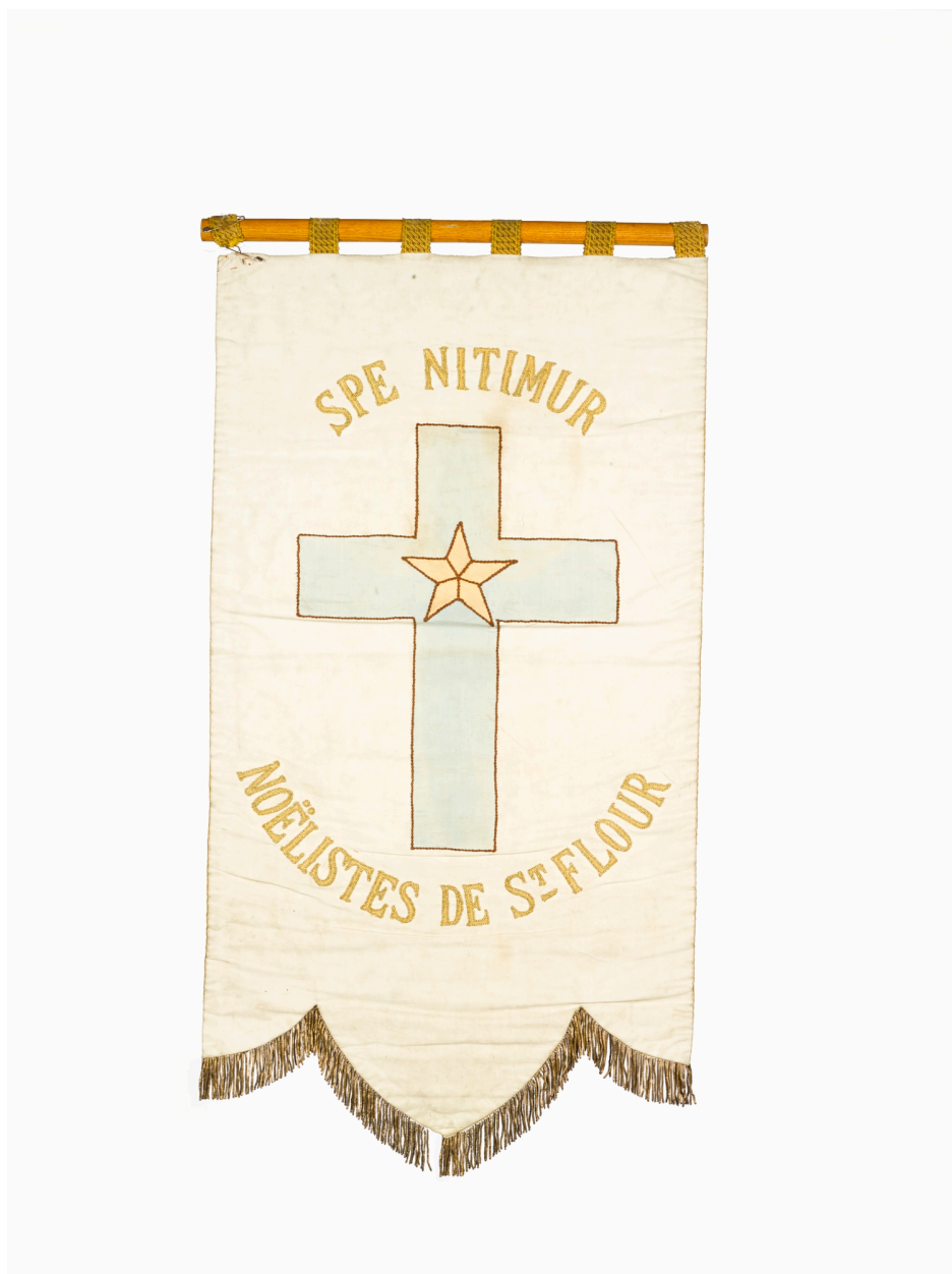
Vue du revers