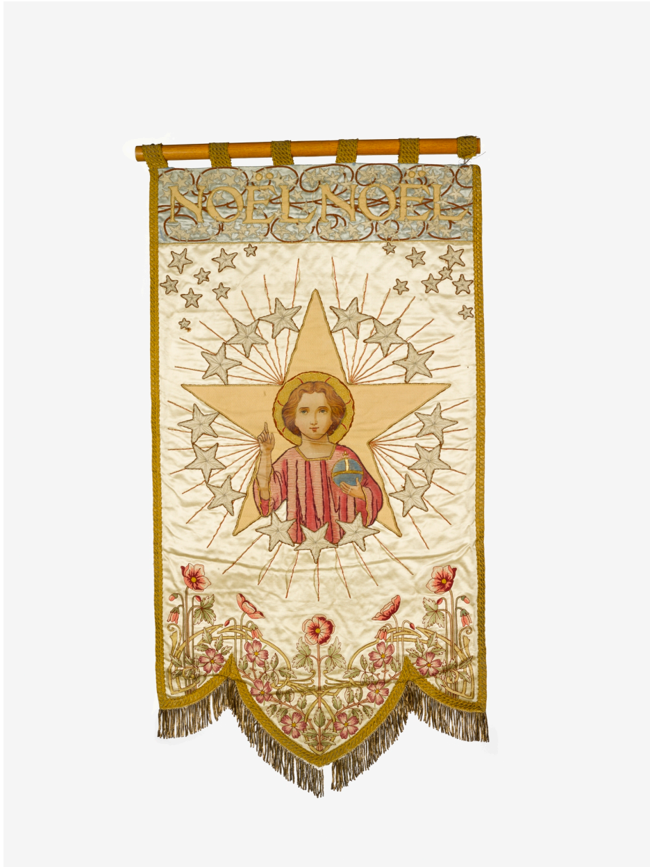
Vue de l'avant