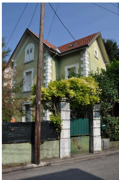
Façade principale IVR82_20137300761NUCA