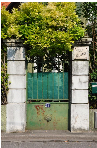
Portail piéton d'entrée IVR82_20137300763NUCA