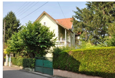
Vue d'ensemble depuis l'arrière IVR82_20137300760NUCA