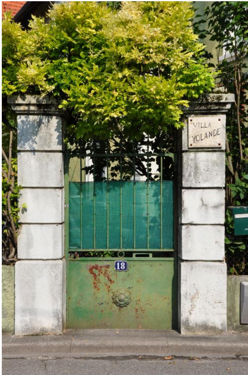
Portail piéton d'entrée