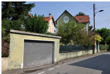
Vue d'ensemble IVR82_20137300762NUCA