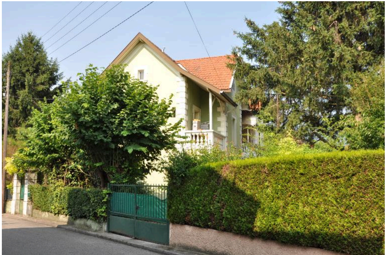
Vue d'ensemble depuis l'arrière