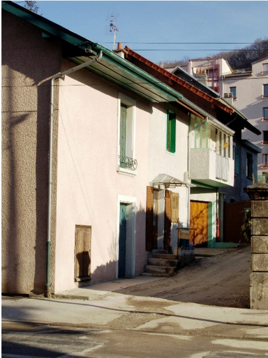
Façade sur cour