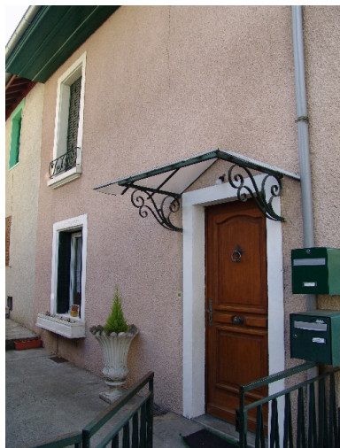
Elévation nord