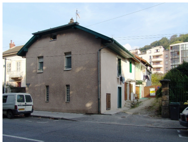
Vue générale IVR82_20077300737NUCA