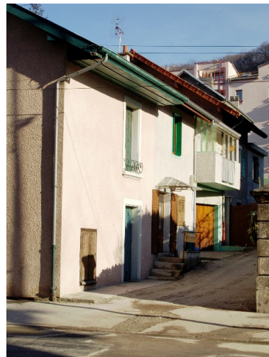
Façade sur cour IVR82_20087300083NUCA