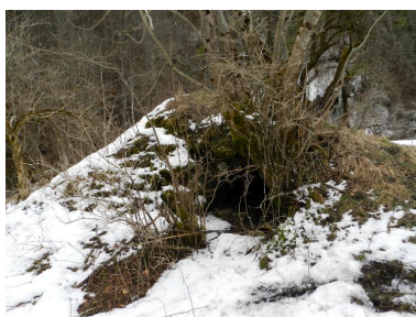
Vestiges de ce qui pourrait être un élément du haut-fourneau.