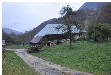
Vue du bâtiment dit "le martinet".