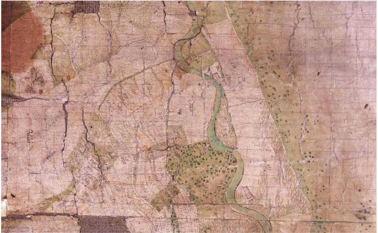
Cadastre de 1728, Aillon, 1733 159, Vue 6 (FR.AD073, C1883).