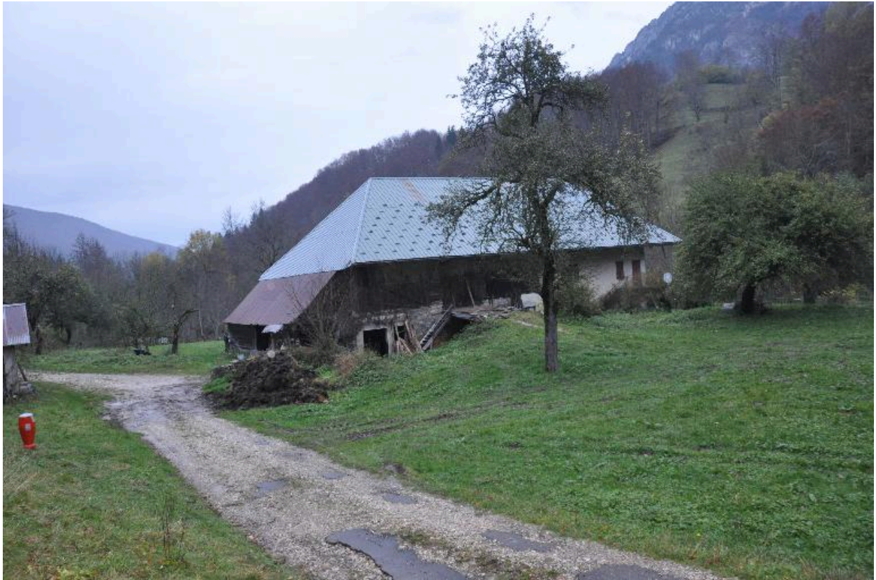
Vue du bâtiment dit "le martinet".