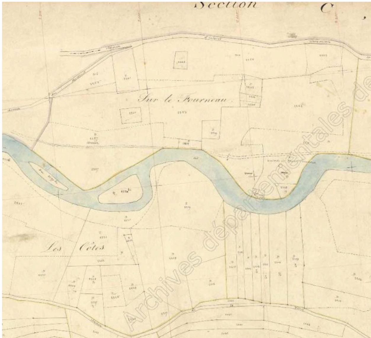
Premier cadastre français, Aillon-le-Vieux, 1878 Section A, feuille 9 (FR.AD073, 3P 7005).