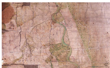
Cadastre de 1728, Aillon, 1733 159, Vue 6 (FR.AD073, C1883). IVR82_20137301898NUCA