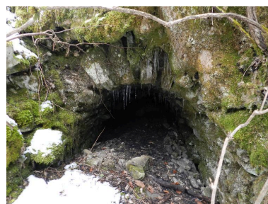
Vestiges de ce qui pourrait être un élément du haut-fourneau. IVR82_20137302788NUCA