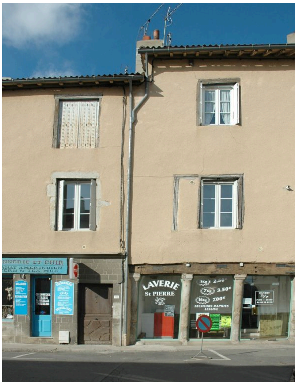
Vue générale de l'élévation donnant sur la place.