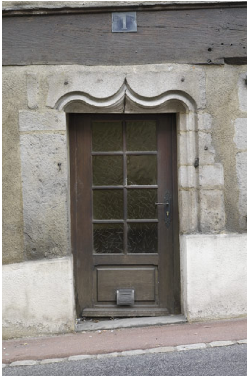
Porte piétonne avec linteau en accolade, 1 rue Saint-Pierre.