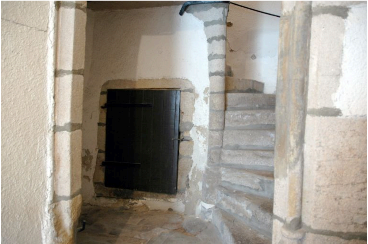
Puits dans le mur-noyau de l'escalier en vis.