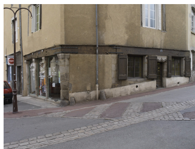
Vue de trois-quarts du rez-de-chaussée soutenu par une poutre sablière.