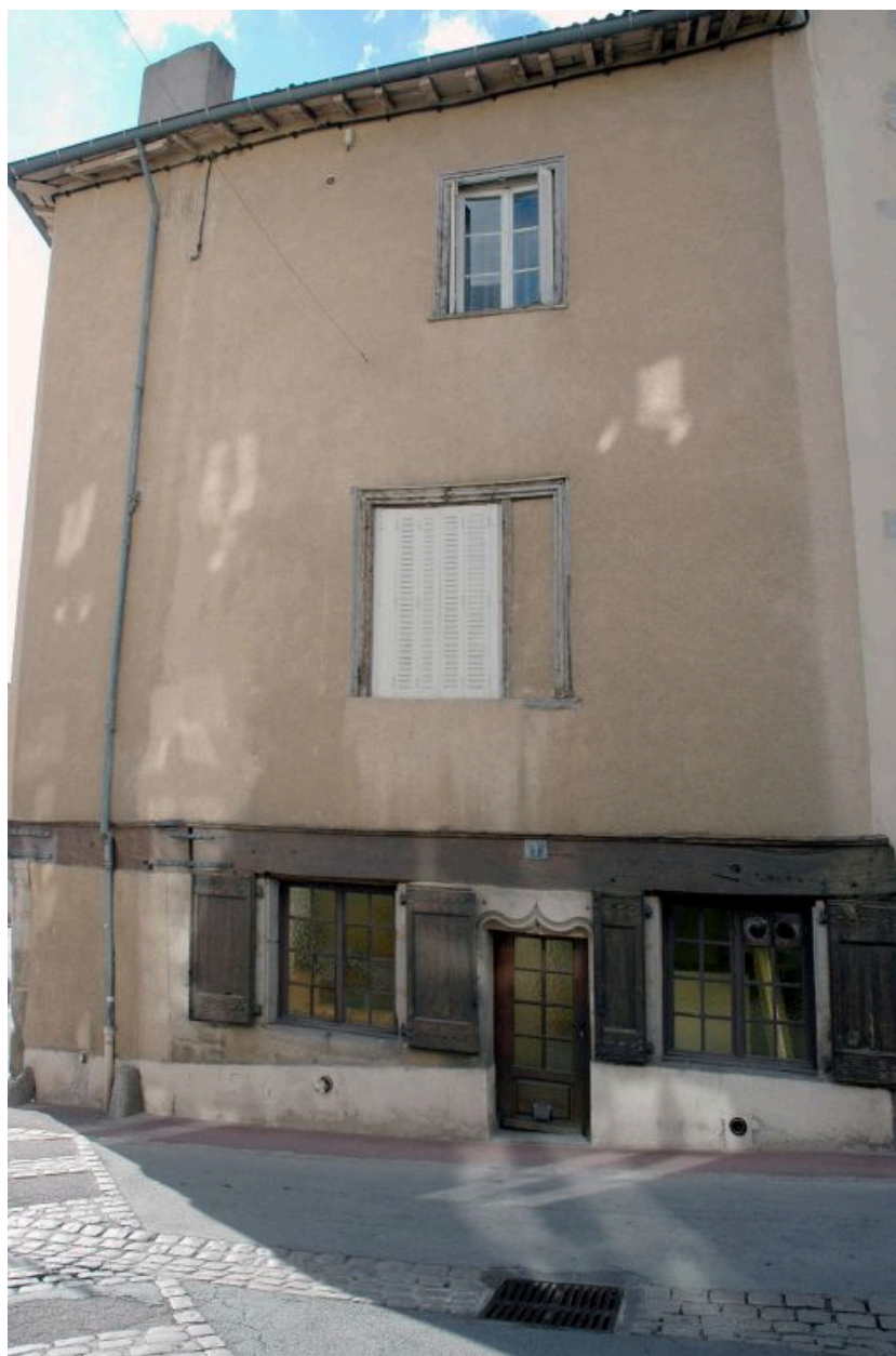
Vue générale de l'élévation donnant sur la rue.