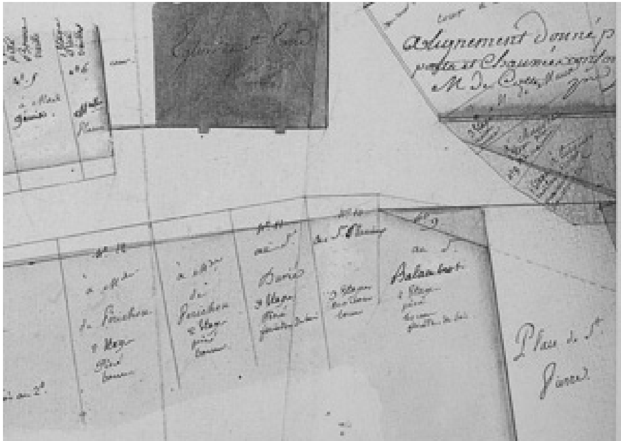
Traversée de Montbrison en 1780, détail. plan de 1780 B Diana Montbrison. C géo 143 F