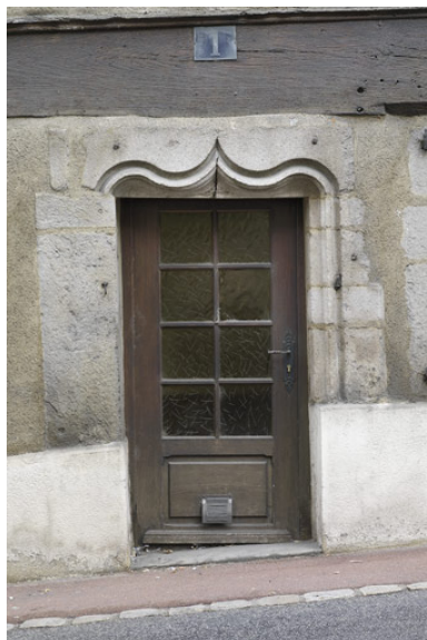
Porte piétonne avec linteau en accolade, 1 rue Saint-Pierre. IVR82_20074201284NUCA