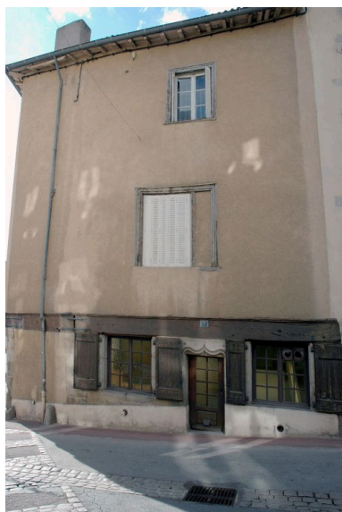
Vue générale de l'élévation donnant sur la rue.