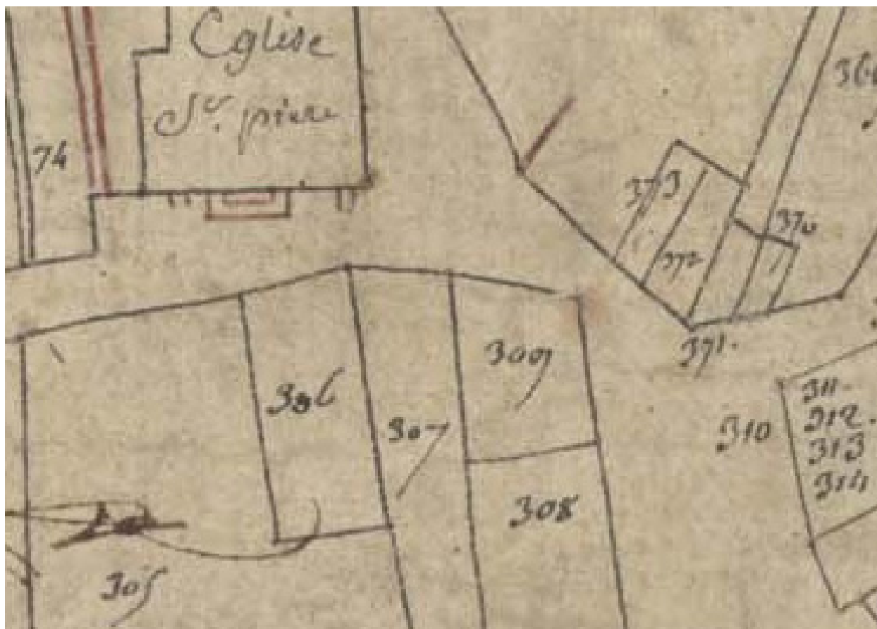
Extrait du plan parcellaire de 1809, parcelle E 309.