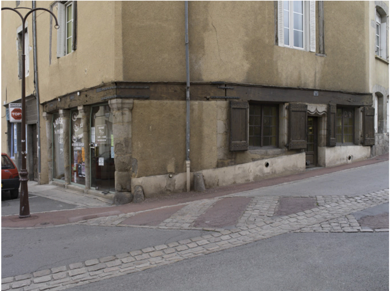
Vue de trois-quarts du rez-de-chaussée soutenu par une poutre sablière.