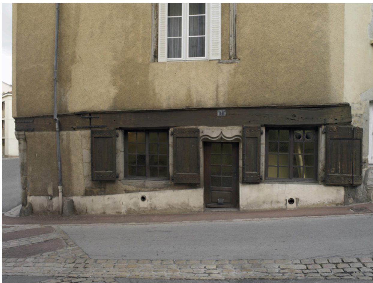
Vue du rez-de-chaussée du côté de la place Saint-Pierre.