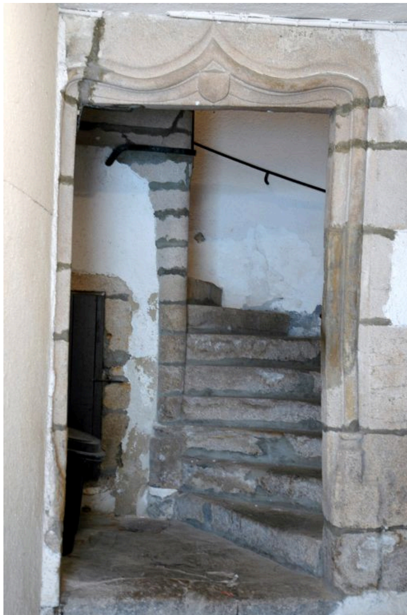
Départ de l'escalier en vis, place Saint-Pierre.