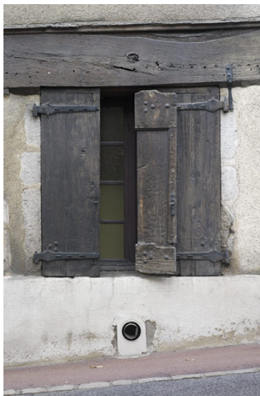
Rez-de-chaussée : la poutre sablière sert de linteau de fenêtre.