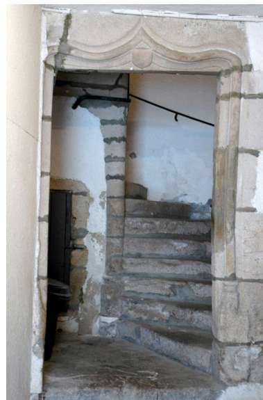
Départ de l'escalier en vis, place Saint-Pierre.