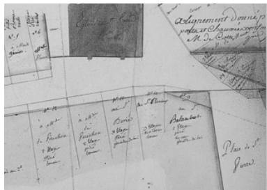
Traversée de Montbrison en 1780, détail. plan de 1780 B Diana Montbrison. C géo 143 F IVR82_20114200616NUC