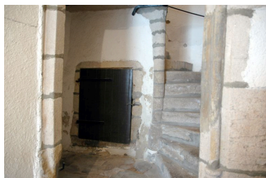
Puits dans le mur- noyau de l'escalier en vis.