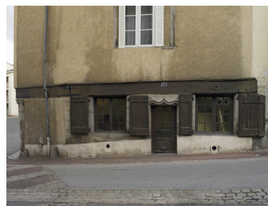
Vue du rez-de-chaussée du côté de la place Saint-Pierre. IVR82_20084200617NUCA