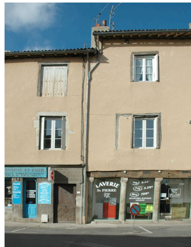
Vue générale de l'élévation donnant sur la place. IVR82_20114200611NUCA