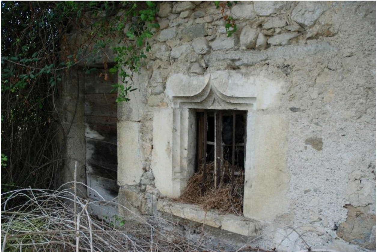
Détail des ouvertures du logis.