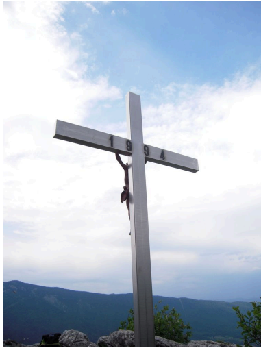
Vue de l'arrière de la croix avec date portée.