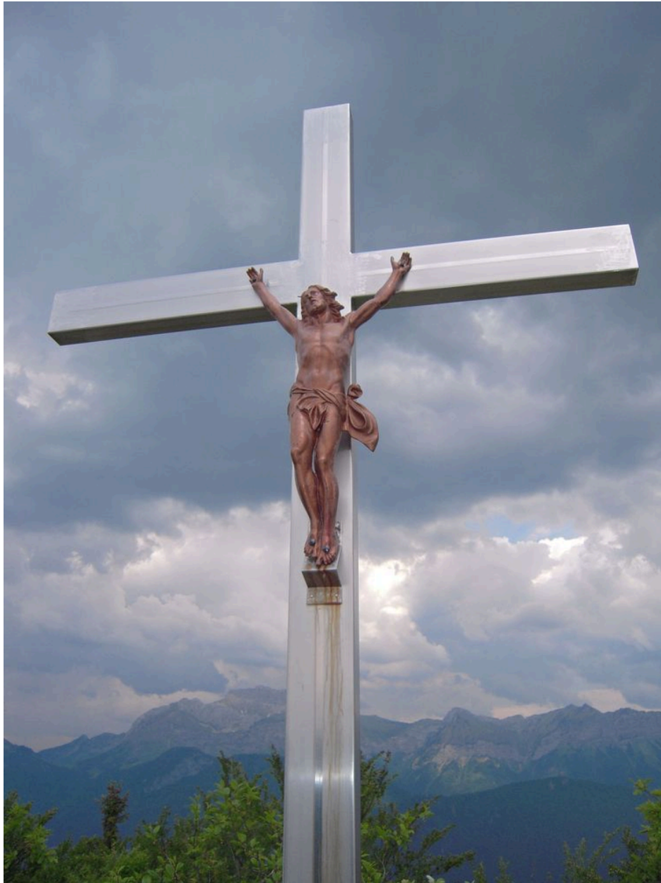
Vue de face sur arrière plan orageux.