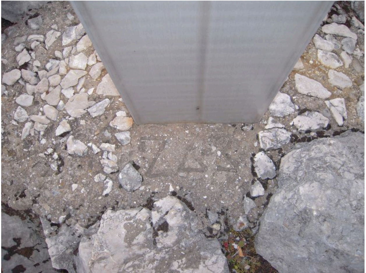
Vue de l'ancrage de la croix.