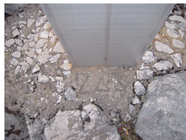
Vue de l'ancrage de la croix.