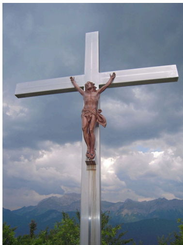
Vue de face sur arrière plan orageux. IVR82_20117400785NUCA