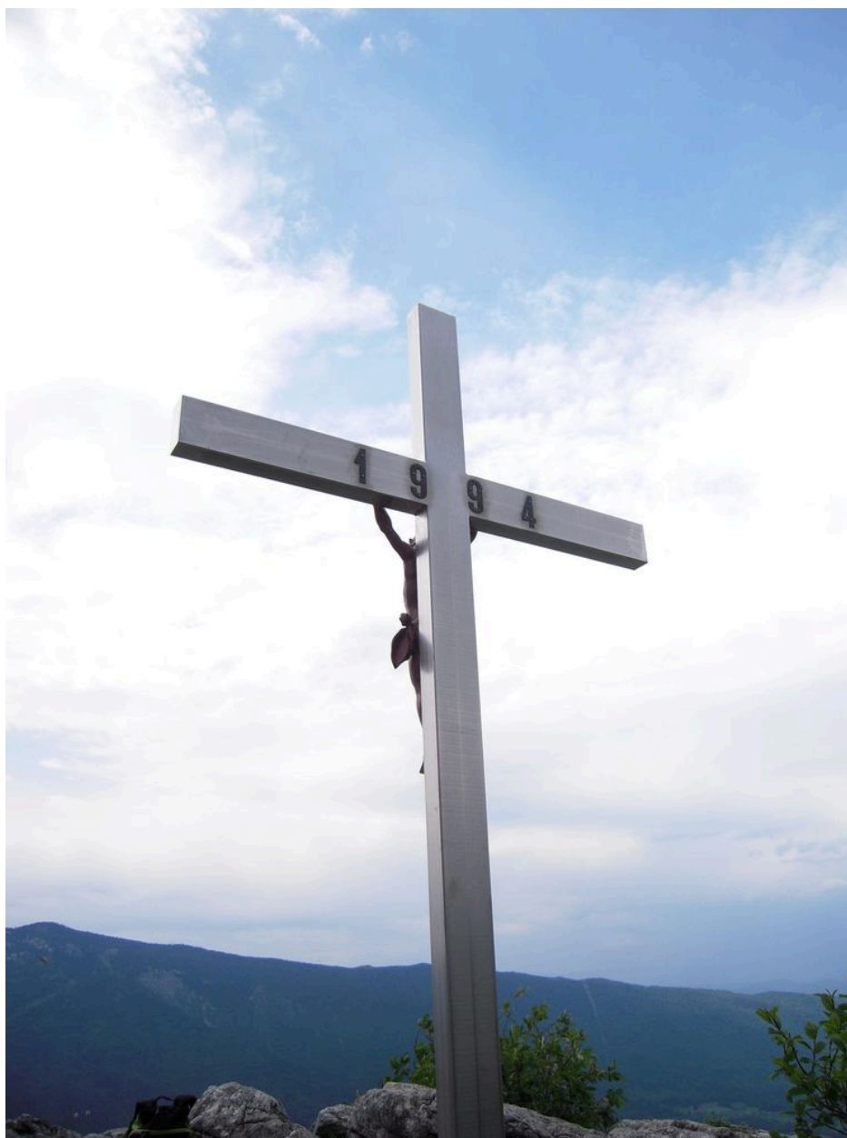
Vue de l'arrière de la croix avec date portée.