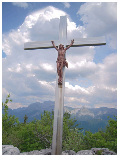
Vue générale. IVR82_20117400780NUCA