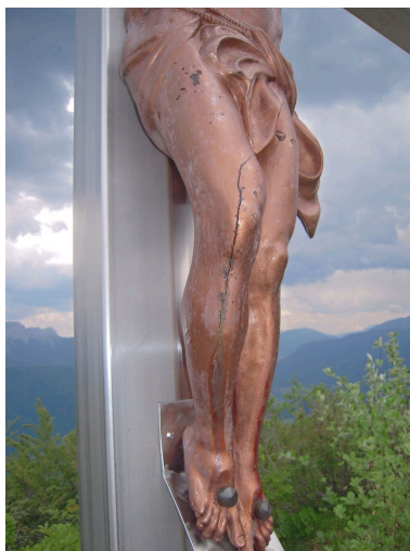
Détail des jambes du Christ.