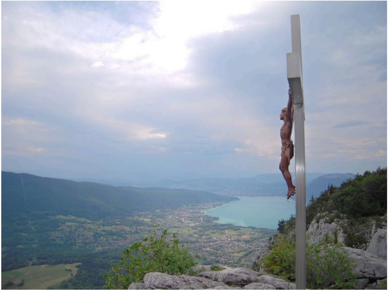
Vue de côté avec le lac d'Annecy et la vallée du Laudon dessous.