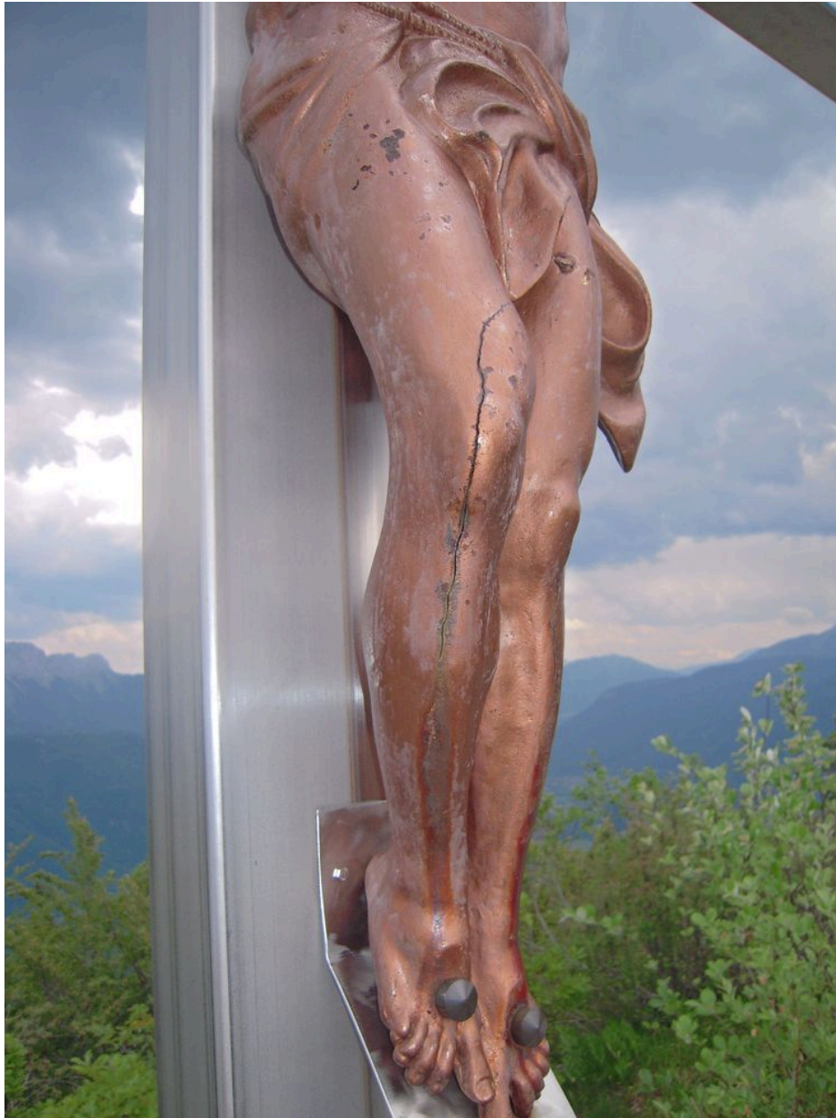
Détail des jambes du Christ.