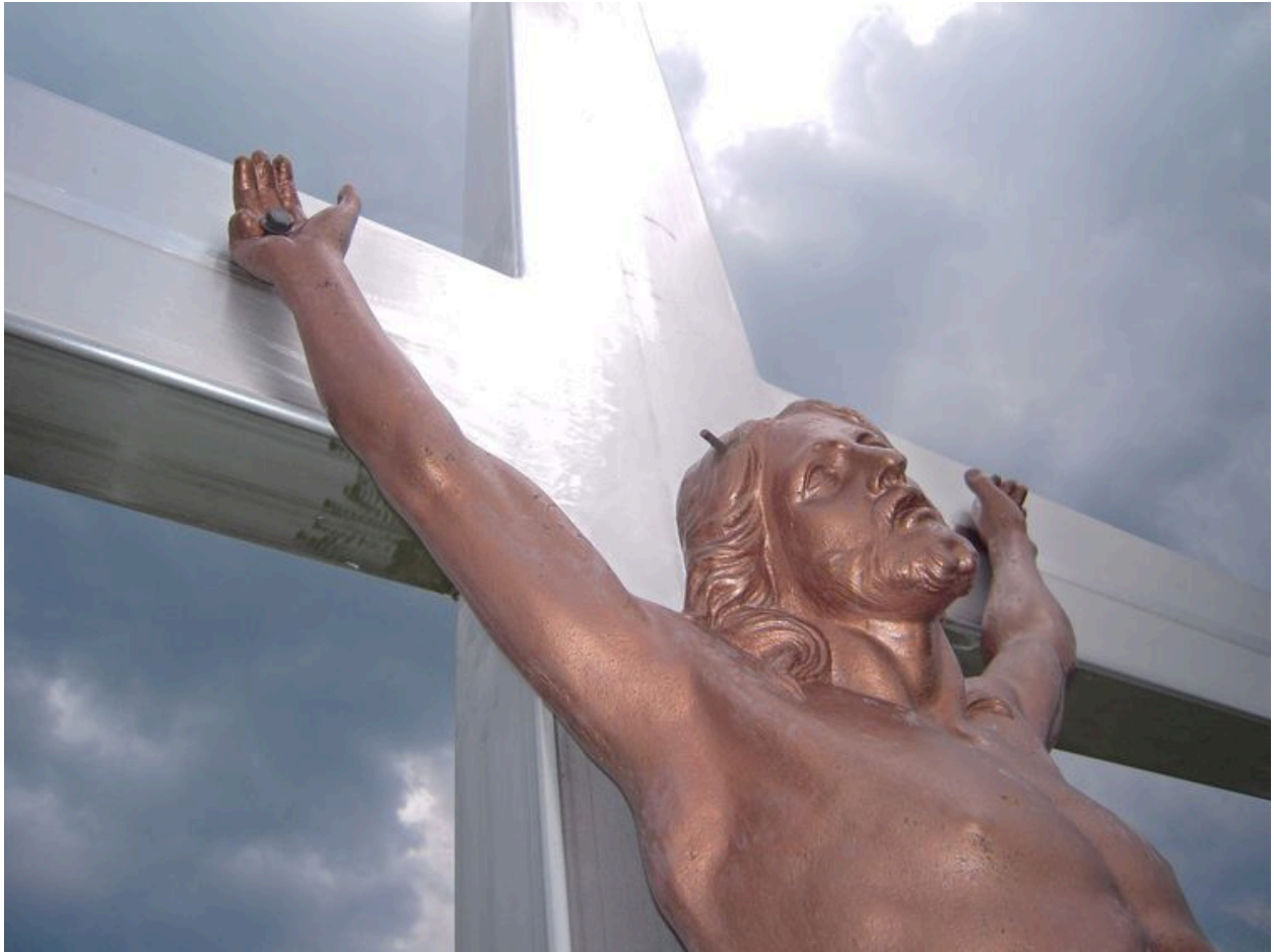
Détail du christ sur la croix.