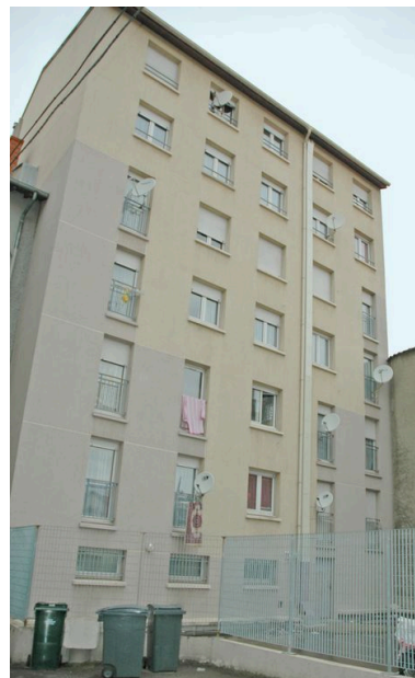
Façade est vue depuis la cour située au sud IVR82_20066901303NUCA