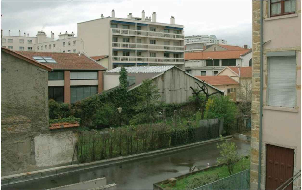
Emprise au sol des garages souterrains et espace vert derrière l'immeuble, vue depuis le sud-ouest