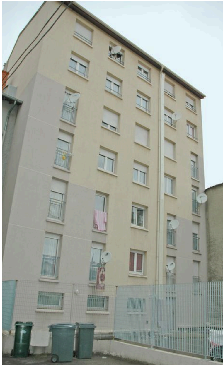
Façade est vue depuis la cour située au sud