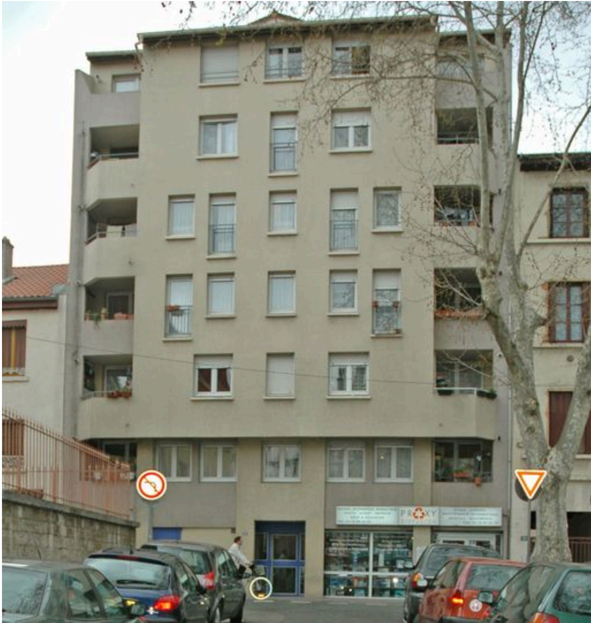
Façade ouest sur rue