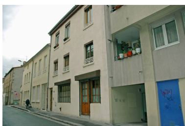
Accès à la rampe descendant au garage vue depuis le sud-ouest IVR82_20066901305NUCA