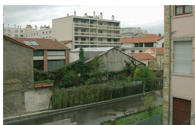
Emprise au sol des garages souterrains et espace vert derrière l'immeuble, vue depuis le sud-ouest IVR82_20066901304NUCA