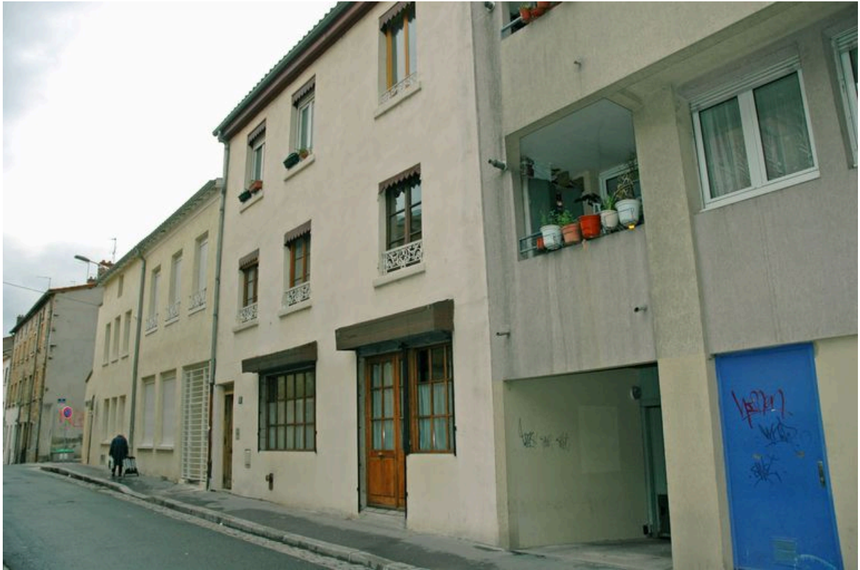
Accès à la rampe descendant au garage vue depuis le sud-ouest