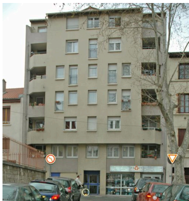
Façade ouest sur rue IVR82_20066901302NUCA