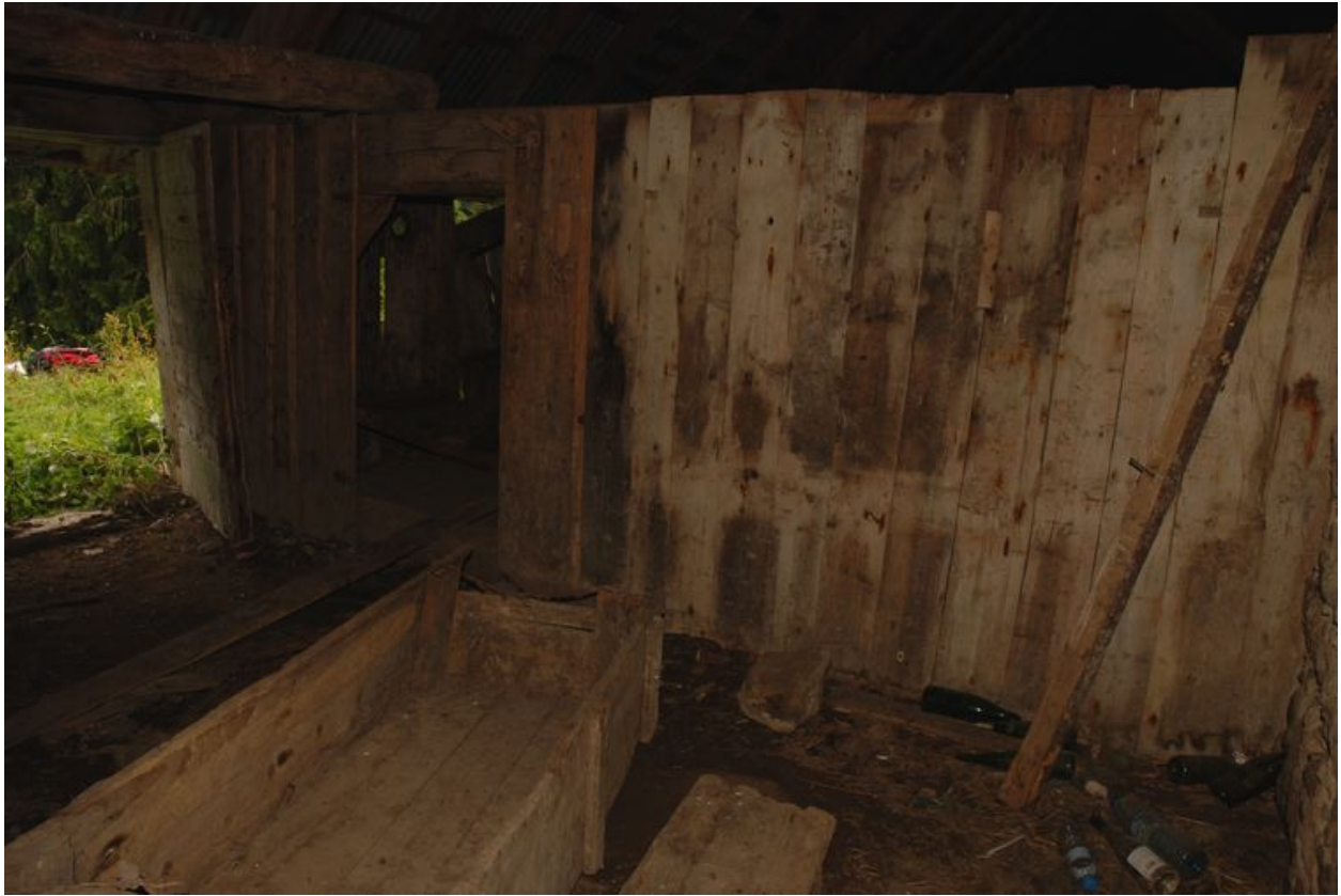
Vue du passage entre la partie habitation et la partie étable.