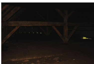
Vue d'ensemble de l'étable.