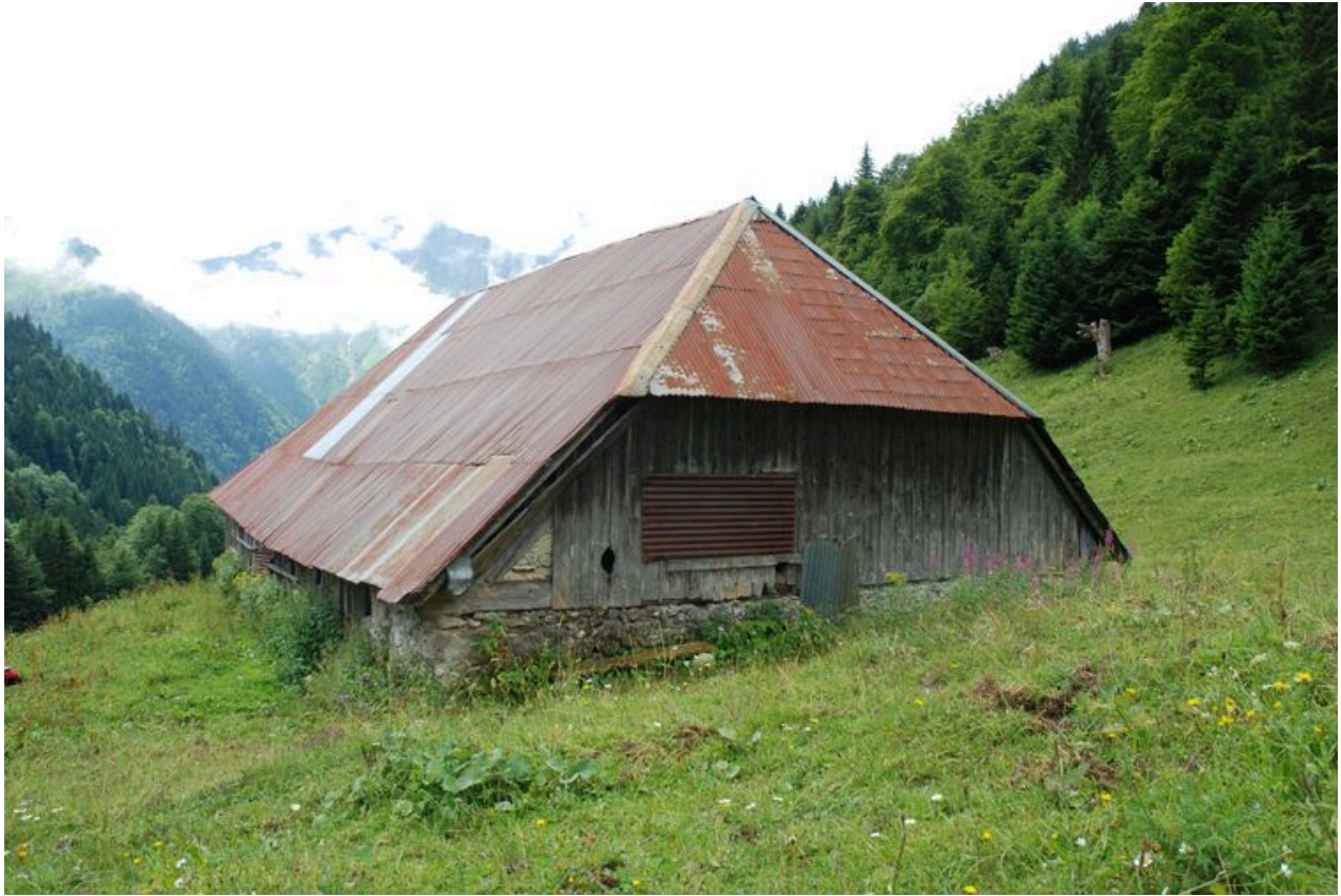
Vue du mur pignon nord derrière lequel se trouve la cave et l'ancien logis.