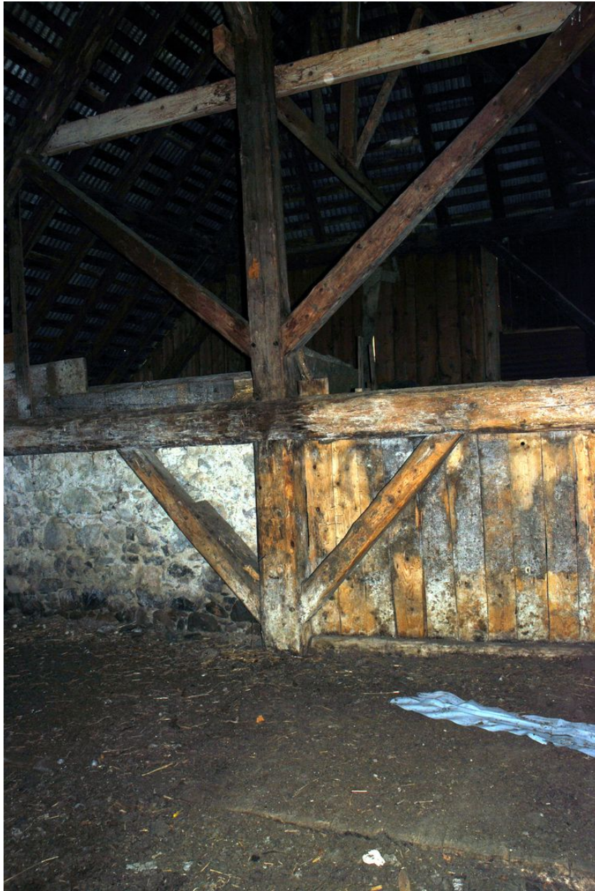
Vue des cloisons séparant la cave et le logis de l'étable.