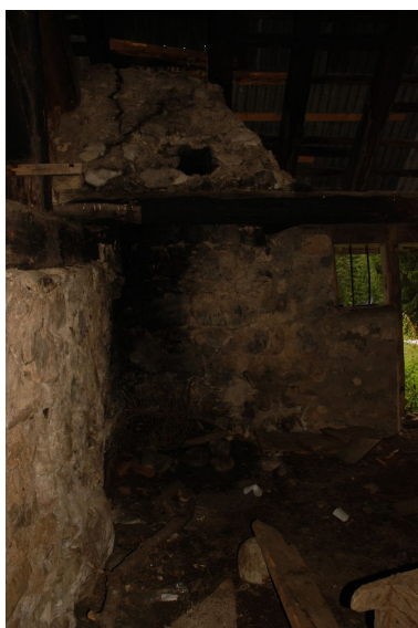
vue des restes de la cheminée à l'intérieur. IVR82_20107304205NUCA