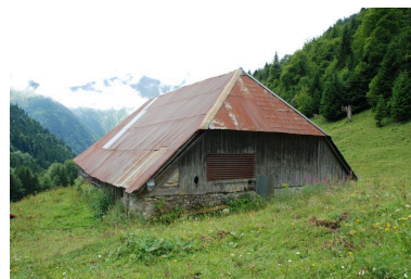
Vue du mur pignon nord derrière lequel se trouve la cave et l'ancien logis. IVR82_20107304202NUCA