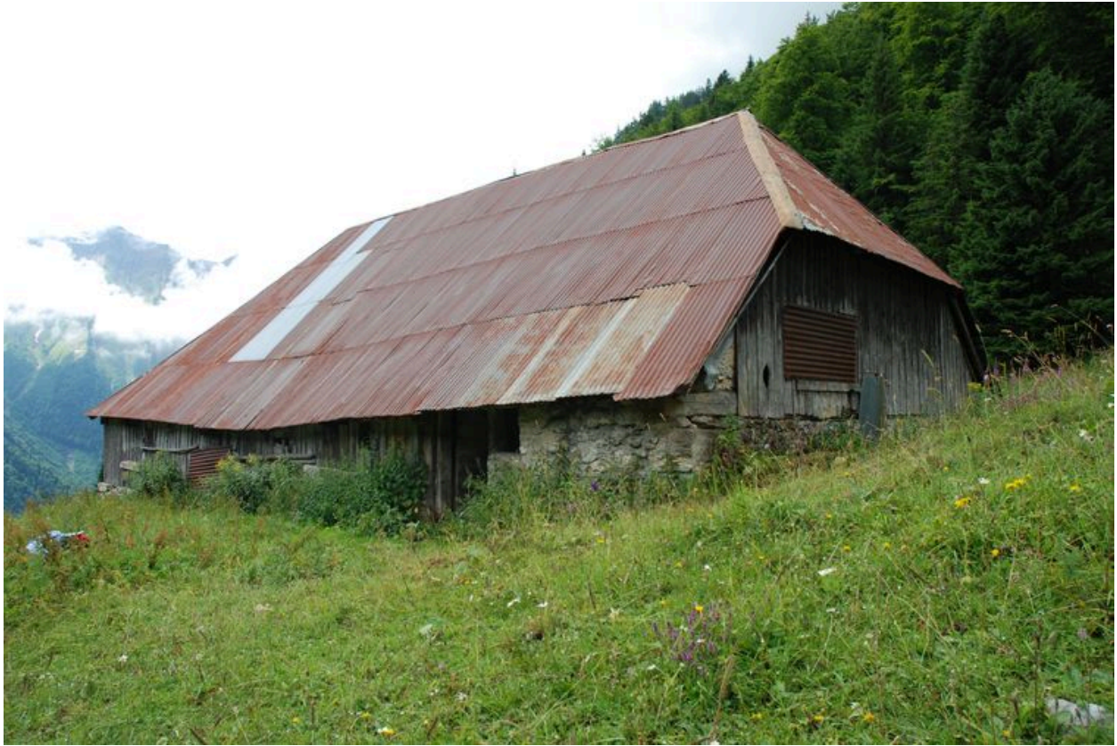
Vue générale du bâtiment.