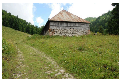
Vue du mur pignon sud.