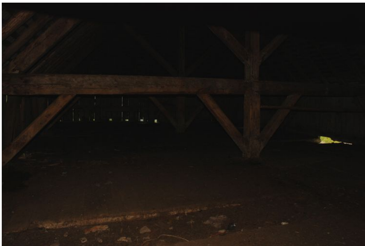
Vue d'ensemble de l'étable.