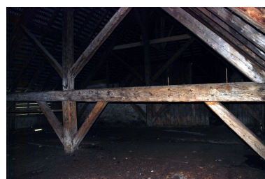
Vue de la charpente entre les allées de l'étable.