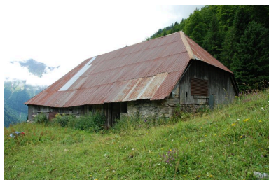
Vue générale du bâtiment.