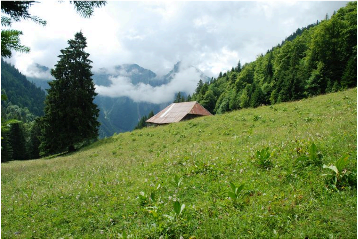
Vue de l'étable dans son environnement.