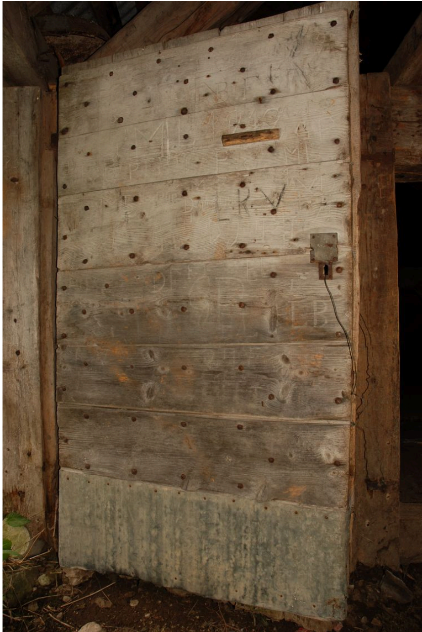
Vue de la porte d'entrée de la partie logis.