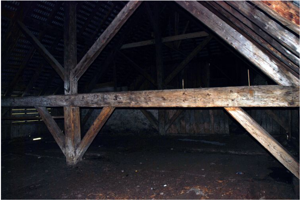
Vue de la charpente entre les allées de l'étable.