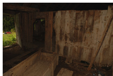
Vue du passage entre la partie habitation et la partie étable. IVR82_20107304206NUCA