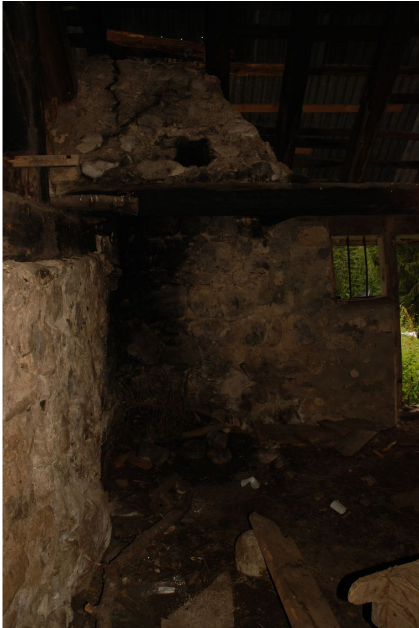
vue des restes de la cheminée à l'intérieur.