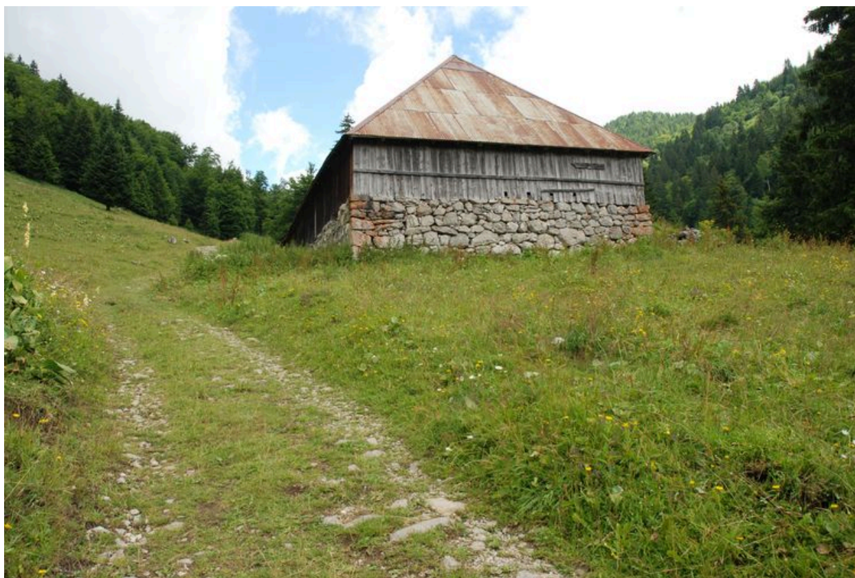
Vue du mur pignon sud.