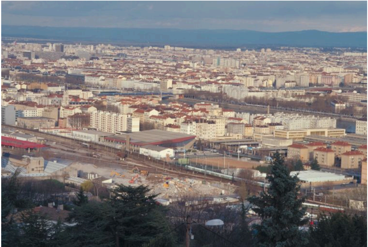
Vue générale depuis la place J.-D. Trait, à Sainte-Foy-les-Lyon