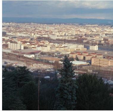
Vue depuis la place J.-D. Trait, à Sainte-Foy-les-Lyon, à l'est