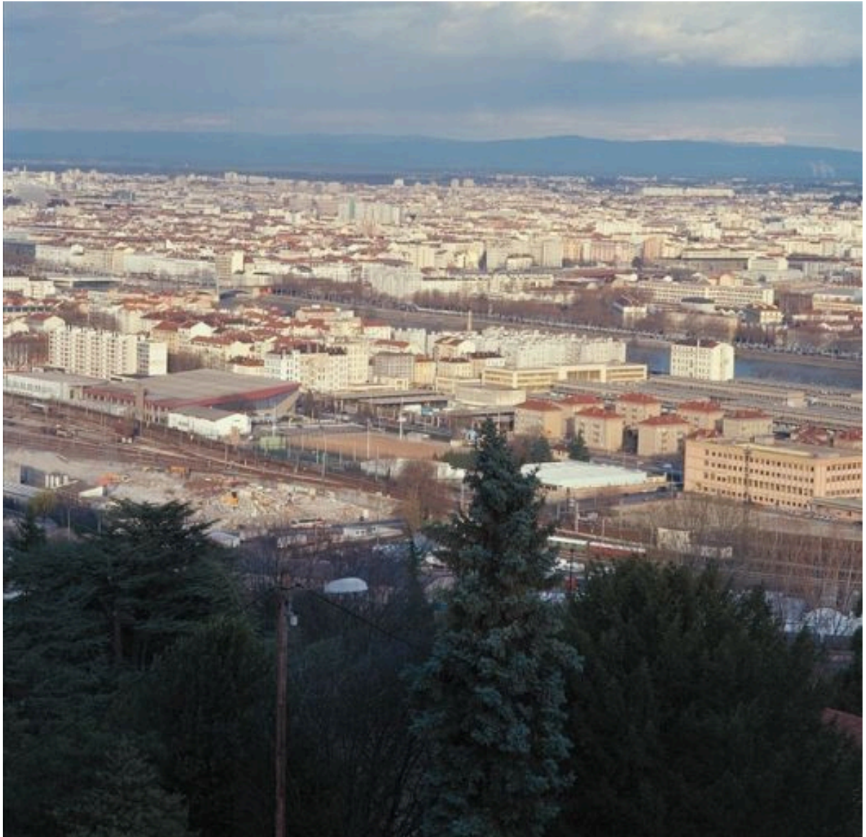
Vue depuis la place J.-D. Trait, à Sainte-Foy-les-Lyon, à l'est