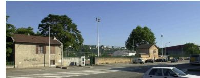
Vue générale IVR82_20016901843NUCA