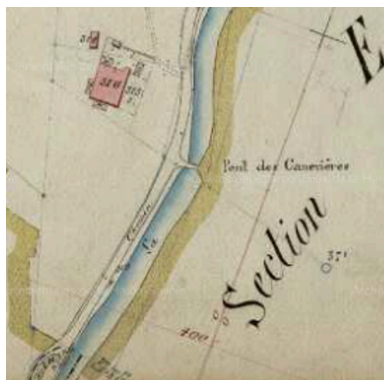
Extrait de la section E Feuille n°2 du cadastre d'Abondance. 1920. (AD Haute-Savoie. 3P3/2118. ) IVR84_20207401003NUCA