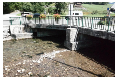
Pont des Canevières, vue de la face aval IVR84_20207401001NUCA