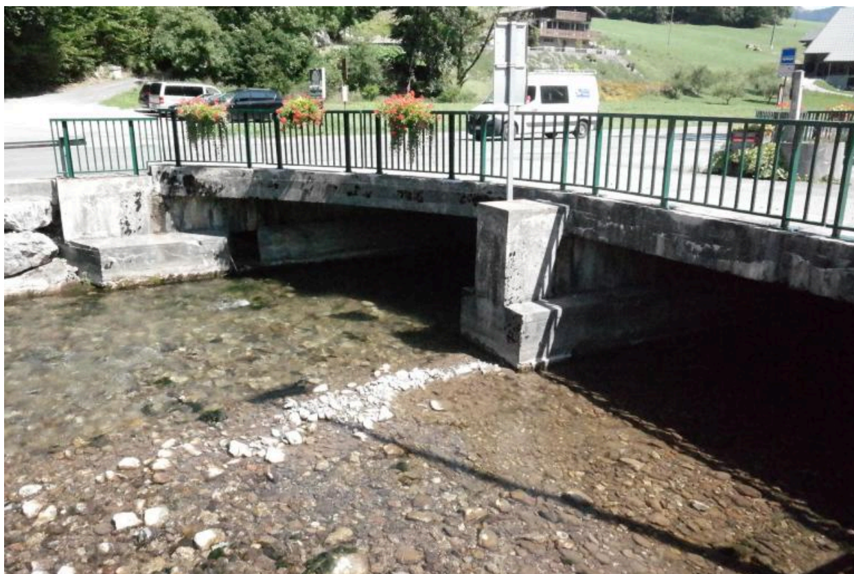
Pont des Canevières, vue de la face aval