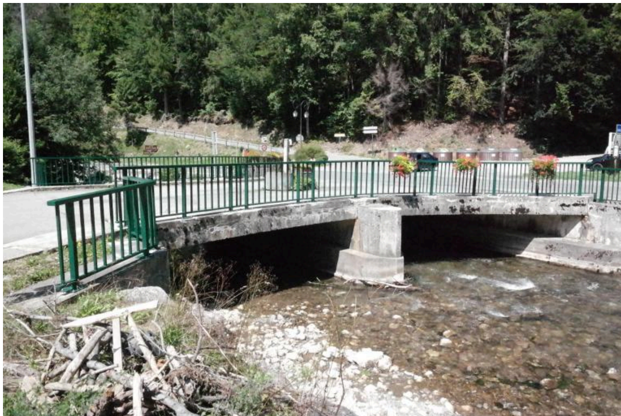
Vue générale du pont des Canevières