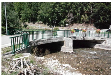
Vue générale du pont des Canevières IVR84_20197401205NUCA