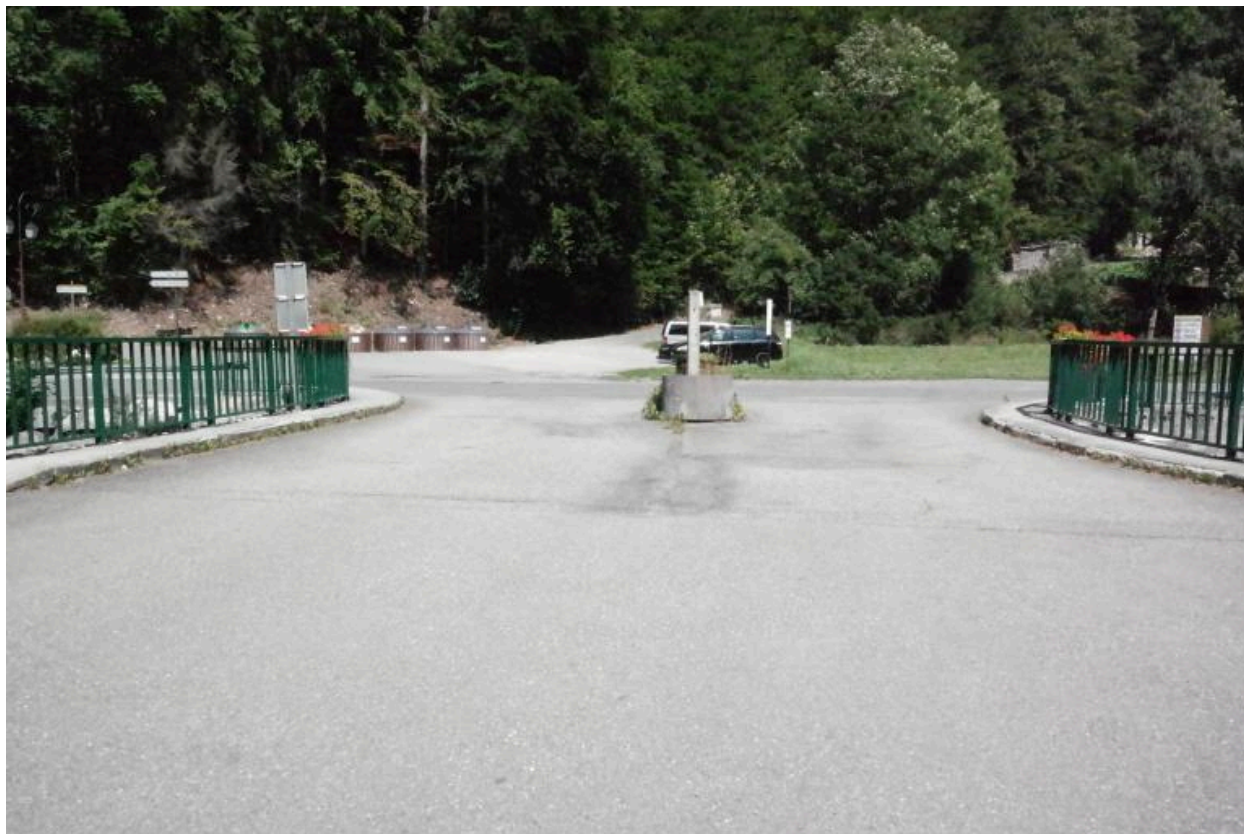
Pont des Canevières, vue de la largeur