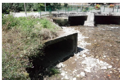
Pont des Canevières, vue sur face amont et sortie de canalisation