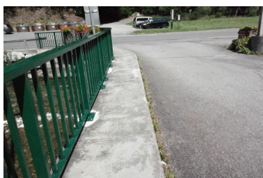
Pont des Canevières, vue de la chaussée et des rambardes IVR84_20207401004NUCA