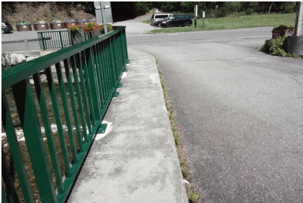
Pont des Canevières, vue de la chaussée et des rambardes