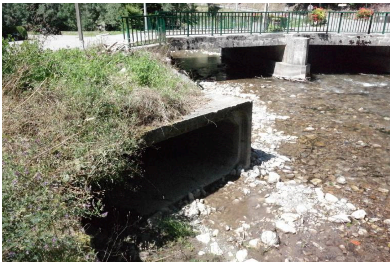
Pont des Canevières, vue sur face amont et sortie de canalisation