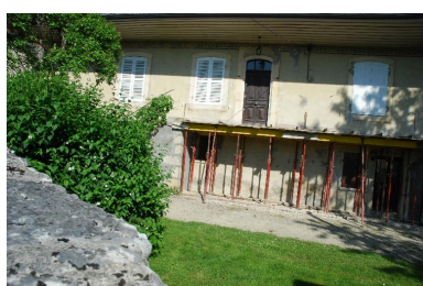
Vue partielle de la façade sur cour.

IVR82_20157302700NUCA