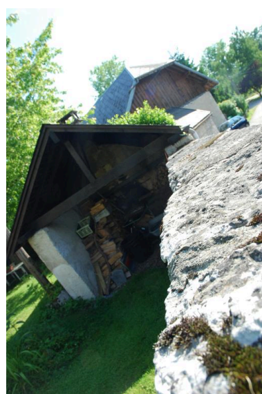
Vue partielle du four à pain.

IVR82_20157302704NUCA