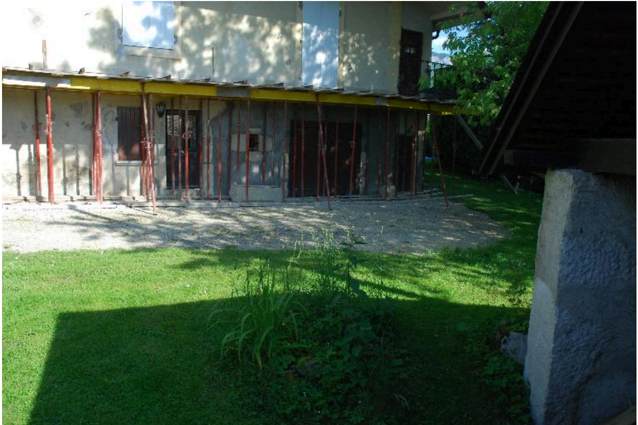
Vue partielle de la façade sur cour.