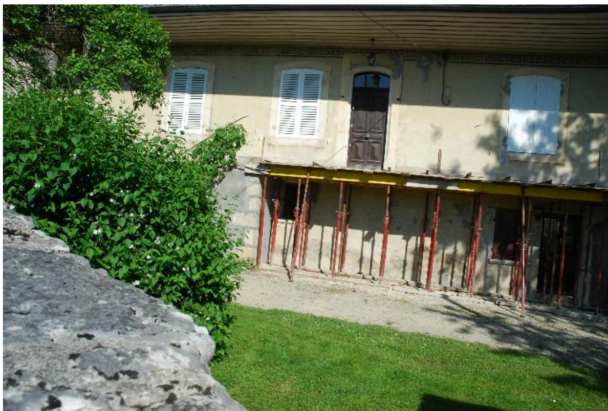
Vue partielle de la façade sur cour.