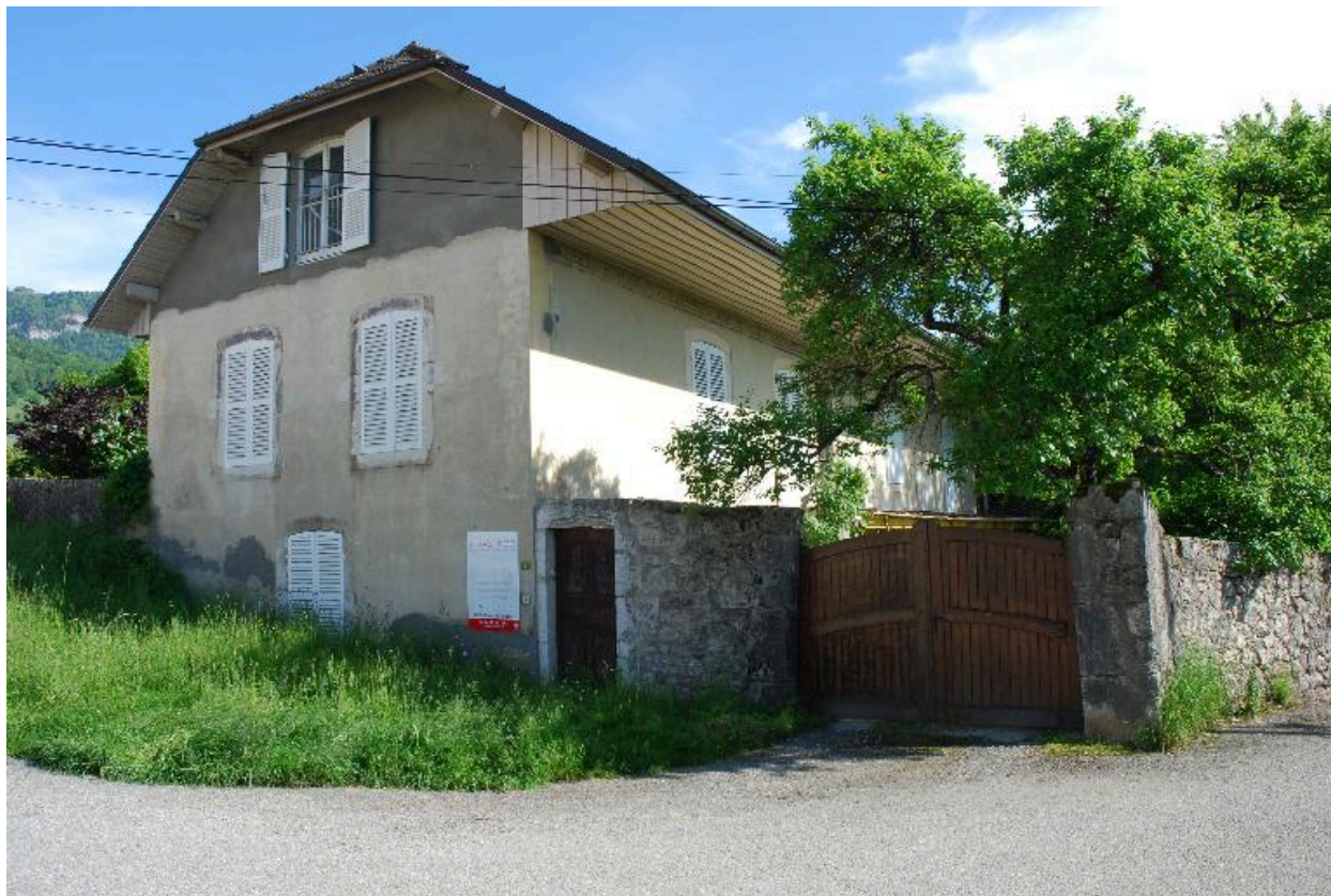
Vue d'ensemble de la maison de trois quart avant gauche depuis le chemin.