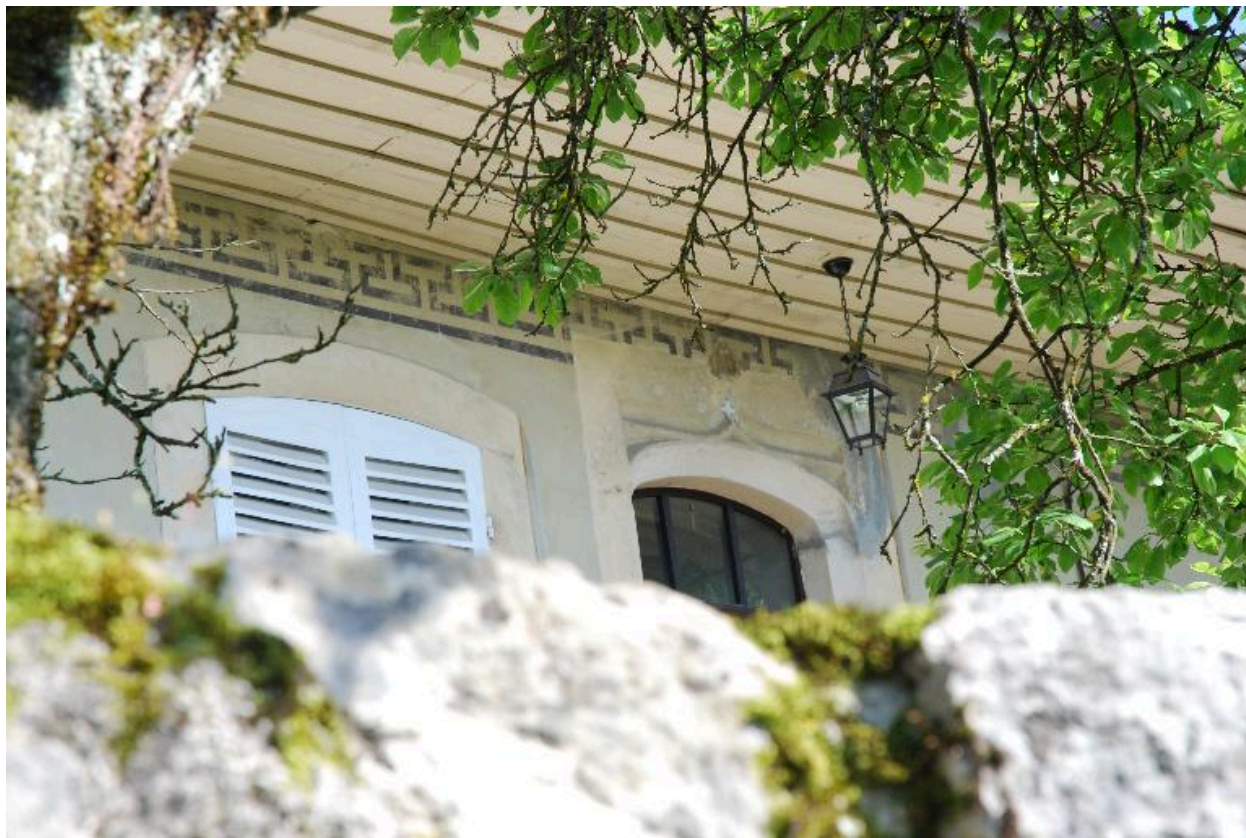
Détail de la porte d'entrée du logis située au rez-de-chaussée surélevé.