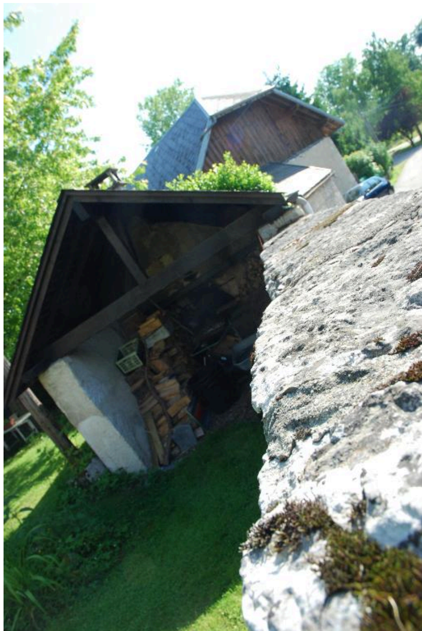
Vue partielle du four à pain.