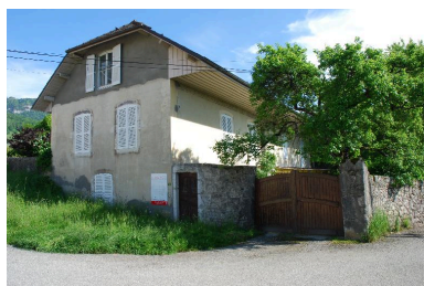
Vue d'ensemble de la maison de trois quart avant gauche depuis le chemin.

IVR82_20157302700NUCA