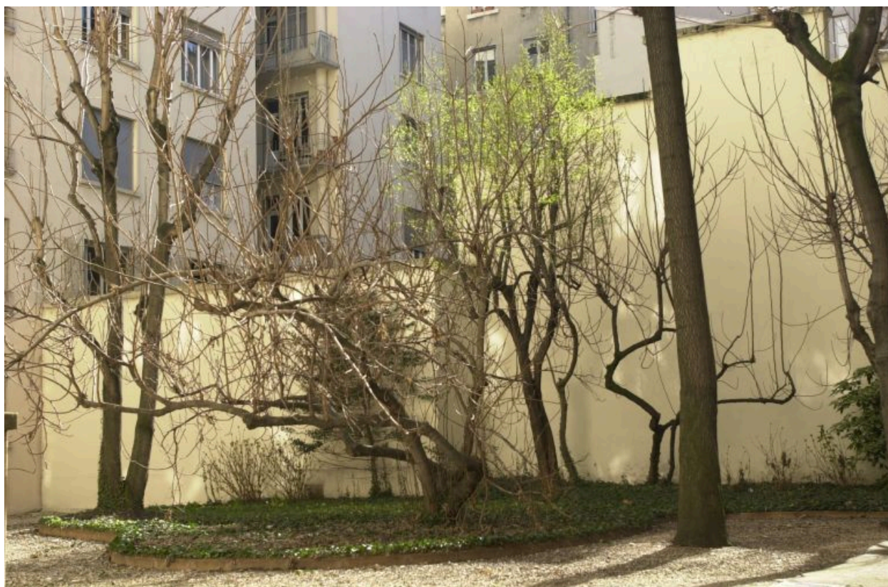
Vue de la cour-jardin