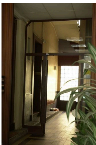
Vue du vestibule-sas