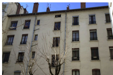
Vue de la façade postérieure sur cour