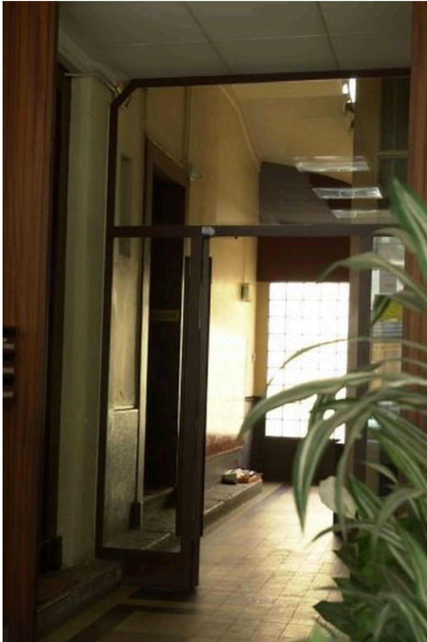
Vue du vestibule-sas