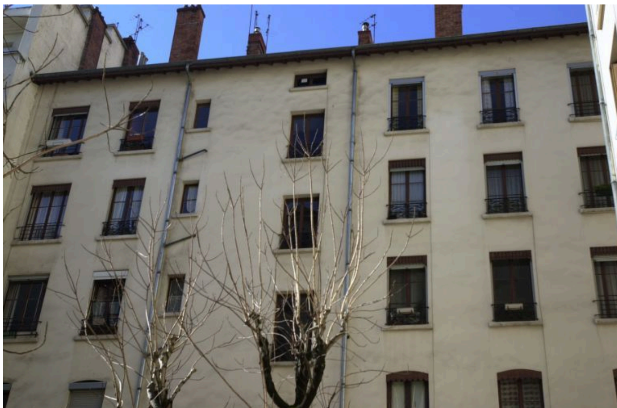
Vue de la façade postérieure sur cour