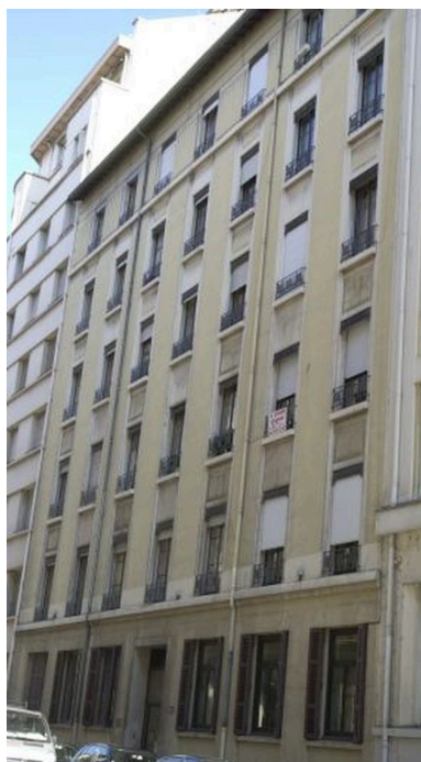
Vue de l'élévation sur rue IVR82_20046903189NUCA