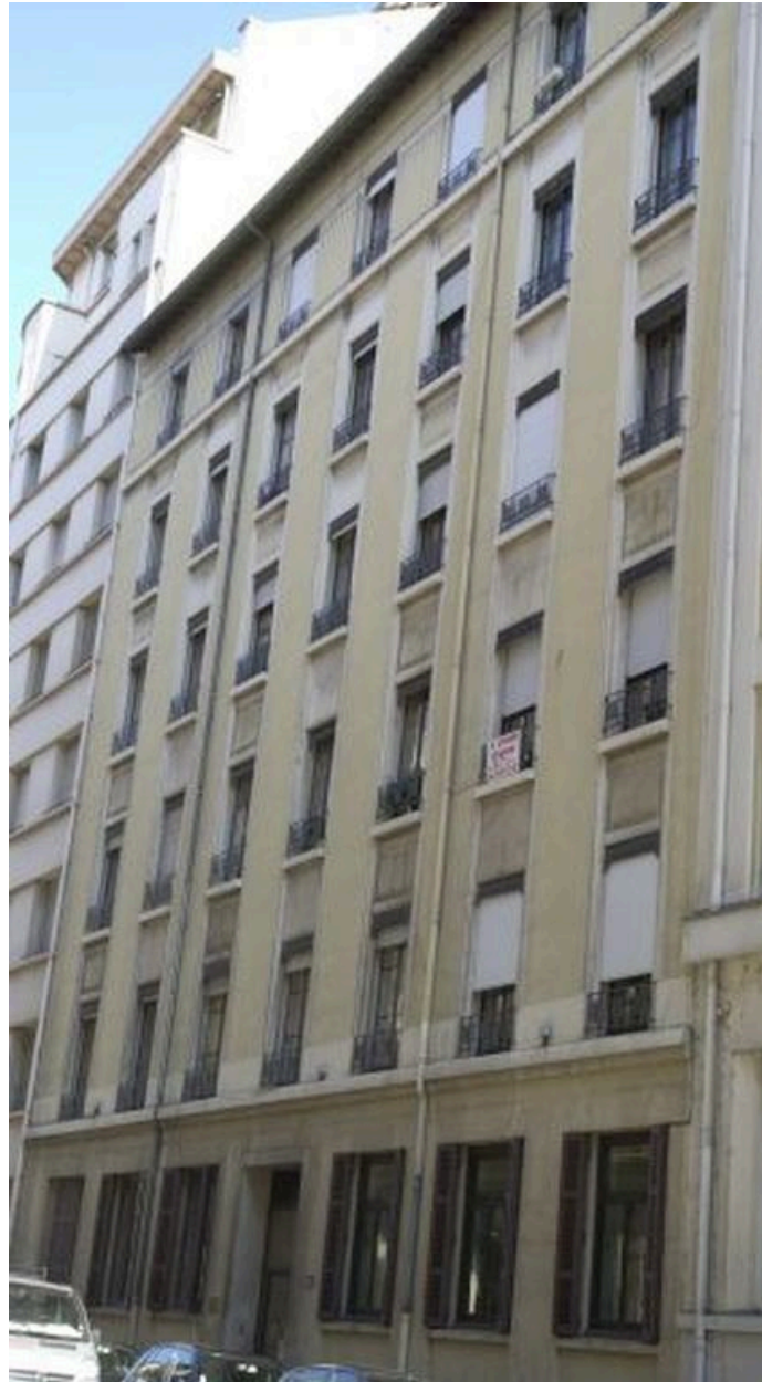
Vue de l'élévation sur rue