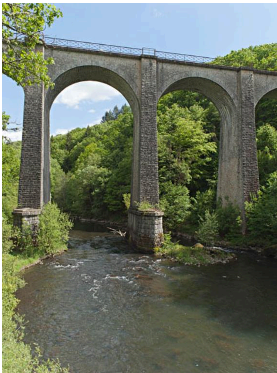
Vue du viaduc de Nèpes, côté amont, depuis les rives de la Cère.