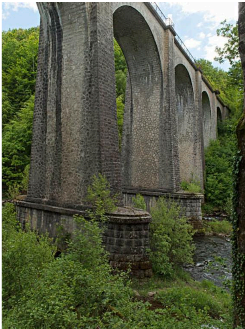
vue partielle des piles du viaduc de Nèpes, depuis les bords de la Cère.