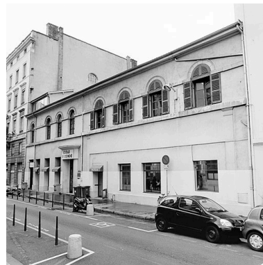
Façade est, rue Vaubecour IVR82_20046902714X