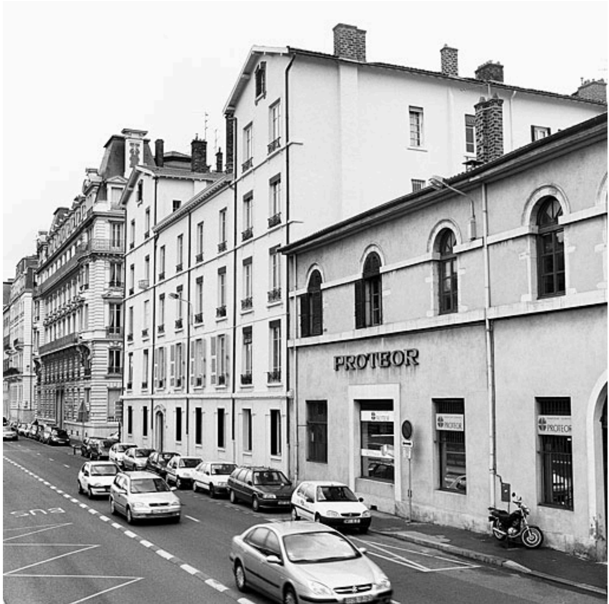
Détail enseigne, vue sud-ouest