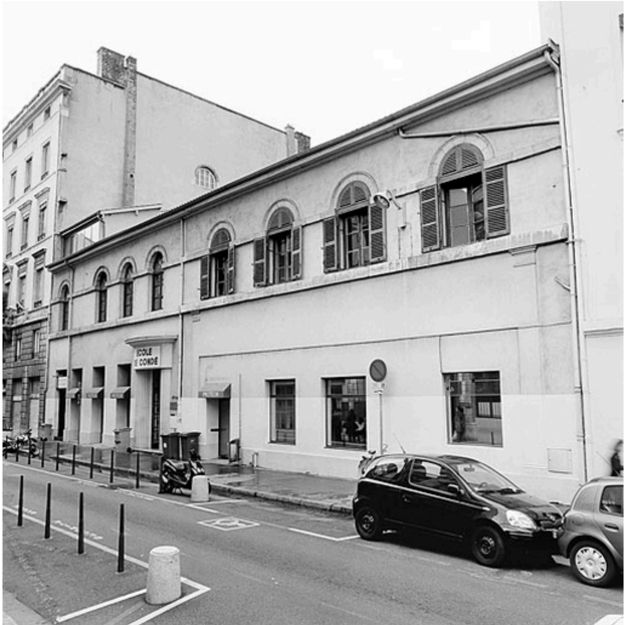
Façade est, rue Vaubecour