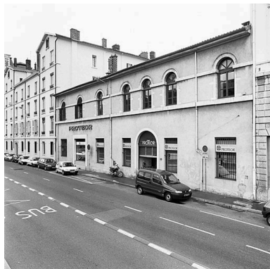
Vue générale sud-ouest IVR82_20046902712X