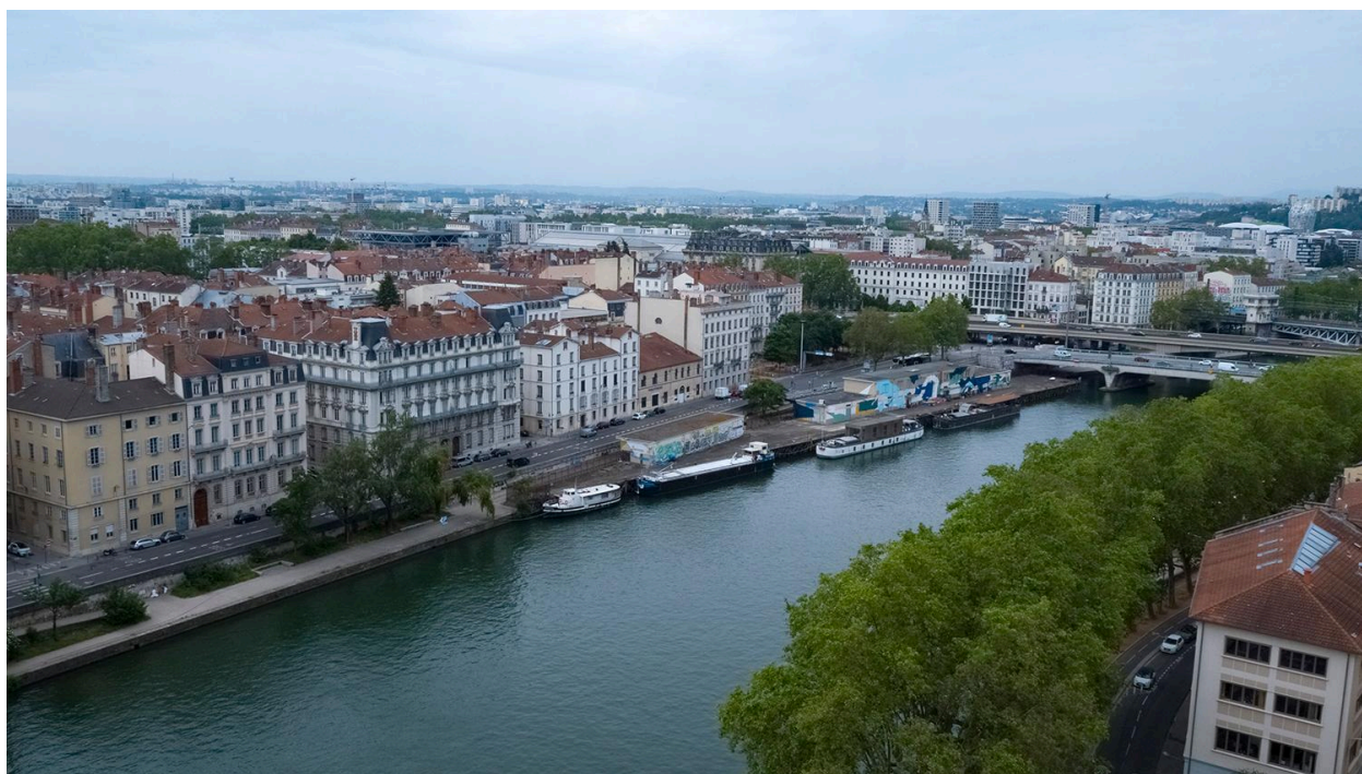
Vue d'ensemble du site (drone)