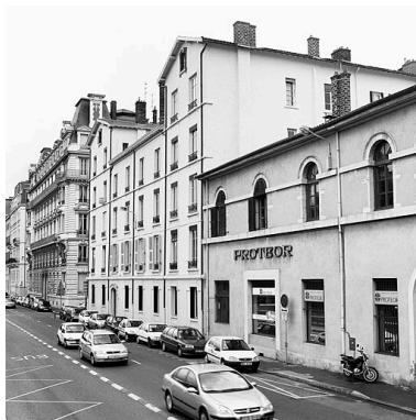
Détail enseigne, vue sud-ouest IVR82_20046902713X