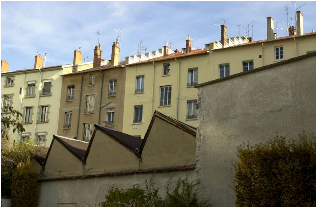
Détail des pignons découverts