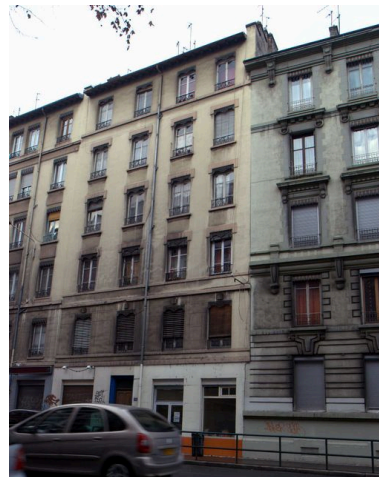
Elévation principale depuis le nord-est IVR82_20086900719NUCA