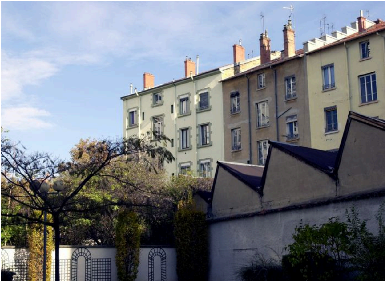
Elévation postérieure vue depuis le sud-ouest