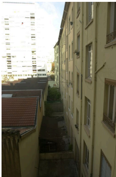
Vue d'ensemble des cours depuis le sud IVR82_20086900649NUCA