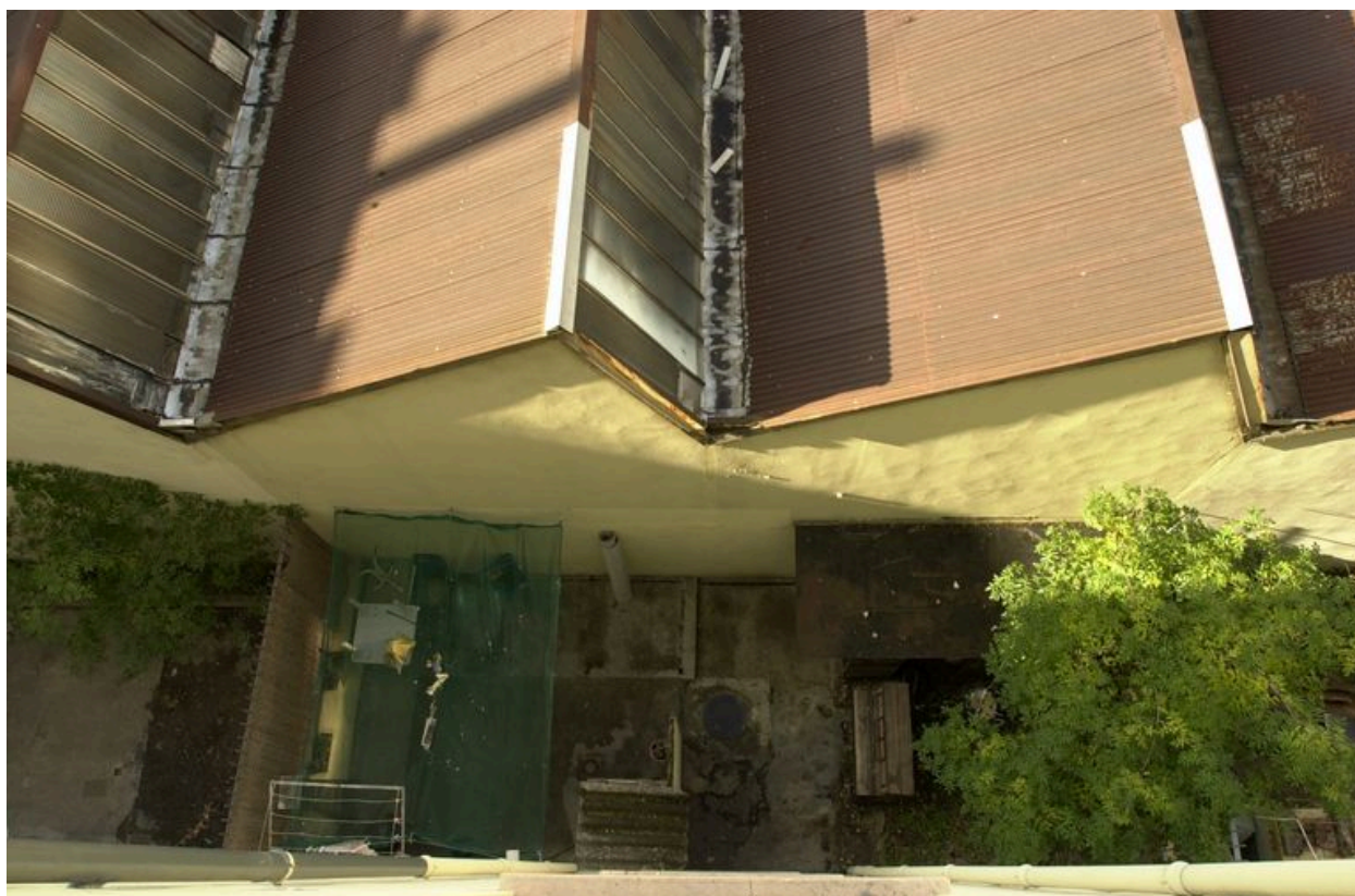
Vue de la cour