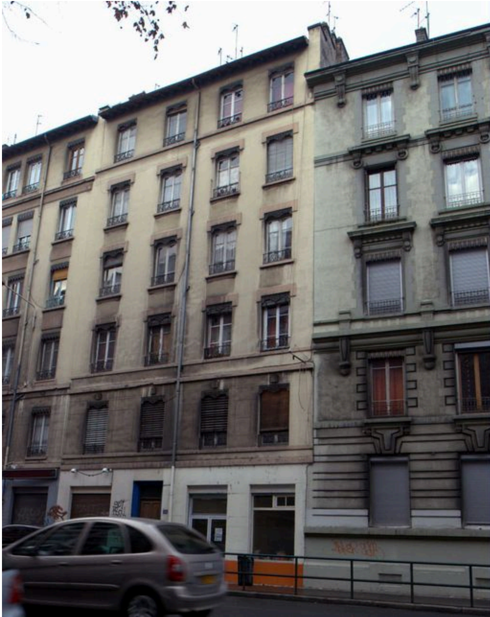
Elévation principale depuis le nord-est