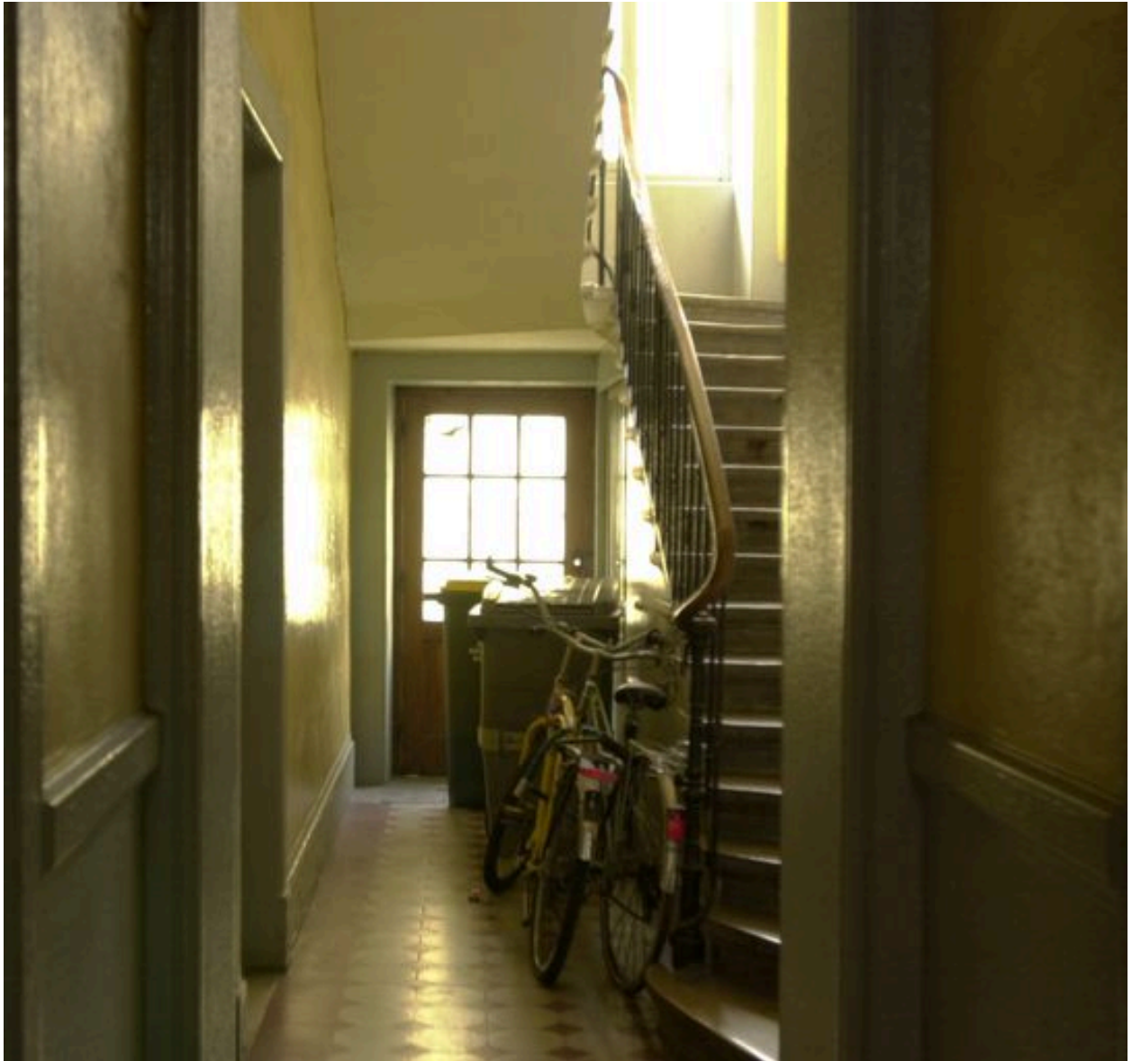
Vue de la cage d'escalier depuis le couloir d'entrée