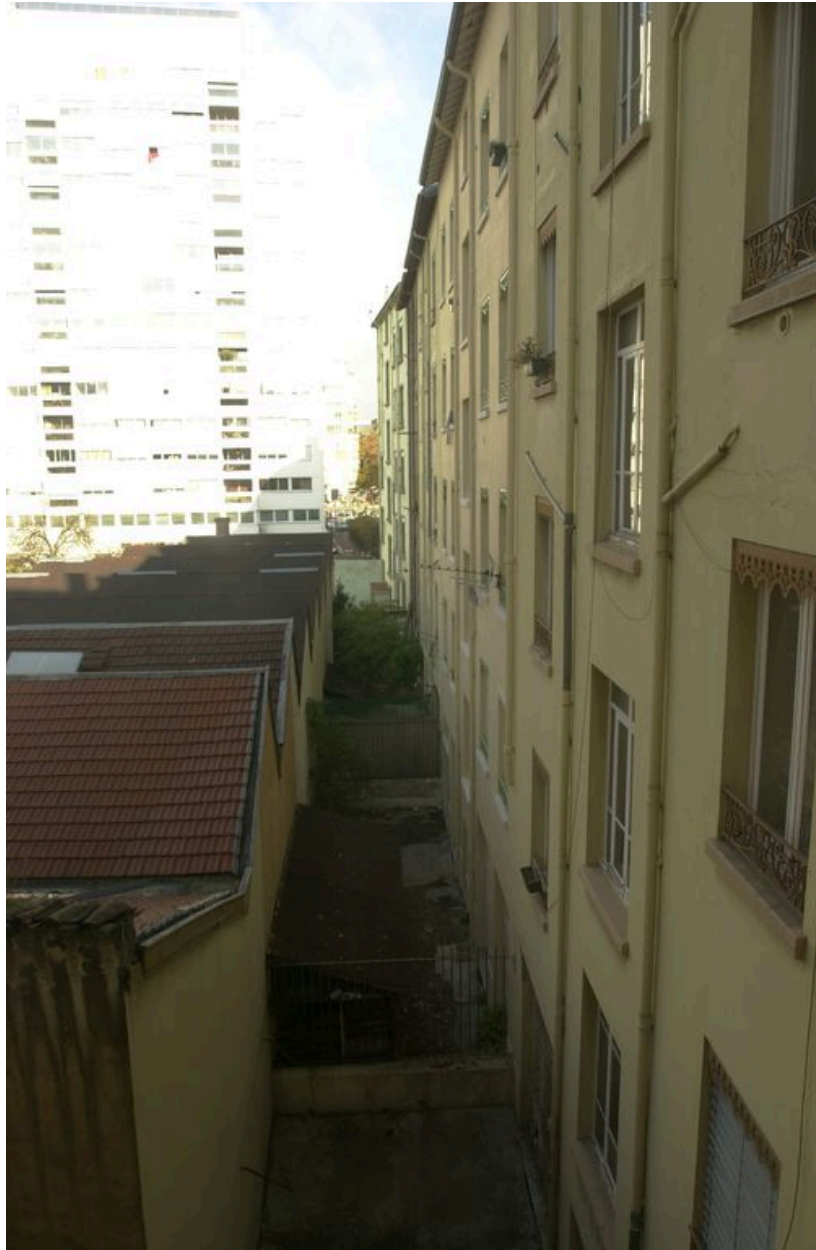
Vue d'ensemble des cours depuis le sud