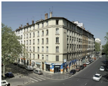
Vue d'ensemble depuis le sud-est IVR82_20076902425NUCA

Plan masse et de situation, extrait de http://cadastre.gouv.fr Dess. André Céréza IVR82_20136902315NUDA