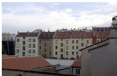
Elévation postérieure IVR82_20086900643NUCA