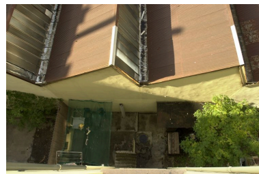
Vue de la cour IVR82_20086900647NUCA