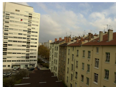
Vue de l'élévation postérieure depuis le sud-ouest IVR82_20086900646NUCA