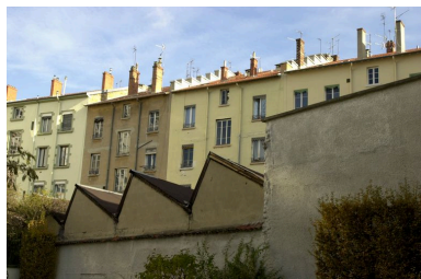
Détail des pignons découverts