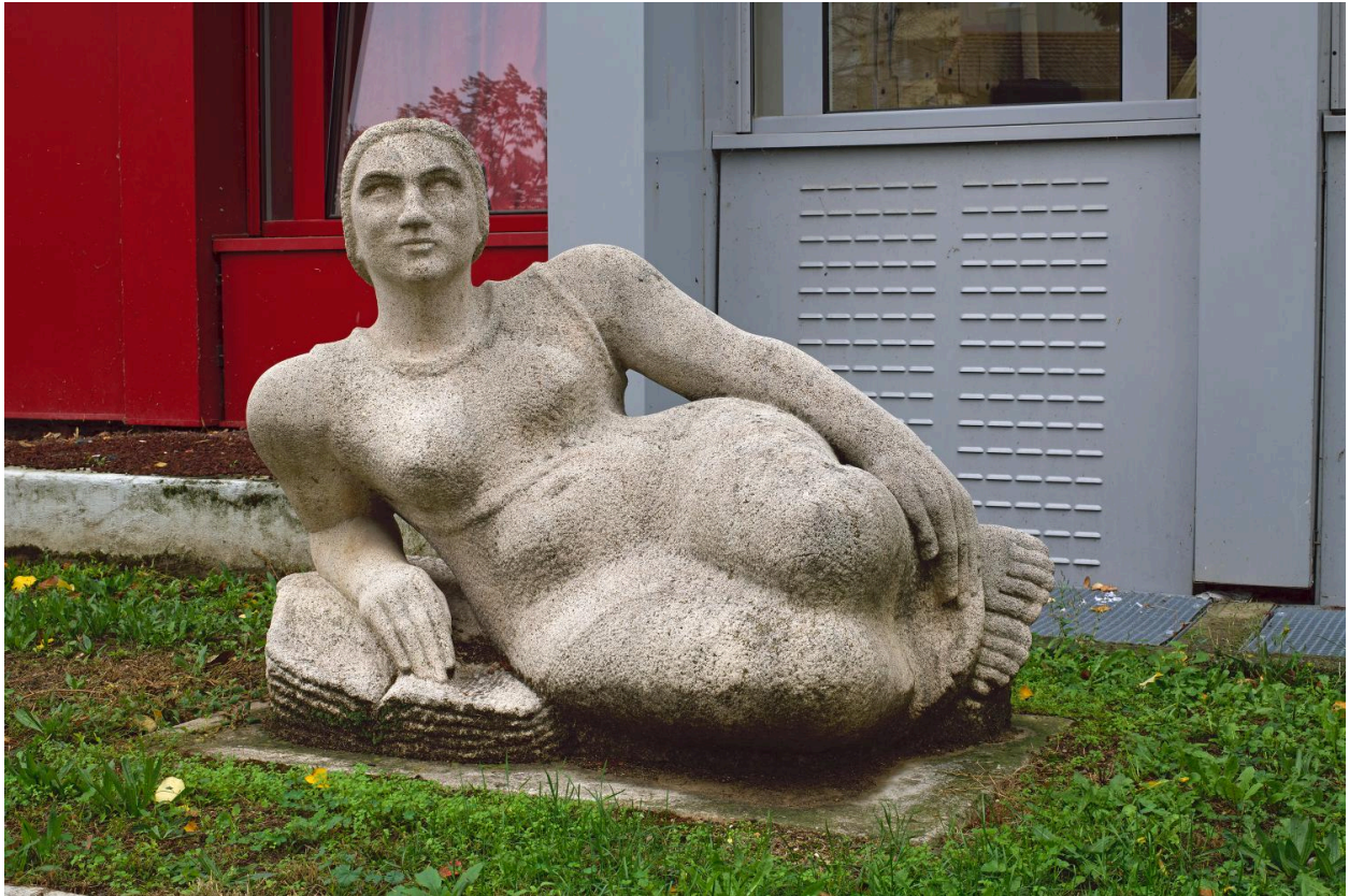
Sculpture : La Liseuse, G. Salendre (IM69001967).