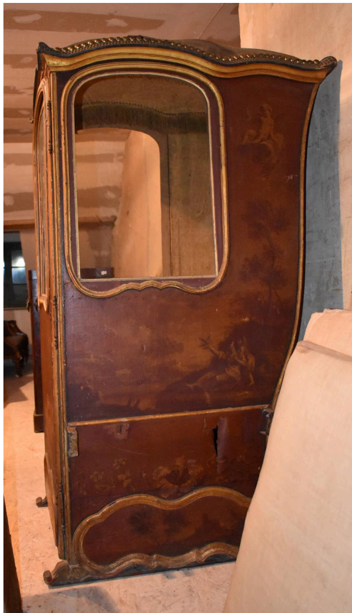
Vue du côté gauche