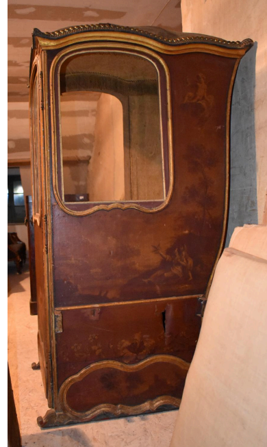
Vue du côté gauche IVR84_20216301648NUC4A