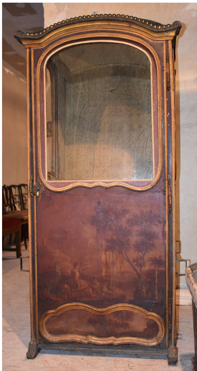
Vue de l'avant