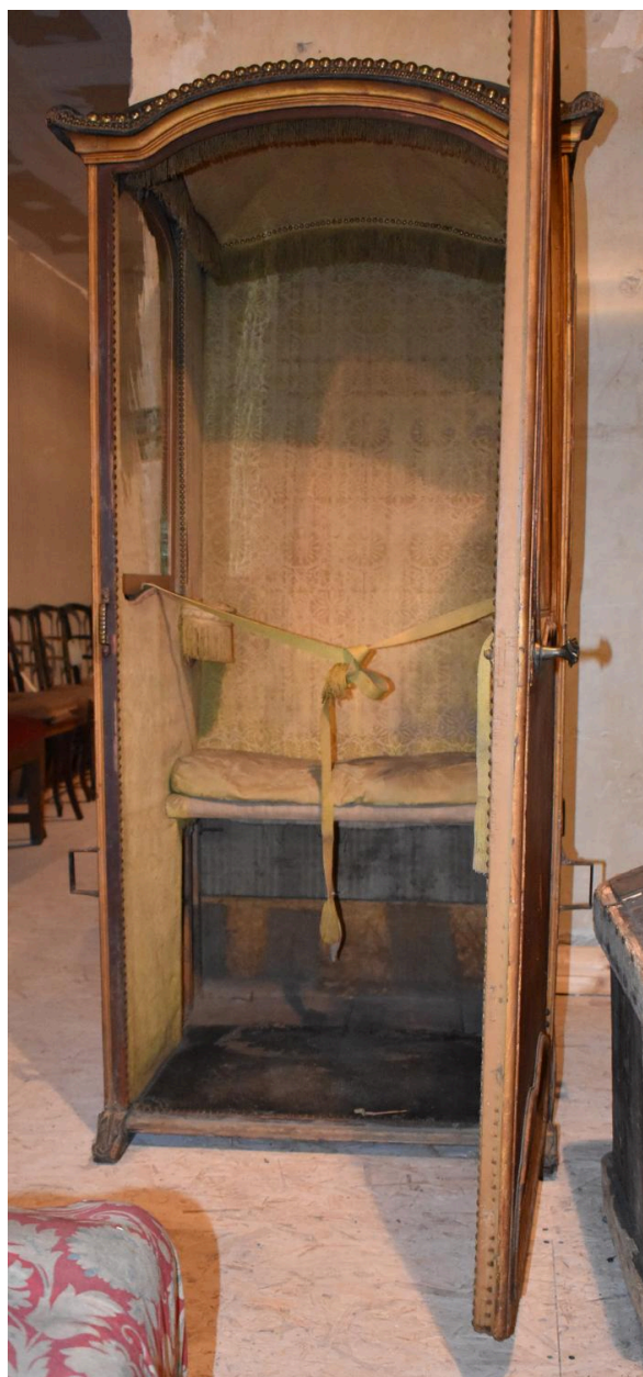
Vue de l'intérieur