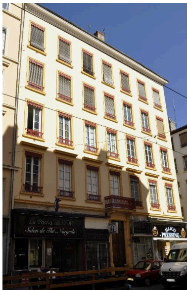
Elévation latérale, sur la rue de Marseille