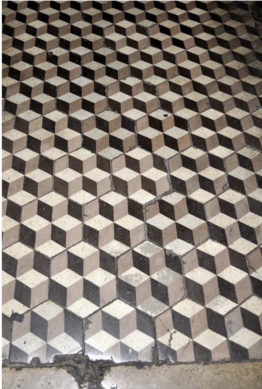
Vue intérieure : le pavement de l'allée