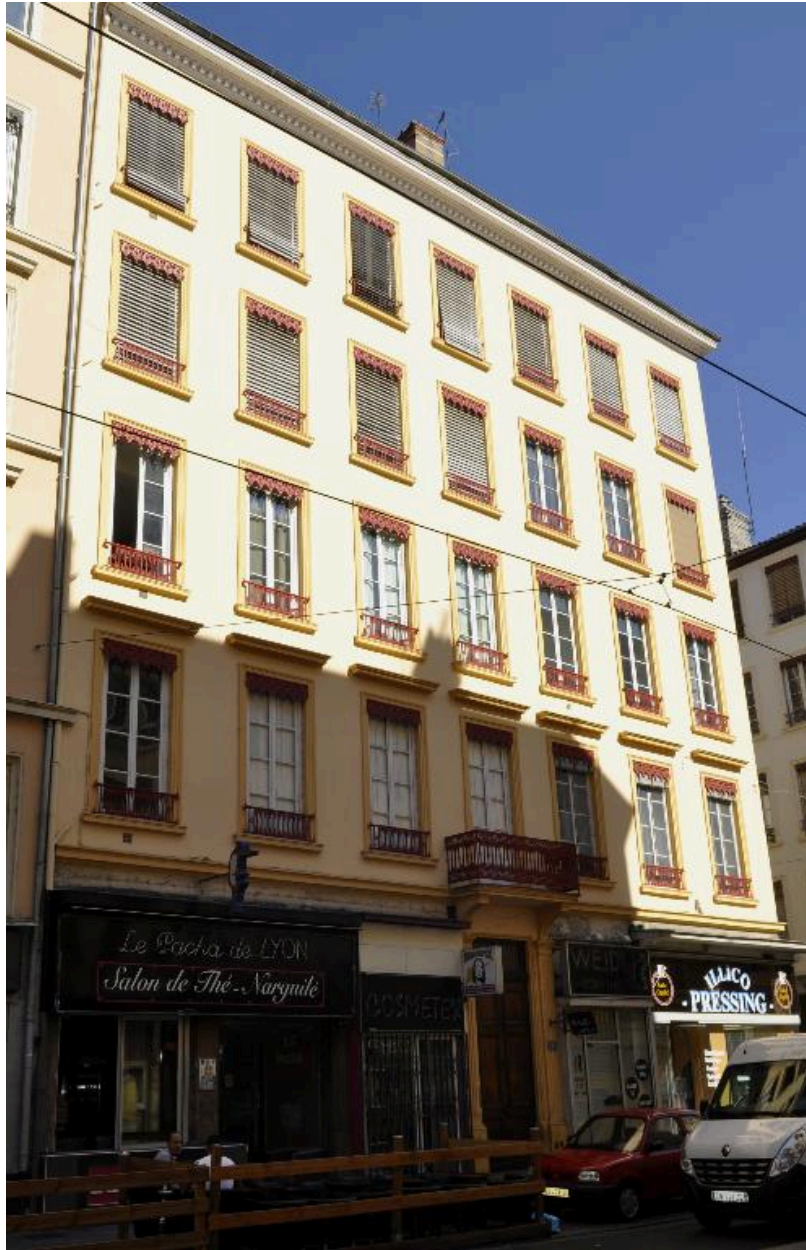
Elévation latérale, sur la rue de Marseille