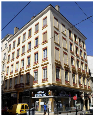
Vue d'ensemble IVR82_20156901235NUCA