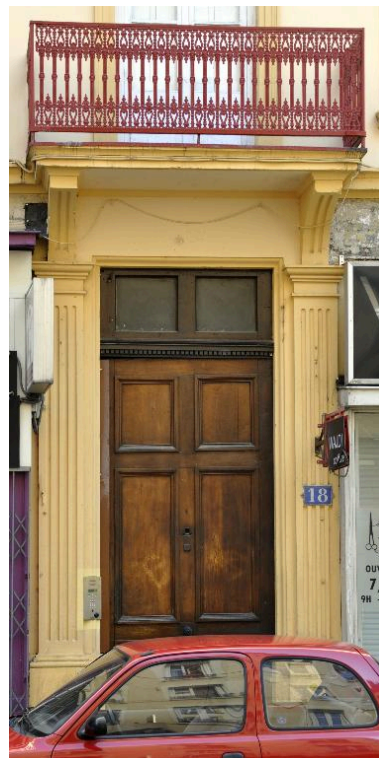
Porte piétonne surmontée d'un balcon central, piédroits cannelés IVR82_20156901237NUCA