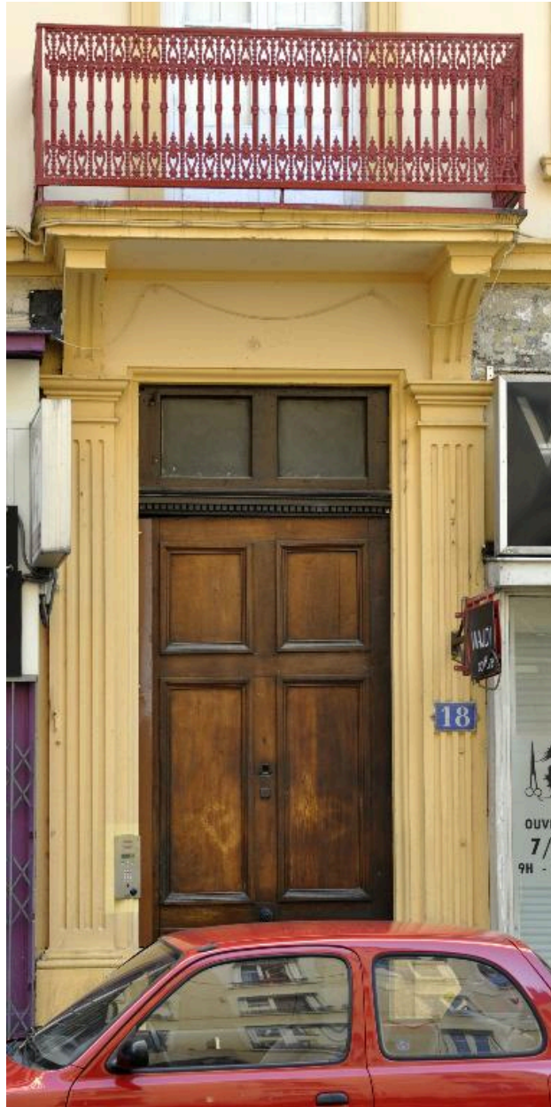
Porte piétonne surmontée d'un balcon central, piédroits cannelés