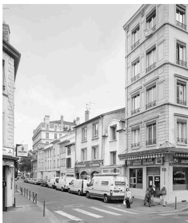
Vue générale depuis le nord-ouest IVR82_20066902154V