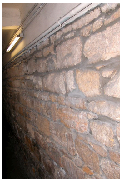
Mur en pierres apparentes du couloir IVR82_20046904082NUCA