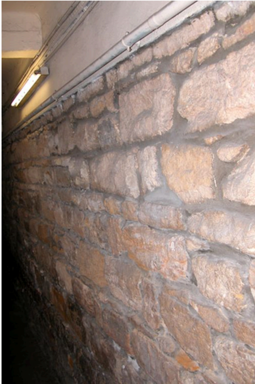
Mur en pierres apparentes du couloir