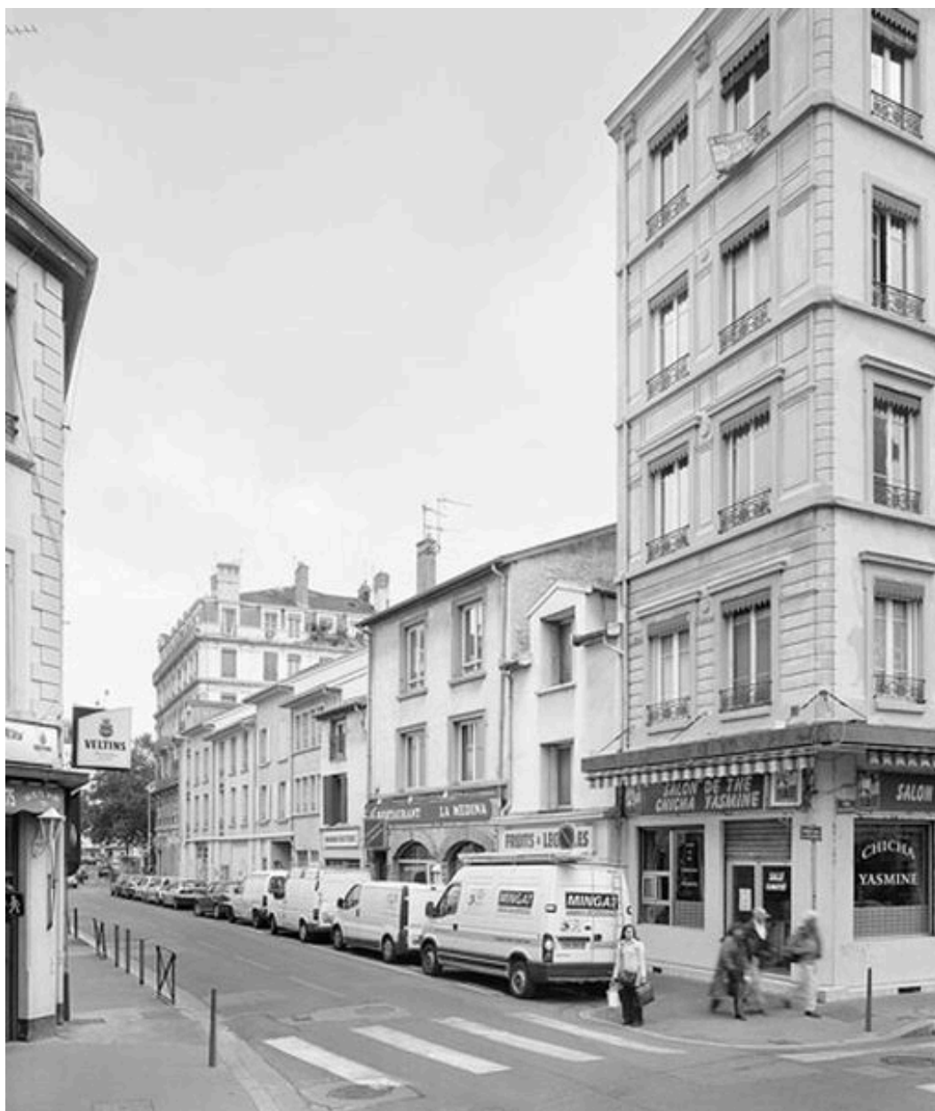
Vue générale depuis le nord-ouest