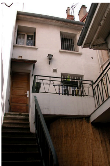
Elévation sur cour