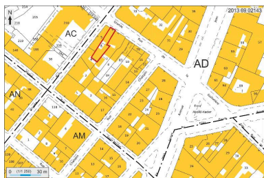
Plan masse et de situation, extrait de http://cadastre.gouv.fr IVR82_20126920085NUDA