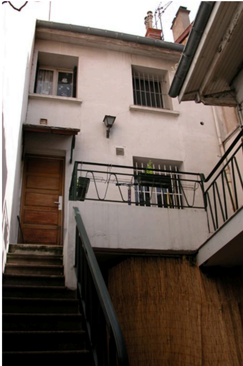
Elévation sur cour