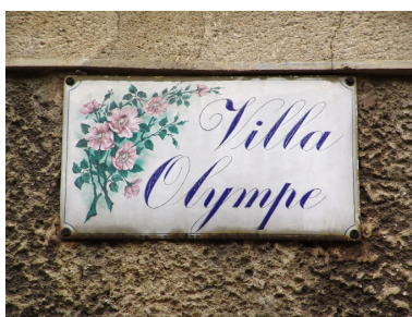
Plaque émaillée IVR82_20097300125NUCA