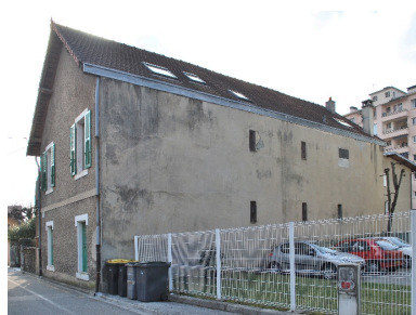
Élévation postérieure