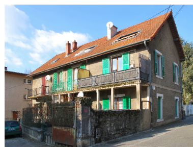
Vue générale IVR82_20097300124NUCA