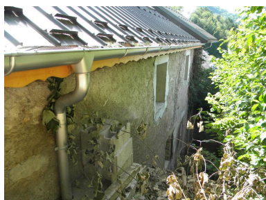
Façade arrière d'une ferme remaniée (2008 F6 814) IVR82_20137401136NUCA