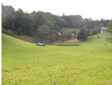
Vue d'un verger dans la combe en aval du hameau. IVR82_20137401129NUCA