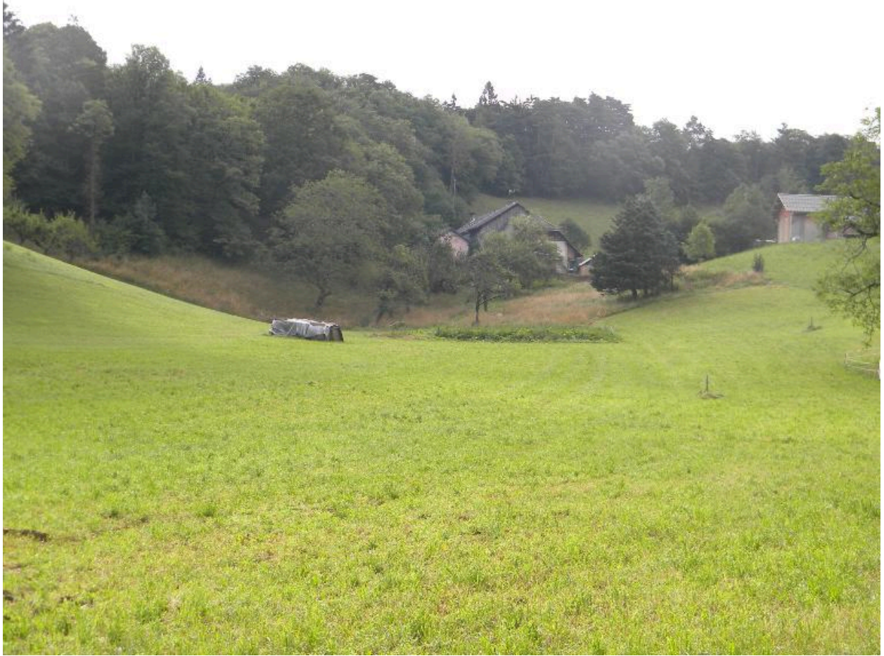
Vue d'un verger dans la combe en aval du hameau.