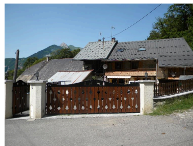
Vue de la façade principale d'une ferme remaniée (2008 F6 814) IVR82_20137401135NUCA