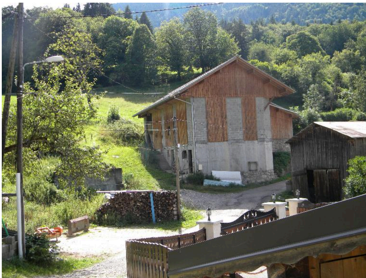
Vue d'une ancienne grange étable modifiée.