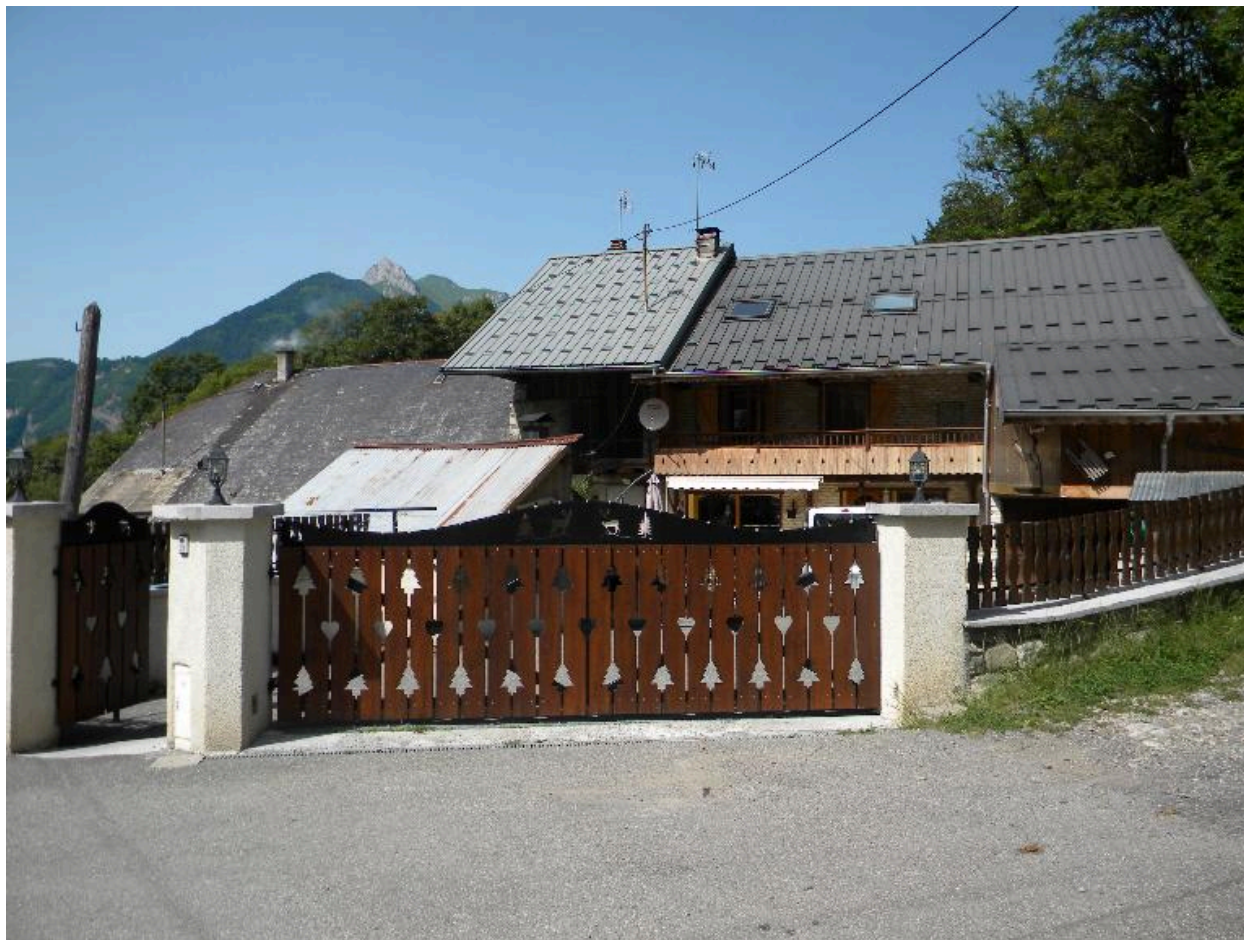
Vue de la façade principale d'une ferme remaniée (2008 F6 814)