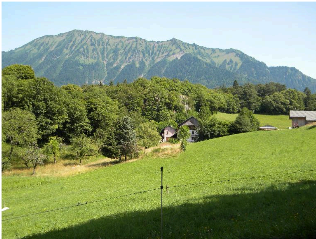
Vue d'ensemble du hameau avec la Dent de Cons en arrière plan.