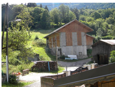
Vue d'une ancienne grange étable modifiée. IVR82_20137401137NUCA