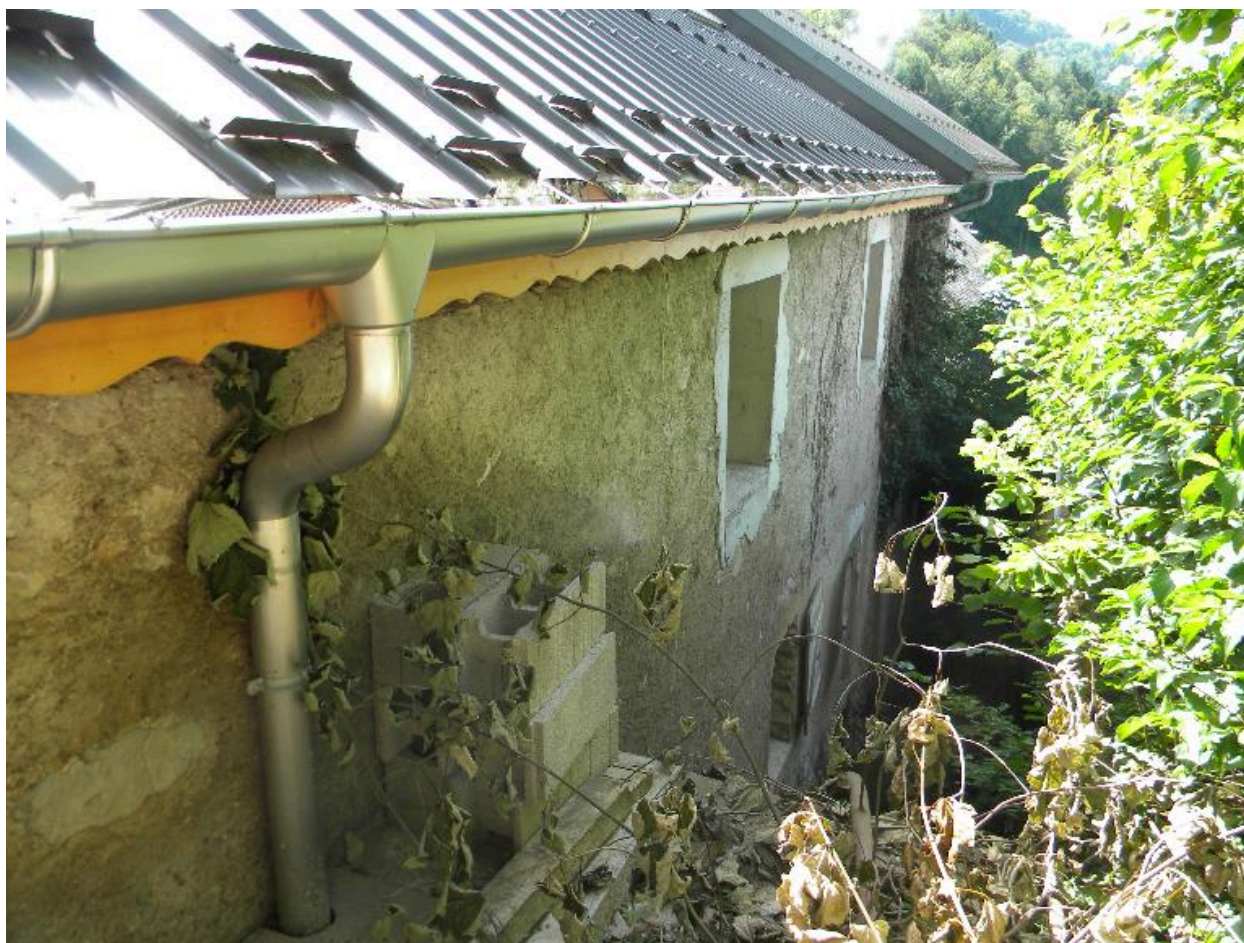
Façade arrière d'une ferme remaniée (2008 F6 814)