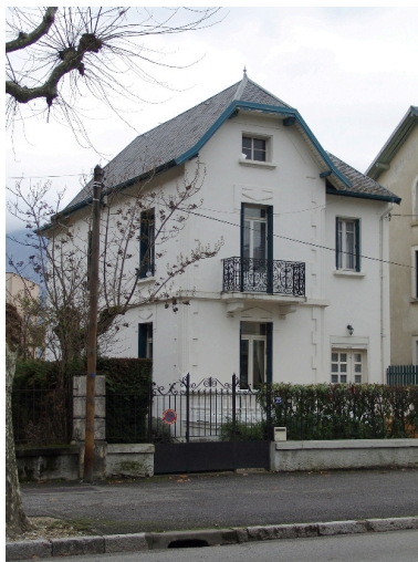
Vue générale IVR82_20077300222NUCA