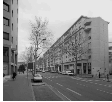
Vue générale depuis le nord-ouest IVR82_20056900633NUC