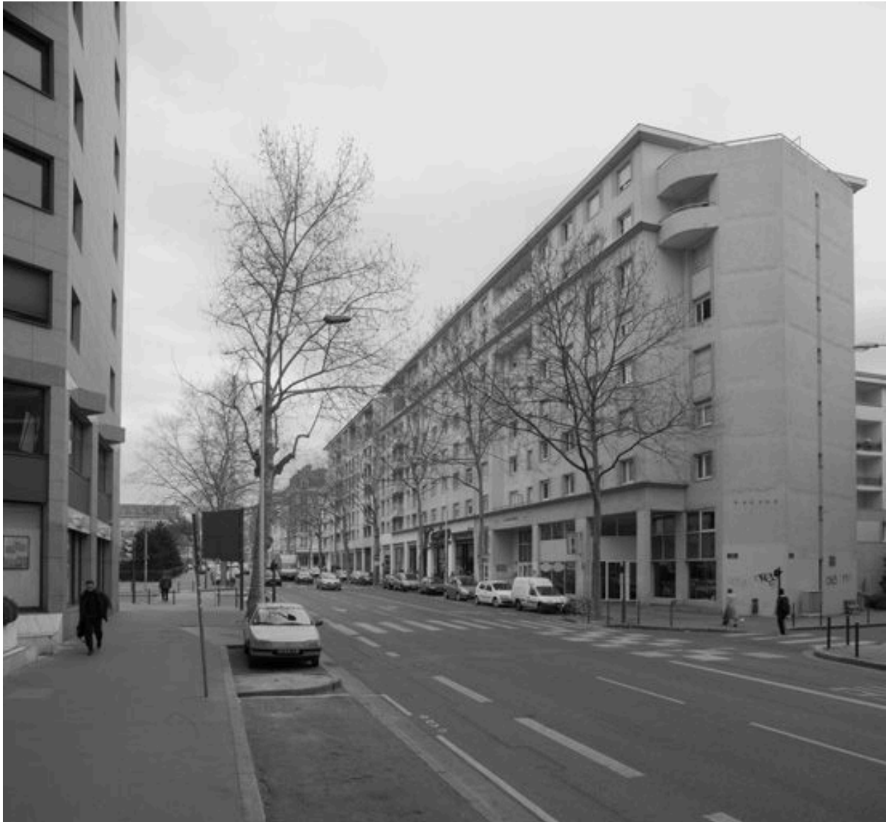
Vue générale depuis le nord-ouest