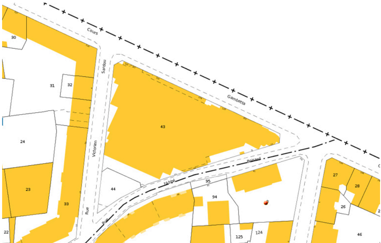
Ville de Lyon, cadastre (2012) : détail de la parcelle AH 43