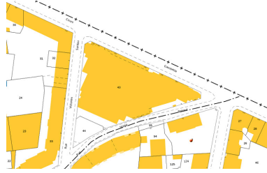
Ville de Lyon, cadastre (2012) : détail de la parcelle AH 43 IVR82_20126902445NUCA