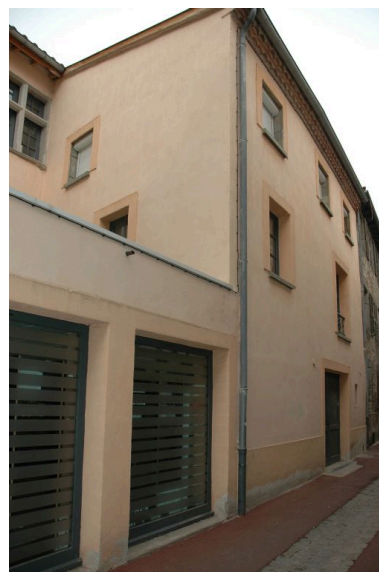
Élévation latérale, ancienne dépendance (?). IVR82_20114201215NUCA