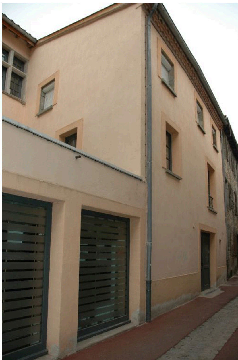
Elévation latérale, ancienne dépendance (?).