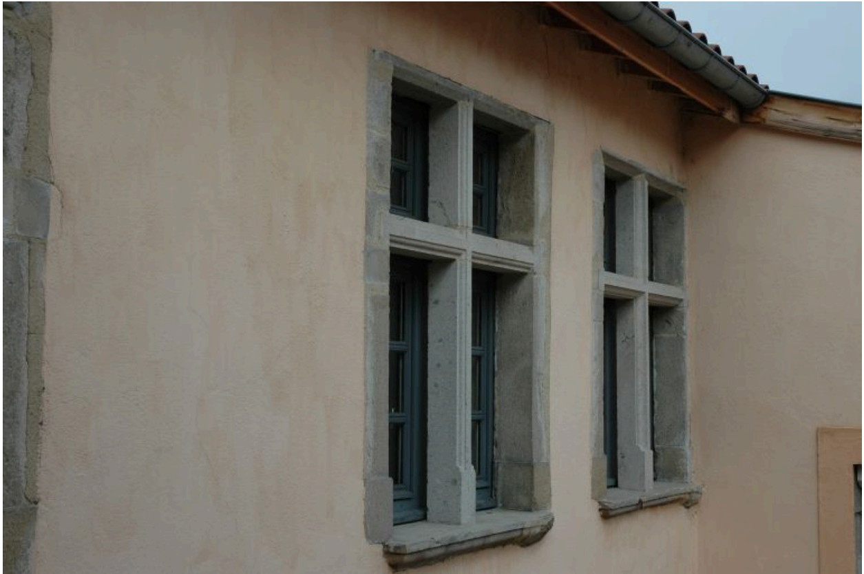
Fenêtres restituées, côté cour.