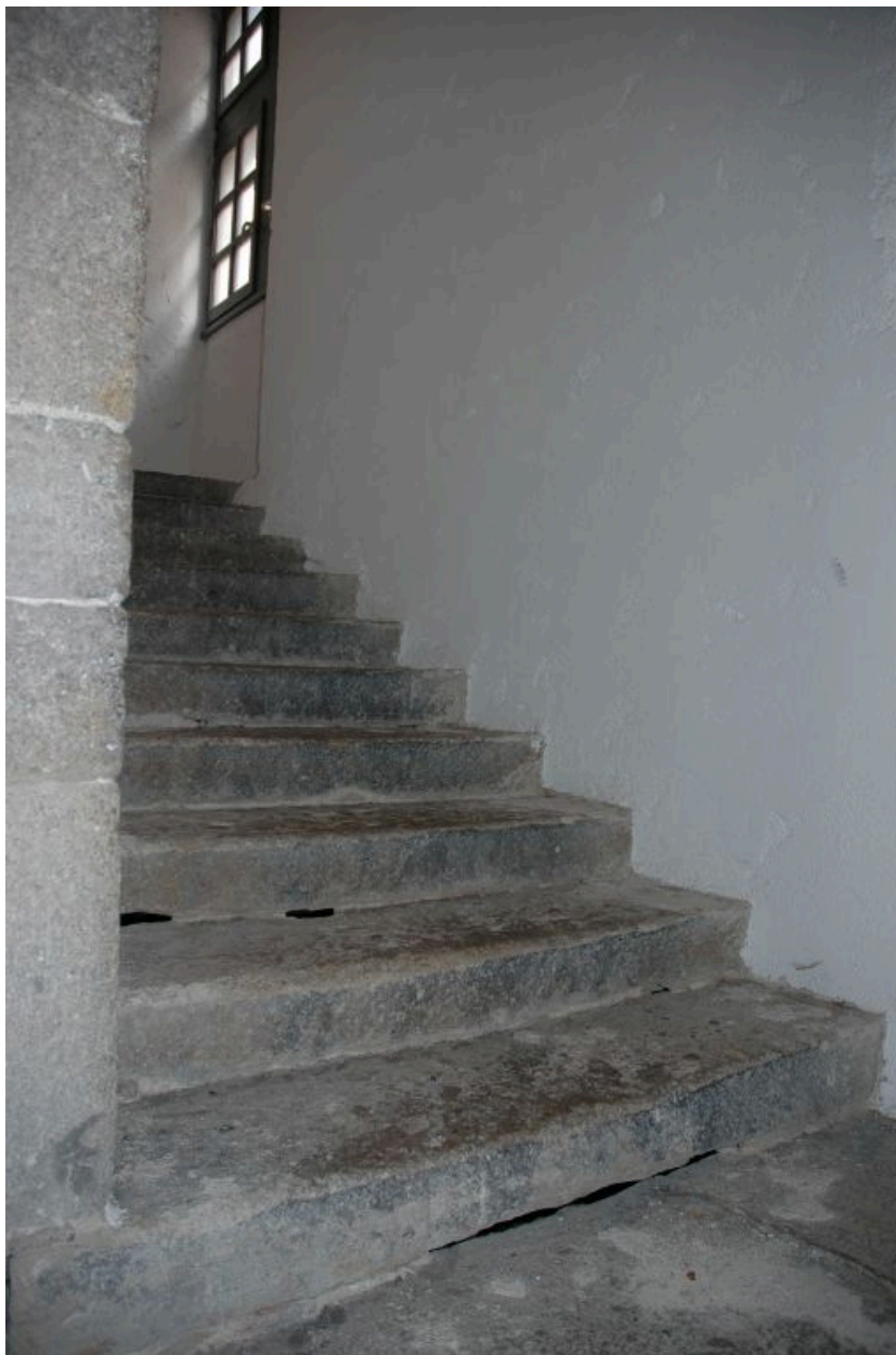
Escalier à mur noyau plein.