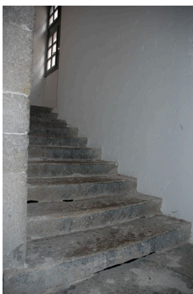
Escalier à mur noyau plein. IVR82_20114201217NUCA