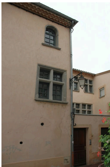
Vue partielle depuis la rue Précomtal en direction de la cour IVR82_20114201214NUCA