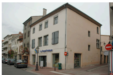
Vue générale, angle rue Tupinerie rue Précomtal.