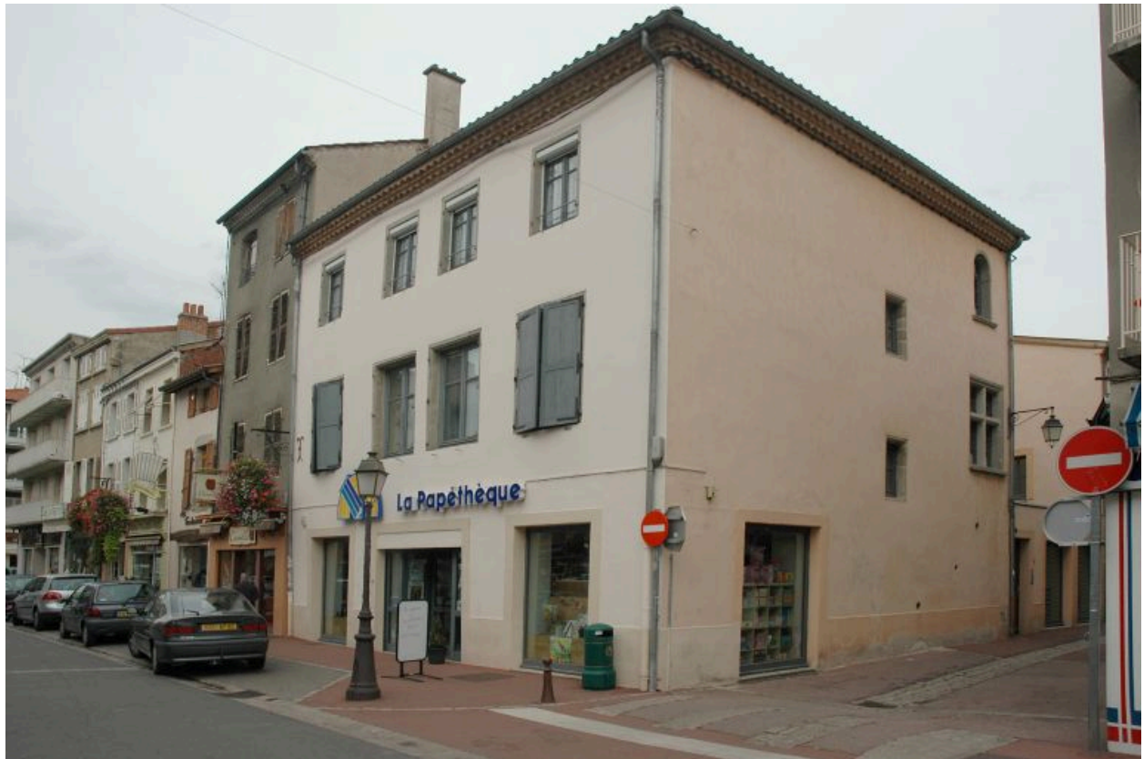
Vue générale, angle rue Tupinerie rue Précomtal.