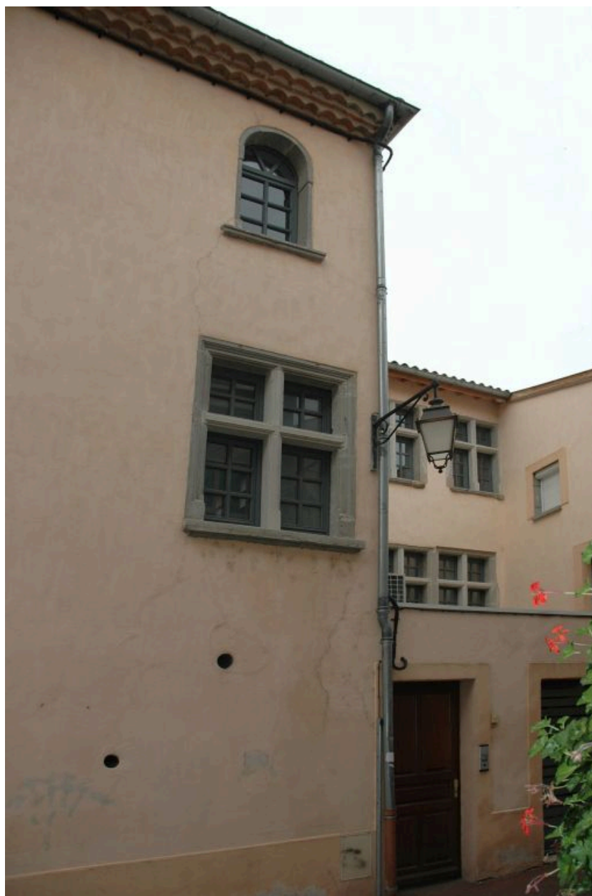
Vue partielle depuis la rue Précomtal en direction de la cour