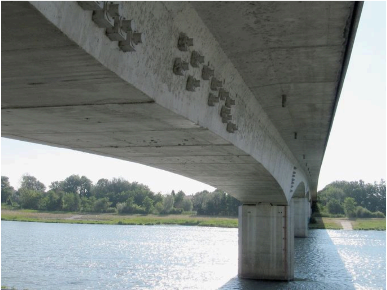
Vue partielle, de dessous, tablier et piles (depuis la rive droite)