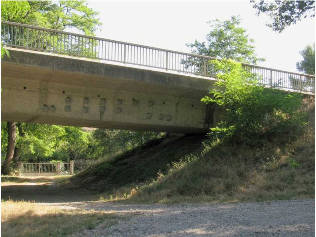
Culée gauche, face aval, vue générale (depuis la rive gauche)