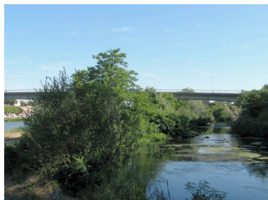
Vue partielle, travée gauche, face aval (depuis la rive gauche) IVR82_20100700332NUCA