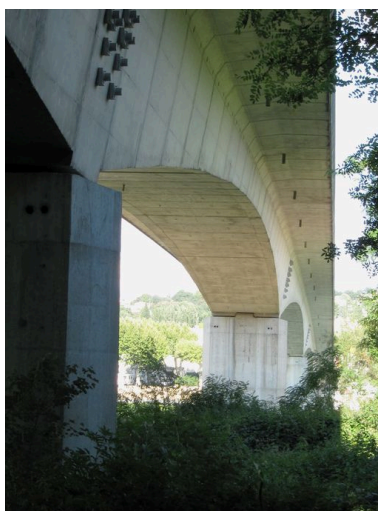
Vue partielle, de dessous, tablier et piles, face amont (depuis la rive gauche) IVR82_20100700336NUCA