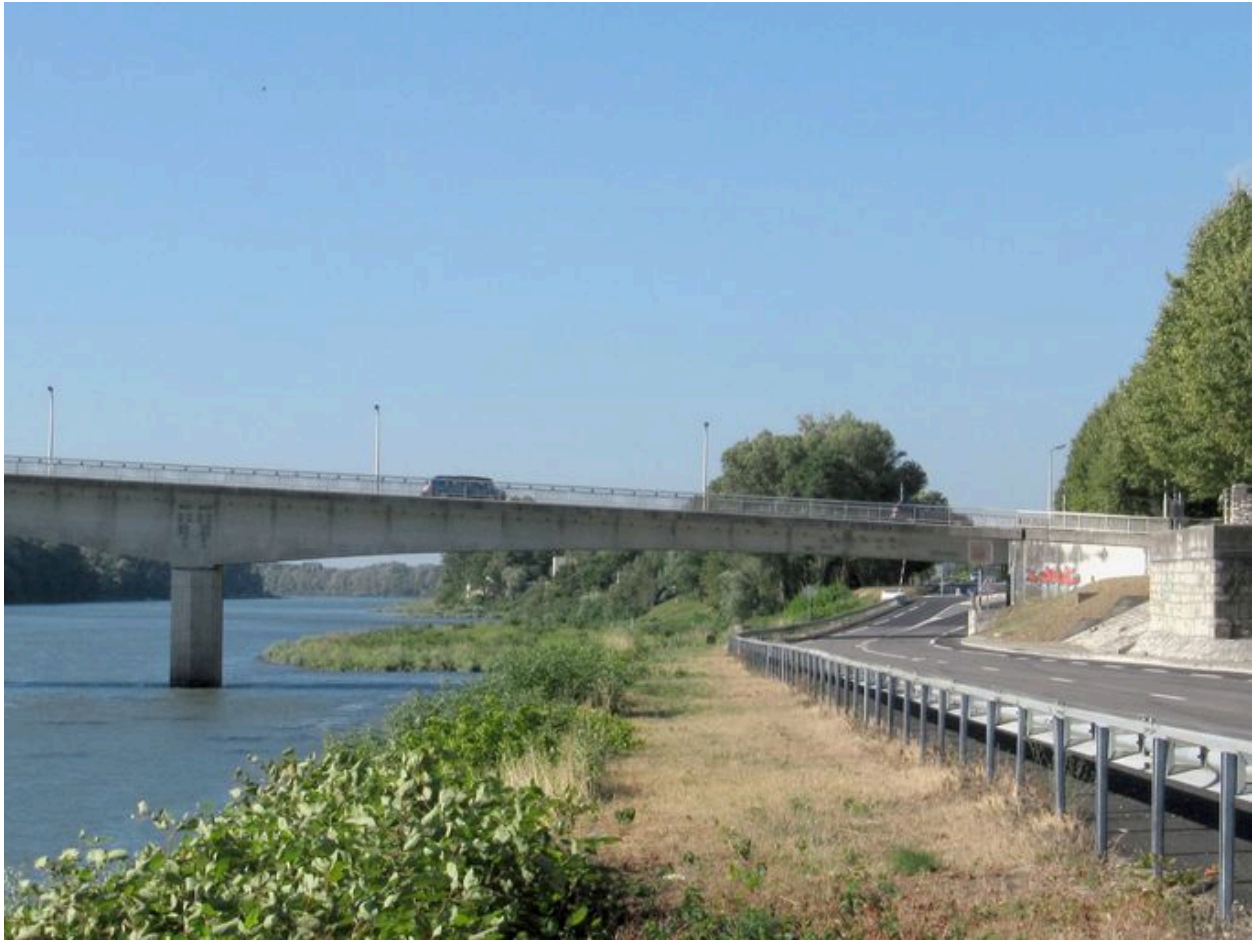
Vue partielle, culée et travée droite, face amont (depuis la rive droite)