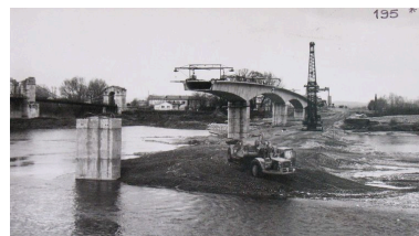
[La construction du nouveau pont de Bourg-Saint-Andéol]. [03/1971]. 1 fotogr. pos. n. et b. 1_ IVR82_20100700081NUCAB