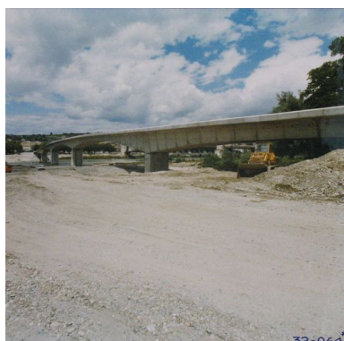
[La construction du nouveau pont de Bourg-Saint-Andéol]. [06/1971]. 1 fotogr. pos. coul. 1_ IVR82_20100700080NUCAB