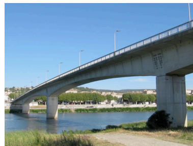
Vue partielle, de côté, face aval (depuis la rive gauche)