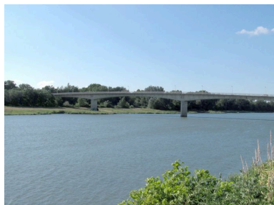
Vue partielle, face amont (depuis la rive droite)