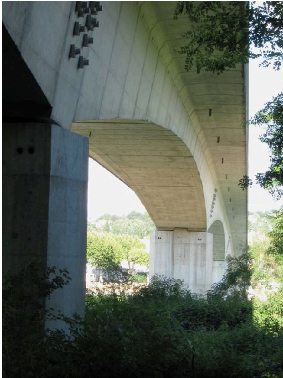
Vue partielle, de dessous, tablier et piles, face amont (depuis la rive gauche)