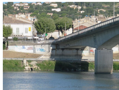
Culée et travée droite, face aval, vue générale (depuis la rive gauche)