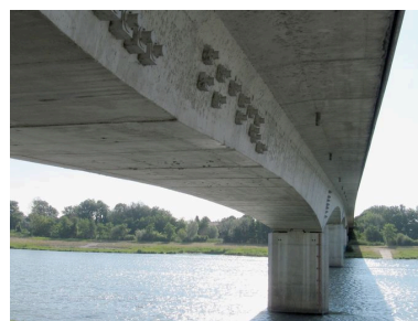
Vue partielle, de dessous, tablier et piles (depuis la rive droite) IVR82_20100700337NUCA