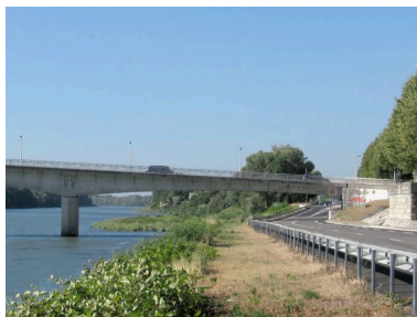
Vue partielle, culée et travée droite, face amont (depuis la rive droite) IVR82_20100700333NUCA