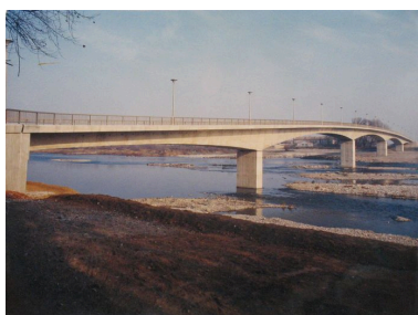
[Vue au pied du pont de Bourg-Saint-Andéol]. [1973]. 1 fotogr. pos. coul. (AD Ardèche. 25 Fi 100, n°59, P.C. 357) 1_ IVR82_20100700082NUCAB