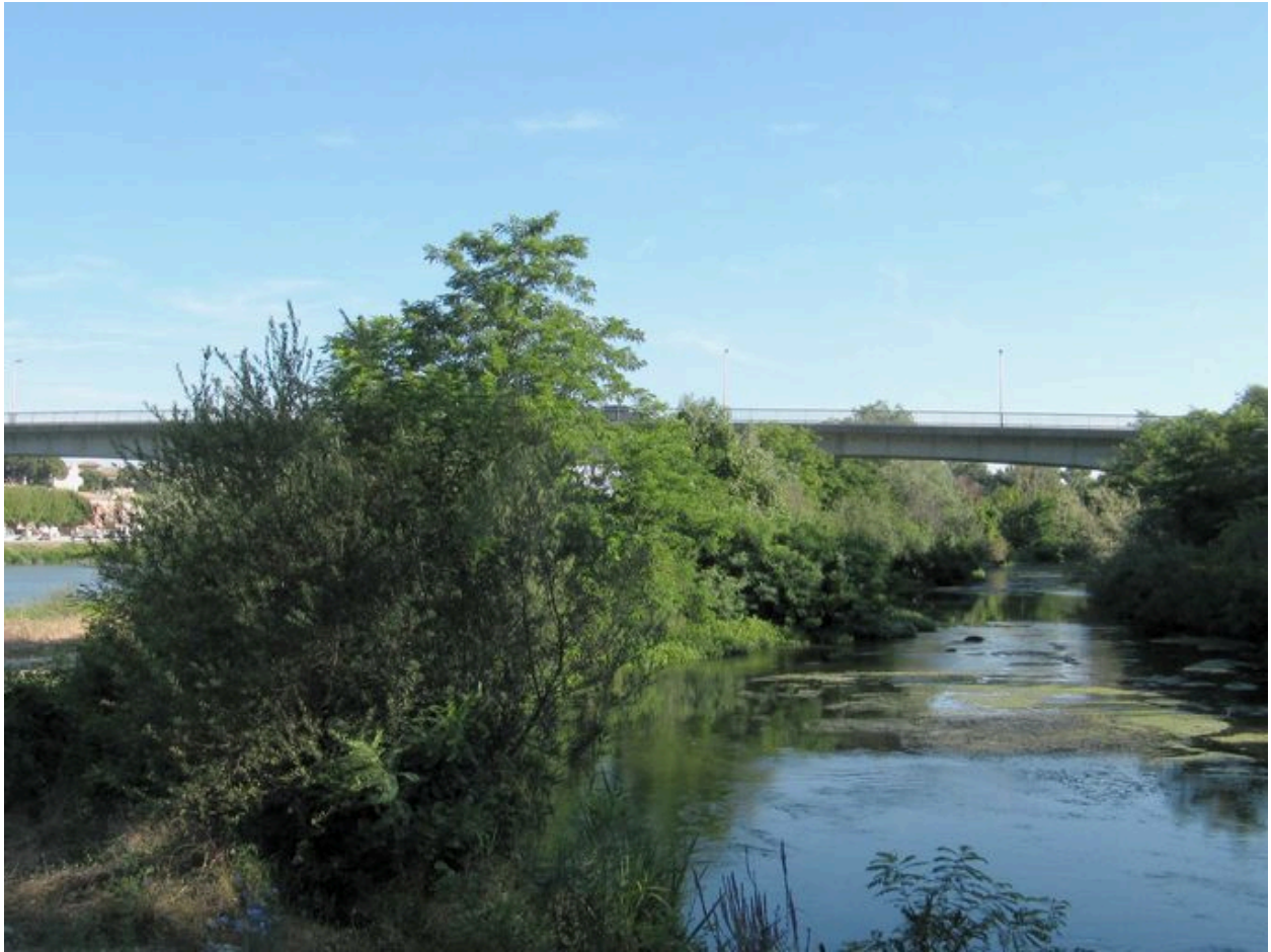
Vue partielle, travée gauche, face aval (depuis la rive gauche)