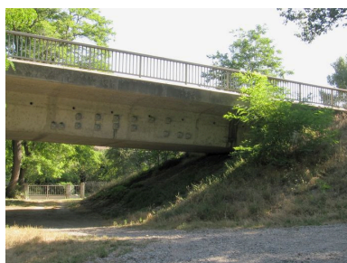
Culée gauche, face aval, vue générale (depuis la rive gauche)