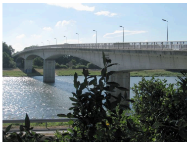
Vue partielle, de côté, face amont (depuis la rive droite) IVR82_20100700330NUCA