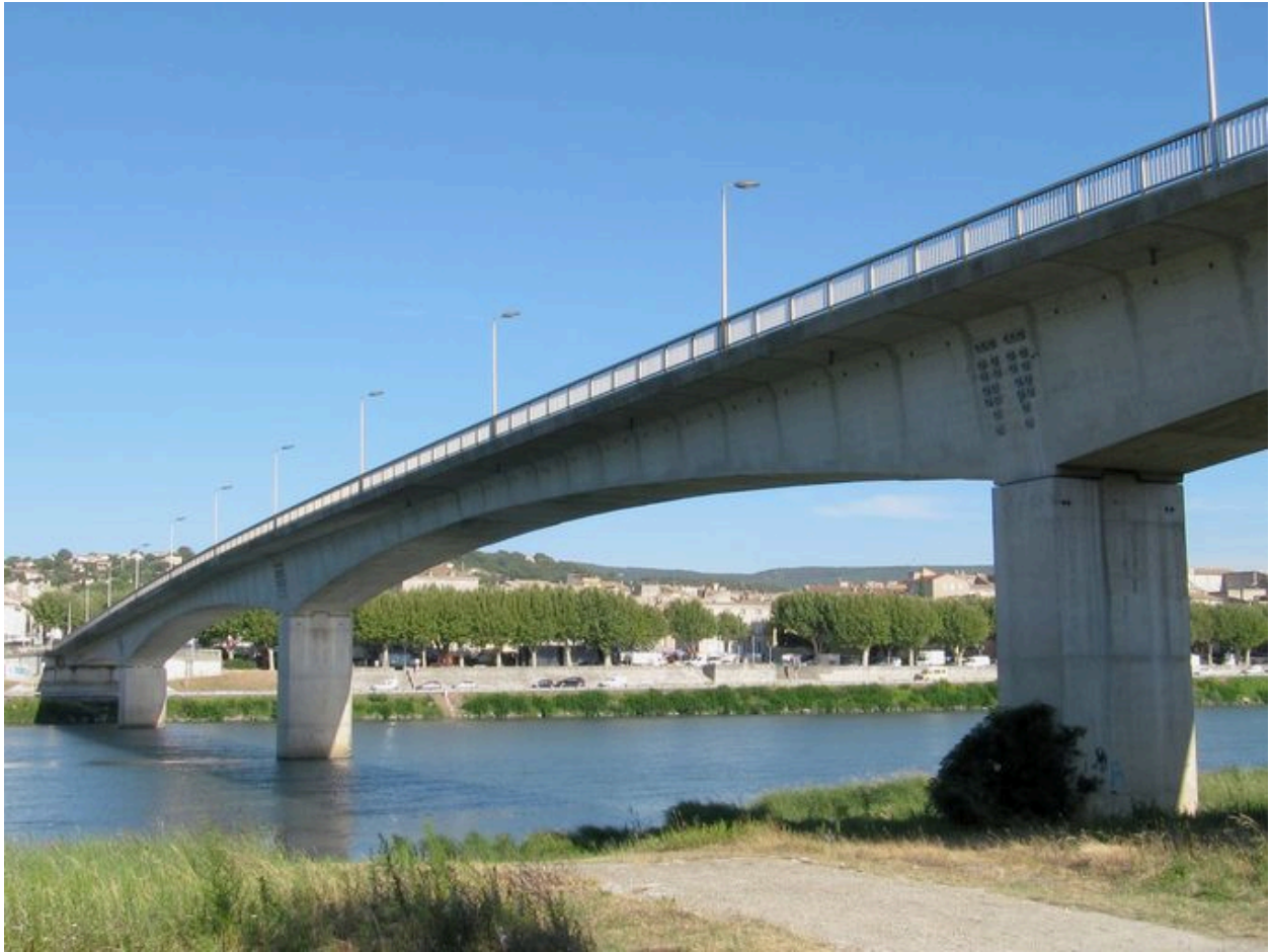
Vue partielle, de côté, face aval (depuis la rive gauche)