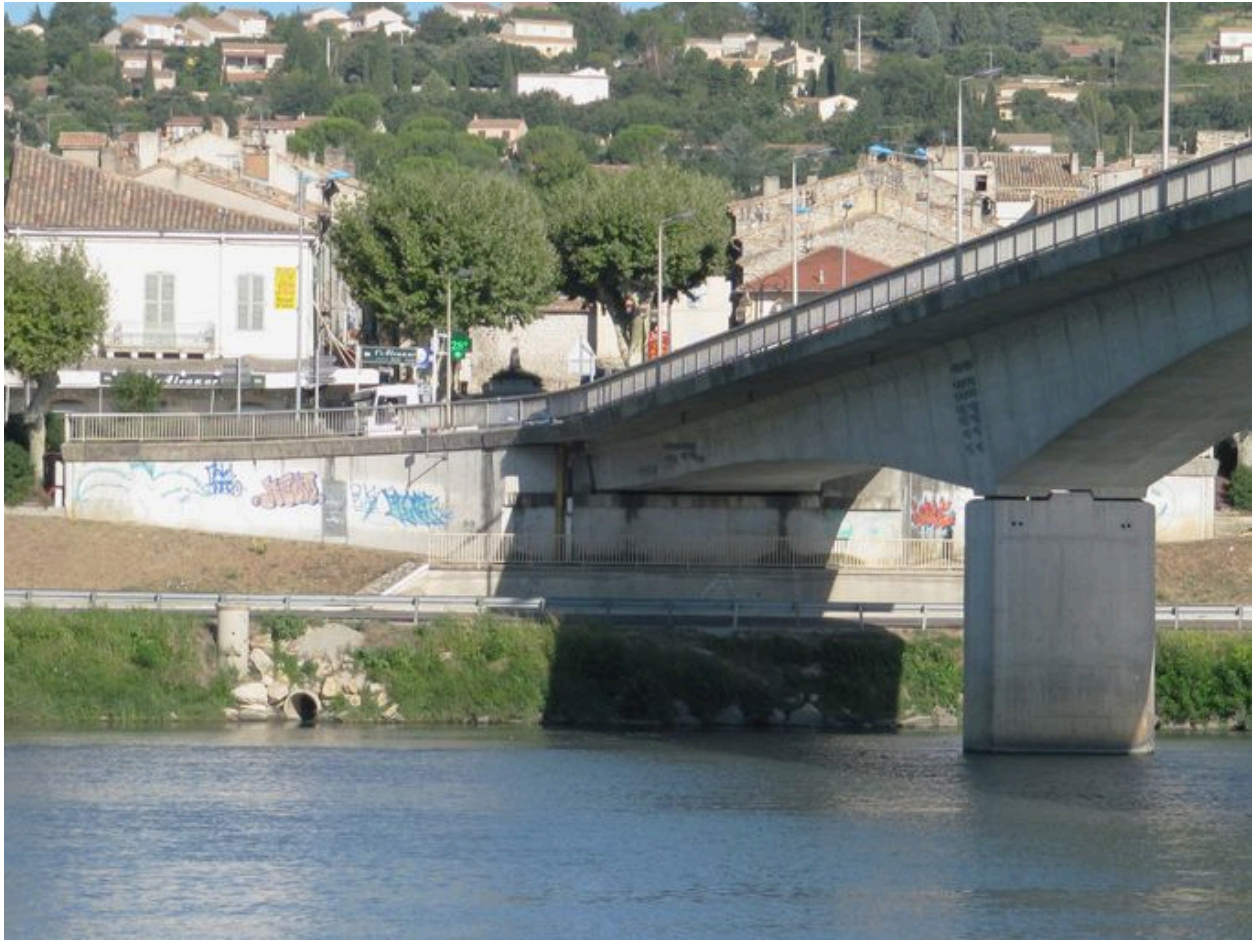
Culée et travée droite, face aval, vue générale (depuis la rive gauche)