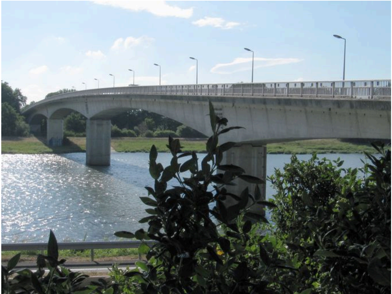
Vue partielle, de côté, face amont (depuis la rive droite)