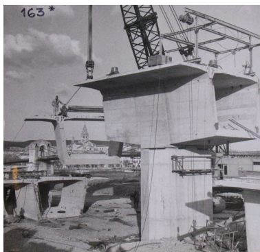
[La construction du nouveau pont de Bourg-Saint-Andéol]. [12/1970]. 1 fotogr. pos. n. et b. (AD Ardèche. 25 Fi 96, n°163) 1_ IVR82_20100700079NUCAB