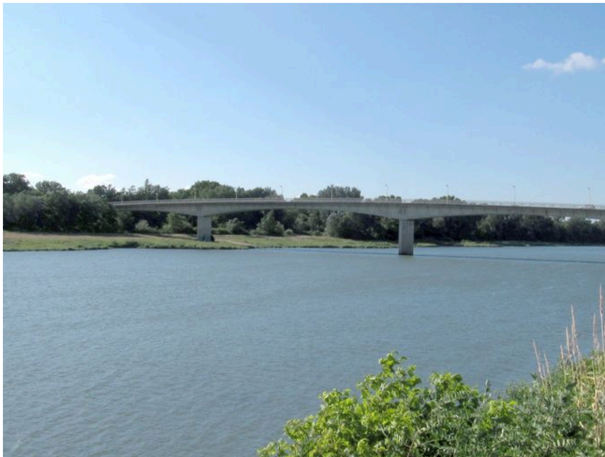
Vue partielle, face amont (depuis la rive droite)