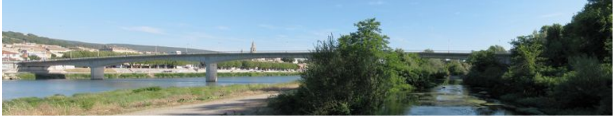
Vue panoramique, face aval (depuis la rive gauche)