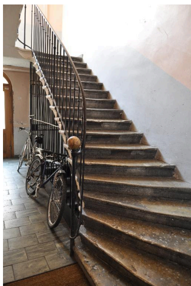
Vue intérieure : départ de l'escalier IVR84_20166902237NUCA