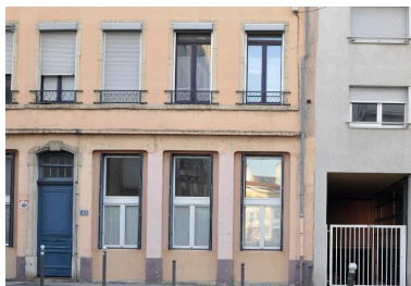
Vue du rez-de-chaussée et des piliers de l'ancienne boutique