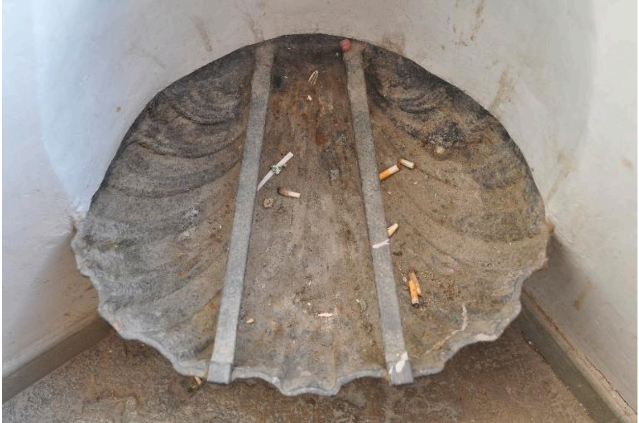
Vasque placée dans l'angle des repos de l'escalier