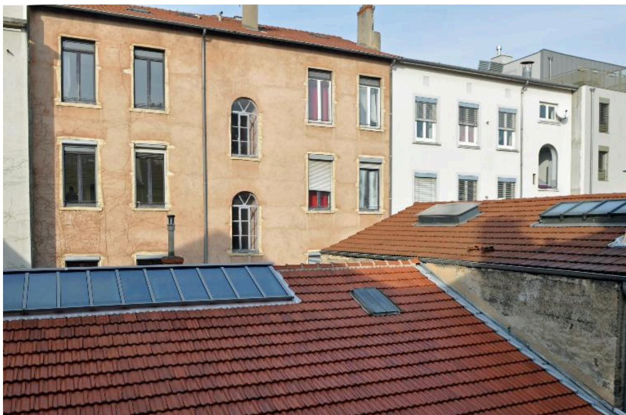
Élévation sur cour, vue partielle