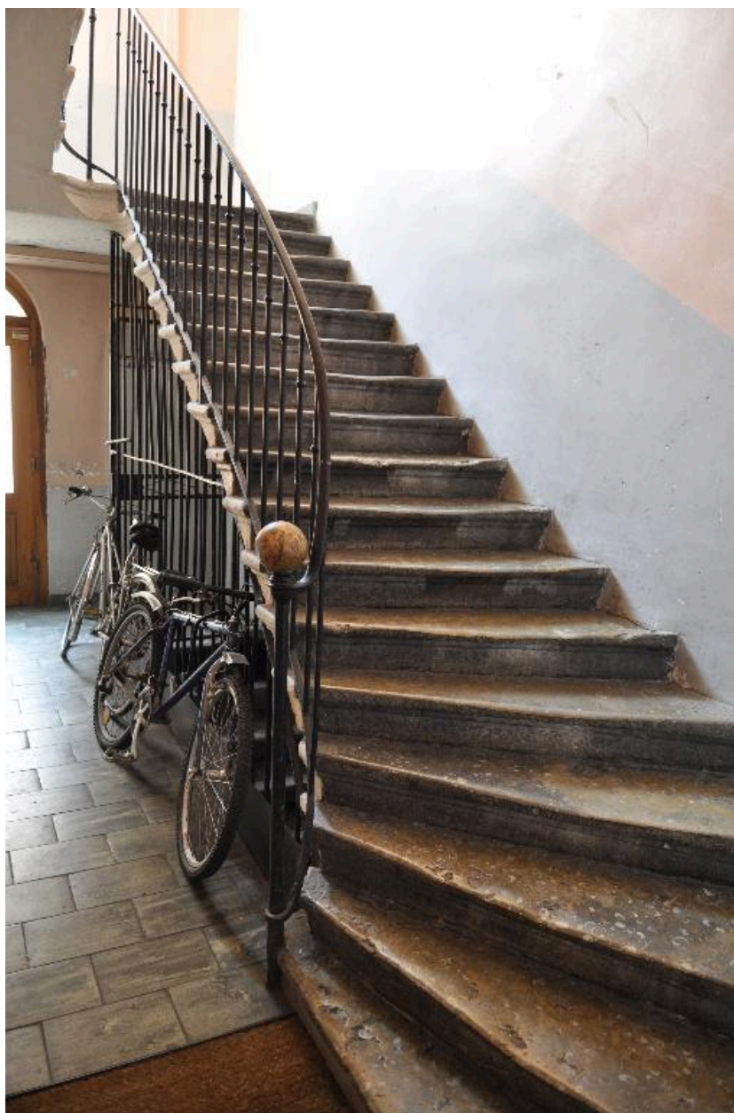
Vue intérieure : départ de l'escalier