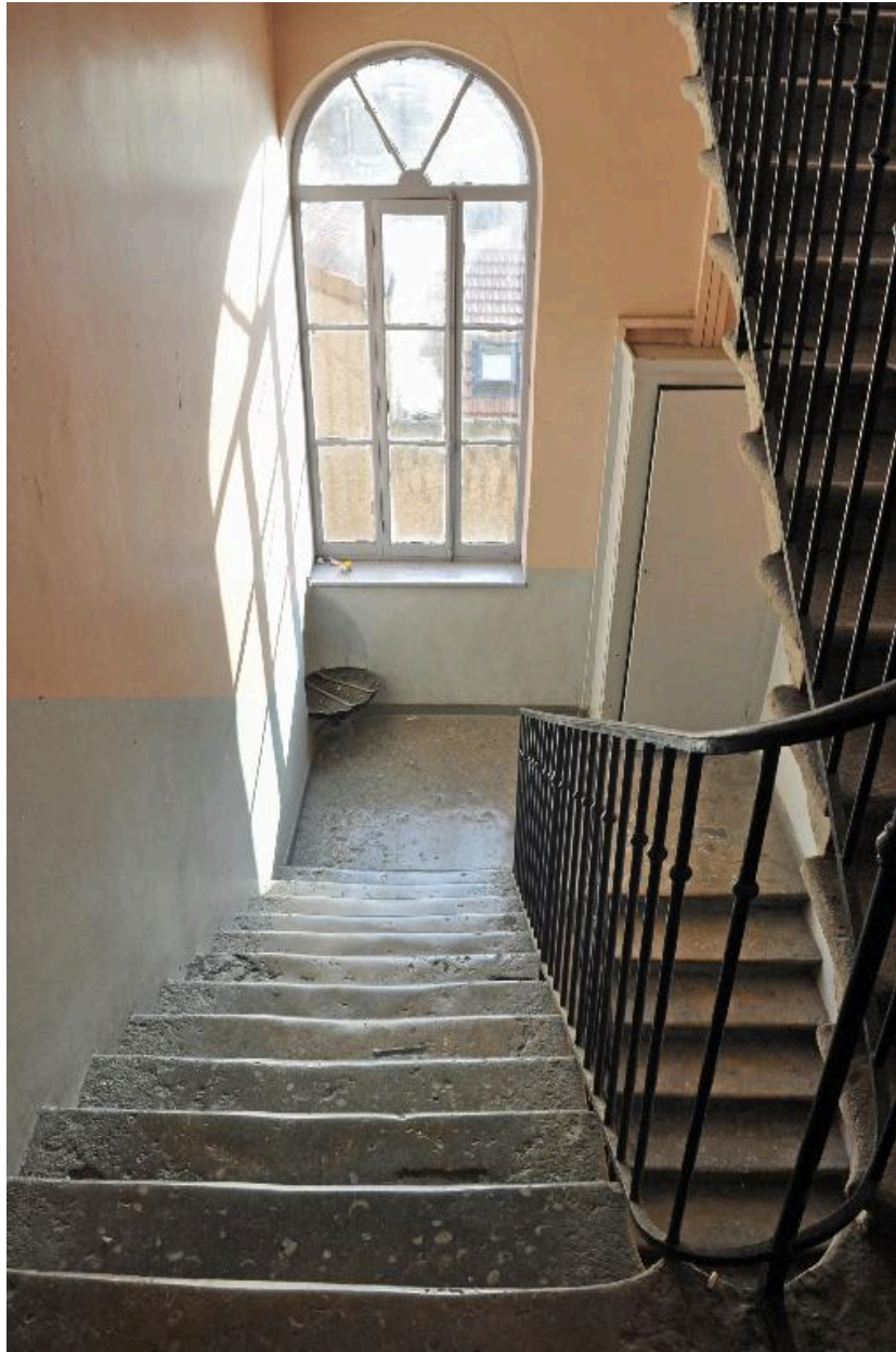
Vue intérieure : cage d'escalier, anciennement ouverte