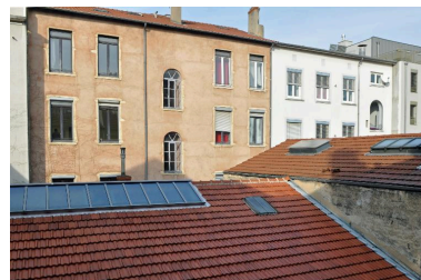
Elévation sur cour, vue partielle IVR84_20166902236NUCA