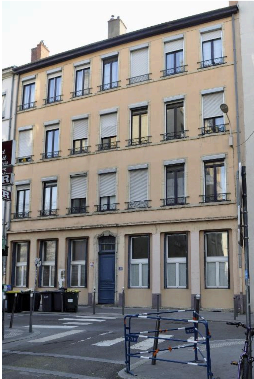
Elévation sur rue