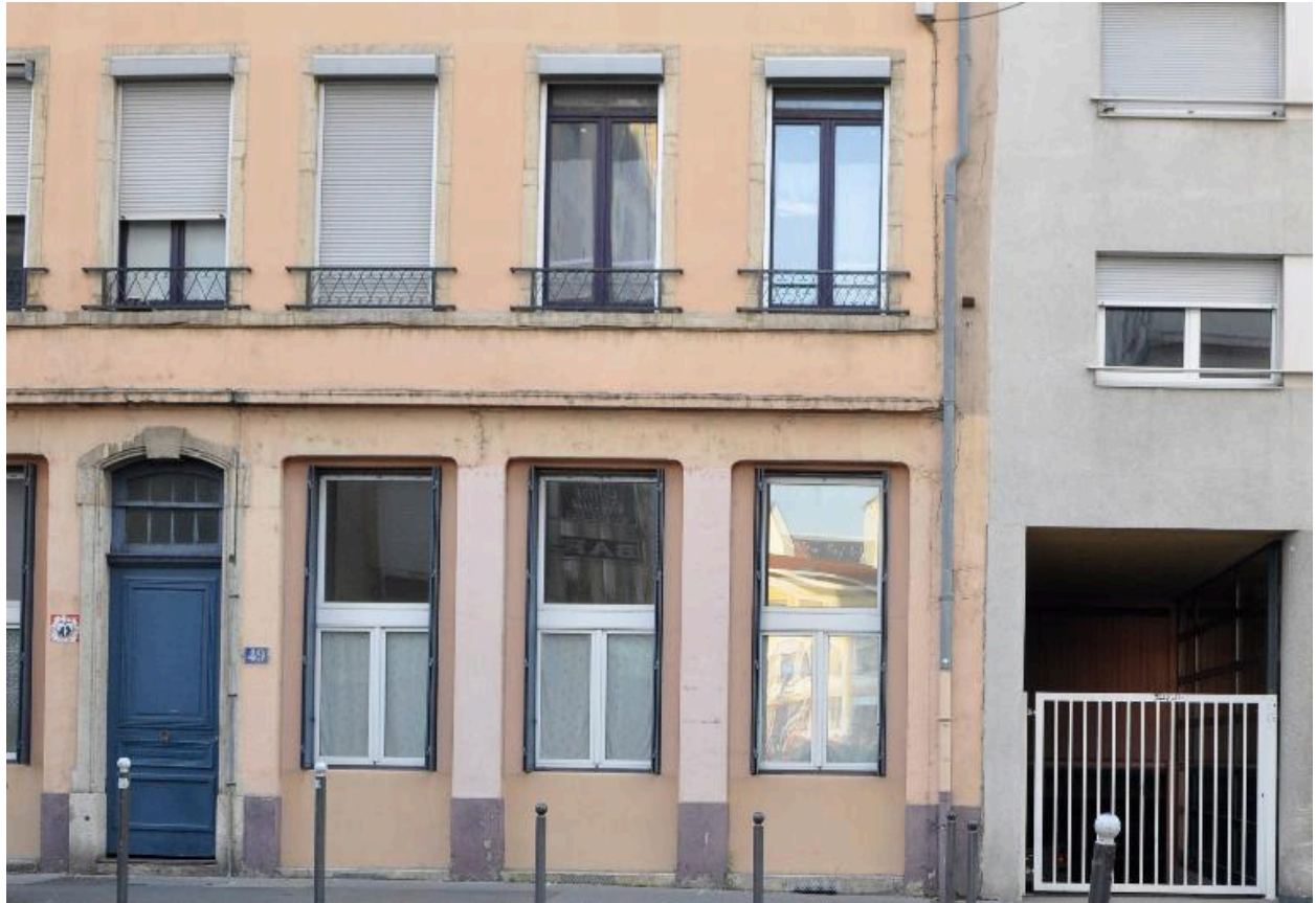
Vue du rez-de-chaussée et des piliers de l'ancienne boutique