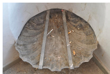
Vasque placée dans l'angle des repos de l'escalier