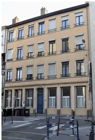
Elévation sur rue IVR84_20166902234NUCA