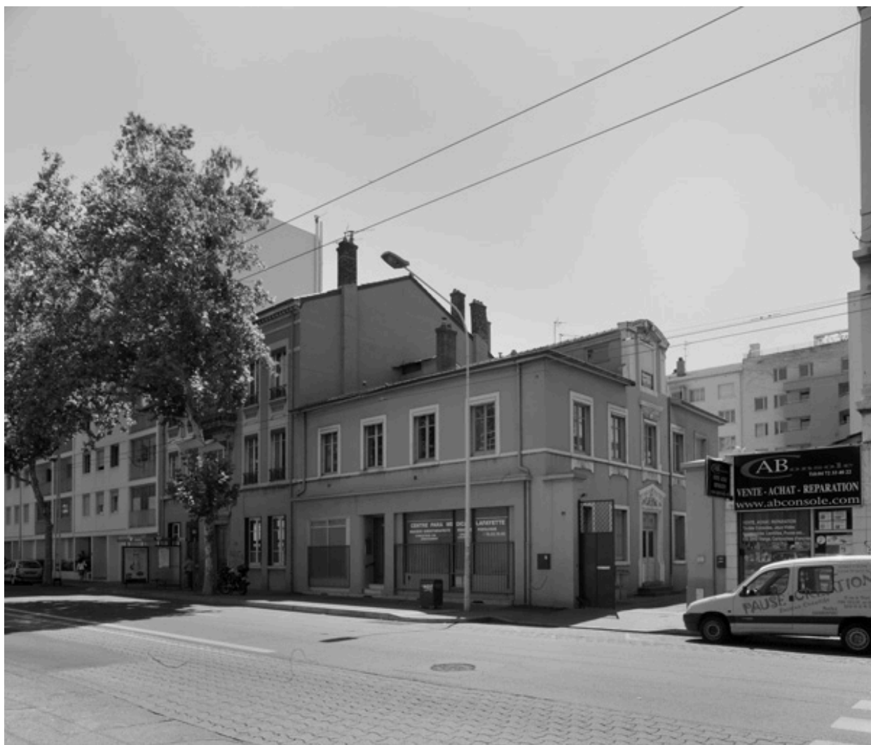
Vue d'ensemble nord-est