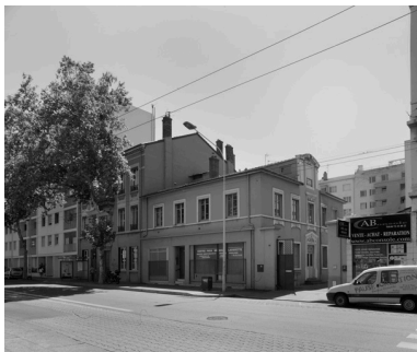
Vue d'ensemble nord-est IVR82_20056900136NUCA