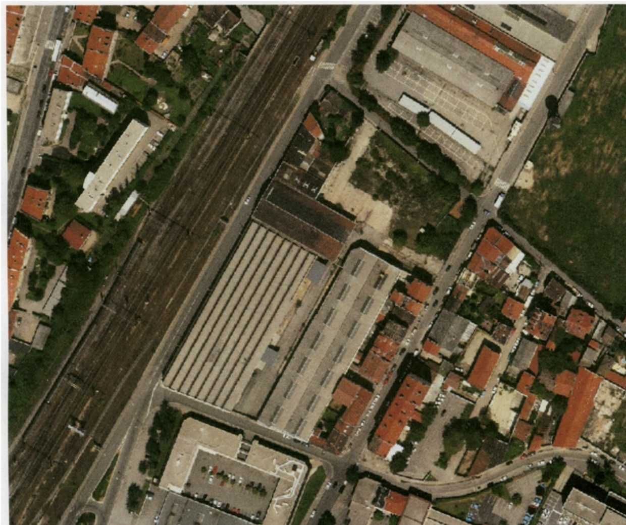
Vue zénithale des anciennes messageries lyonnaises (1997)