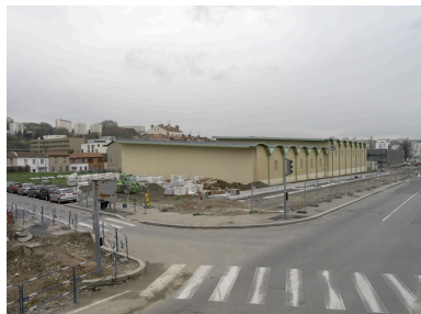
Vue générale nord-ouest IVR82_20086901030NUCA