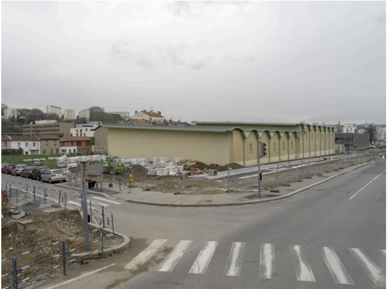
Vue générale nord-ouest