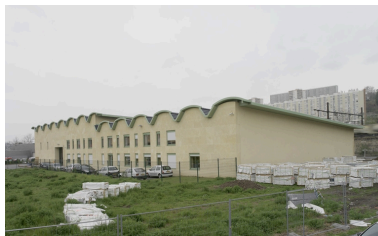
Façade nord IVR82_20086901031NUCA