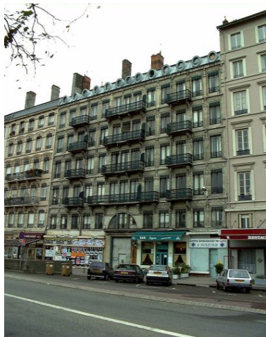
Elévation principale, cours de Verdun-Perrache IVR82_20006900604NUCA