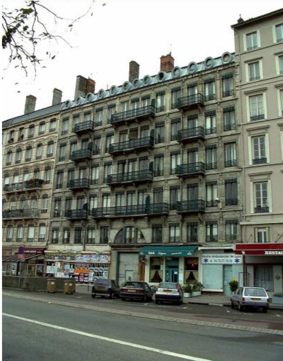
Elévation principale, cours de Verdun-Perrache