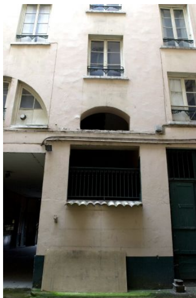
Vue de la travée d'escalier de l'immeuble sur rue IVR82_20016901705NUCA