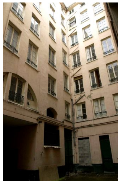
Vue de l'angle nord-est de la cour IVR82_20016901701NUCA