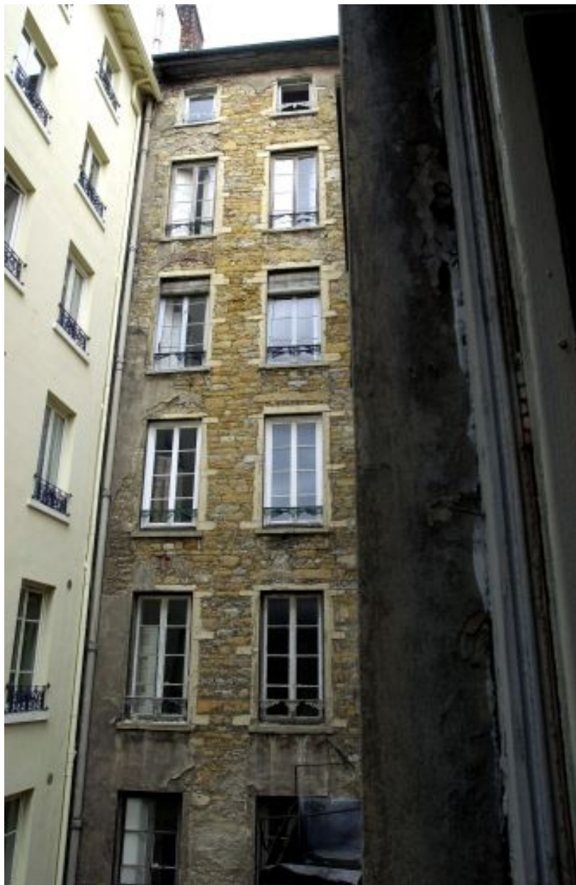
Elévation postérieure de la partie ouest de l'immeuble sur rue, au-dessus de la cour du 3 rue Delandine