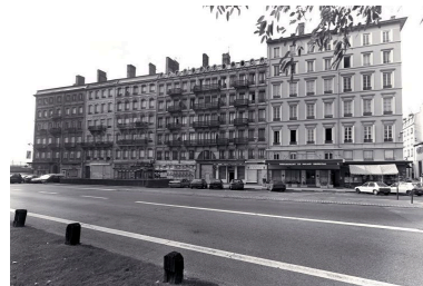
Vue d'ensemble des immeubles, 30-40 cours de Verdun-Perrache IVR82_20016902480V