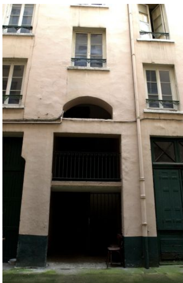
Vue de la travée d'escalier du corps de bâtiment en fond de cour IVR82_20016901707NUCA