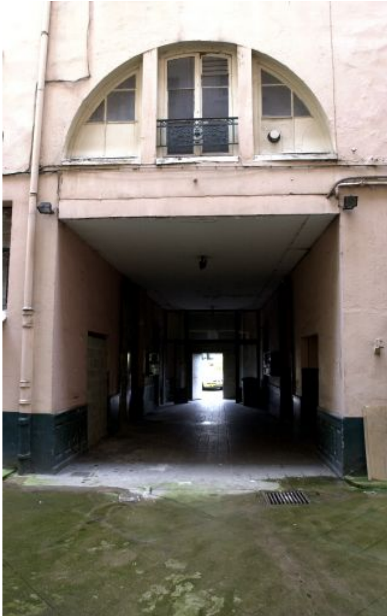
Vue du passage cocher depuis la cour