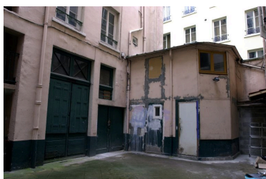
Vue de la loge de concierge dans l'angle sud-ouest de la cour IVR82_20016901706NUCA