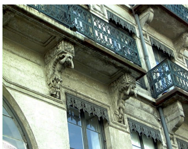
Détail du balcon et de ses supports, à droite