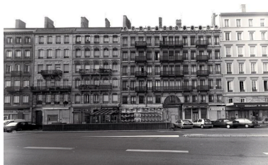
Elévation principale