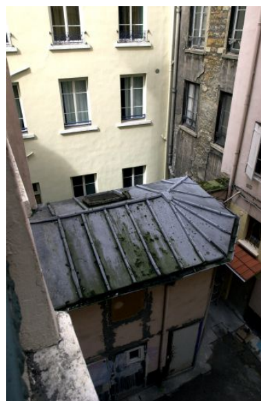
Vue de la loge de concierge depuis l'escalier IVR82_20016901708NUCA