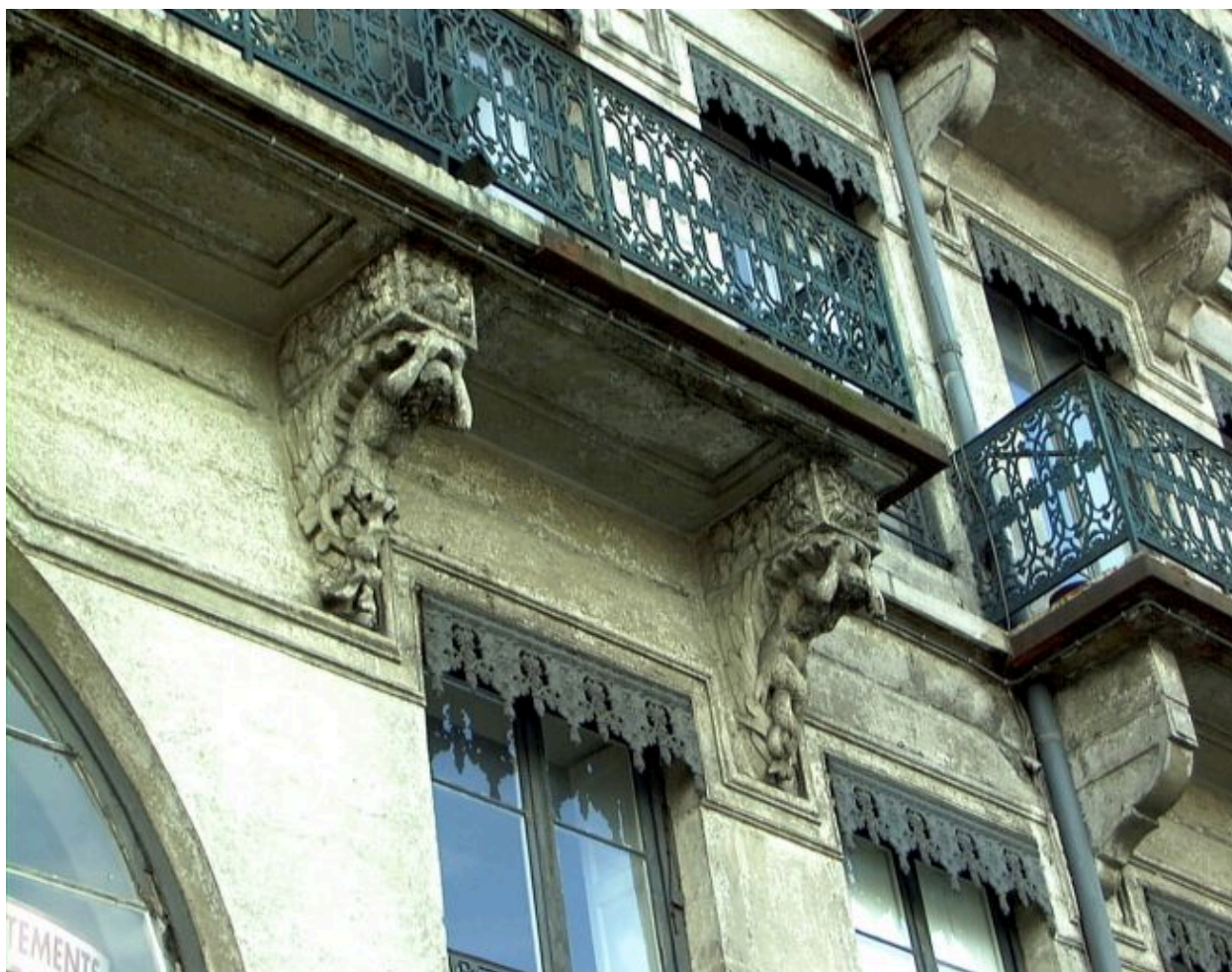
Détail du balcon et de ses supports, à droite