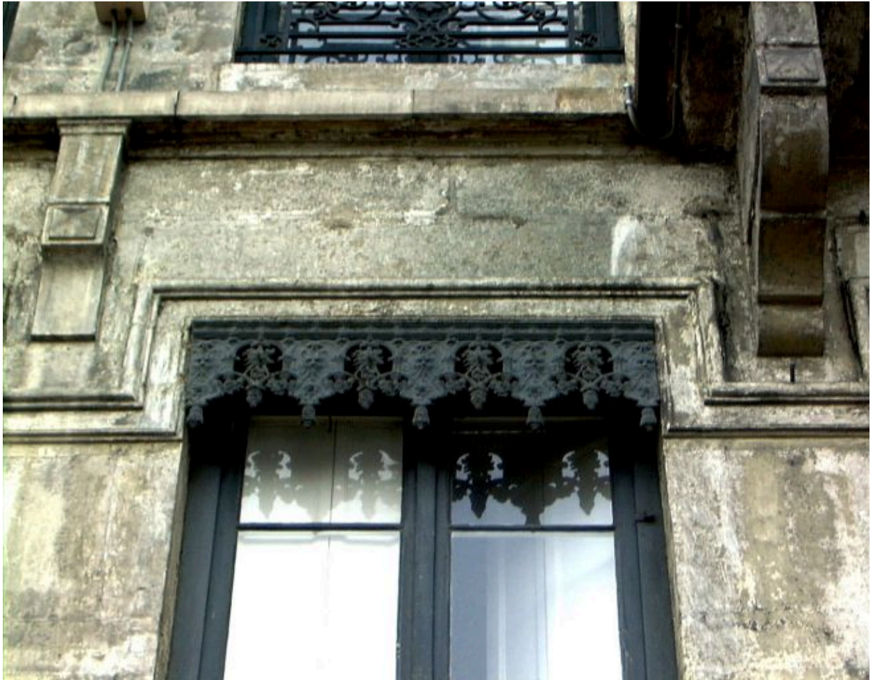
Détail d'un lambrequin