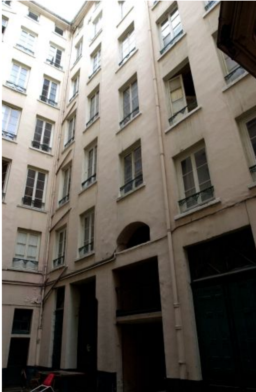
Vue de l'angle nord-ouest de la cour