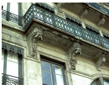
Détail du balcon et de ses supports, à gauche