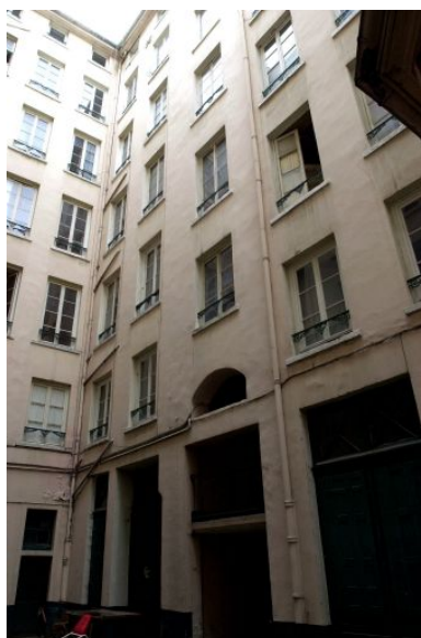
Vue de l'angle nord-ouest de la cour IVR82_20016901702NUCA