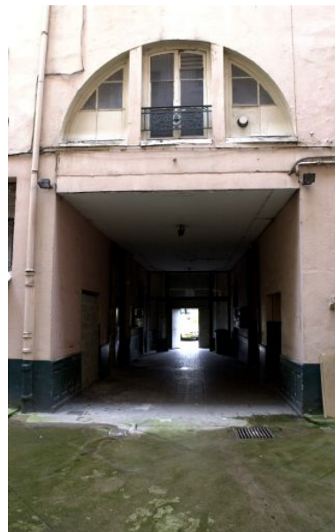
Vue du passage cocher depuis la cour IVR82_20016901704NUCA