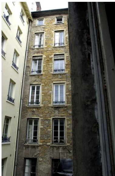
Elévation postérieure de la partie ouest de l'immeuble sur rue, au-dessus de la cour du 3 rue Delandine