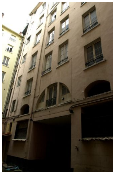
Elévation postérieure du corps de bâtiment sur rue IVR82_20016901703NUCA