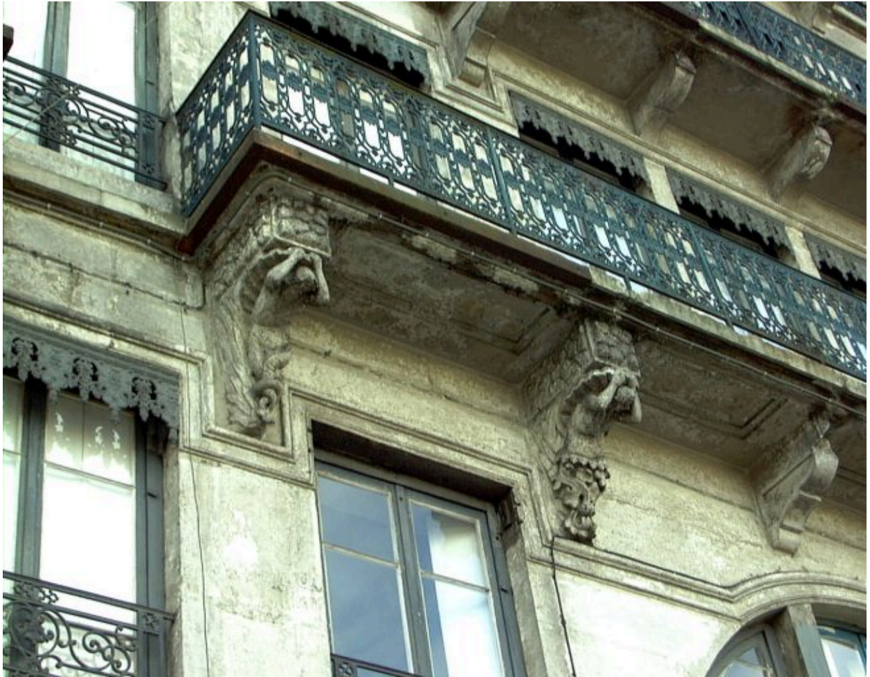
Détail du balcon et de ses supports, à gauche