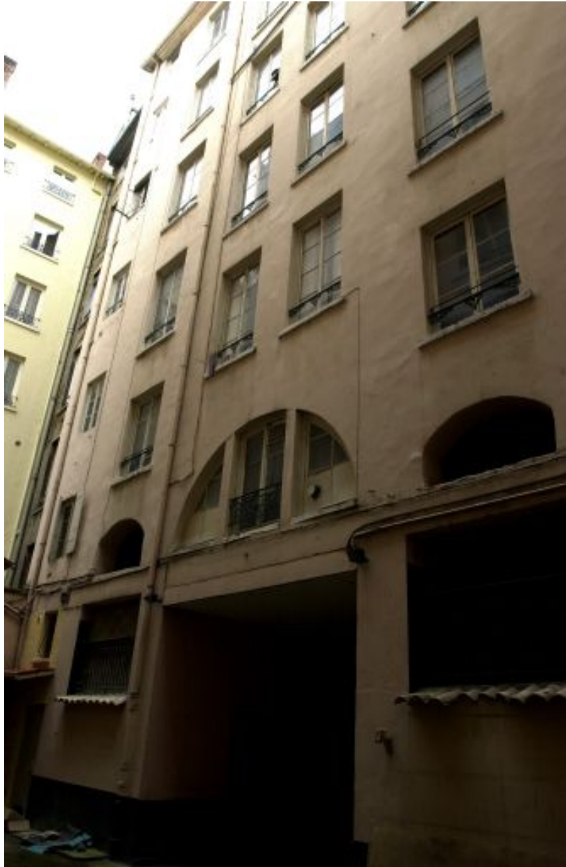
Elévation postérieure du corps de bâtiment sur rue