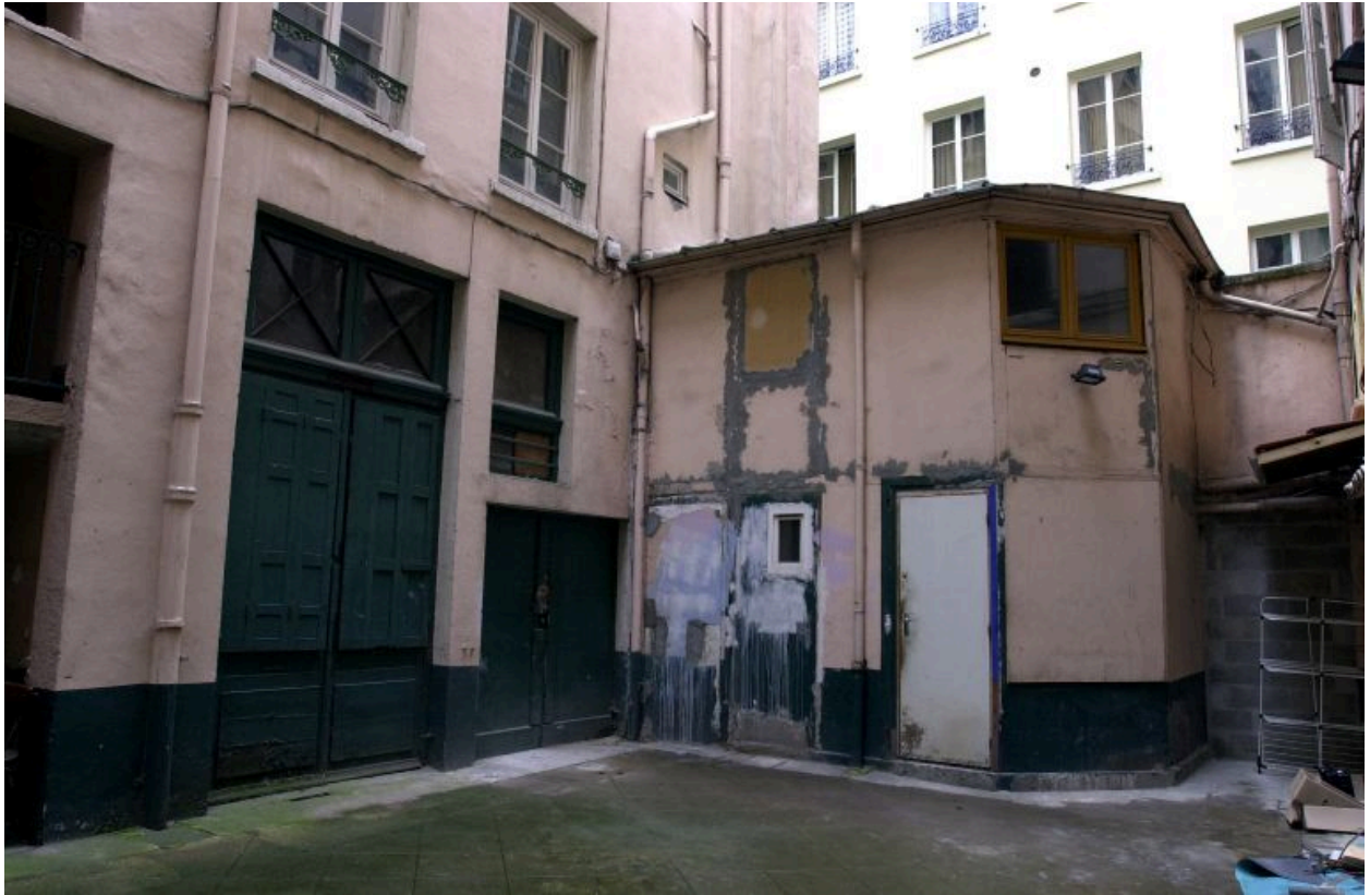
Vue de la loge de concierge dans l'angle sud-ouest de la cour