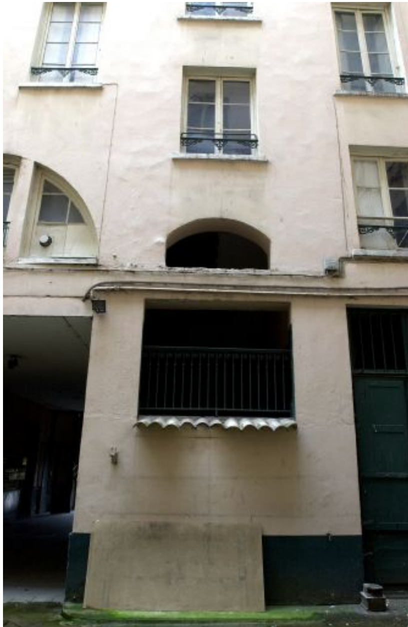
Vue de la travée d'escalier de l'immeuble sur rue