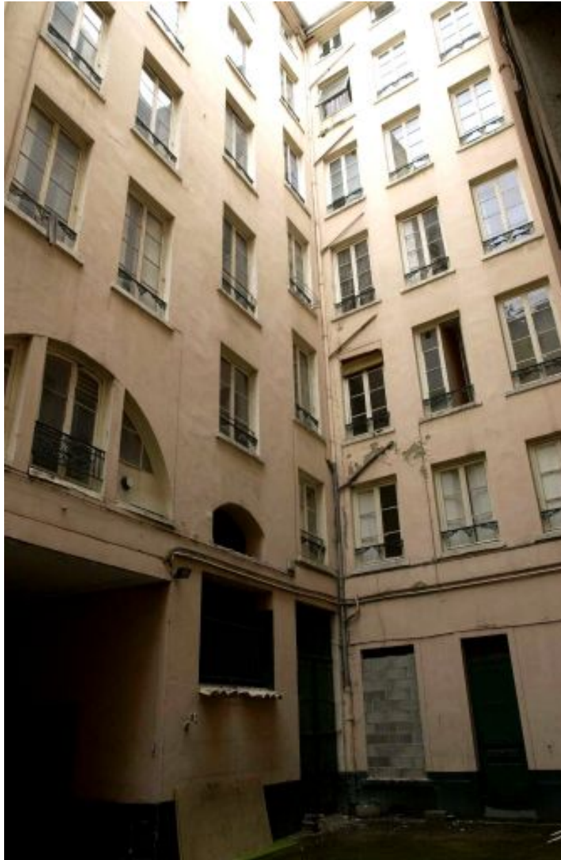
Vue de l'angle nord-est de la cour