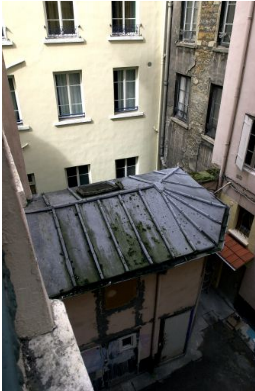
Vue de la loge de concierge depuis l'escalier