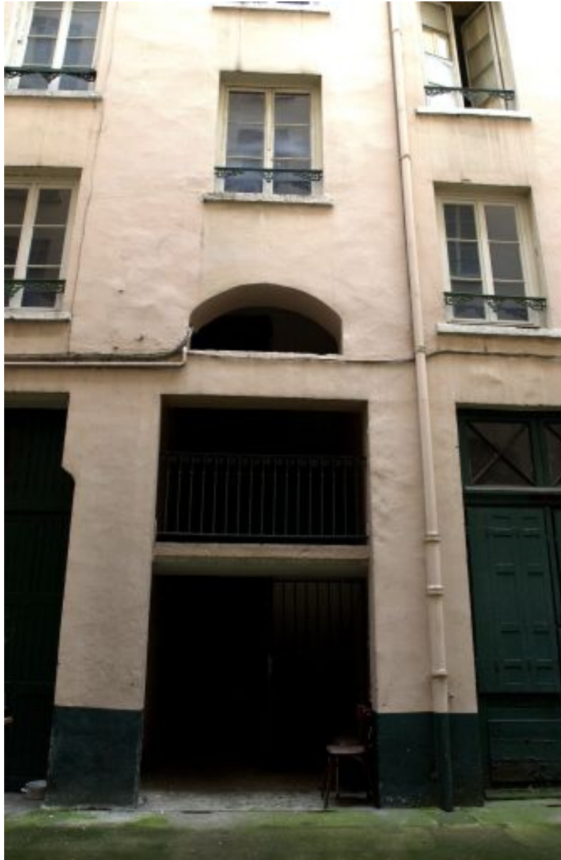
Vue de la travée d'escalier du corps de bâtiment en fond de cour