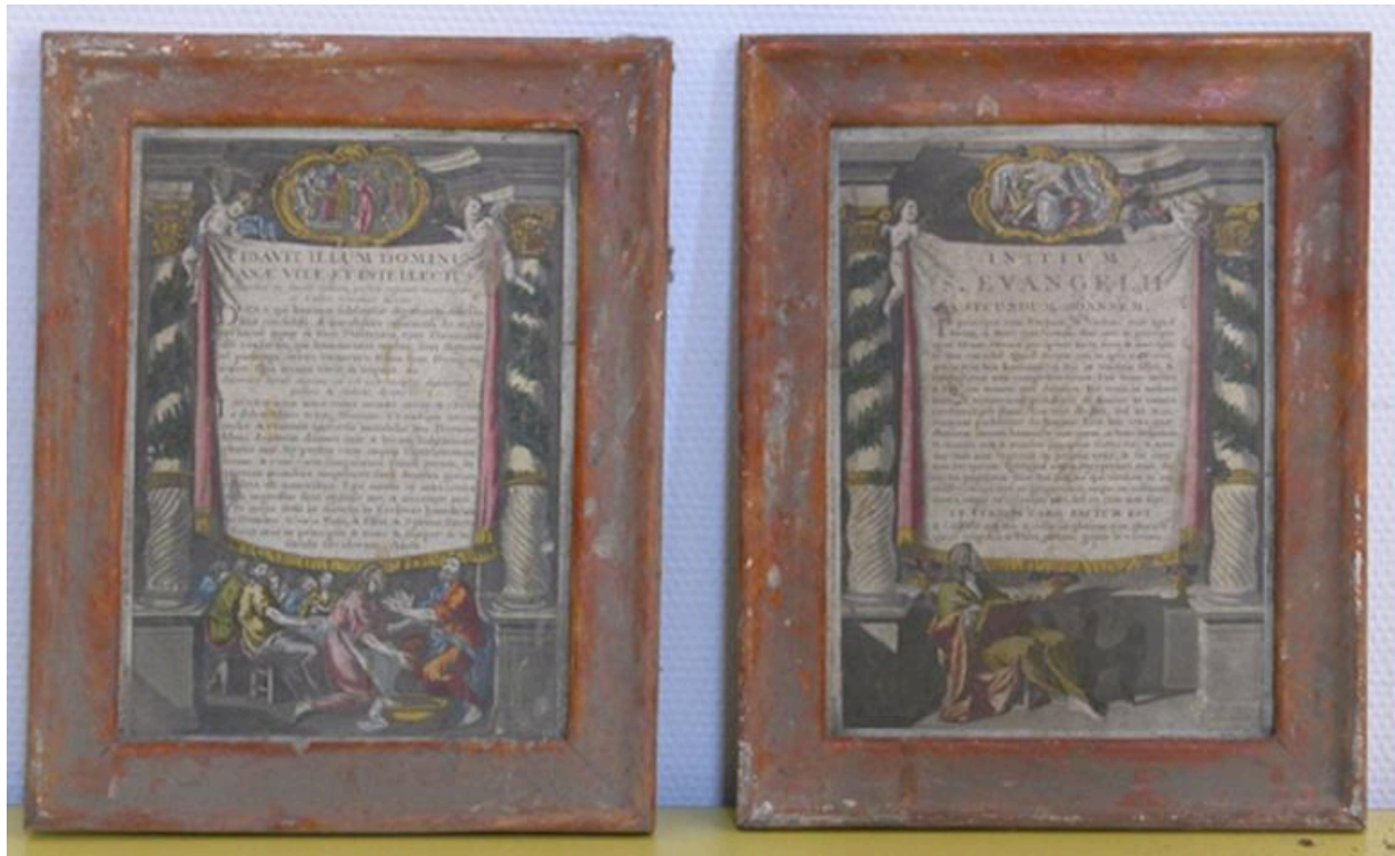
Vue générale de la paire de canons d'autel.