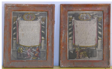
Vue générale de la paire de canons d'autel.