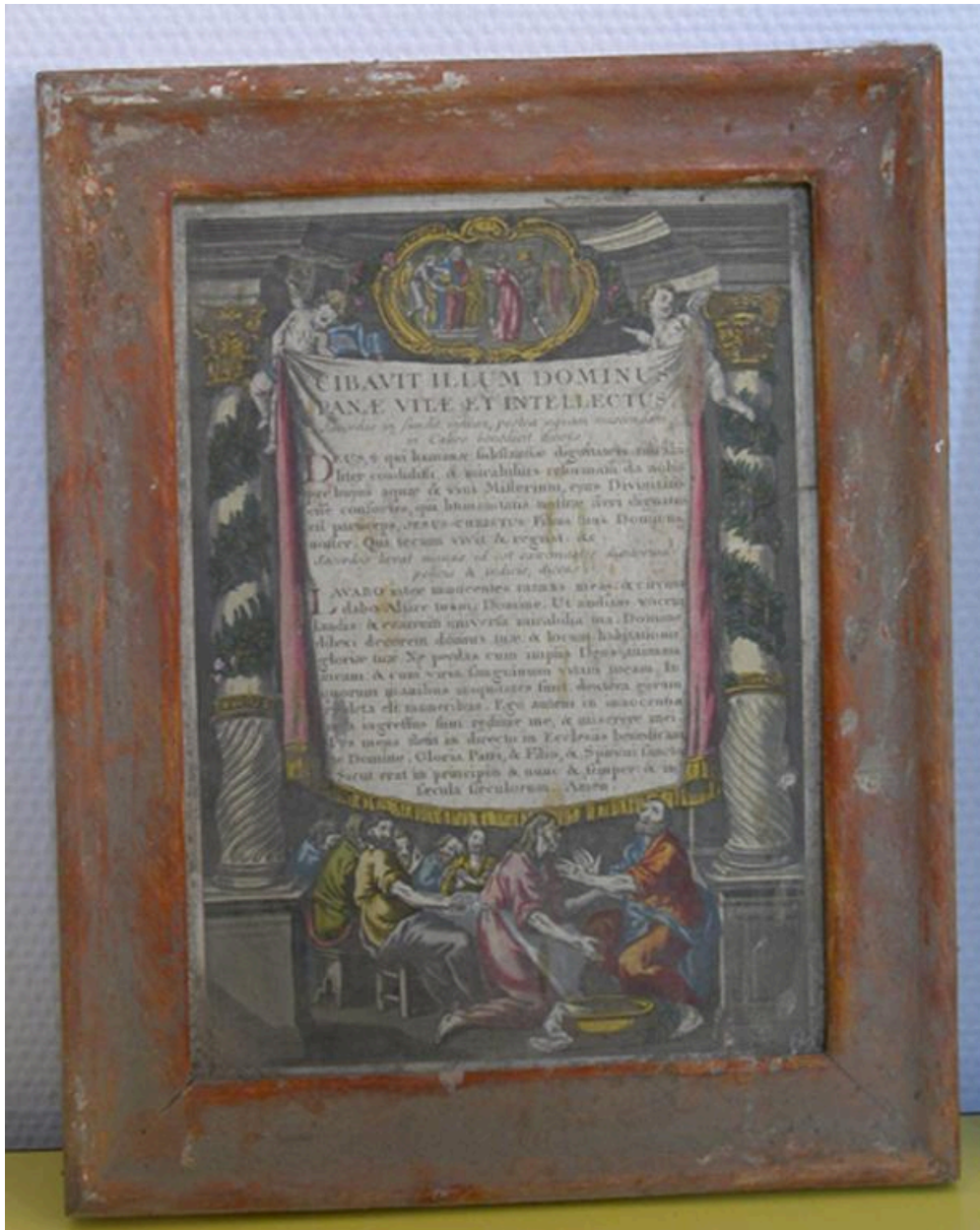
Vue du canon d'autel n°1.