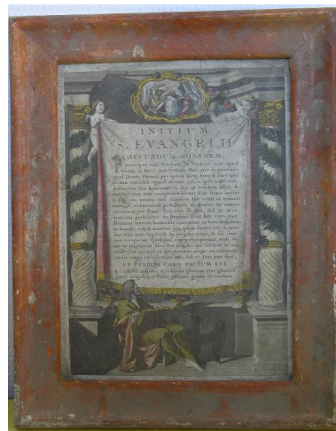
Vue du canon d'autel n°2 IVR83_20141500030NUCA