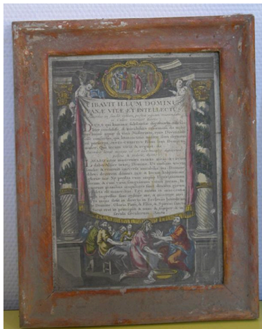
Vue du canon d'autel n°1. IVR83_20141500028NUCA