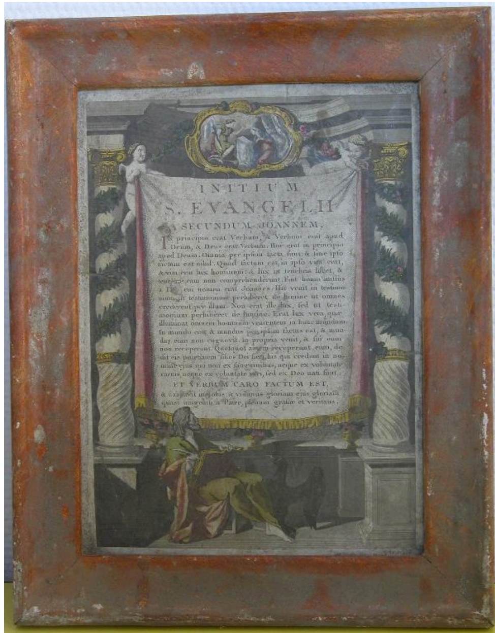
Vue du canon d'autel n°2