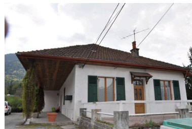
Mur gouttereau nord du bâtiment des bureaux de l'ancienne distillerie IVR82_20117401076NUCA