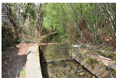
Section du ruisseau Fontaine avec grille ouvrant sur l'ancienne propriété de la distillerie Chevrier IVR82_20117401073NUCA