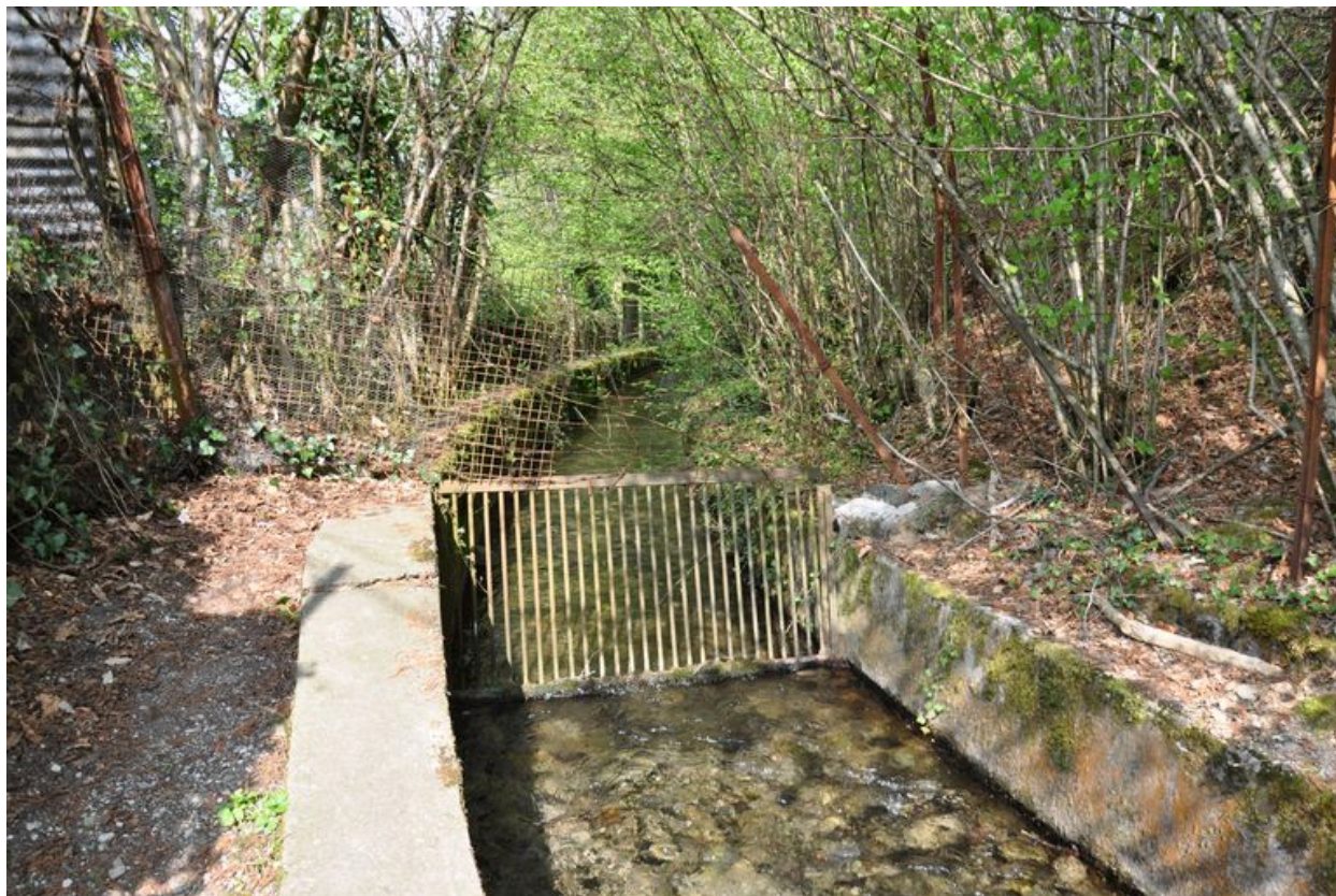
Section du ruisseau Fontaine avec grille ouvrant sur l'ancienne propriété de la distillerie Chevrier