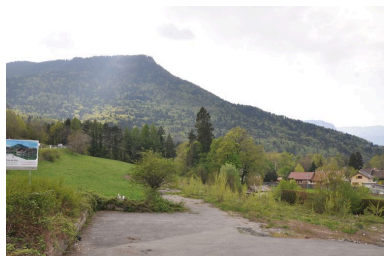
Friche de l'usine Chevrier IVR82_20117401074NUCA