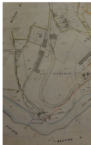
Extrait de la section F Feuille n °14 du cadastre de la commune de Faverges, 1945. Plan. Archives municipales de Faverges © Archives municipales de Faverges. 1 G 40 Phot. Samir Mahfoudi