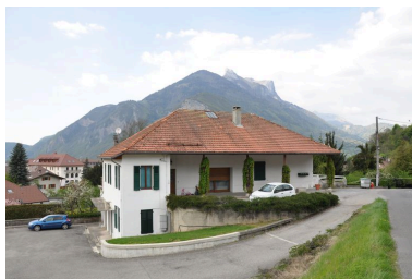
Façade antérieure est du bâtiment des bureaux de l'ancienne distillerie IVR82_20117401075NUCA