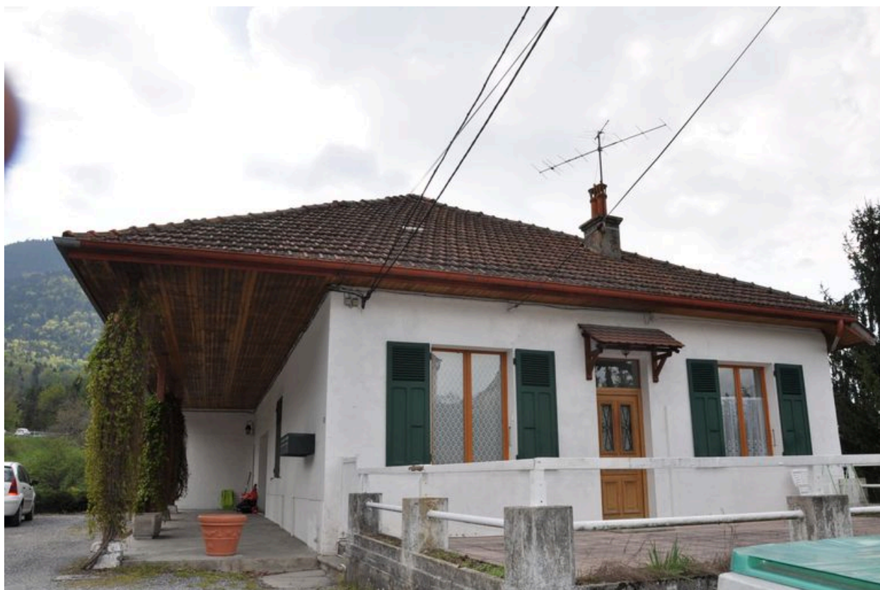
Mur gouttereau nord du bâtiment des bureaux de l'ancienne distillerie