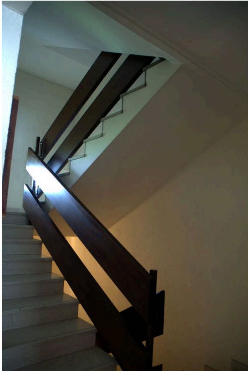
Départ de l'escalier