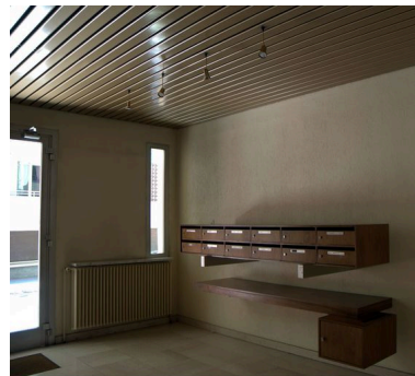
Hall d'entrée