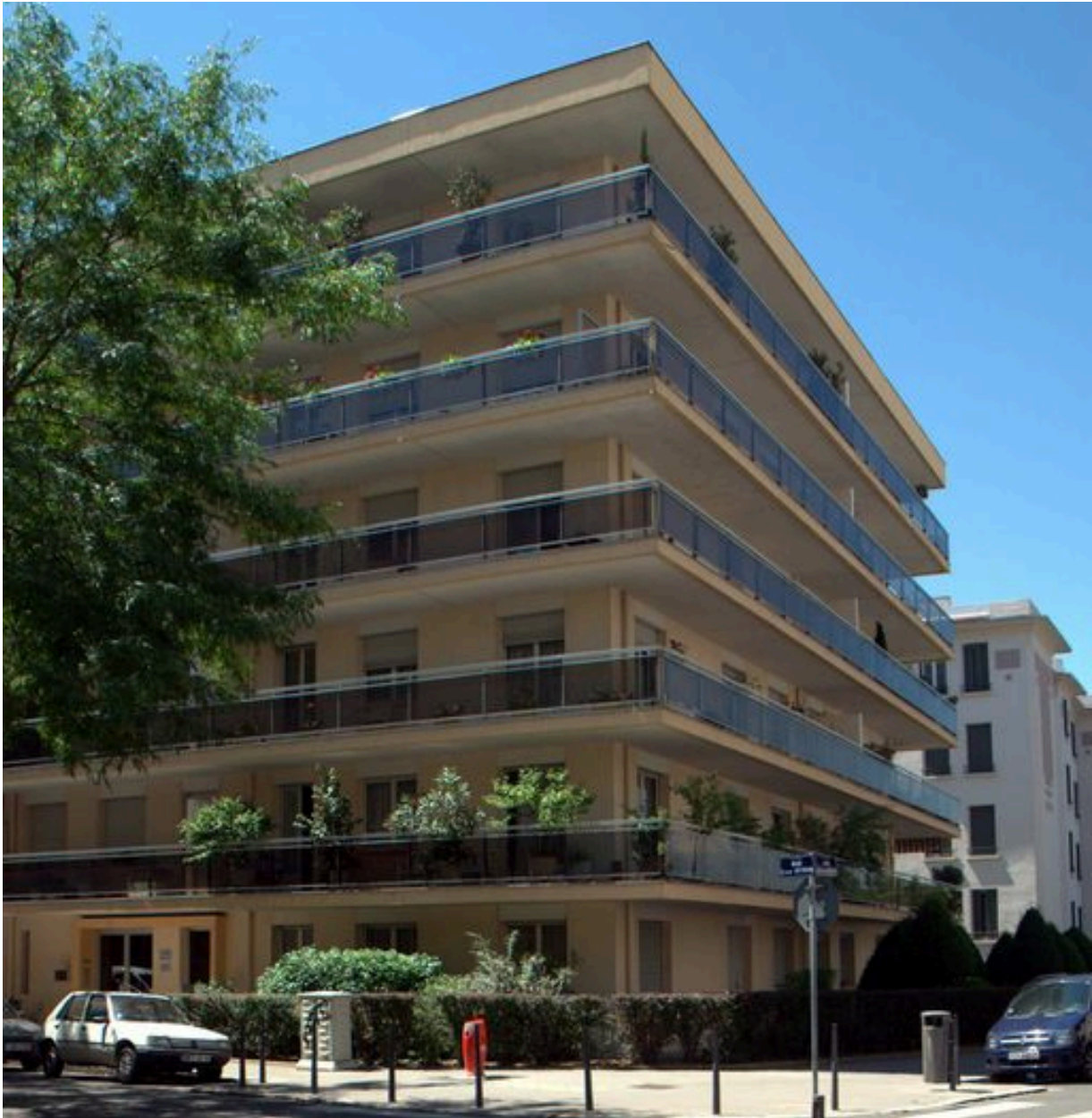
Vue de l'élévation, angle de la rue du Docteur-Crestin et de celle Claude-Veyron