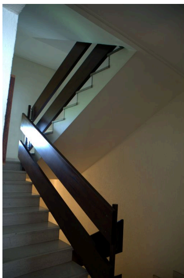
Départ de l'escalier IVR82_20116901578NUCA