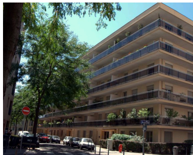
Vue générale IVR82_20116901574NUCA