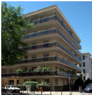
Vue de l'élévation, angle de la rue du Docteur-Crestin et de celle Claude-Veyron IVR82_20116901575NUCA