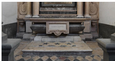
Autel et rétable, partie inférieure IVR82_20136901798NUCA