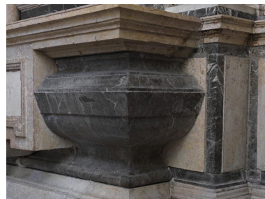
Autel, détail IVR82_20136901799NUCA