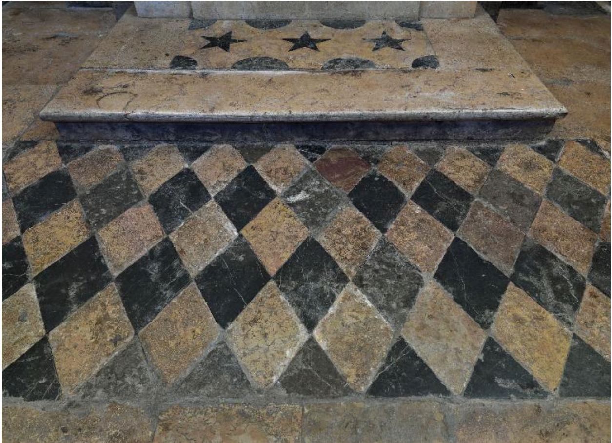
Détail du dallage