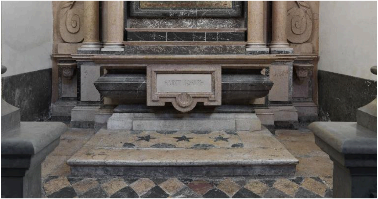
Autel et rétable, partie inférieure