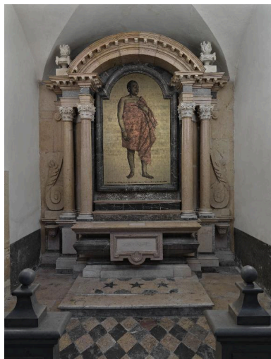
Vue générale IVR82_20136901797NUCAQ