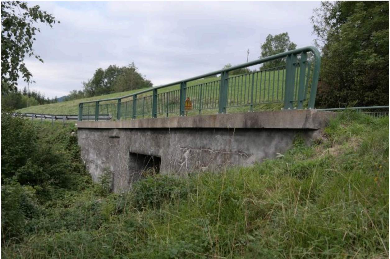
Pont de la Corbassière, vue de la face aval