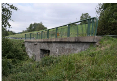
Pont de la Corbassière, vue de la face aval IVR84_20197401218NUCA