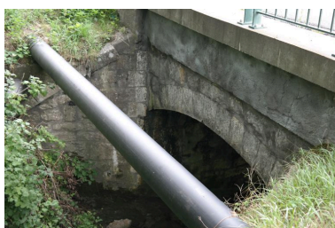
Pont de la Corbassière, détail de la voûte IVR84_20207401243NUCA