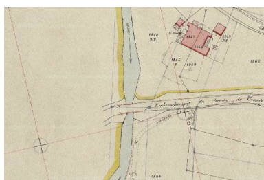
Extrait de la section A Feuille n°6 du cadastre de Chevenoz. 1920. IVR84_20207401240NUCA