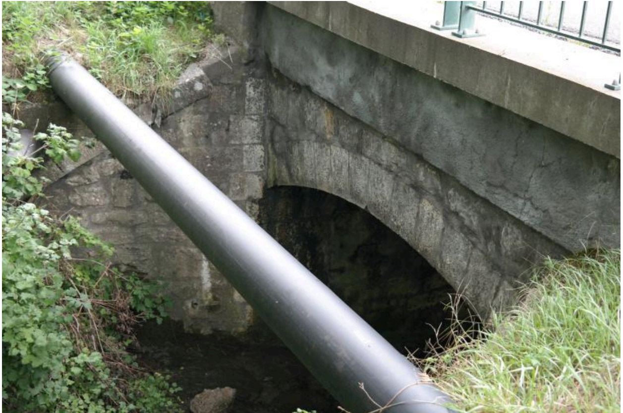
Pont de la Corbassière, détail de la voûte