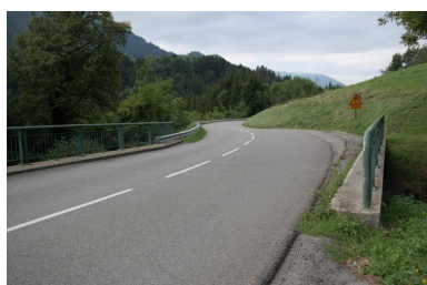
Pont de la Corbassière, vue de la chaussée et des gardes-corps