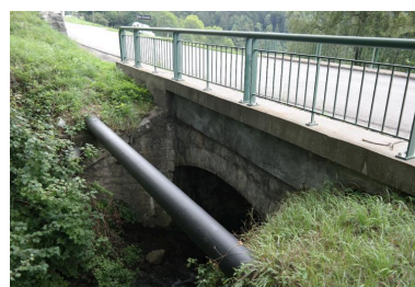
Pont de la Corbassière, vue de la face amont IVR84_20207401241NUCA