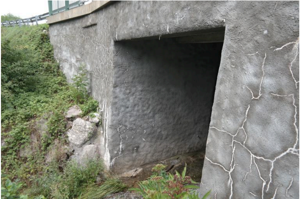
Pont de la Corbassière, détail de l'élargissement béton