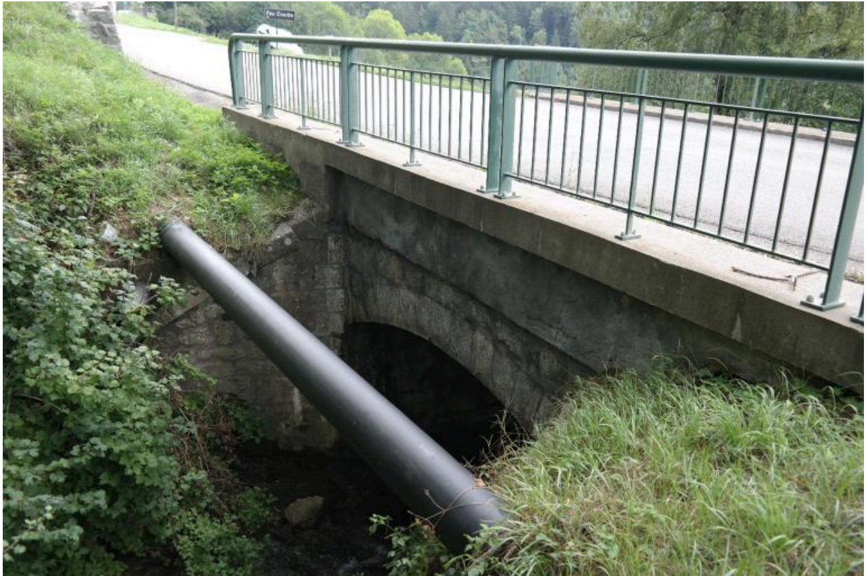
Pont de la Corbassière, vue de la face amont