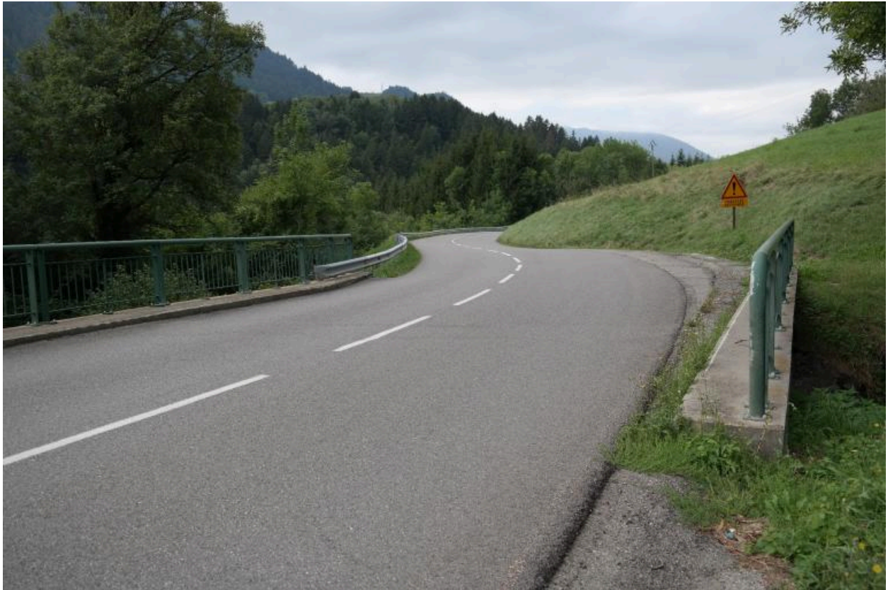
Pont de la Corbassière, vue de la chaussée et des gardes-corps