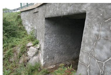
Pont de la Corbassière, détail de l'élargissement béton