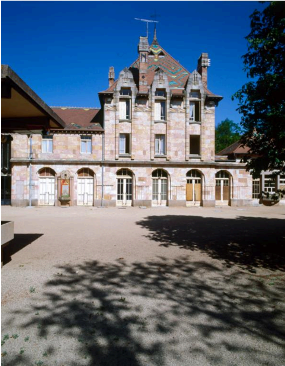
Détail de la façade ouest (en 1997) de la gare désaffectée de Nérís, du côté des anciennes voies.