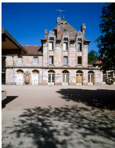
Détail de la façade ouest (en 1997) de la gare désaffectée de Nérís, du côté des anciennes voies.

IVR83_19970300078XA