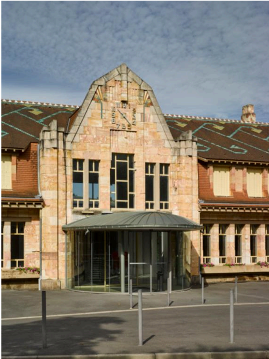
Détail (après réaménagement en centre socio-culturel) de l'ancienne entrée côté est, toujours surmontée de l'horloge de la gare.