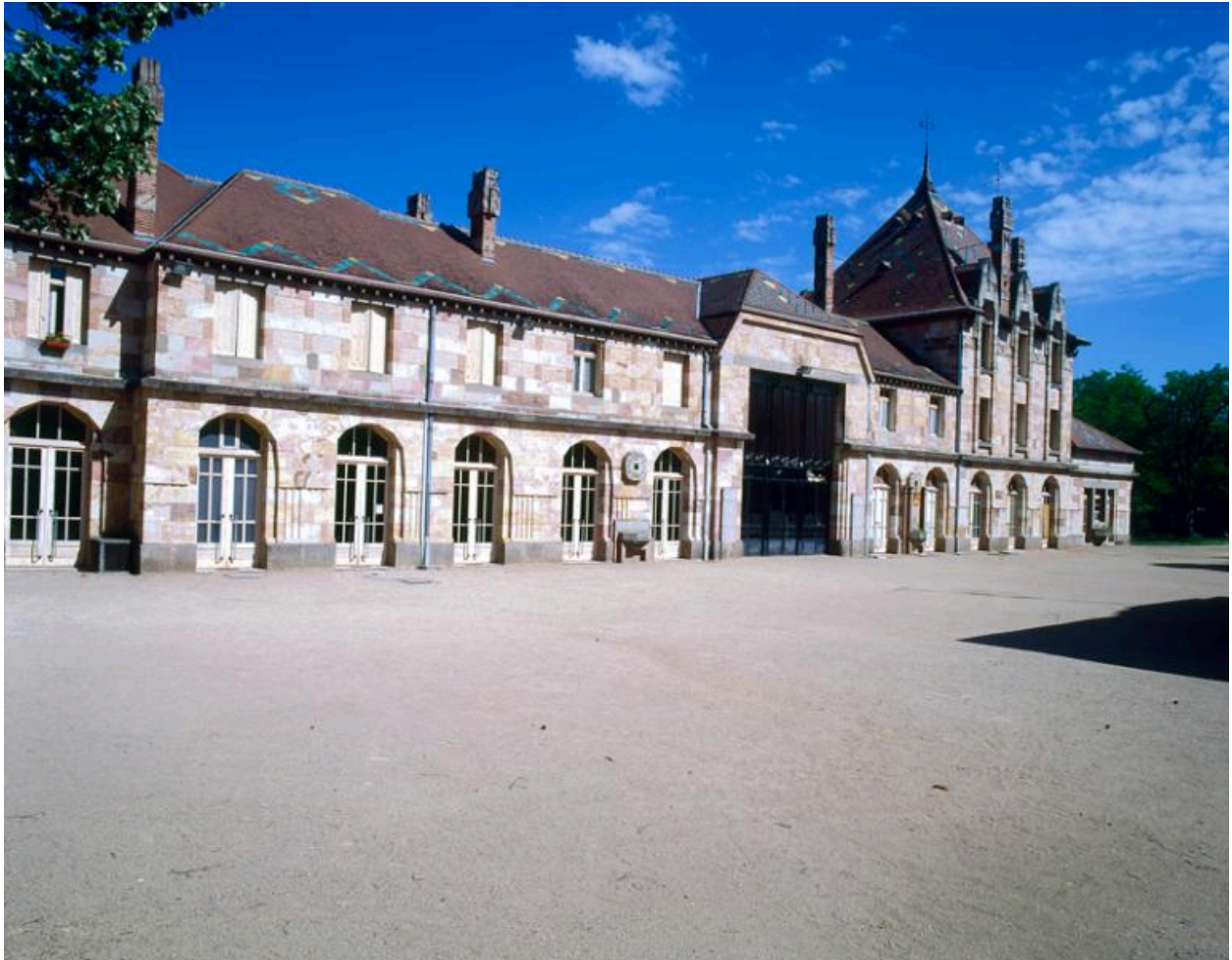
L'ancienne gare de Nérís-les-Bains en 1997 depuis l'emplacement des voies, côté ouest, avant réaménagement du bâtiment en centre socio-culturel.