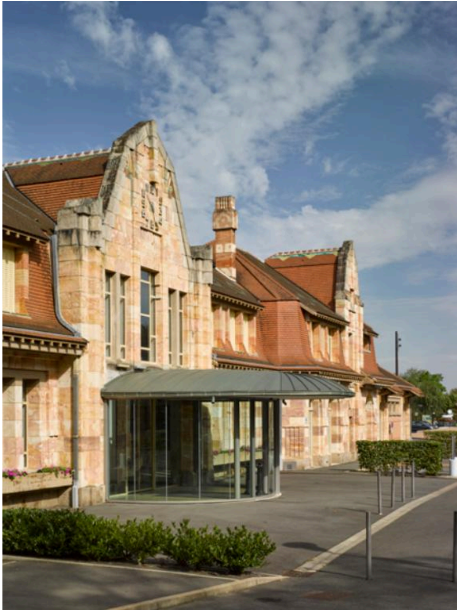
Détail de la façade est de la gare de Nérís (après réaménagement en centre socio-culturel), du côté de l'ancienne cour des voyageurs.