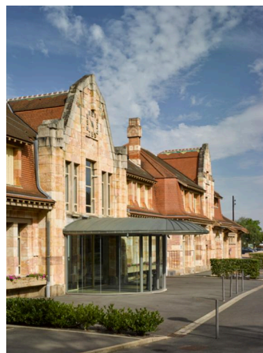
Détail de la façade est de la gare de Nérís (après réaménagement en centre socio-culturel), du côté de l'ancienne cour des voyageurs.

IVR83_19970300079XA