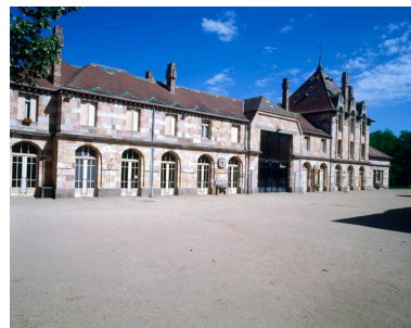
L'ancienne gare de Nérís-les-Bains en 1997 depuis l'emplacement des voies, côté ouest, avant réaménagement du bâtiment en centre socio-culturel.

IVR83_19970300080XA