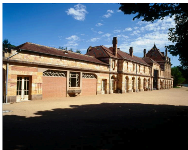
La gare de Nérís-les-Bains en 1997 depuis l'emplacement des anciennes voies, après désaffectation en tant que gare et avant réaménagement en centre socio-culturel.

Phot. Jean-Michel Périn IVR84_20160300133NUC4A