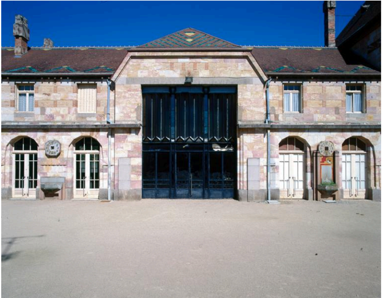
Détail de l'élévation arrière (ouest) de l'ancienne gare de Nérís-les-Bains en 1997, avant réaménagement en centre socio-culturel.