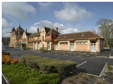
L'ancienne gare de Nérís-les-Bains devenue centre socio-culturel, côté cour des voyageurs, à l'est.

IVR84_20160300133NUC4A