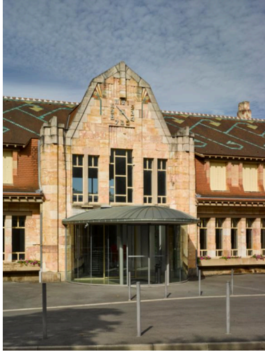
Détail (après réaménagement en centre socio-culturel) de l'ancienne entrée côté est, toujours surmontée de l'horloge de la gare. IVR84_20160300281NUC4A