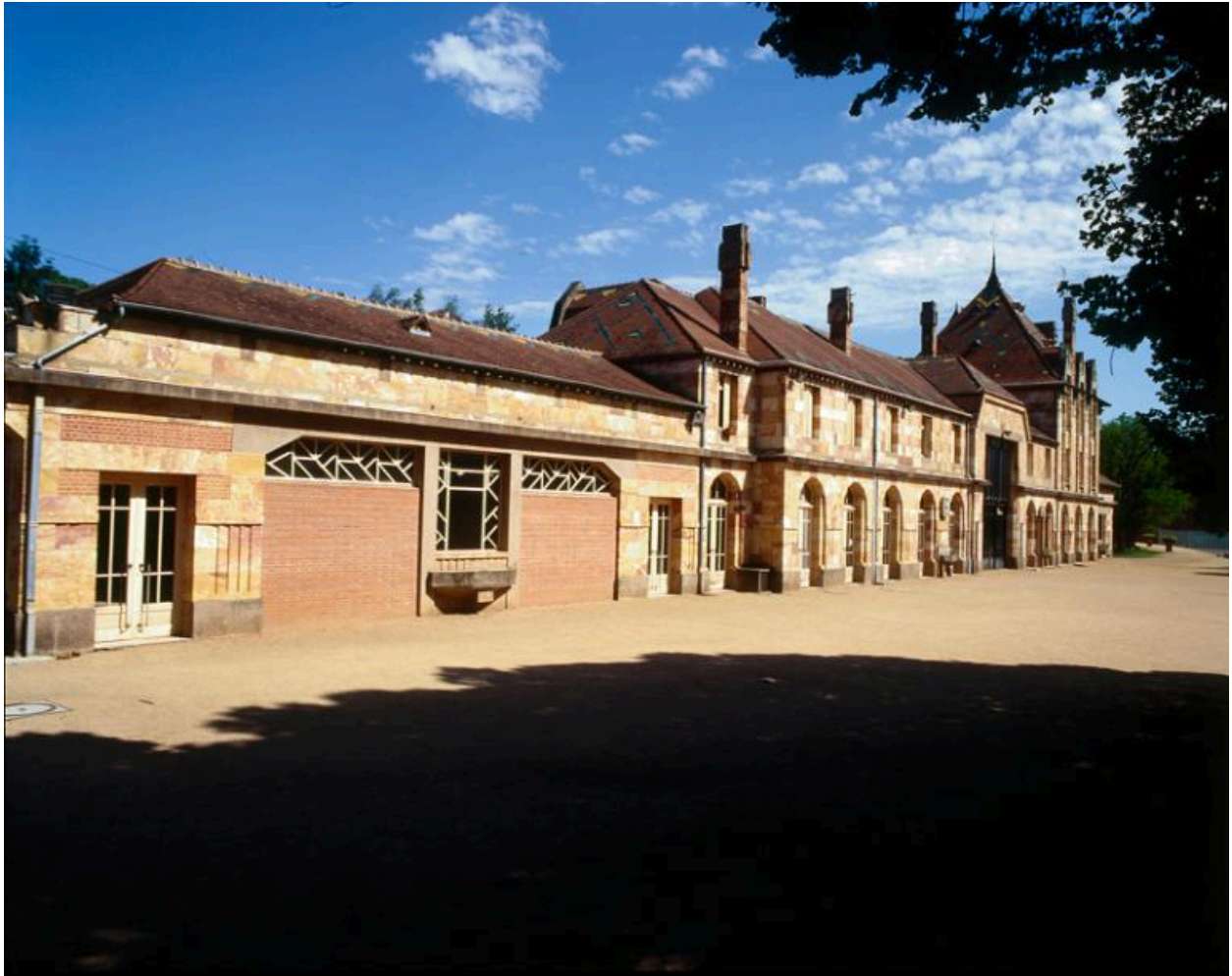
La gare de Nérís-les-Bains en 1997 depuis l'emplacement des anciennes voies, après désaffectation en tant que gare et avant réaménagement en centre socio-culturel.