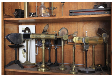
Vue d'ensemble des appareils. IVR82_20103800456NUCA