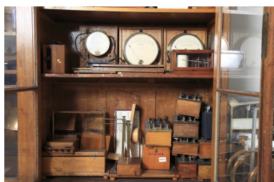
Vue d'ensemble des appareils. IVR82_20103800458NUCA