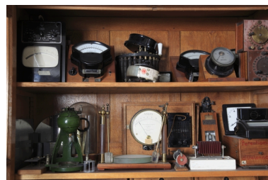
Vue d'ensemble des appareils.