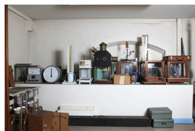
Vue d'ensemble des appareils. IVR82_20103800460NUCA