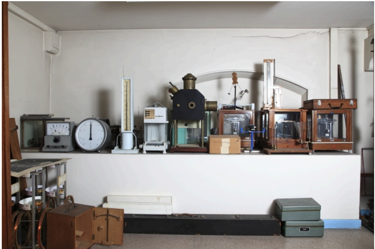
Vue d'ensemble des appareils.