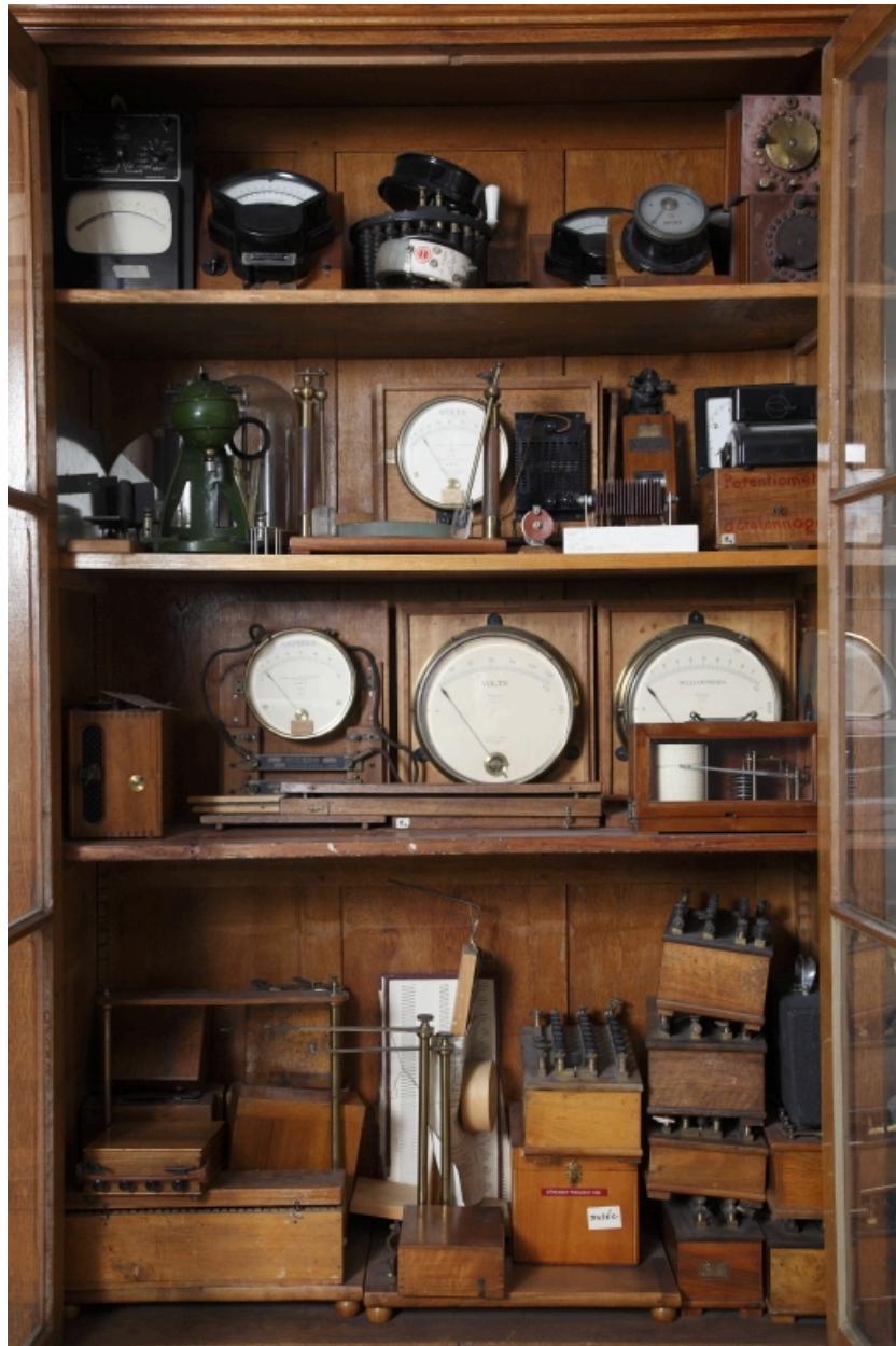
Vue d'ensemble des appareils.