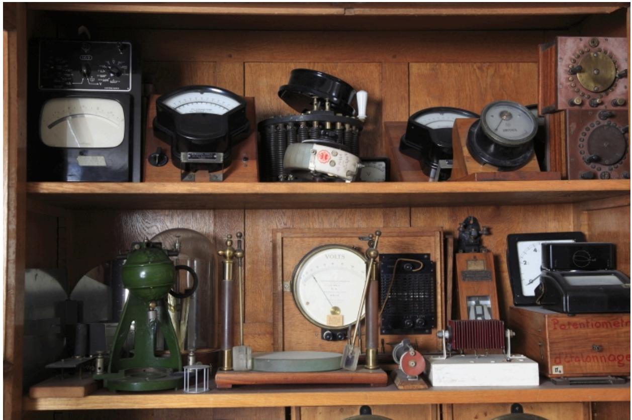
Vue d'ensemble des appareils.