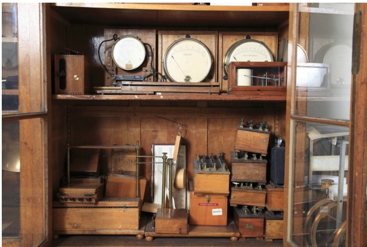
Vue d'ensemble des appareils.