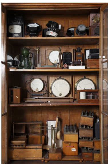
Vue d'ensemble des appareils.