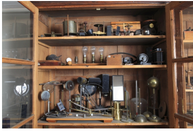
Vue d'ensemble des appareils. IVR82_20103800470NUCA