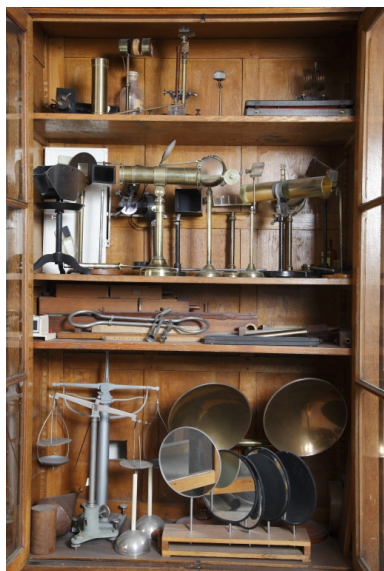
Vue générale IVR82_20103800455NUCA