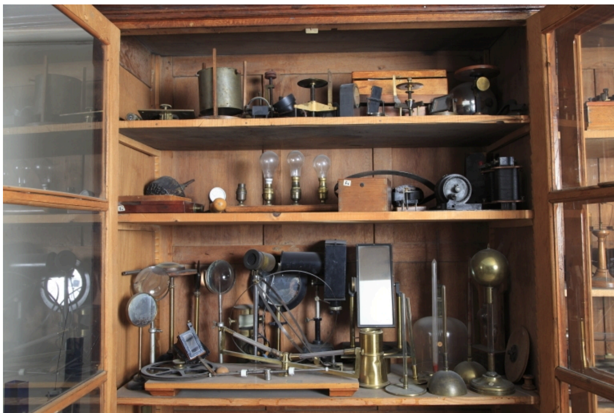
Vue d'ensemble des appareils.