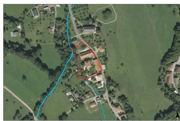
Photo aérienne 2011 IVR82_20117401389NUCA