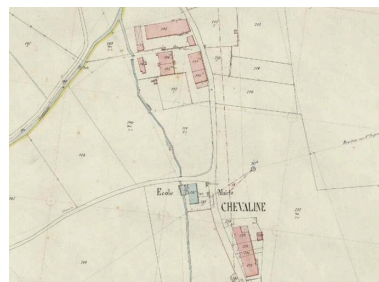
Extrait de la Section A Feuille n°2 du cadastre de Chevaline, 1905. Plan. Archives départementales de la Haute-Savoie 3 P 3/3509