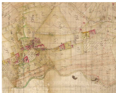
Copie de la carte sarde, atlas, 1ère feuille, 1728-1738. Plan. Archives départementales de la Haute-Savoie 1 Cd 90 - COPIE, Autr. Administration financière IVR82_20117401385NUCA