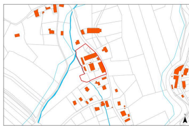
Cadastre 2011 IVR82_20117401388NUCA