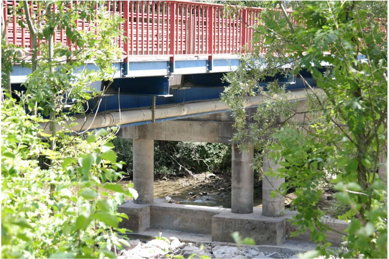
Pont des Îles, détail du tablier et des garde-corps