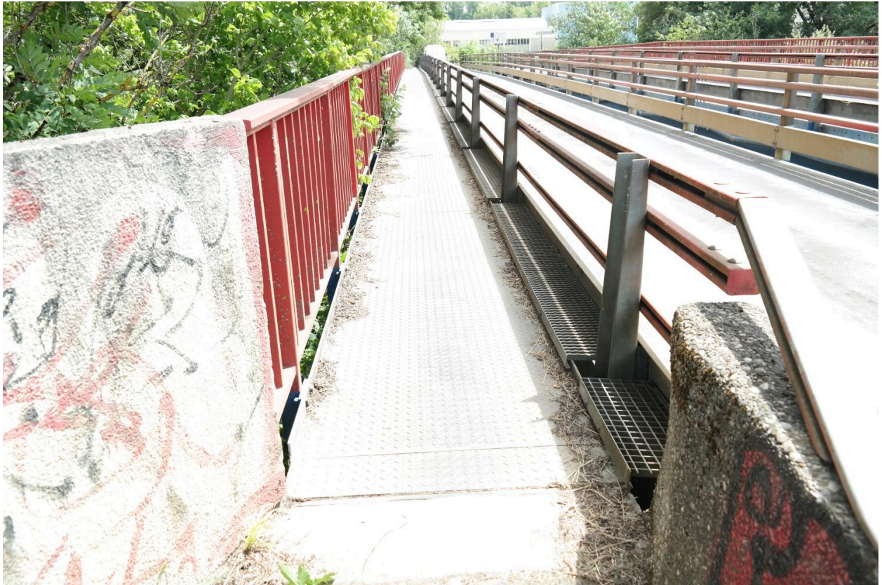
Pont des Îles, détail d'une passerelle piétonne