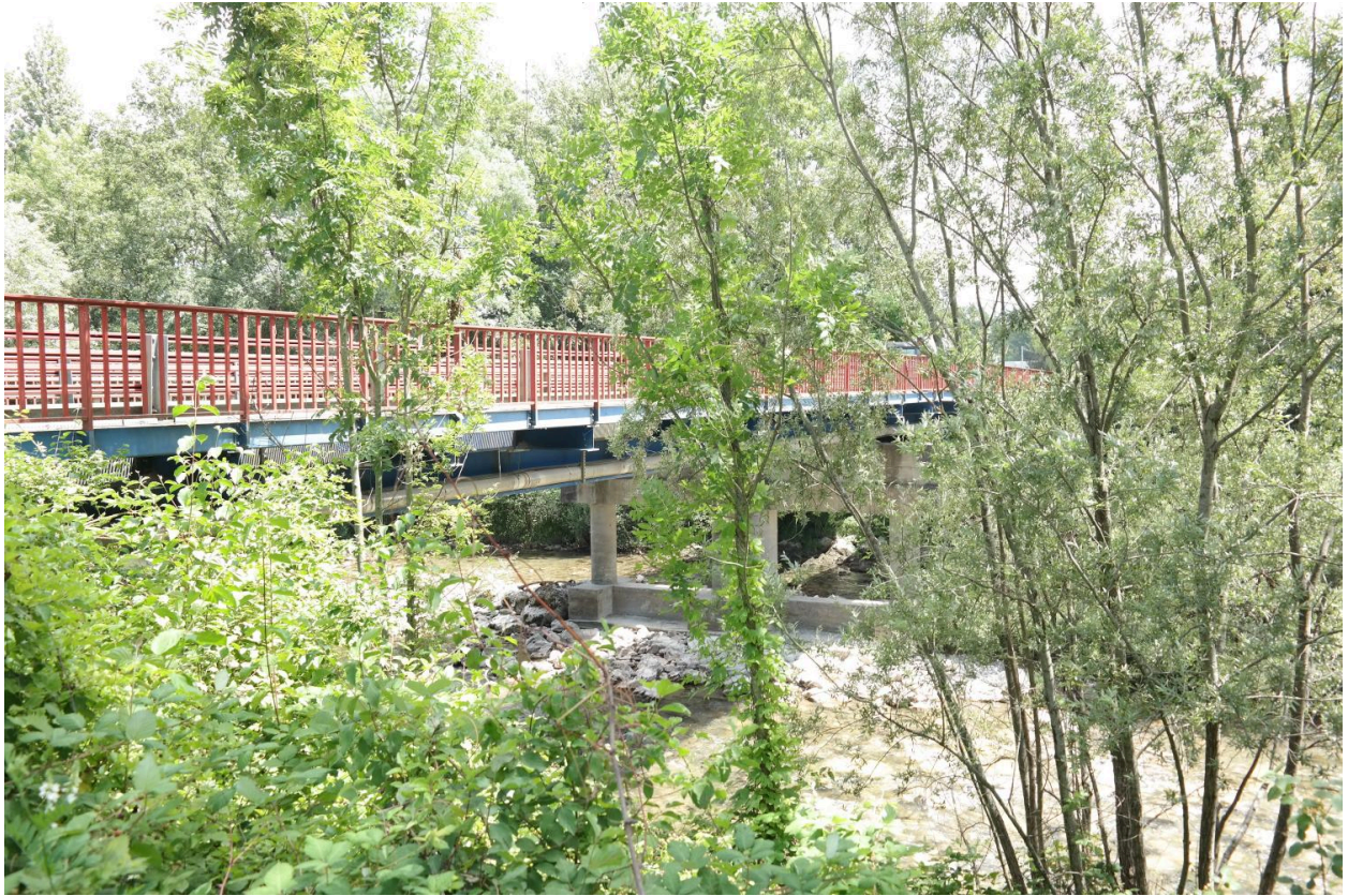
Pont des Îles, vue de la face aval