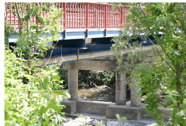
Pont des Îles, détail du tablier et des garde-corps IVR84_20207403882NUCA