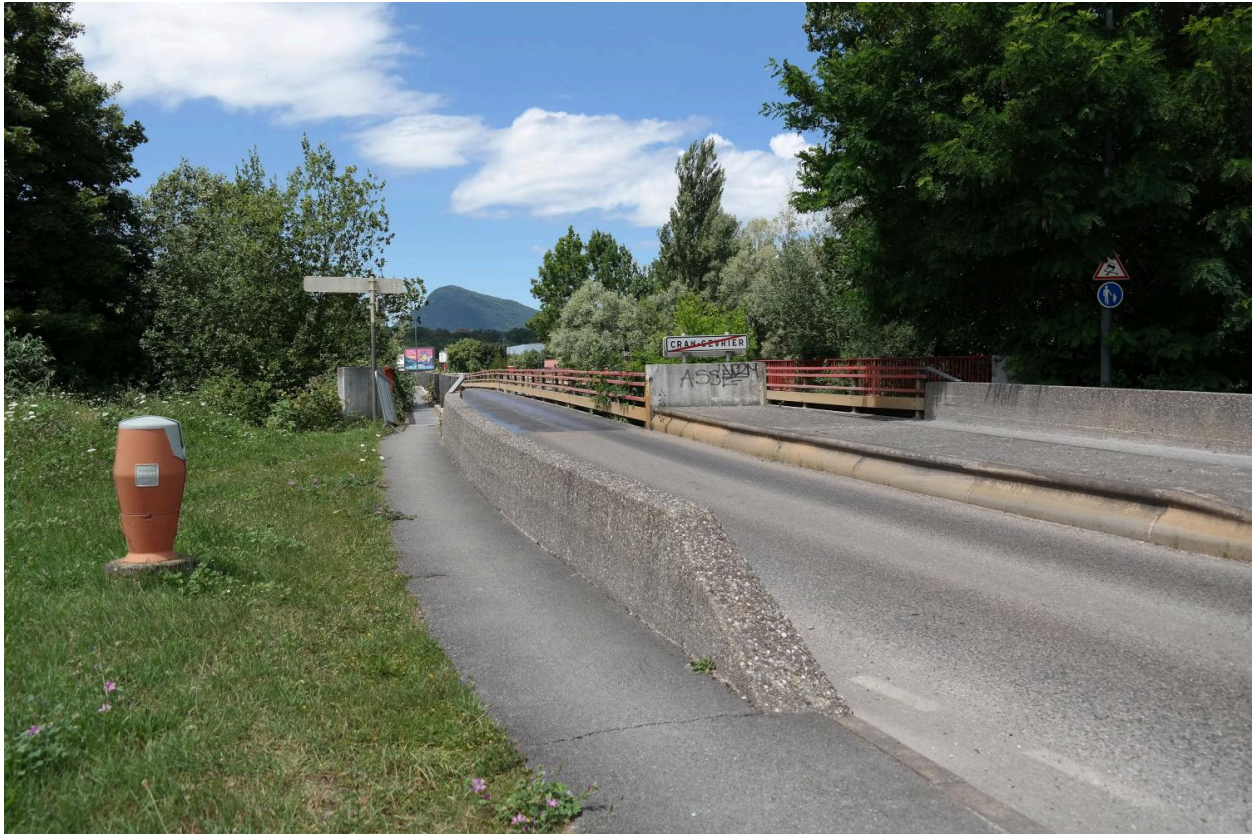
Pont des Îles, vue de la chaussée