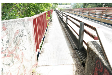
Pont des Îles, détail d'une passerelle piétonne