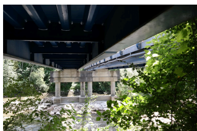
Pont des Îles, détail de la pile et tablier vue de dessous