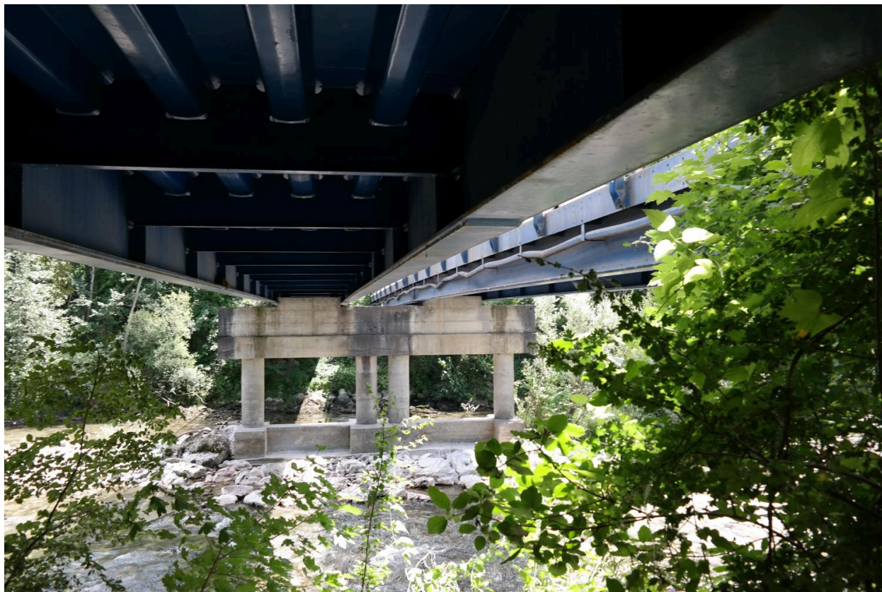
Pont des Îles, détail de la pile et tablier vue de dessous