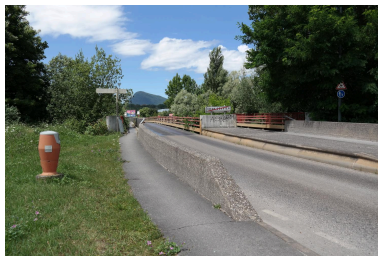
Pont des Îles, vue de la chaussée IVR84_20207403881NUCA