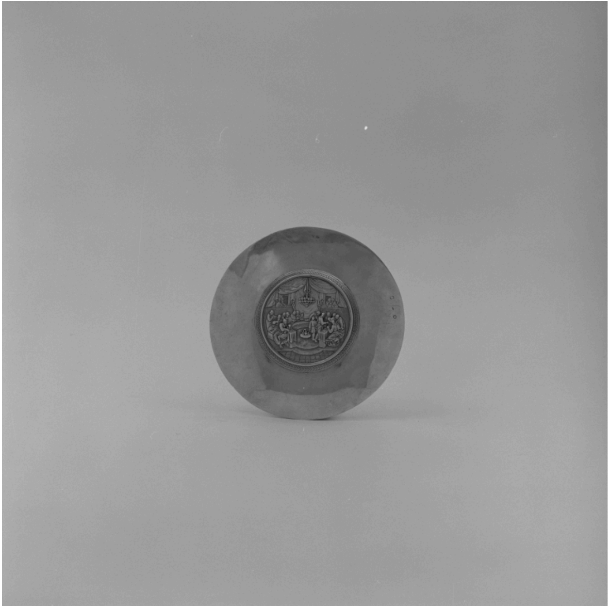
Vue du revers.