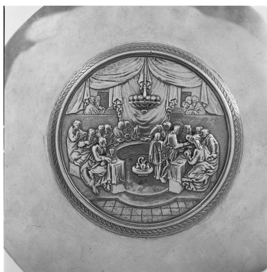
Détail du médaillon : la Cène. IVR82_19910100805X