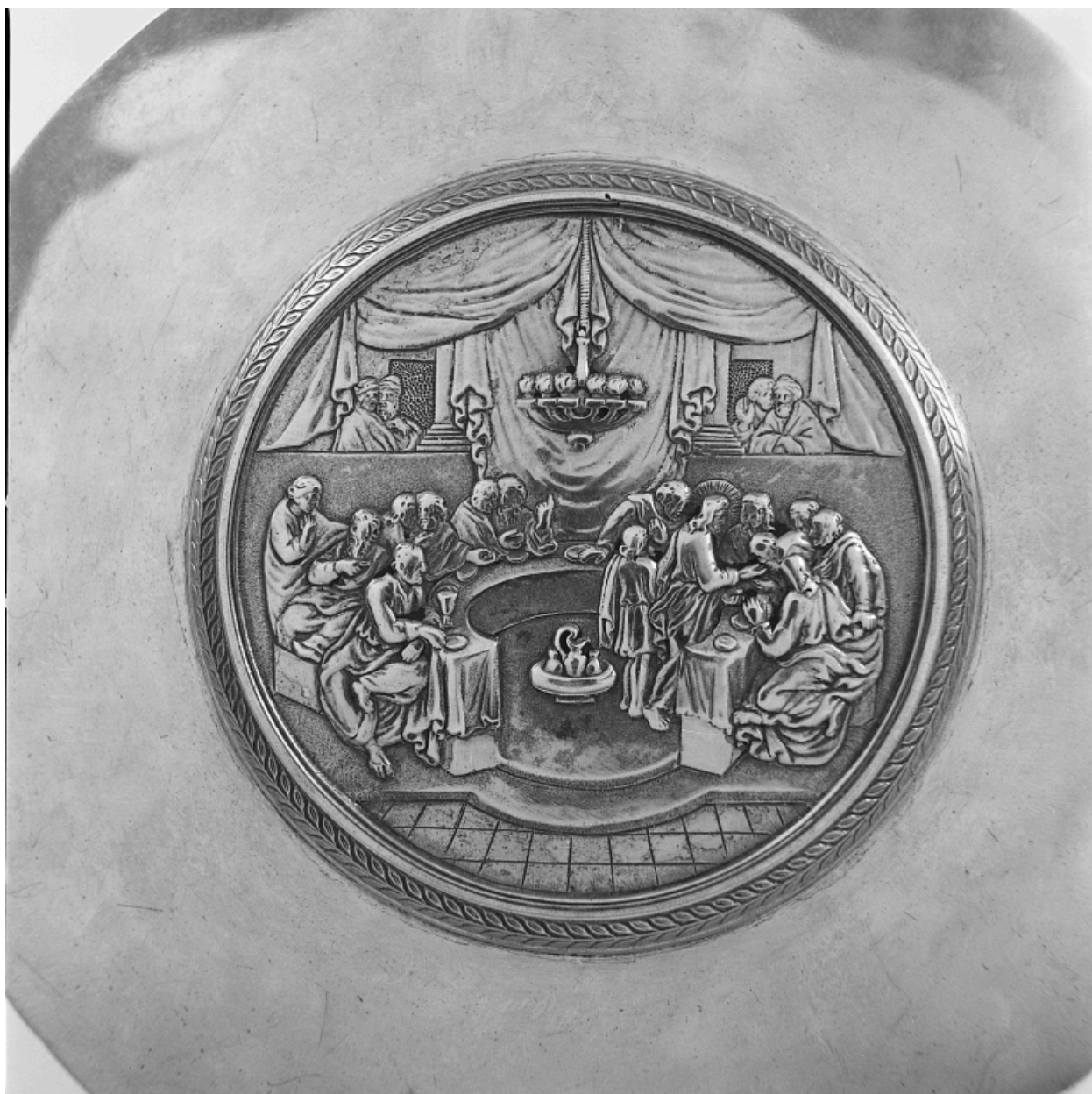
Détail du médaillon : la Cène.