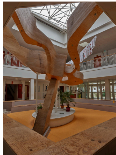
Autre vue d'ensemble en 2025 IVR84_20250300297NUC4A