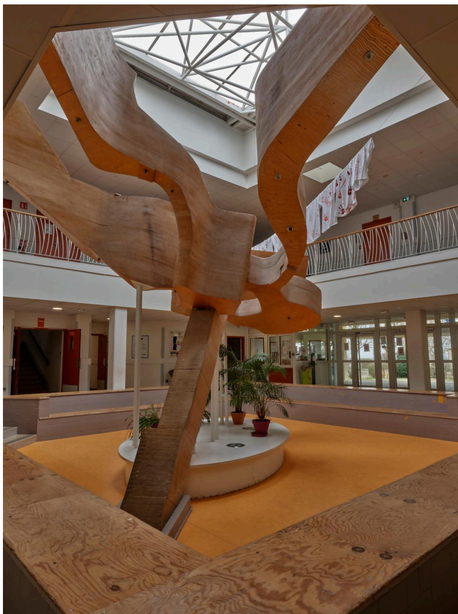
Autre vue d'ensemble en 2025