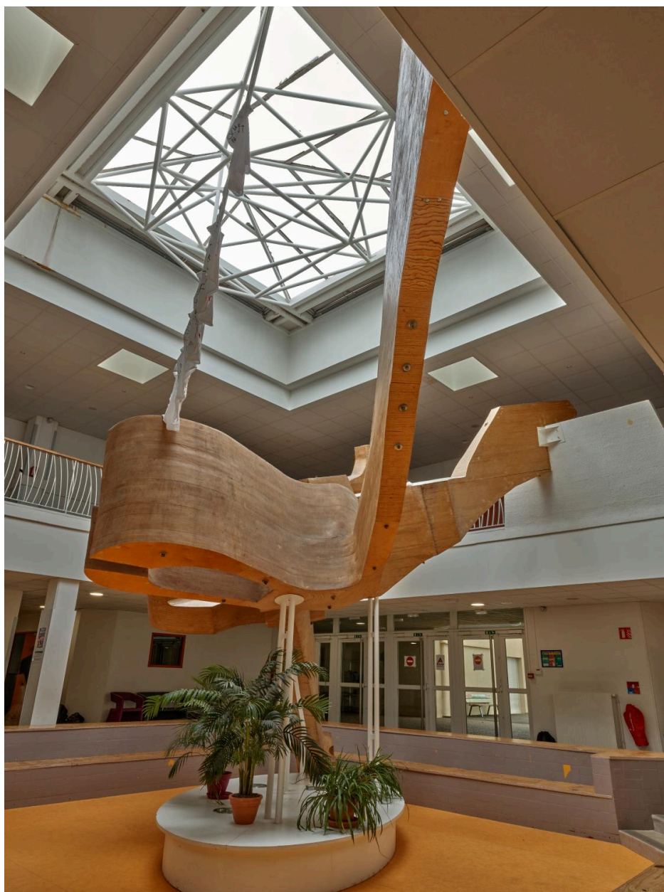
Vue d'ensemble en 2025