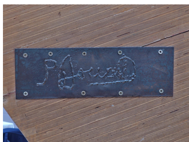
Détail de la signature IVR84_20250300298NUC4A