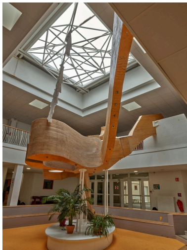
Vue d'ensemble en 2025 IVR84_20250300296NUC4A