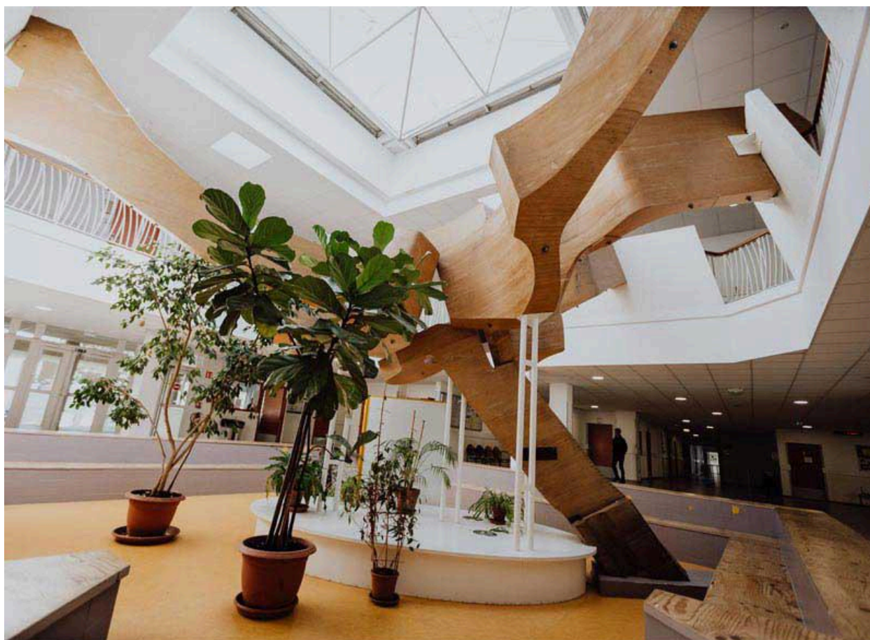
Vue d'ensemble (A Région Auvergne-Rhône-Alpes site de Clermont-Ferrand, 2226 WR 10).