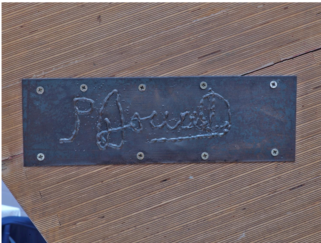
Détail de la signature