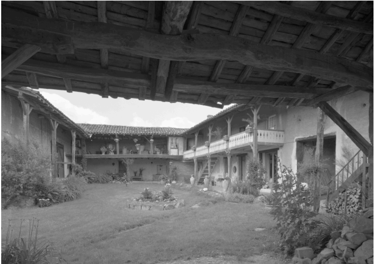
Vue d'ensemble de la cour depuis le passage couvert.