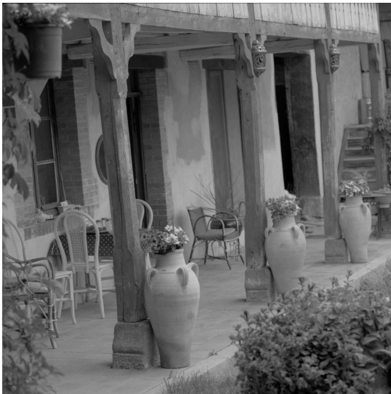
Vue de la terrasse sous la galerie située devant le logis.