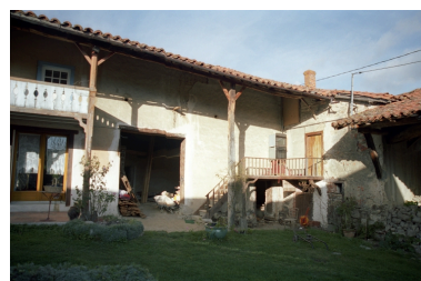
Vue du cuvage et du logement de valet situé à côté du passage couvert.