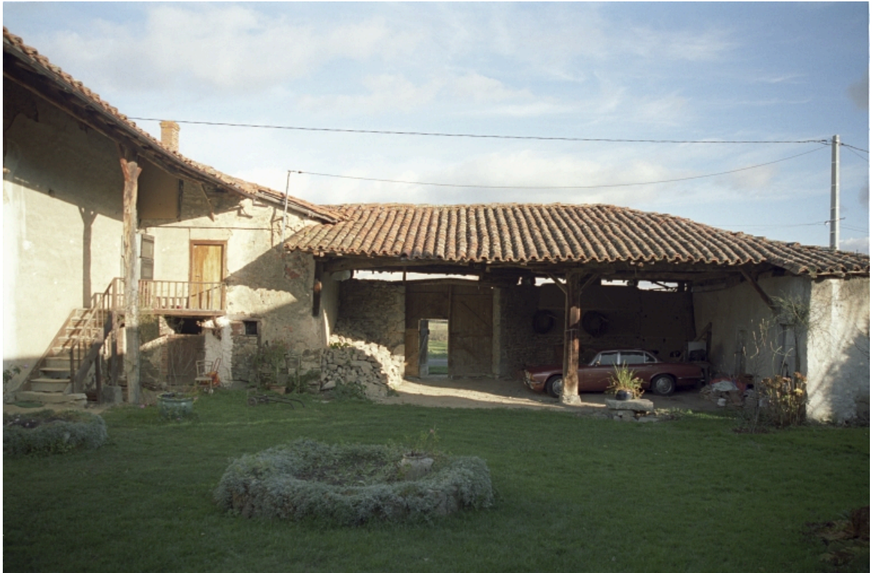
Vue d'ensemble du passage couvert, depuis le fond de la cour.