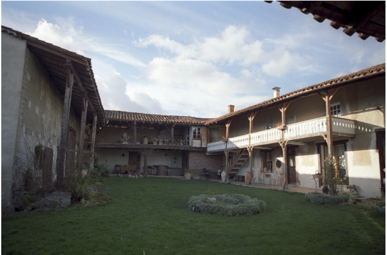
Vue d'ensemble de la cour, depuis le passage couvert.