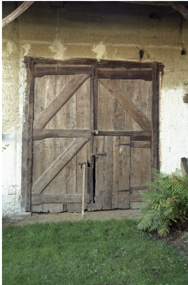
Vue de la porte de la grange. IVR82_20044200690ZE