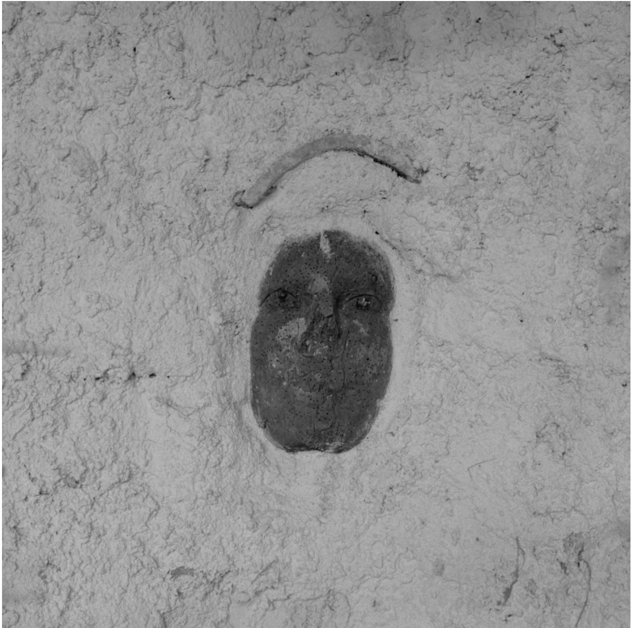
Masque de statue (?) en bois enchâssé dans le mur ouest de la cour.