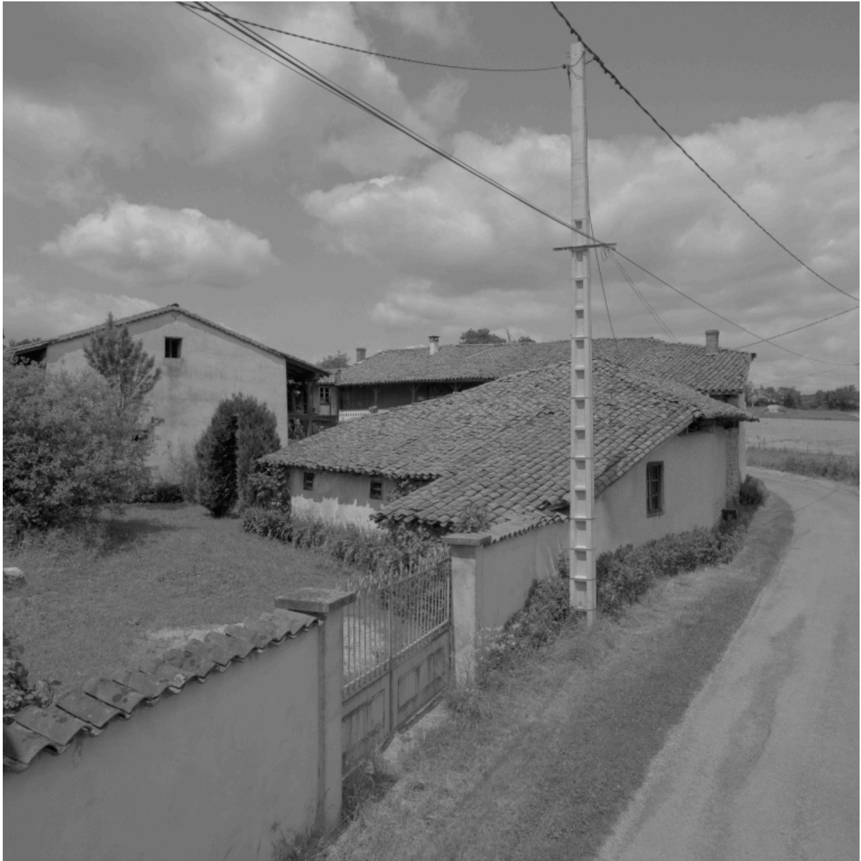
Vue générale des bâtiments depuis le sud.