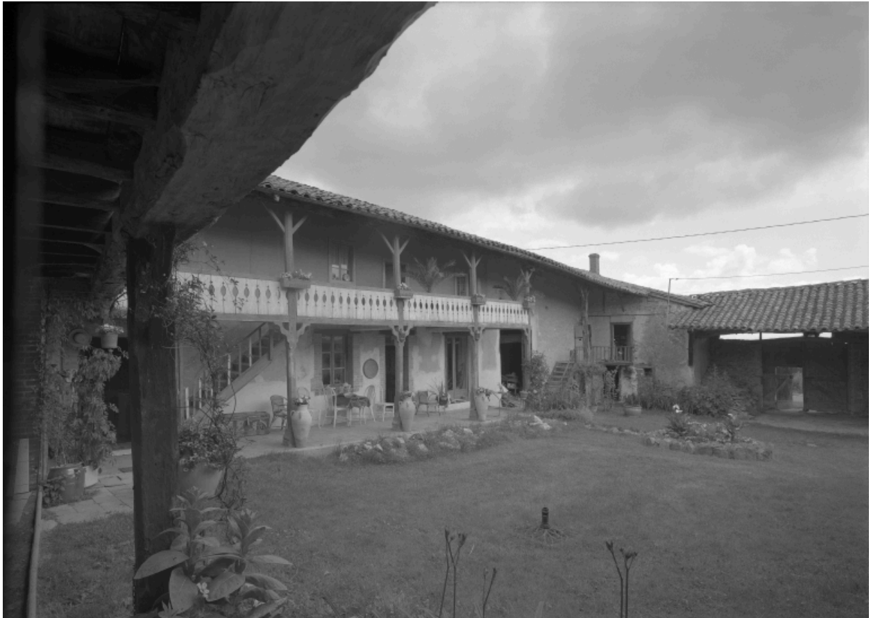
Vue d'ensemble de la cour vers le logis et le passage couvert.