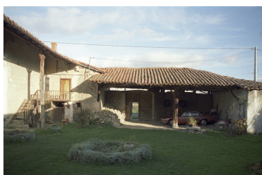
Vue d'ensemble du passage couvert, depuis le fond de la cour. IVR82_20044200687ZE