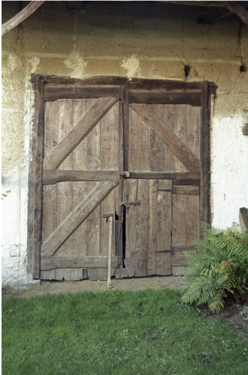
Vue de la porte de la grange.