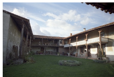
Vue d'ensemble de la cour, depuis le passage couvert.