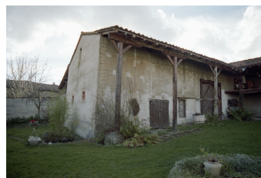
Vue d'ensemble de la grange-étable. IVR82_20044200689ZE