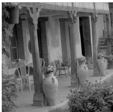
Vue de la terrasse sous la galerie située devant le logis. IVR82_20024202653X