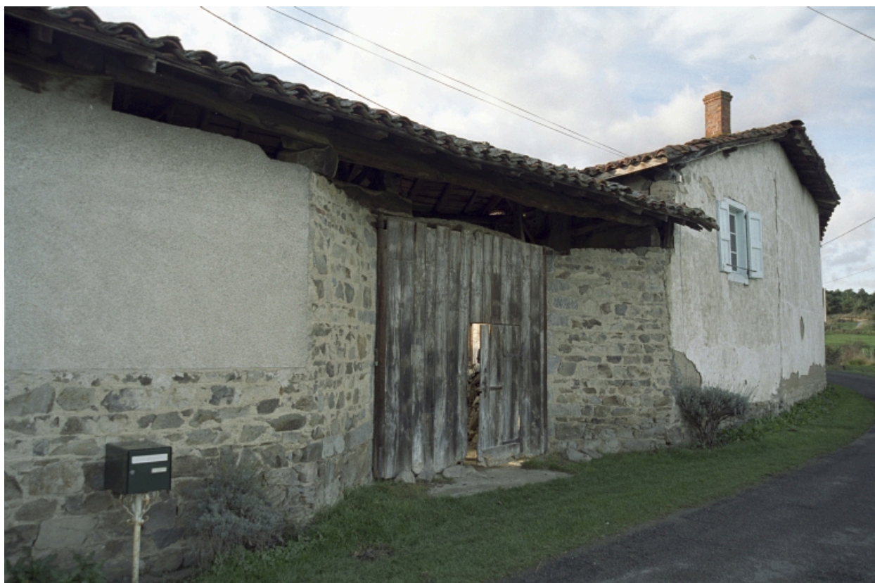
Vue d'ensemble depuis le chemin : passage couvert.