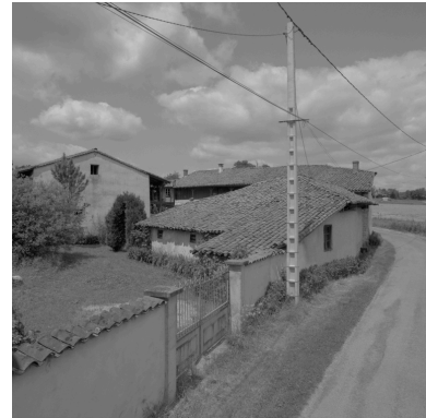
Vue générale des bâtiments depuis le sud. IVR82_20024202652X