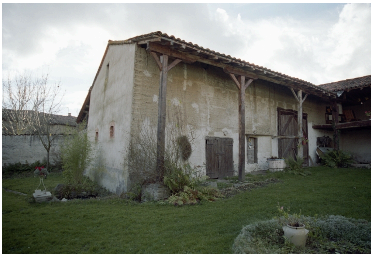
Vue d'ensemble de la grange-étable.