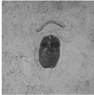
Masque de statue (?) en bois enchâssé dans le mur ouest de la cour. IVR82_20024202655X