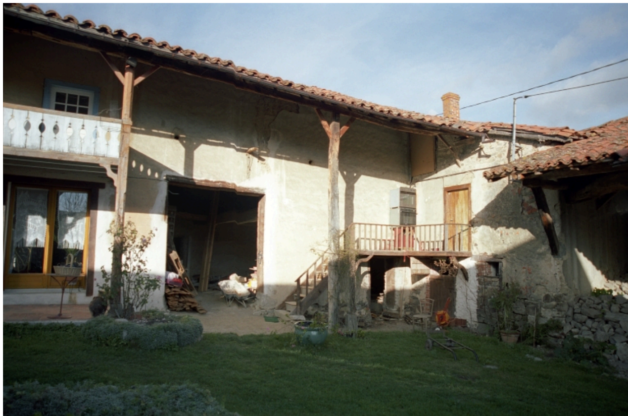
Vue du cuvage et du logement de valet situé à côté du passage couvert.