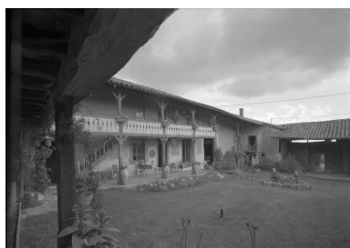
Vue d'ensemble de la cour vers le logis et le passage couvert.