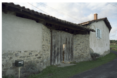
Vue d'ensemble depuis le chemin : passage couvert.