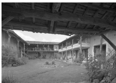
Vue d'ensemble de la cour depuis le passage couvert.