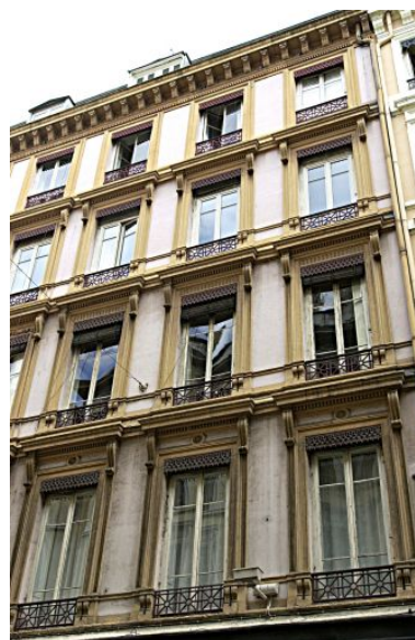
Façade principale sur la rue Paul-Chenavard, détail de l'élévation IVR82_20046900142NUCA