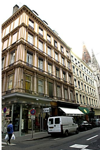
Façade principale sur la rue Paul-Chenavard, vue générale IVR82_20046900140NUCA