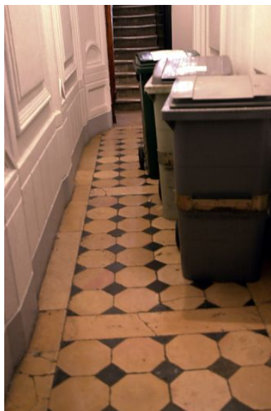
Pavage de l'allée IVR82_20046900147NUCA