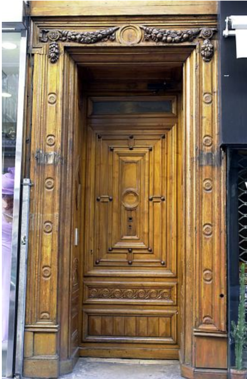
Façade principale sur la rue Paul-Chenavard, porte