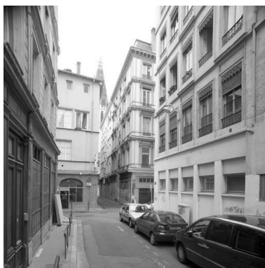
Vue sur l'angle entre la rue Longue et la rue Pléney IVR82_20056901538NUC