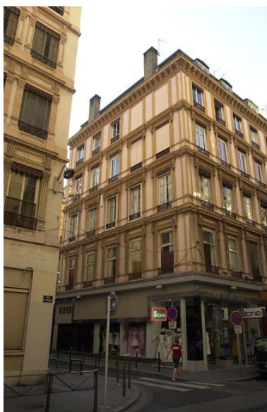
Façade sur la rue Longue IVR82_20046900141NUCA