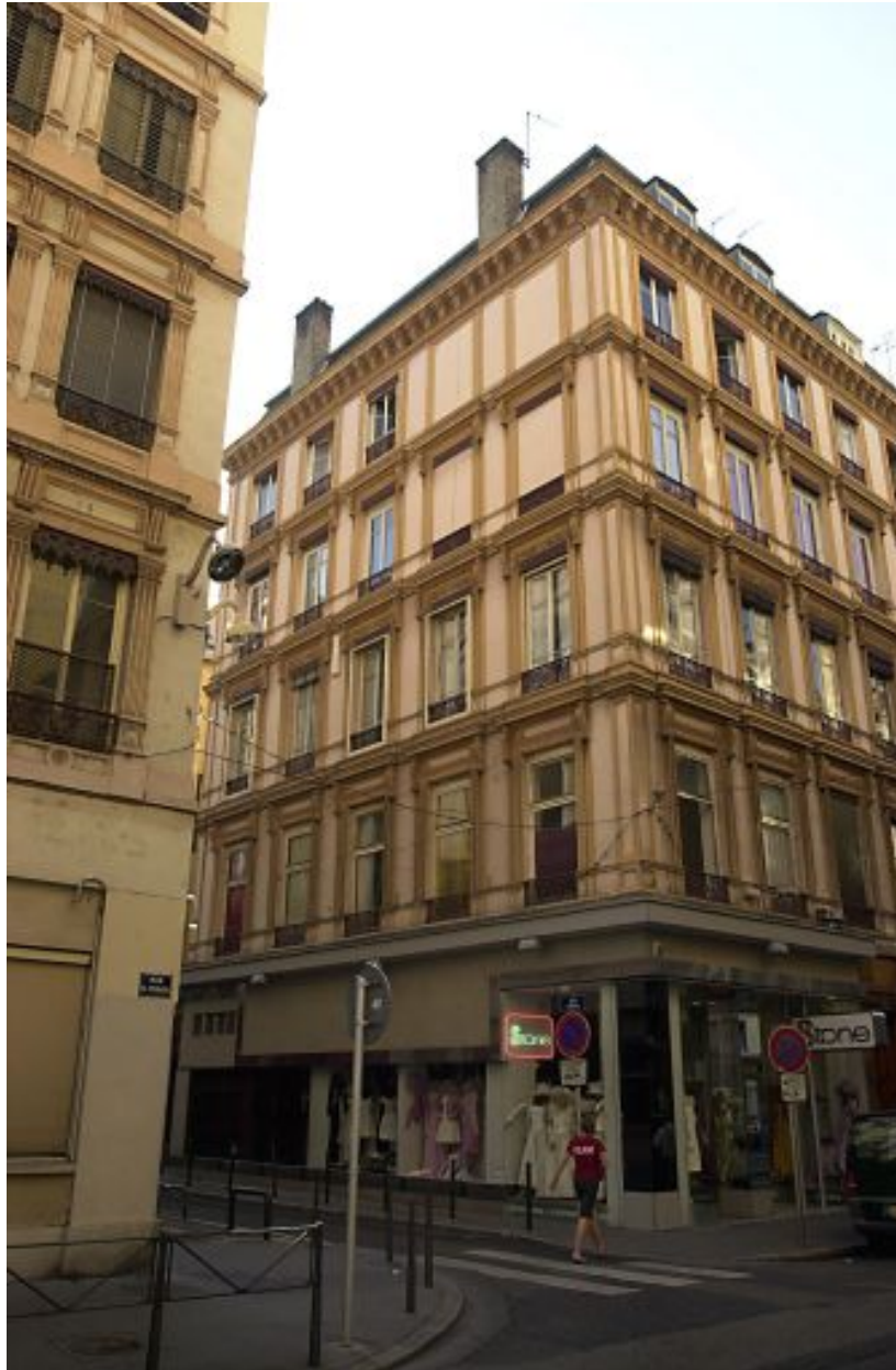
Façade sur la rue Longue