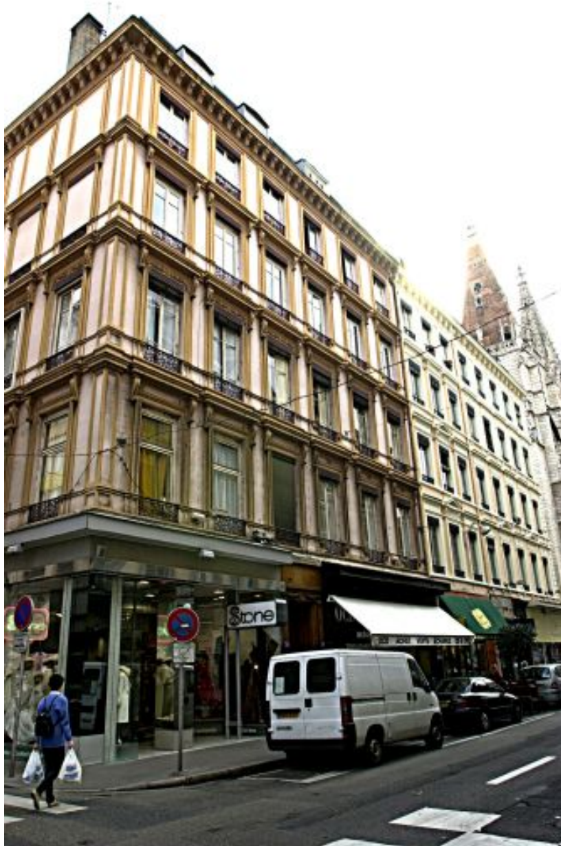
Façade principale sur la rue Paul-Chenavard, vue générale