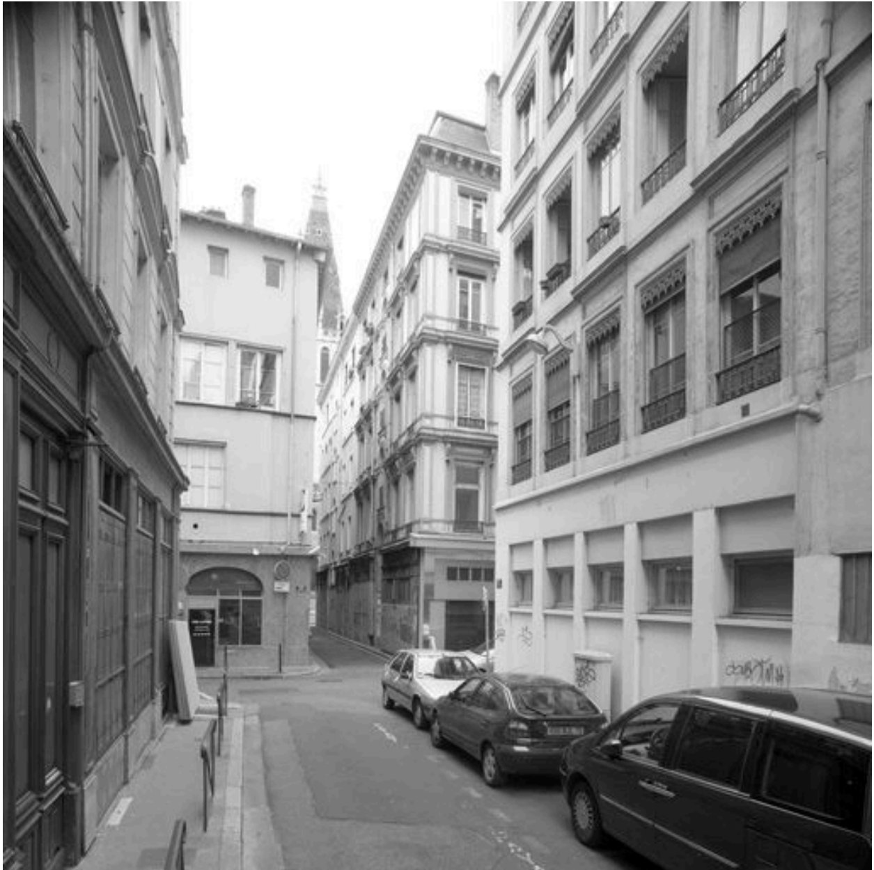
Vue sur l'angle entre la rue Longue et la rue Pléney