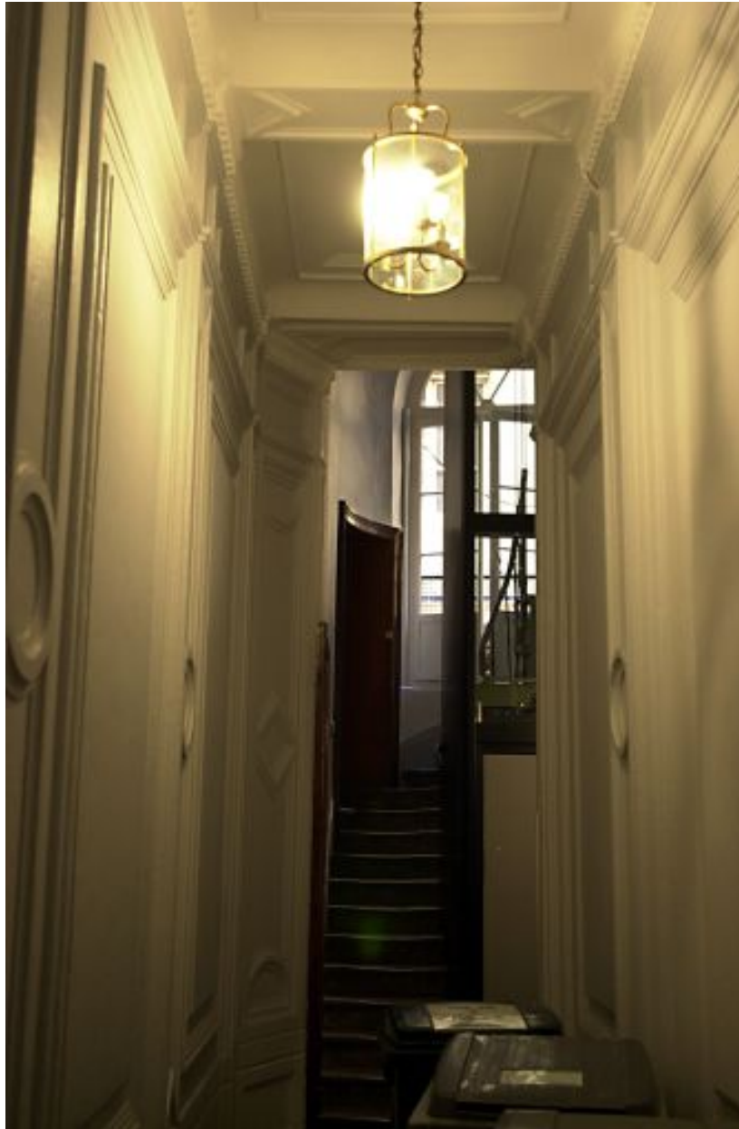
Allée, vue vers l'escalier