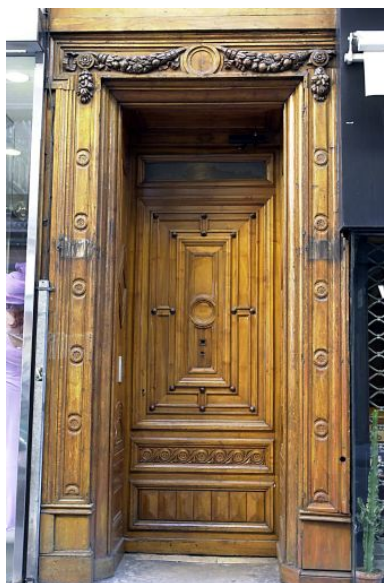
Façade principale sur la rue Paul-Chenavard, porte