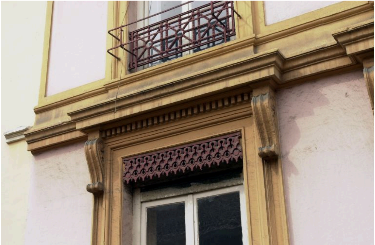
Façade sur la rue Pléney, détail d'une fenêtre