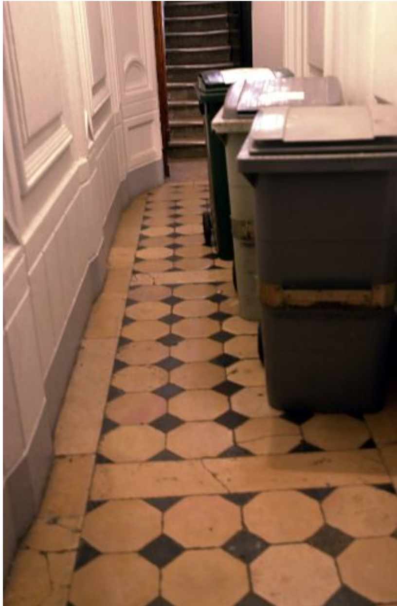
Pavage de l'allée