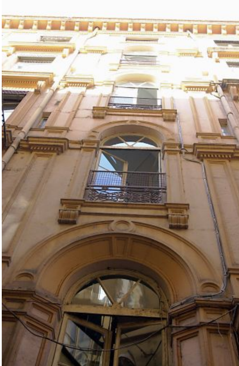
Façade sur la rue Pléney, détail de la travée d'escalier