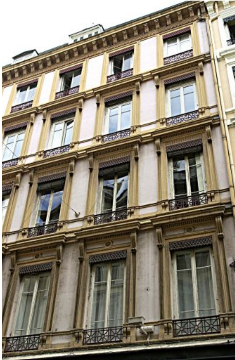
Façade principale sur la rue Paul-Chenavard, détail de l'élévation