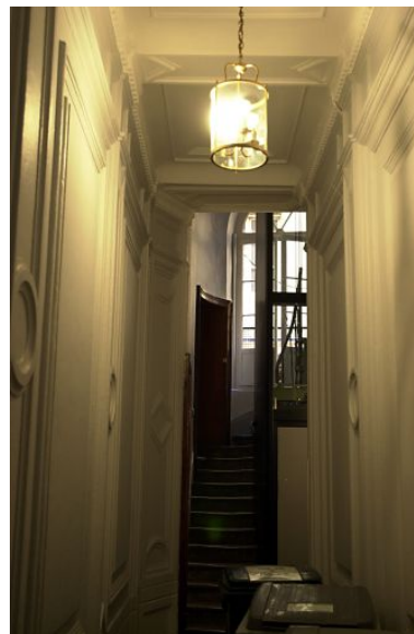
Allée, vue vers l'escalier