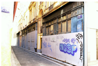
Alignement des boutiques rue Pléney des immeubles 39 (au 1er plan) et 41, rue Paul-Chenavard IVR82_20046900138NUCA